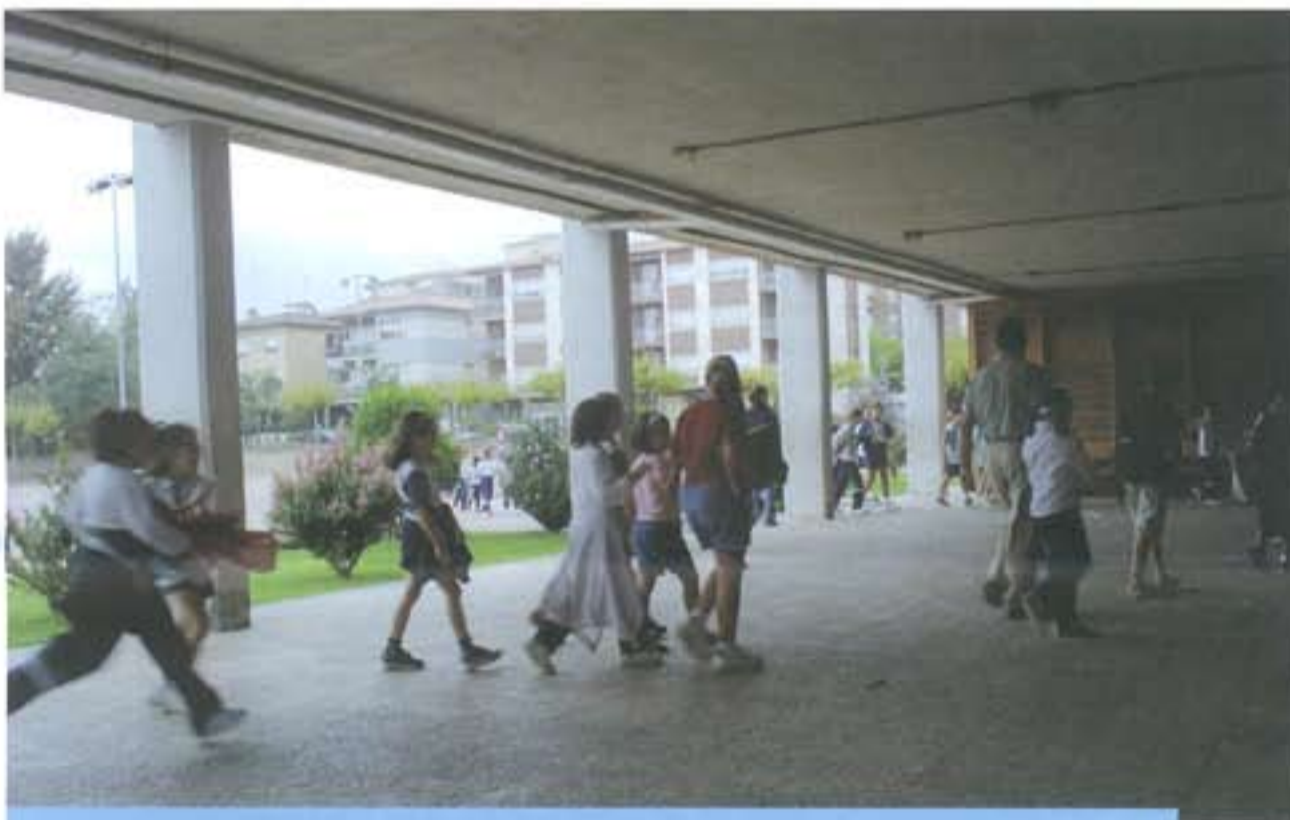
Els alumnes entrant a les seves respectives aules

El dia 15 de setembre va tenir lloc la tornada a les aules de petits i no tant petits. Pel que fa a Riudoms, això suposa un total de 84 alumnes a la Llar d'Infants "Els Picarols" de 4 mesos a 3 anys, 520 alumnes al Col·legi "Beat Bonaventura Gran" entre el Parvulari, el Cicle Inicial, Mitjà i Superior, i 634 a l'I.E.S. "Joan Guinjoan i Gispert", on s'han matriculat 520 alumnes d'E.S.O., distribuïts en 5 línies i 114 alumnes de Batxillerat distribuïts en les 3 modalitats: Científic, Tecnològic i Humanístic.