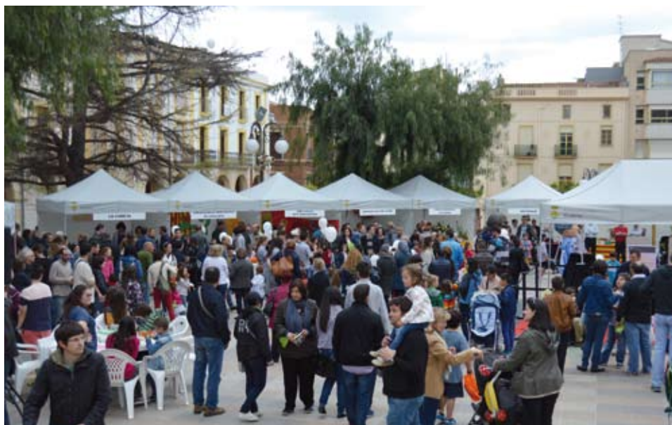
Nombrosos riudomencs van acudir a la plaça per viure la festa