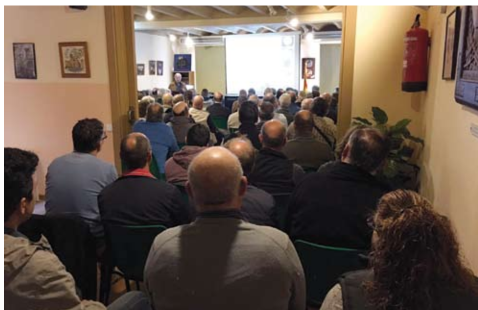
Més de cent persones van assistir a la xerrada

Per tancar la jornada, es va dedicar una xerrada a informar sobre la situació actual de la plaga de quarantena Xylella fastidiosa .