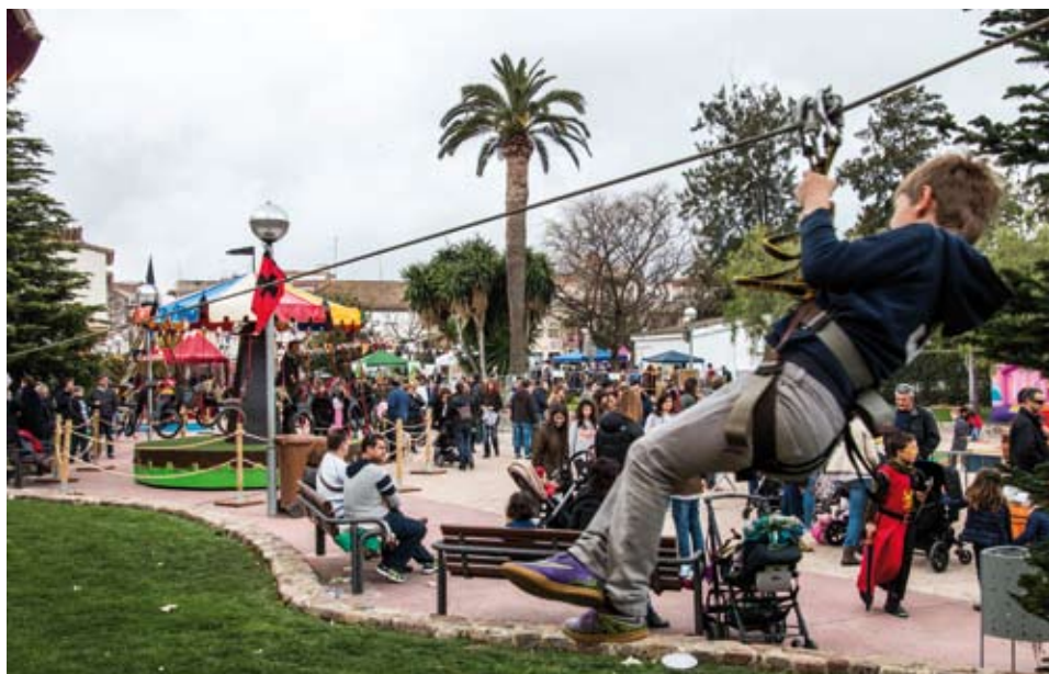
Durant tres dies, els infants van poder gaudir de jocs i atraccions

Durant tres dies, es van oferir jocs medievals, espectacles itinerants, atraccions, ruta amb ponis i parades. El diumenge 3 es va celebrar el dinar popular i, a la tarda, l'actuació esportiva medieval. La Colla de Diables de Riudoms va tancar l'edició 2016 d'aquesta festa.