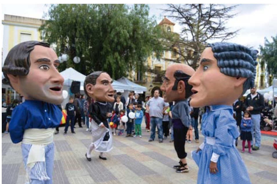
Aprofitant que es tractava d'una jornada cultural, es va fer l'acte oficial de la restauració dels capgrossos de la Colla Gegantera de Riudoms. Durant tot el matí, van estar exposats a la plaça de l'Església i a la tarda es va fer la presentació pública amb un ball.