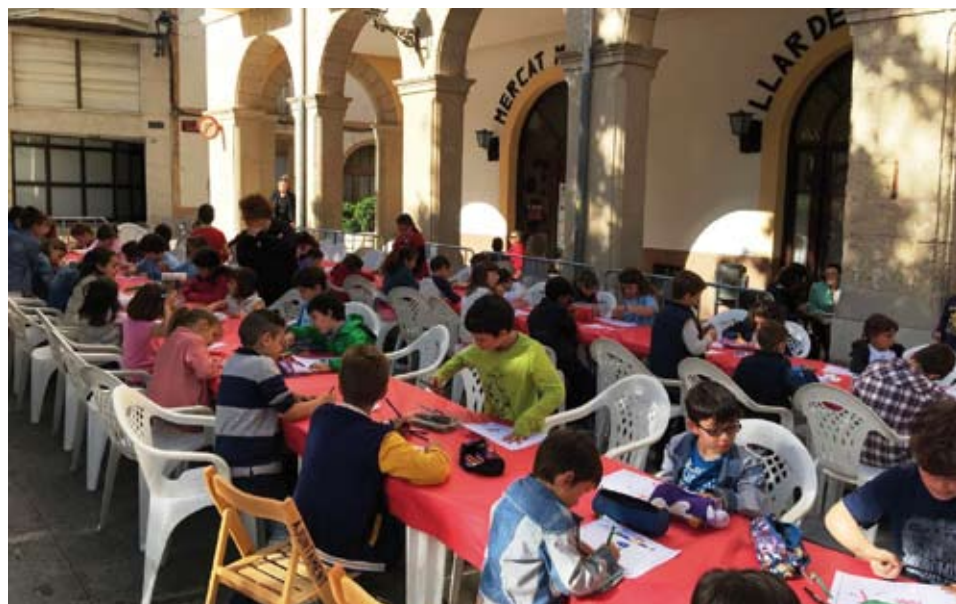
Al Concurs de dibuix hi van participar prop de vuitanta infants