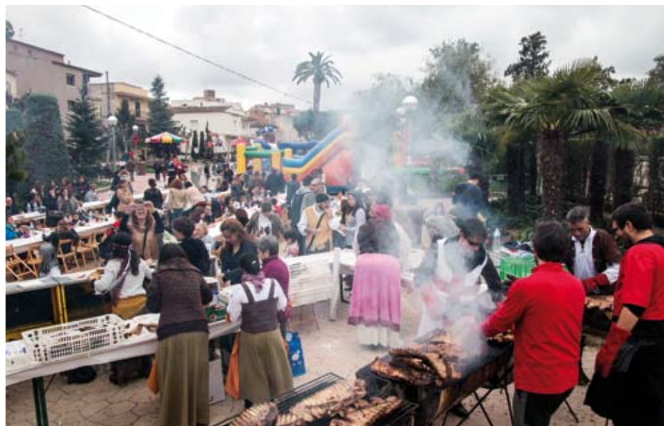
El dinar popular és un dels actes centrals de la festa