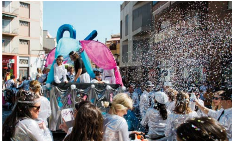
La rua de lluïment de diumenge al matí és un dels atractius

Un any més, la Festa dels Barris es va acomiadar amb un gran èxit de participació.