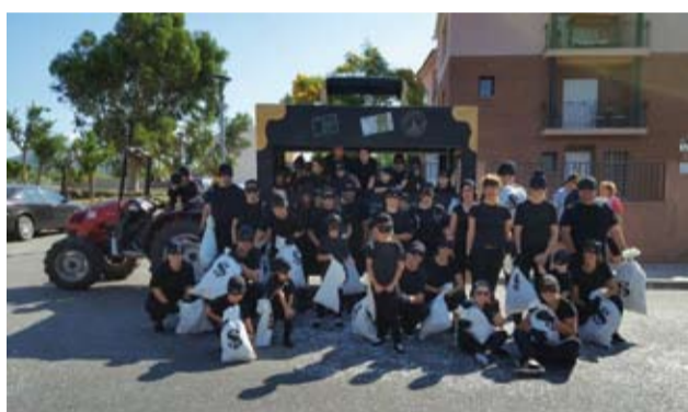
Barri de la Plaça