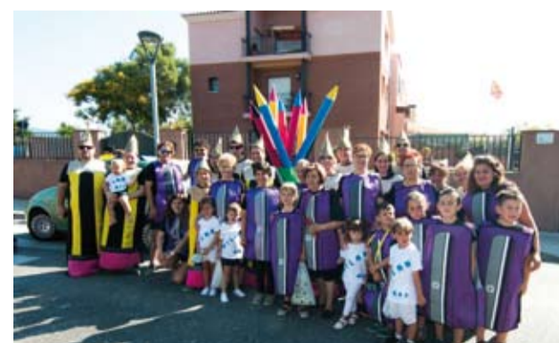
Barri del carrer Major