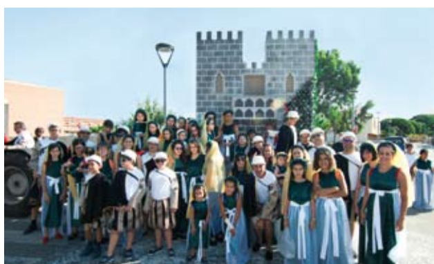
Barri de les Escoles