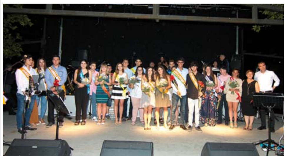
Tots els hereus i les pubilles representants de cada barri