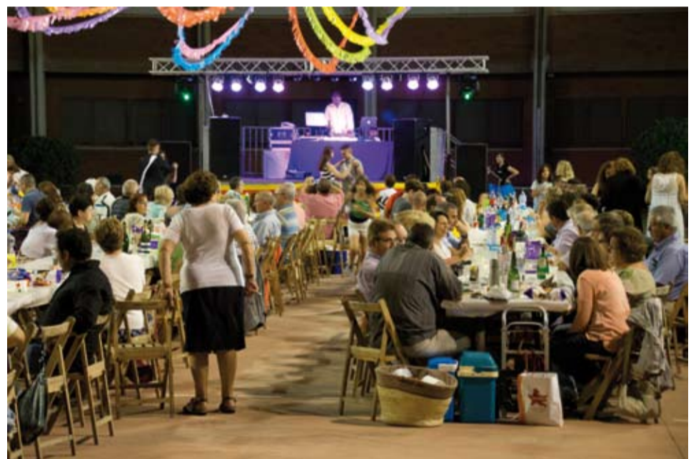
A la nit, cada barri es va reunir per sopar conjuntament