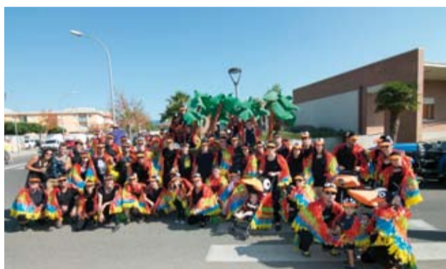
Barri del Colomer