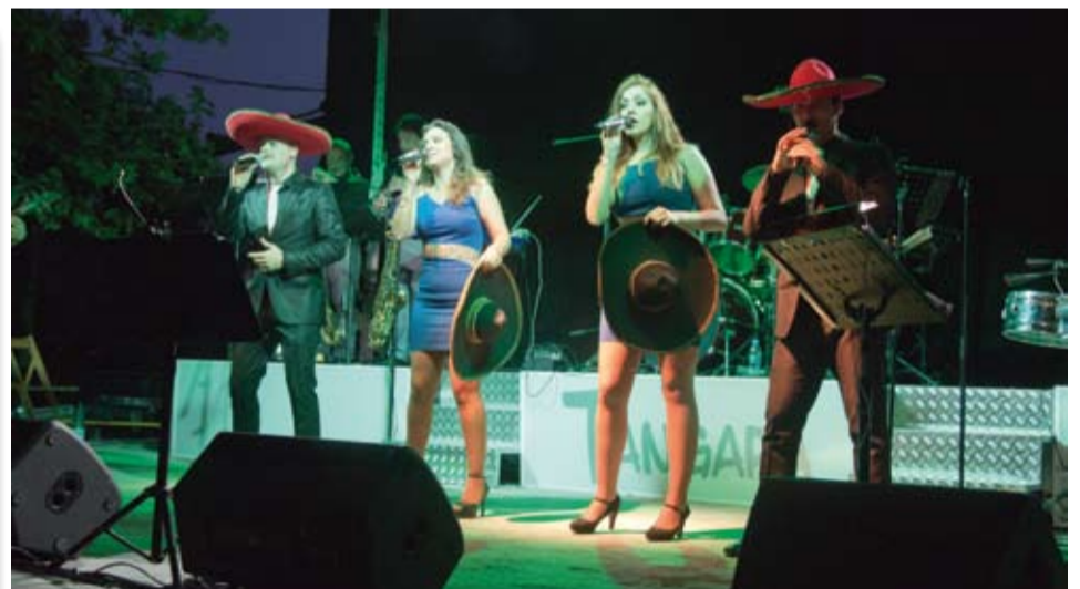
El ball de nit va anar a càrrec de l'Orquestra Tangara