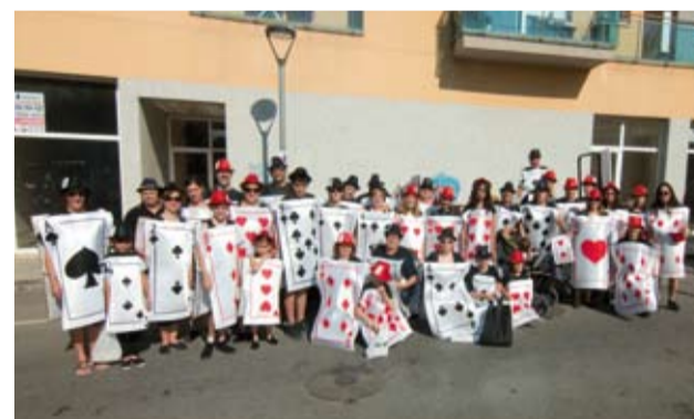
Barri de Sant Sebastià