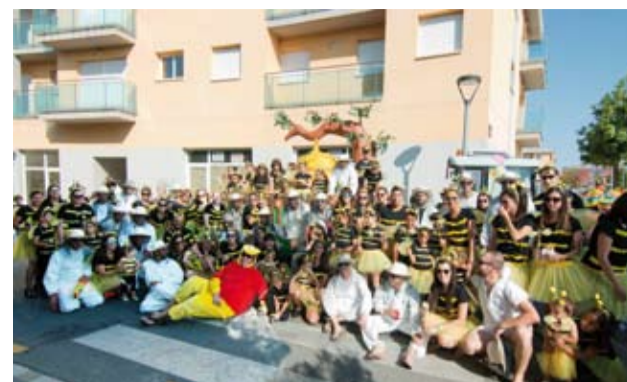
Barri dels Molins Nous