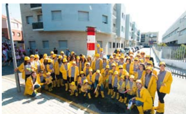
Barri de la Raval