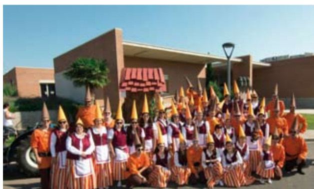
Barri de Sant Antoni