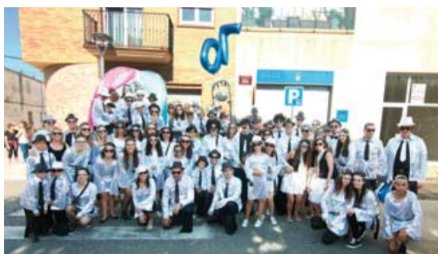
Barri del Molí d'en Marc