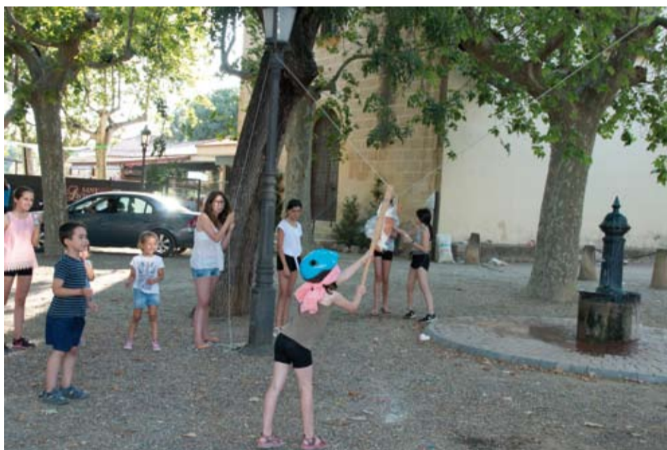
Jocs de cucanya durant la tarda de dissabte