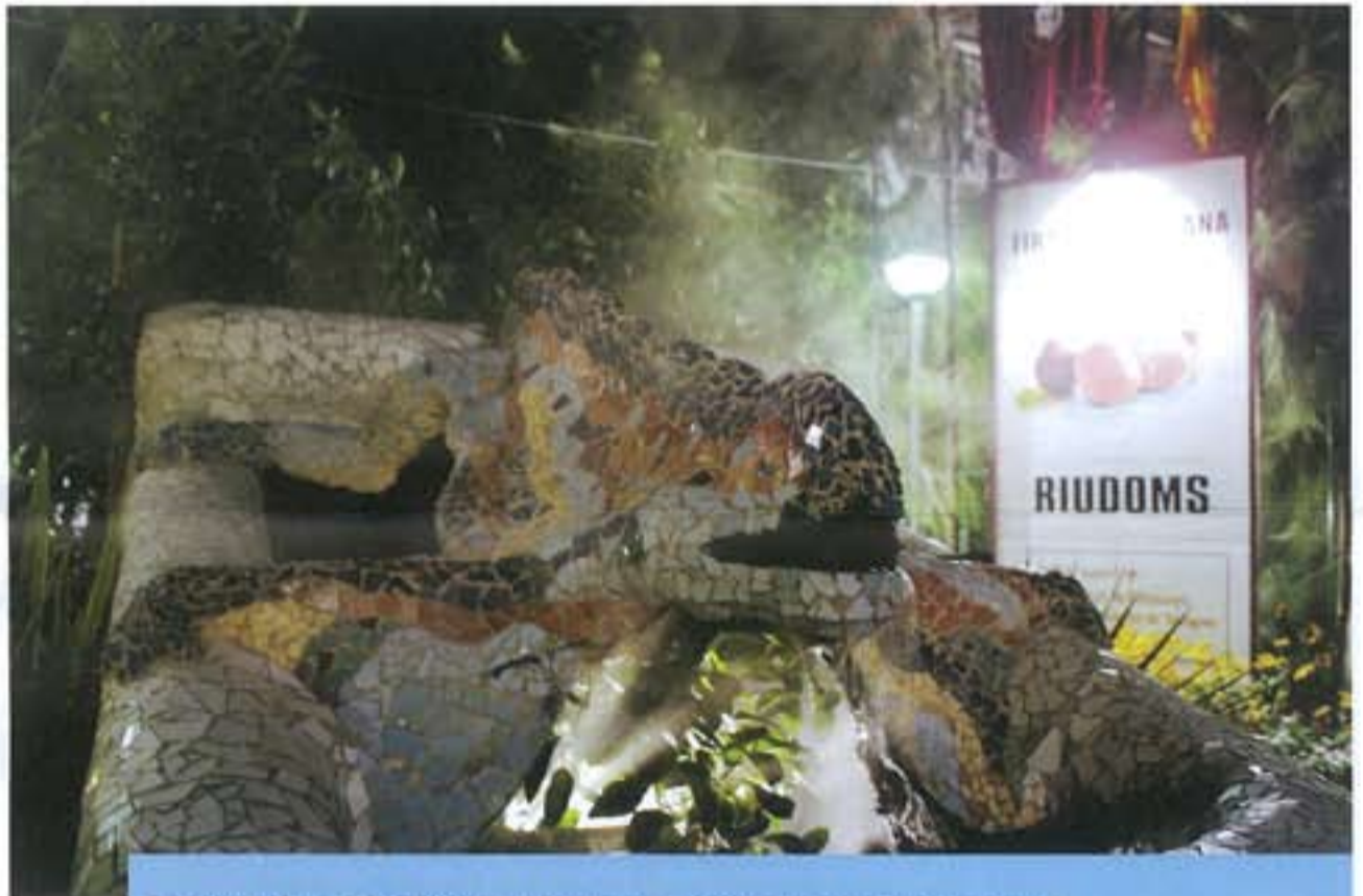
Entrada de la 23a Fira de l'Avellana i 404a Fira de Sant Llorenç