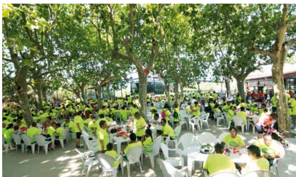
Després dels últims metres del recorregut urbà de la Bicicletada Popular, cal recuperar energia amb un esmorzar conjunt