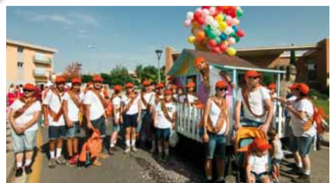
Barri del Colomer