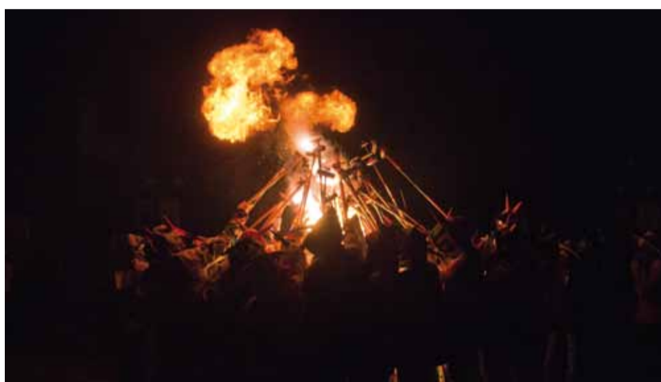
El dissabte al vespre va tenir lloc el correfoc pels carrers del casc antic, un acte que és un dels plats forts del programa de festa major