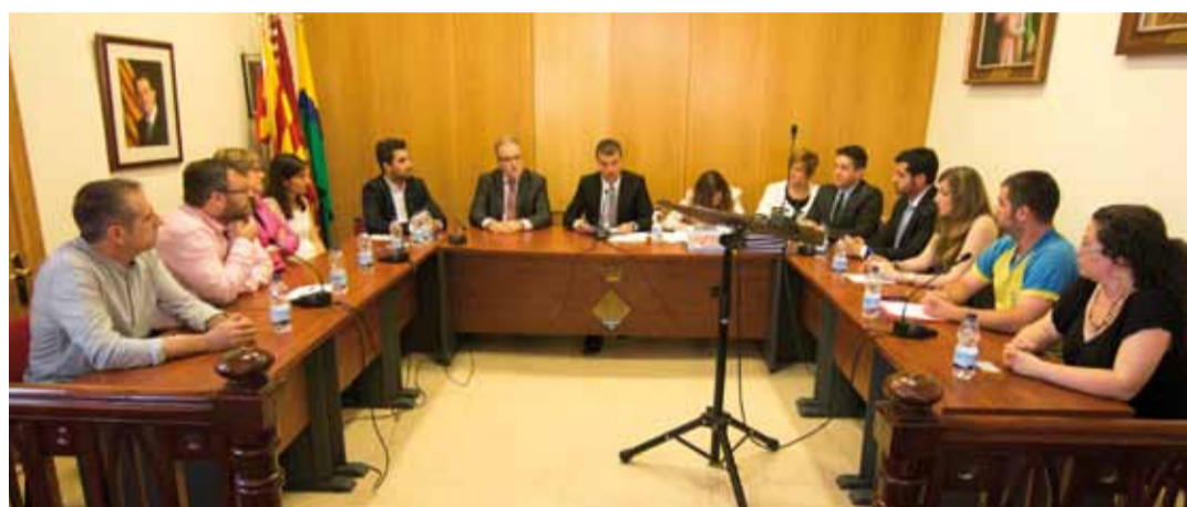
El Ple que representarà els riudomencs durant els propers quatre anys