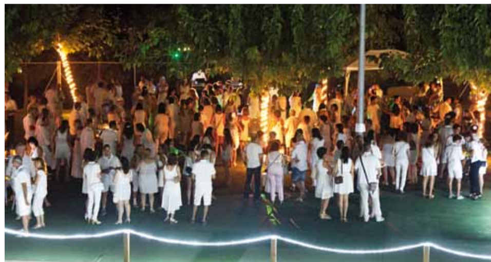
La Festa Eivissenca va tenir lloc a la Piscina de Sant Antoni

Unes dues-centes persones van gaudir d'aquest esdeveniment que ja s'ha convertit en un clàssic de l'estiu i del programa de festes de Riudoms, fet que assegura la seva continuïtat en properes edicions.