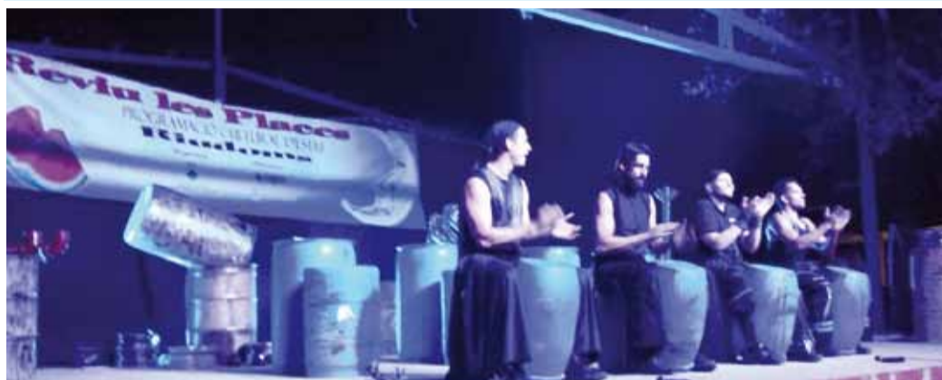
La companyia Toom-Pak va oferir un espectacle rítmic ben diferent