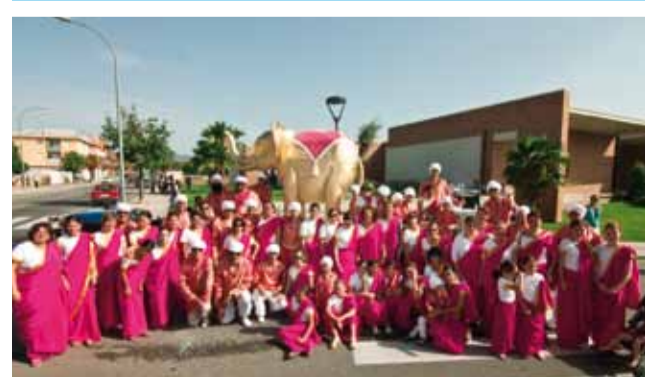
Barri de Sant Antoni