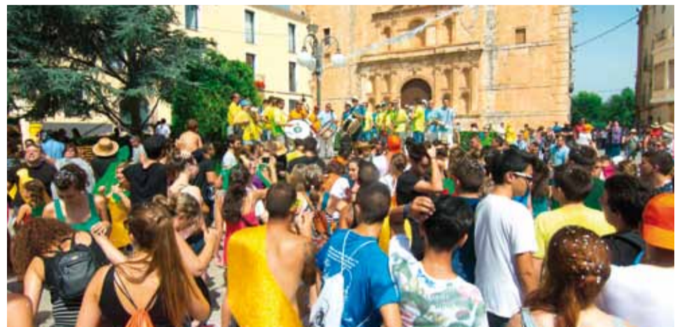
Festa final de la rua de lluïment de carrosses i disfresses