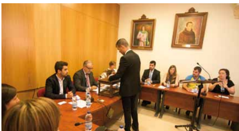
Moment de la votació per a l'elecció de l'alcalde