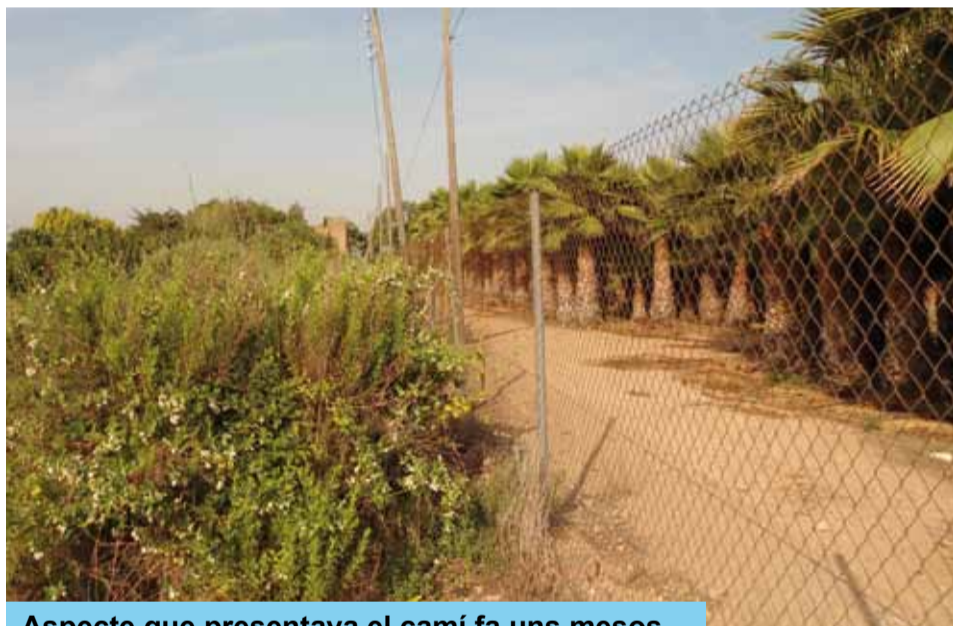
Aspecte que presentava el camí fa uns mesos

d'acondicionament permetran recuperar el pas als veïns de la zona i també de vehicles com motocicletes, bicicletes i maquinària agrícola de poca envergadura.