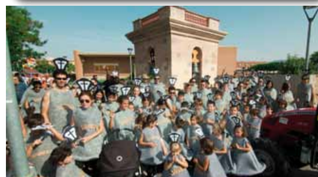
Barri de les Escoles