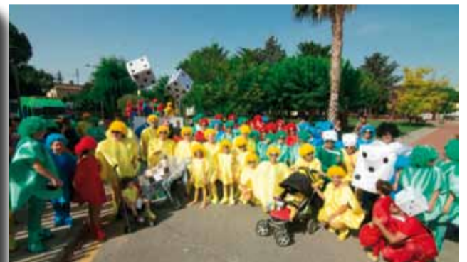
Barri Molí d'en Marc