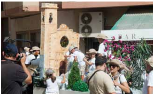
Barri de La Plaça