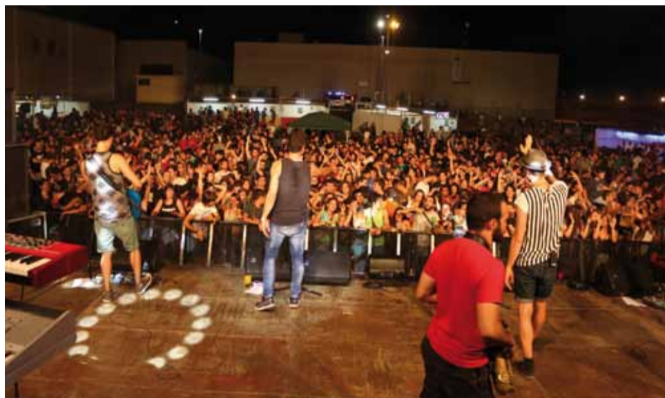
Dues de les actuacions de les Ulé Barraques 2015, que agrupen cada any nombrosos joves de Riudoms i de pobles veïns