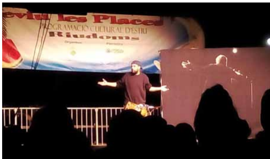
L'humorista Peyu va arrencar somriures al públic assistent