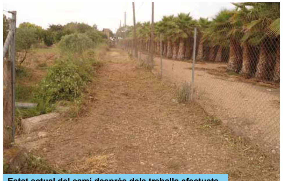
Estat actual del camí després dels treballs efectuats