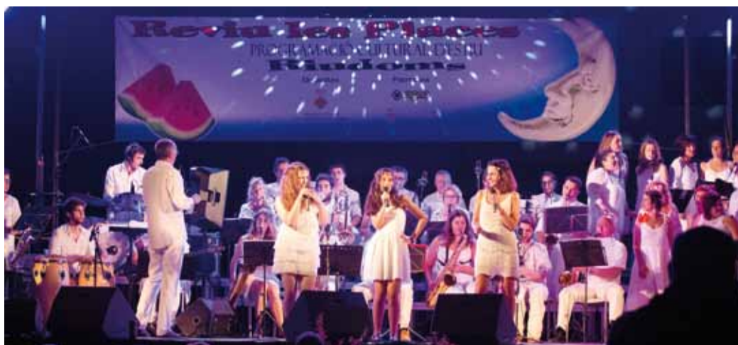
La formació local Gaudi'm va encetar el Reviu Les Places 2015

Un any més, la programació del Casal Riudomenc es trasllada a les places del poble per oferir propostes actuals d'entreteniment. Durant tres dimecres del mes de juliol, el públic ha pogut gaudir d'actuacions musicals amb l'adaptació del musical "Mare meva" per part del grup local Gaudi'm, humorístiques amb el còmic televisiu Peyu, i innovadores amb l'espectacle Recicllart 2.0 a càrrec de la companyia Toom-Pak.