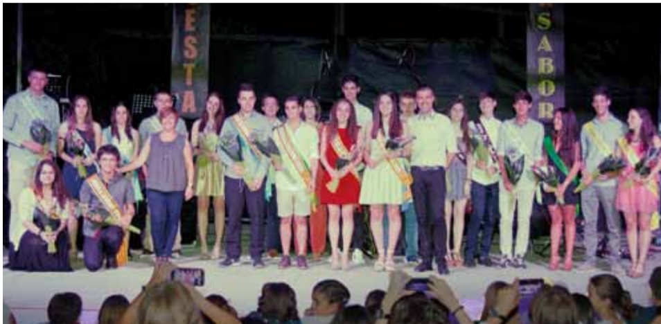
Moment de l'elecció de l'Hereu i la Pubilla i del Fadrí i la Dama d'honor

del poble i, a la nit, es va celebrar el ball de cloenda de la festa amb l'Orquestra Sabor Sabor, durant el qual es van lliurar els premis dels concursos de carrosses i disfresses i es va fer l'elecció de l'hereu i la pubilla 2015 d'entre els nois i les noies que enguany compleixen els 18 anys. Aquest any, per primera vegada, també es va fer l'elecció del Fadrí i la Dama d'honor.