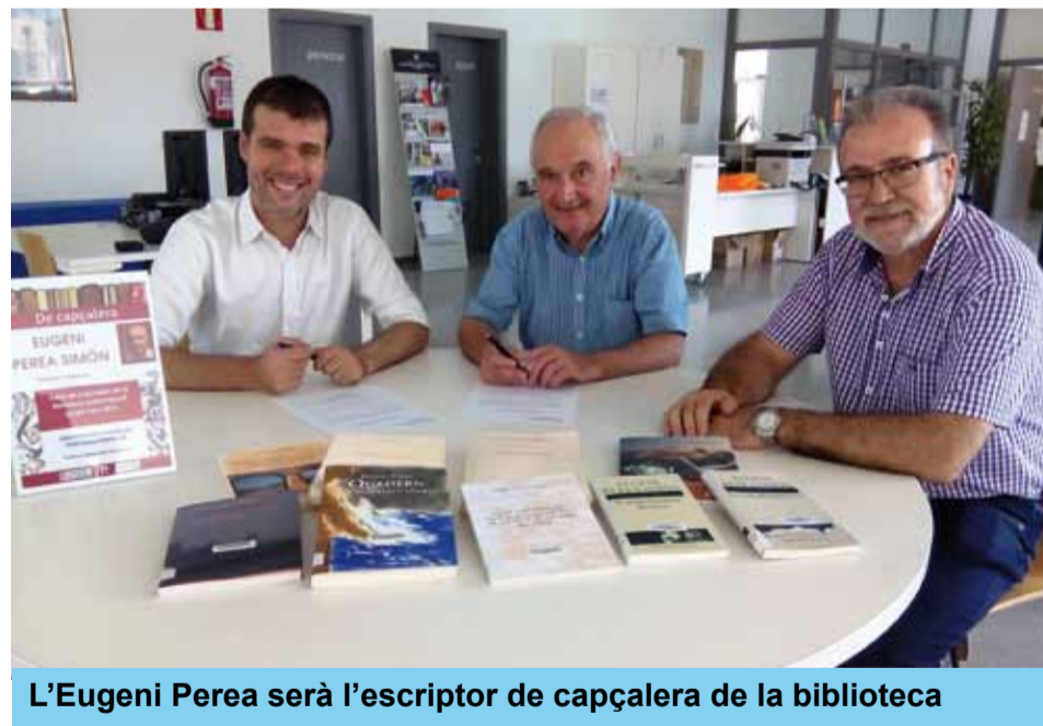
L'Eugeni Perea serà l'escriptor de capçalera de la biblioteca

Des del mes de juliol, l'escriptor riudomenc Eugeni Perea Simón és oficialment, i durant aquest any 2015, l'autor de capçalera de la Biblioteca Pública Municipal Antoni Gaudí. L'escriptor i la biblioteca s'han adherit al projecte "De capçalera", impulsat pel Servei de Biblioteques de la Generalitat de Catalunya, juntament amb la Institució de les Lletres Catalanes i amb la col·laboració de l'Institut Català de les Dones, i que pretén enfortir els vincles entre les biblioteques i els seus escriptors de proximitat. Per aquest motiu, la Biblioteca Pública Municipal Antoni Gaudí organitzarà diferents activitats en les quals es reconeixerà la trajectòria literària de l'Eugeni i que comptaran amb la seva participació.