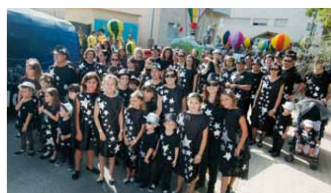
Barri de la Raval