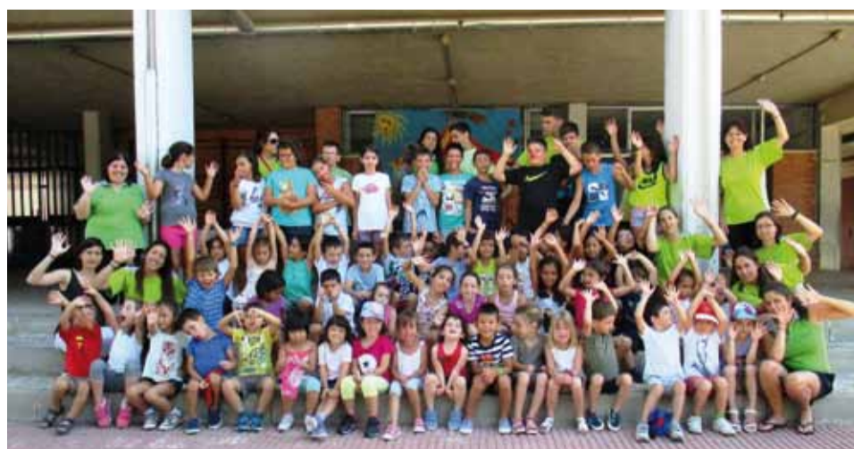
Durant el mes de juliol, els infants han gaudit d'activitats de lleure

Aquest any, i com a novetat, cadascun dels dos torns s'ha centrat en un centre d'interès, així el primer torn va treballar el circ i el segon el mar, de manera que totes les activitats han girat al voltant d'aquestes temàtiques.