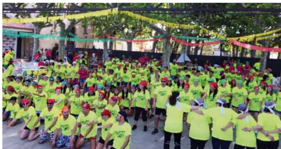
Els participants a la Megagimcana ballant "Paquito Chocolatero"

El món dels pirates ha estat el tema escollit sobre el qual s'ha basat la Megagimcana Popular 2015 que va celebrar-se el diumenge 19 de juliol. Aquest any i com a novetat, els 206 participants es van dividir en dues categories: la júnior i la d'adult, amb 12 i 24 equips respectivament. Les proves van finalitzar al Parc de Sant Antoni on també es va fer el lliurament de premis per als tres primers equips classificats de cada categoria, per als equips més animats i per als millors vaixells pirates.