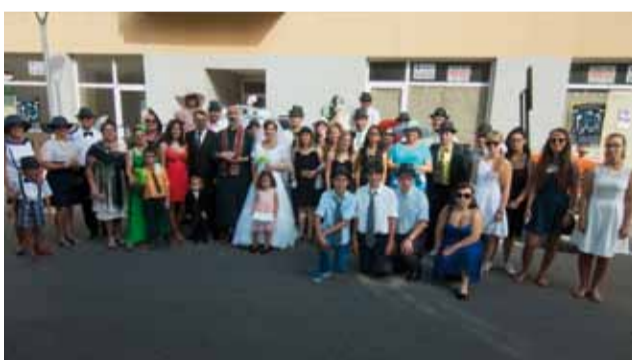
Barri de Sant Sebastià