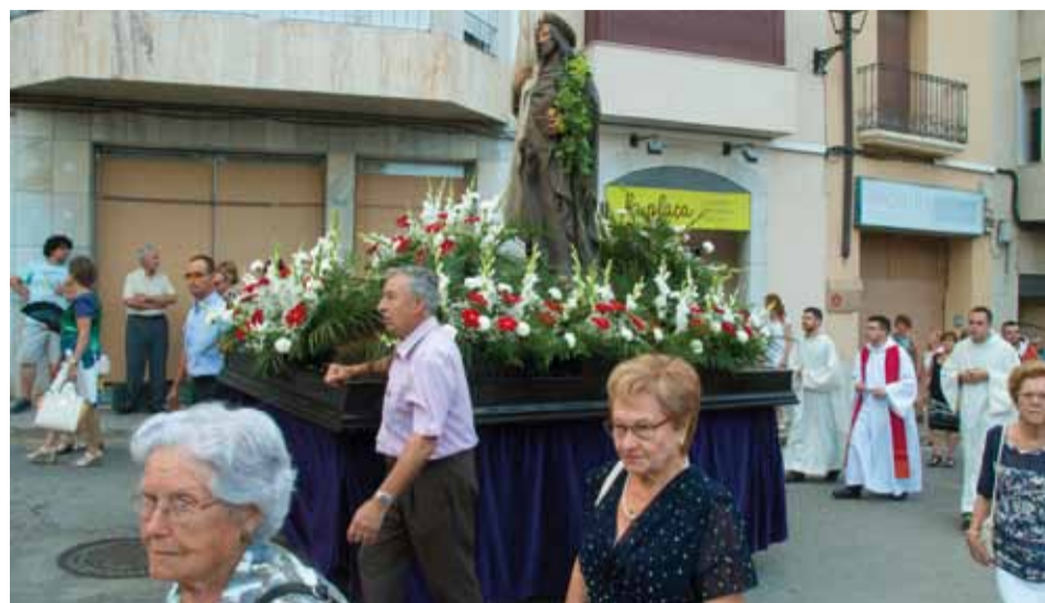
La processó de Sant Jaume Apòstol, en honor al copatró

I el diumenge 26 es va celebrar la 24a Bicicletada Popular amb prop de mil persones inscrites que van poder escollir dos tipus de recorregut, un de llarg pel terme i un de curt pel casc urbà, i van acabar la jornada amb un esmorzar conjunt al Parc de Sant Antoni.