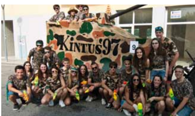
Els quintos de l'any 1997