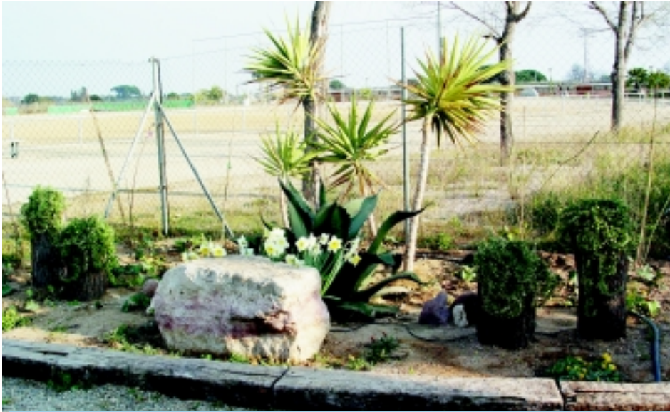
Una de les parts de la zona enjardinada al costat del camp de futbol nou de Riudoms.

Lamiel, guàrdia municipal de l'Ajuntament de Riudoms, ha estat el responsable d'enjardinar desinteressadament i en el seu temps lliure l'espai que quedava al costat del camp de futbol nou.