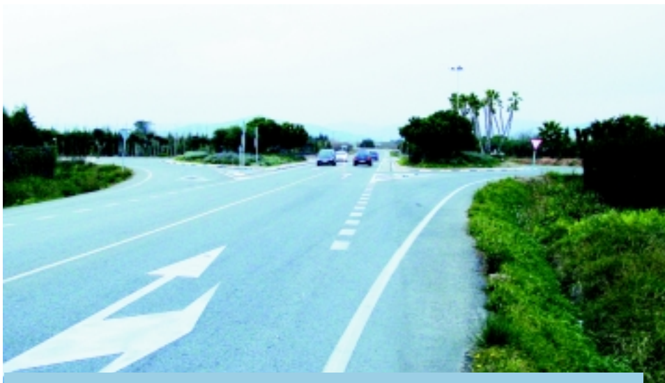
Una de les rotondes al seu pas per la Variant Riudoms-Reus .

A hores d'ara ja està planificat pavimentar els darrers carrers del barri que queden pendents. Aquest dos carrers no es van poder pavimentar en el seu moment per la seva reduïda amplada i per les obres que es feien en un d'ells.