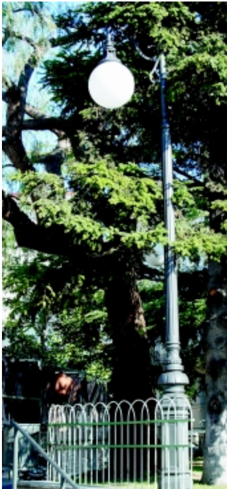
Nou enllumenat a les escales principals de la Plaça de l'Església.