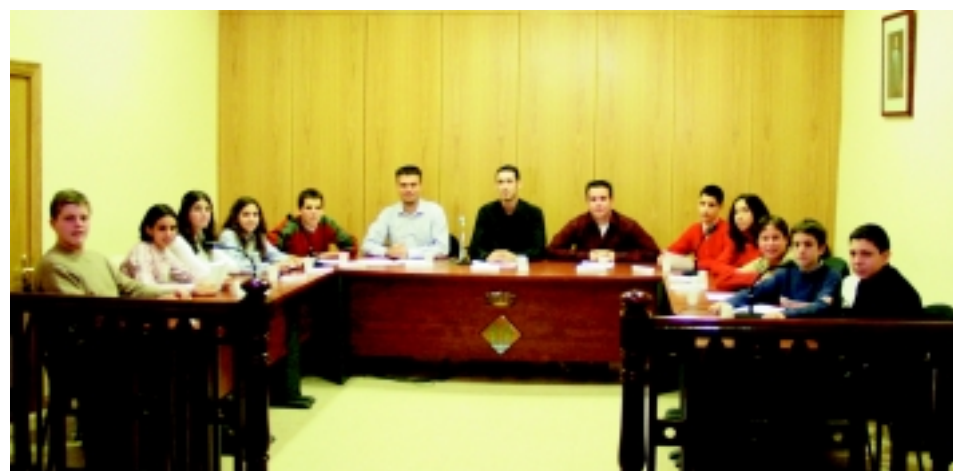
L'Esplai del Casal al Saló de Plens de l'Ajuntament.

Mitjançant aquesta activitat, els monitors buscaven donar a conèixer el funcionament de les Sessions Plenàries de l'Ajuntament i per altra banda practicar amb aquests joves diferents actituds com ara el consens, la participació, el raonament, el respecte del torn de paraula, etc.