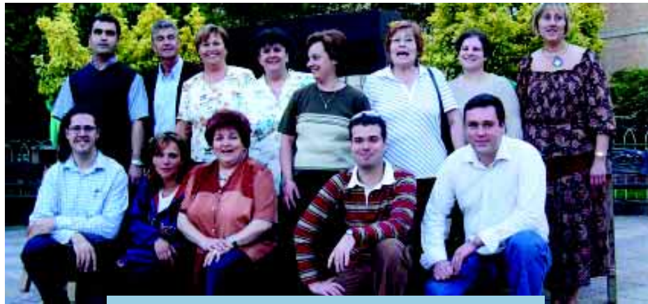
Part de l'equip organitzador de la Trobada .

El passat diumenge 23 de maig es va celebrar una trobada de puntaires a la nostra vila, coorganitzada per l'Ajuntament de Riudoms i « El Taller », grup riudomenc dedicat a les manualitats. A banda de les puntaires de « El Taller », també hi van participar del Grup de Puntaires de Riudoms que assisteixen en altres trobades lluint el nom del nostre poble.