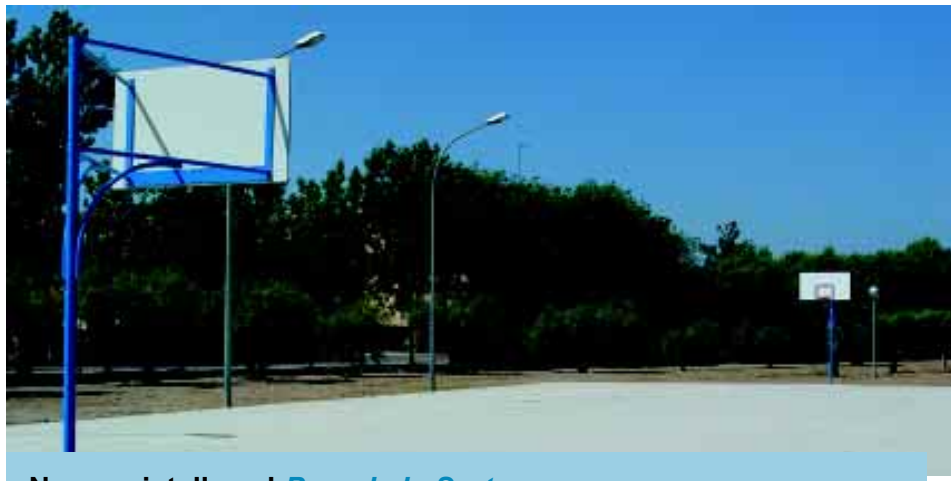
Noves cistelles al Parc de la Sort .

A petició de diferents veïns, s'han instal·lat dues cistelles de bàsquet al Parc de la Sort , situat prop de l'Avinguda Verge de Montserrat. Així doncs, a partir d'ara els veïns de Riudoms podran fruit d'aquest espai també per a jugar-hi a bàsquet.