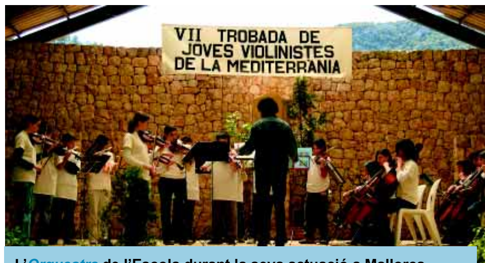
L' Orquestra de l'Escola durant la seva actuació a Mallorca.

Els dies 6, 7, 8 i 9 de maig l' Orquestra de l'escola es va desplaçar a l'illa de Mallorca per a participar a la « VII trobada de joves violinistes de la Mediterrània ». El dijous 6 van fer un concert a l'Església dels Sagrats Cors de Ciutat de Palma, amb un important èxit artístic. És la primera vegada que l'Orquestra ha preparat un concert d'una hora de durada, assajat prèviament amb molt esforç i dedicació. Fins diumenge, van participar en les activitats pròpies de la trobada, visitant també la casa on va viure Frederic Chopin a Valldemossa. Els actes centrals de la trobada es van fer al Monestir de Lluc, un preciós emplaçament situat a la Serra de Tramuntana que va ajudar encara més a gaudir de la música i la convivència entre tots els participants. Per altra banda, el dijous 13 de maig, l'Orquestra va tornar a interpretar el concert ofert a Mallorca una setmana abans, aquesta vegada al pati del Castell de Torredembarra, un lloc ideal per sentir la música d'aquesta formació de Riudoms que encara encoratjats per la trobada a les illes, van demostrar el bon moment musical i humà que han pogut recollir a l'altra banda de la Mediterrània. Fruit d'aquest encoratjament, ens volen oferir el mateix concert a Riudoms. Ja en sentirem a parlar.