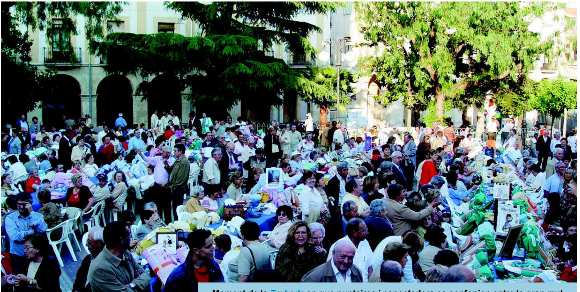
Moment de la Trobada en que puntaires i espectadors es confonien entre la gran multitud que va assistir a l'acte.