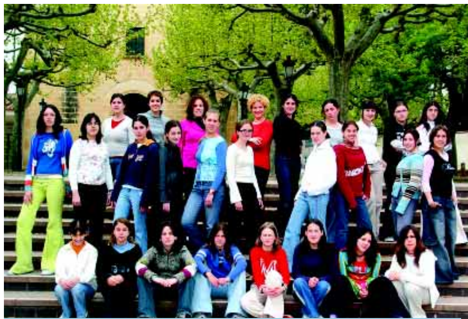
Integrants del Cor Jove que va triomfar a Torrevella.

Així mateix, els dies 8 i 9 de maig, les alumnes més grans de l'escola integrades al « Cor Jove » van participar, convidades per l'organització, al prestigiós concurs de cant coral « X Certamen Infantil de Habaneras » celebrat a Torrevella (Alacant). Hi van prendre part catorze formacions corals. El « Cor Jove » era la formació amb menys temps d'existència que participava al concurs i tot i així, la nostra representació va obtenir un meritori « Diploma d'or », que representa una mena de tercer premi que l'organització va concedir vist l'altíssim nivell ofert en aquest certamen. A hores d'ara, s'està preparant un intercanvi amb una coral de Vitòria (Euskadi) per als dies 19, 20 i 21 de juny.