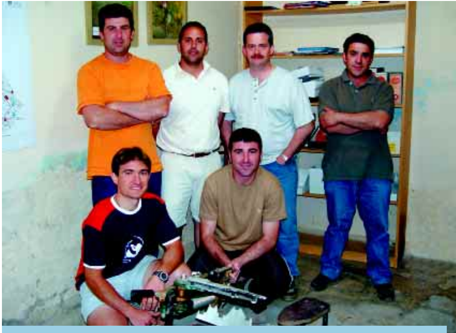
Junta actual de la Societat de Caçadors de Riudoms .