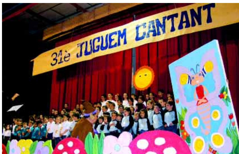
Totes les corals participants en plena actuació conjunta.

Dissabte 1 de maig, els alumnes més joves, els « Petits Cantors », van participar a la trobada anual de cant coral « Juguem Cantant », que es va celebrar a Alcanar (El Montsià). Es van celebrar també algunes activitats complementàries: cercavila amb gegants i capgrossos, pallassos... i a la tarda, conjuntament amb una desena de formacions corals de tota la província, es va interpretar la cantata «El follet valent», en la qual els alumnes de Riudoms van fer de solistes.