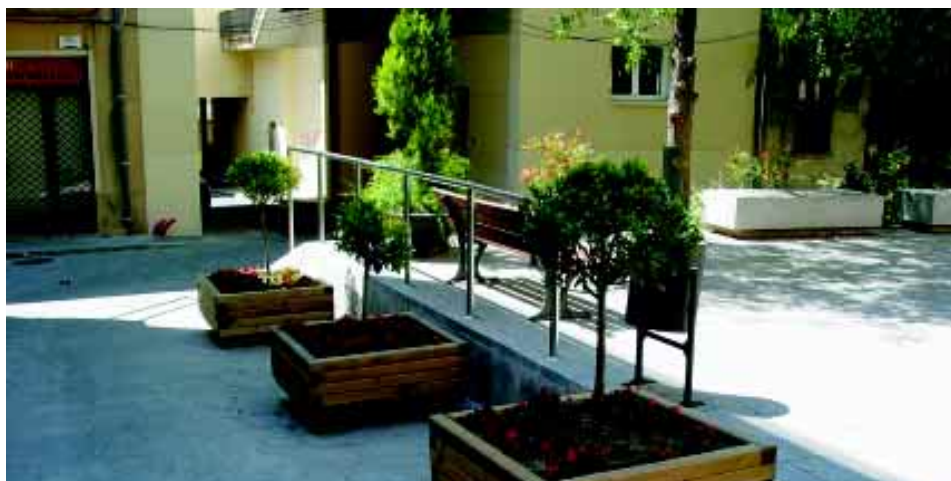
Les jardineres milloraran la circulació a la Plaça de l'Om .

Les parts laterals de la plaça de l'Om, que comuniquen el carrer Major amb el carrer Beat Bonaventura Gran, eren sovint objecte d'aparcaments indeguts que dificultaven el trànsit rodat. Les noves jardineres col·locades en aquest espai, alhora que embelliran encara més la plaça, pretenen acabar amb aquest problema. Per facilitar l'aparcament de motos, aquestes tenen una zona reservada al passatge que comunica la plaça de l'Om amb l'Av. Pau Casals.