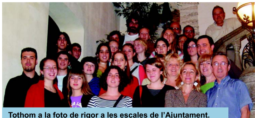
Tothom a la foto de rigor a les escales de l'Ajuntament.

Si esteu interessats en veure algunes fotografies dels intercanvis podeu entrar a la web de l'institut: www.xtec.es/iesjoanguinjoan/ex.htm .