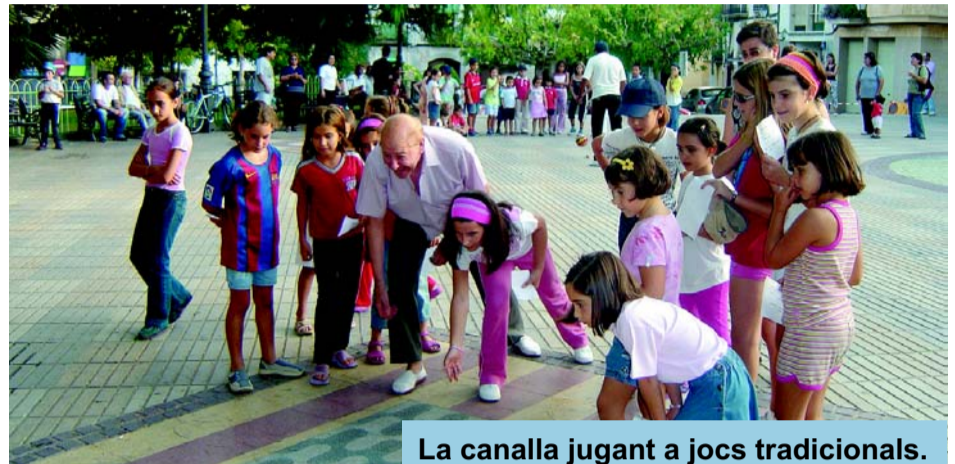
La canalla jugant a jocs tradicionals.

La valoració de les jornades ha estat molt positiva, per la gran participació dels veïns del poble, sobretot dels nens i nenes, i les entitats i associacions organitzadores.