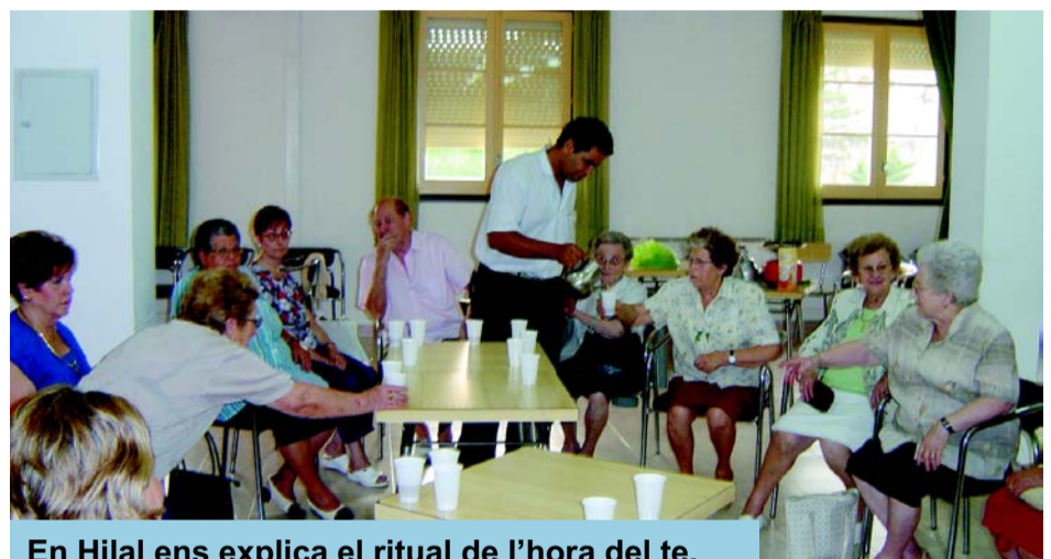
En Hilal ens explica el ritual de l'hora del te.