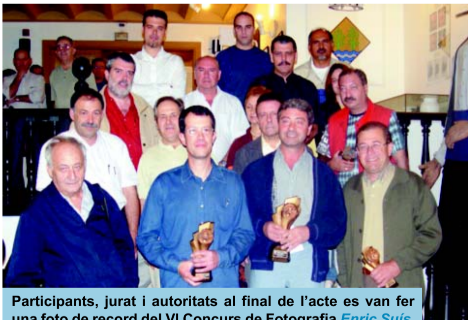
Participants, jurat i autoritats al final de l'acte es van fer una foto de record del VI Concurs de Fotografia Enric Suís .

El divendres 22 d'octubre es va portar a terme l'entrega de premis del concurs de fotografia Enric Suís 2004, així com la inauguració de l'exposició de fotografies que recull totes les propostes que s'ha presentat.