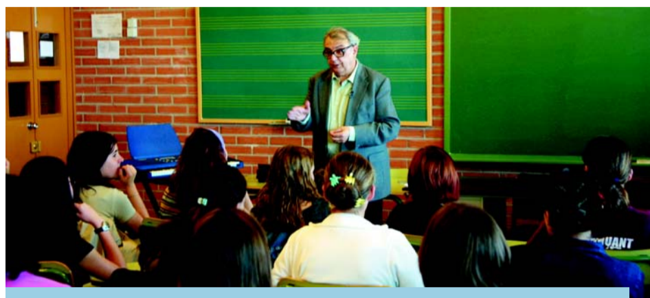
Joan Guinjoan durant una visita de cortesia a l'Institut que porta el seu nom.