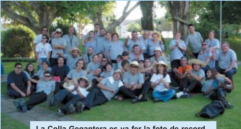
La Colla Gegantera es va fer la foto de record.

Els dies 2 i 3 de juliol 2005, el Gegant Antoni Gaudí per segona vegada i la parella de Capgrossos Catalans de Riudoms juntament amb catorze components de l'entitat ens vam desplaçar a la població portuguesa de Pinhal Novo per participar al «5è Festival Internacional de Gigants». Les colles geganteres catalanes invitades a la Festa van ser: Manresa, Vallgorguina, Amics dels Gegants de Matadepera i en especial Riudoms.