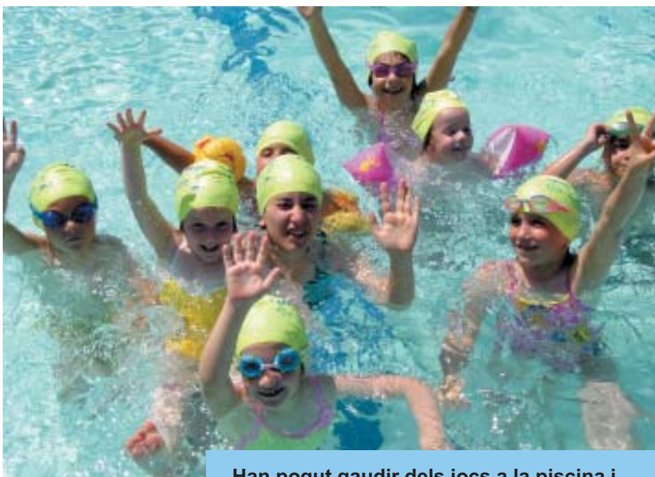
Han pogut gaudir dels jocs a la piscina i ...

El divendres 29 es va acabar l'Escola de Lleure 2005, organitzada per l'Ajuntament de Riudoms. Cinc setmanes compartint emocions, sorpreses i somriures. Cinc setmanes de jocs, de tallers, d'activitats aquàtiques, de visites culturals, d'esports i de danses. Cinc setmanes de nens i nenes, de pares i mares, de monitors i monitores... Però sobretot, cinc setmanes transmetent actituds, valors i normes, desenvolupant habilitats motrius i formant relacions socials.