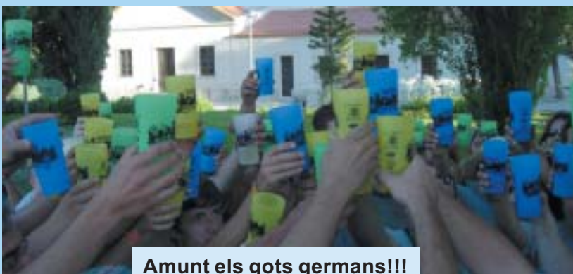
Amunt els gots germans!!!

L'entitat gegantera riudomenca està efectuant contactes amb colles de: «Les Amis de Fromulus» Steenvoorde (França), «Les Amis du Caou» Merville (França), Miami-Florida (E.U.A), Laguntasuna (Barakaldo), Deba (Guipuzcoa), Menorca i Palma de Mallorca, aquestes colles geganteres i grups musicals són els preparatius per celebrar el 25 a Aniversari de la Colla Gegantera de Riudoms que s'iniciarà a l'agost del 2007 i finalitzarà a l'agost del 2008. El projecte de l'Aniversari serà que els actes Festius Locals (Fira 2007, 11 setembre, Beat, Sant Jordi, Sant Jaume i Fira 2008), tinguin actes geganters i de música tradicional. Animem a la gent que estima els Elements Festius Locals per apuntar-se a l'entitat gegantera Local.