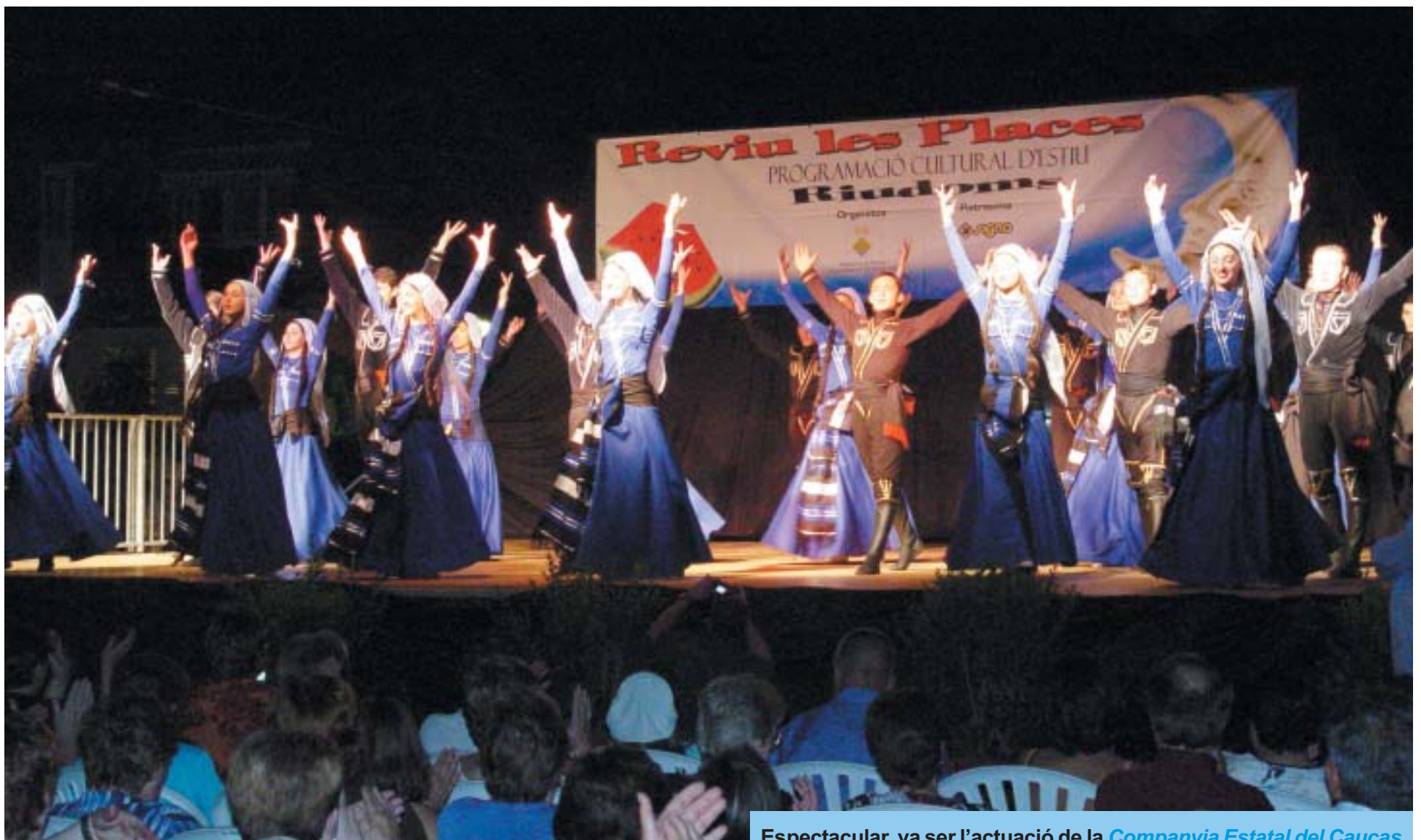
Espectacular, va ser l'actuació de la Companyia Estatal del Caucas .