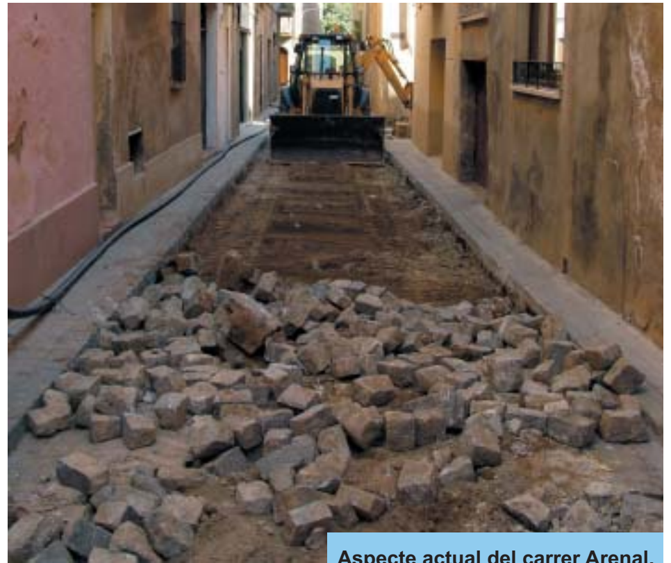
Aspecte actual del carrer Arenal.

A efectes de minimitzar les molèsties als vianants s'ha planificat l'execució de l'obra en tres fases: la primera va de l'Avinguda de Reus fins a l'encreuament del Carrer Major, la segona de l'encreuament del Carrer Major fins l'encreuament amb el Carrer de Sant Isidre i la tercera del Carrer de Sant Isidre fins a la Plaça de l'Església.