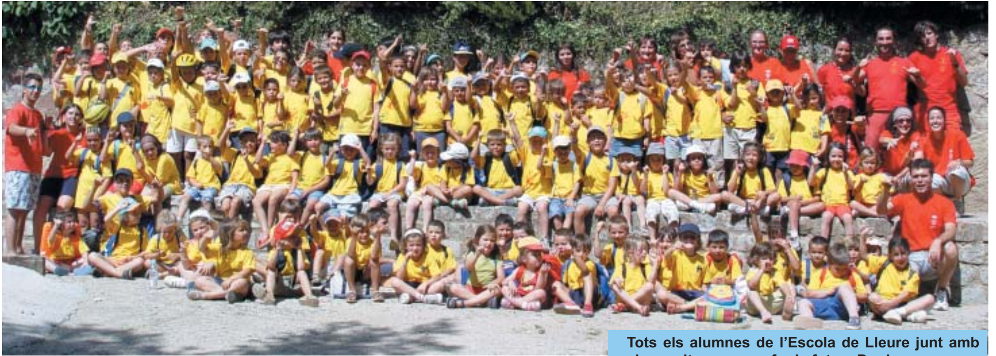
Tots els alumnes de l'Escola de Lleure junt amb els monitors es van fer la foto a Prades.

El divendres 29 es va acabar l'Escola de Lleure 2005, organitzada per l'Ajuntament de Riudoms. Cinc setmanes compartint emocions, sorpreses i somriures. Cinc setmanes de jocs, de tallers, d'activitats aquàtiques, de visites culturals, d'esports i de danses. Cinc setmanes de nens i nenes, de pares i mares, de monitors i monitores... Però sobretot, cinc setmanes transmetent actituds, valors i normes, desenvolupant habilitats motrius i formant relacions socials.