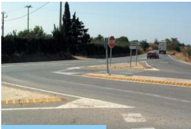
Aspecte actual de la cruïlla.

Riudoms es beneficiarà d'un nou projecte de millora de la xarxa viària de carreteres de la Diputació de Tarragona.