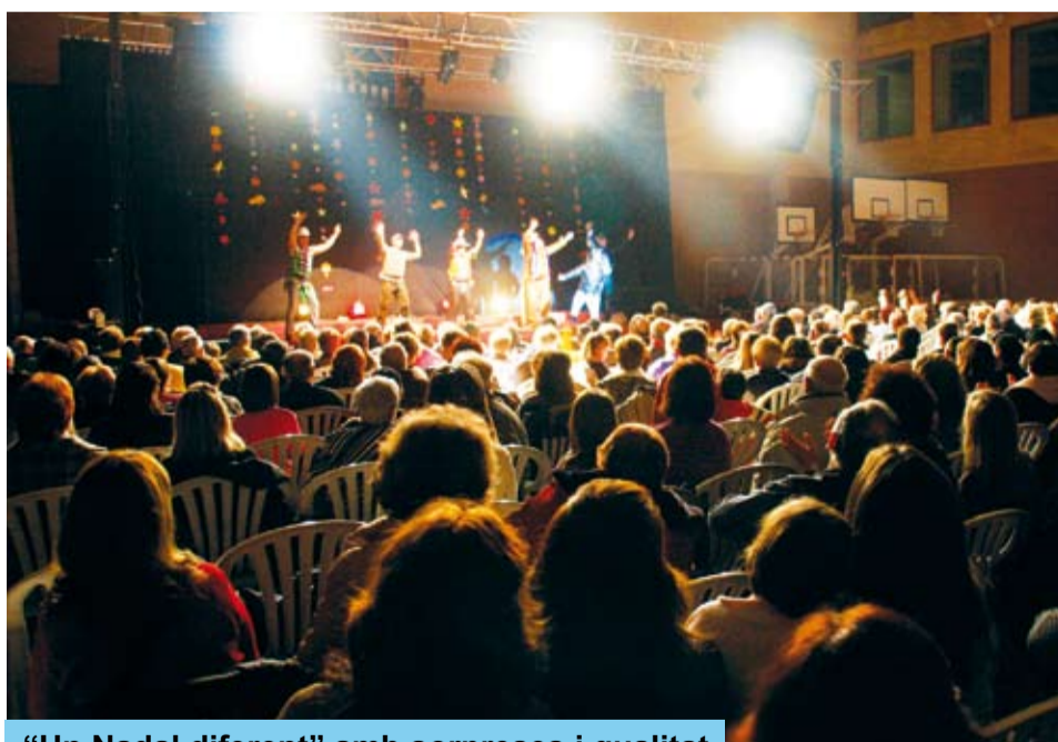
"Un Nadal diferent" amb sorpreses i qualitat

Dissabte 27, el Concert de Nadal que cada any organitza l'Ajuntament de Riudoms, va anar a càrrec del Grup Independent d'Art, que va oferir-nos un excel·lent espectacle musical anomenat "Un Nadal diferent", tot fent un repàs a peces musicals de totes les èpoques, en format play-back.