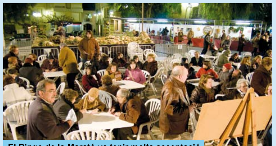
El Bingo de la Marató va tenir molta acceptació

L'Ajuntament de Riudoms us encoratja a participar en els actes de la propera Marató.