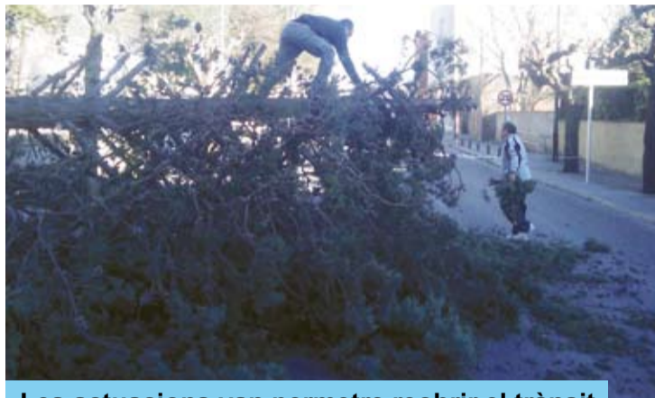
Les actuacions van permetre reobrir el trànsit

Tal i com vam poder comprovar els que érem al poble o pel terme, els cops de vent de més de 120 quilòmetres per hora van sembrar-ho tot de desperfectes i d'importants danys materials.