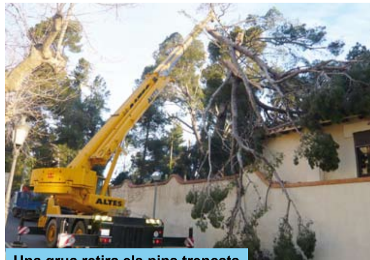
Una grua retira els pins trencats

Tot i no obtenir ajuda des dels serveis d'altres administracions, a Riudoms vam fer front al temporal, estant al peu del canó. És per això, que m'agradaria agrair l'esforç de tot el personal de l'Ajuntament i regidors que van participar dels treballs durant el fort vent, així com la col·laboració ciutadana i l'actuació responsable de tots els veïns.