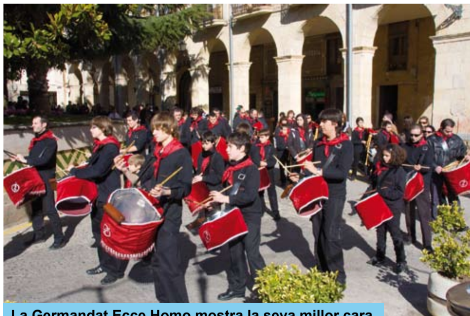
La Germandat Ecce Homo mostra la seva millor cara