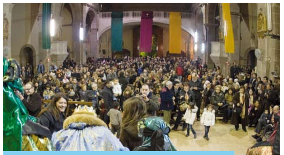
En el Seguici Reial hi participen més de cent persones

El 5 de gener va arribar un altre moment màgic: la Cavalcada dels Reis d'Orient que venir a Riudoms acompanyats pels més de cent membres del Seguici Reial, carrosses, una miqueta de carbó i moltes sorpreses. Des del balcó de la Casa de la Vila van saludar tot el poble, anunciant que portaven tres regals molt especials: PAU, AMOR i FELICITAT, representats pel Colom de la Pau, una pluja de pètals de rosa i un esclat de confetti. A l'Església van repartir molts regals als nens i nenes que van anar a rebre'ls. Altres, van trobar els seus obsequis a tots els balcons i finestres, gràcies al treball dels patges i a la màgia reial de la que poden fer ús.