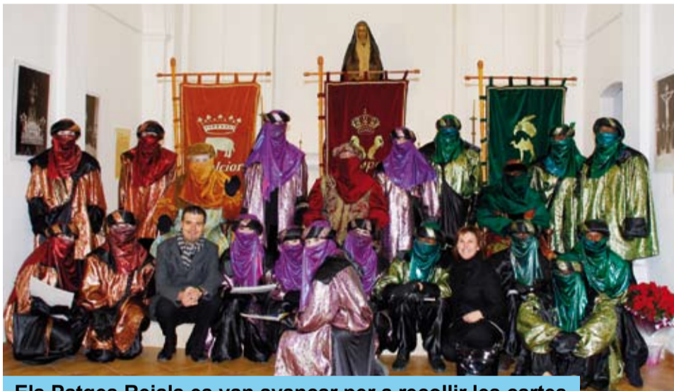
Els Patges Reials es van avançar per a recollir les cartes

Sant Esteve va ser el dia triat pels Patges Reials per venir a recollir les cartes de tots els nens i nenes de Riudoms.