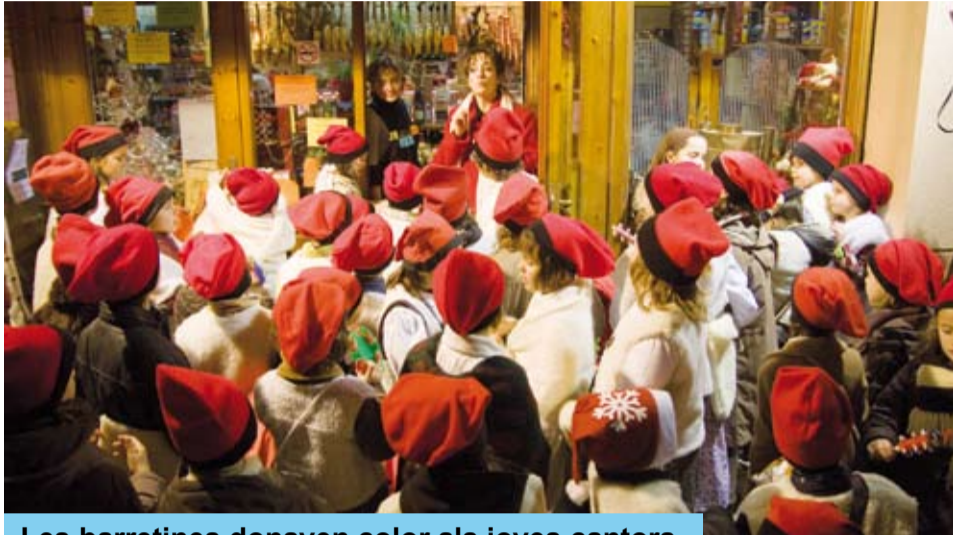
Les barretines donaven color als joves cantors

L'Escola de Música va oferir, el 16 de desembre, una Audició musical i el 19, una Cantada de nades pels carrers i el Concert de Nadal a l'església.