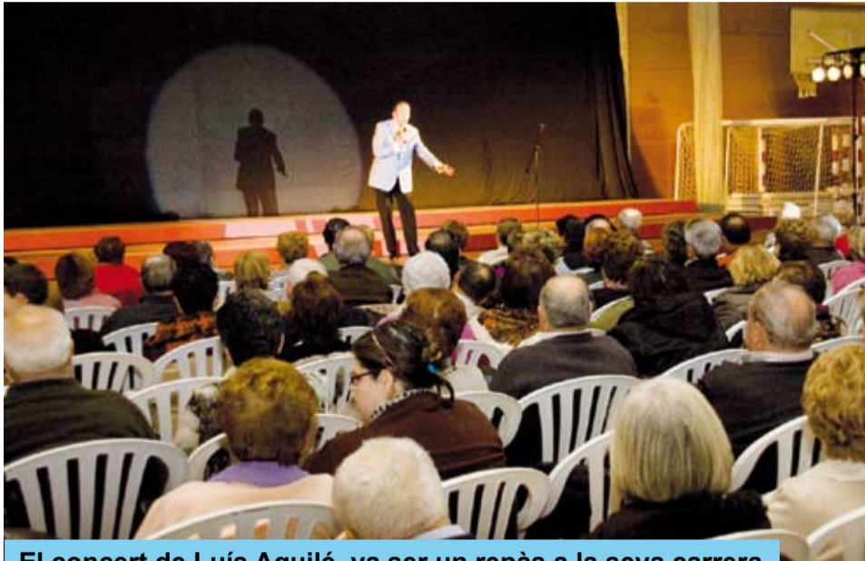
El concert de Luís Aguilé, va ser un repàs a la seva carrera

Tot i això, divendres es va celebrar, sense problemes, el concert del cantant Luís Aguilé. Al pavelló municipal, aquest artista d'origen argentí va resegir la seva carrera musical, tot fent gala de les seves dots de "showman" a l'intercalar anècdotes i acudits entremig dels temes musicals. Luis Aguilé va interpretar una peça en llengua catalana, mostrant una molt bona dicció, arran dels anys que va viure a Barcelona. En acabar el concert el públic va poder saludar a l'artista qui va respondre amb la signatura d'autògrafs i d'algun disc compacte.