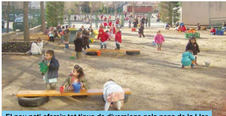
El nou pati ofereix tot tipus de diversions pels nens de la Llar

Tot aprofitant les vacances de Nadal, la Brigada Municipal ha realitzat diverses intervencions de manteniment i conservació de les aules i ha repintat totes les dependències de la llar, aconseguint crear un ambient molt més acollidor.