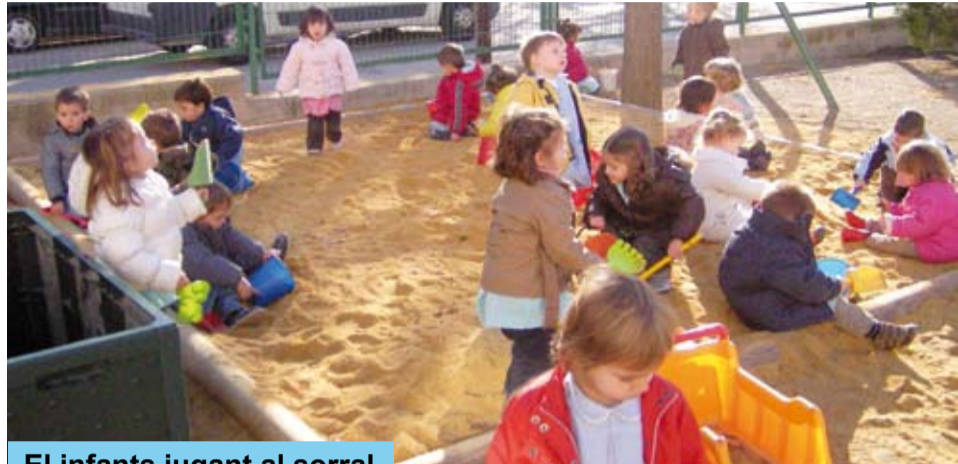
El infants jugant al sorral

Aquest hivern s'ha millorat l'enjardinament global del pati. Potser el més destacat ha estat el trasllat cap el viver municipal d'un arbre de gran talla, que a l'hivern feia massa ombra i provocava sensació d'humitat i fredor.