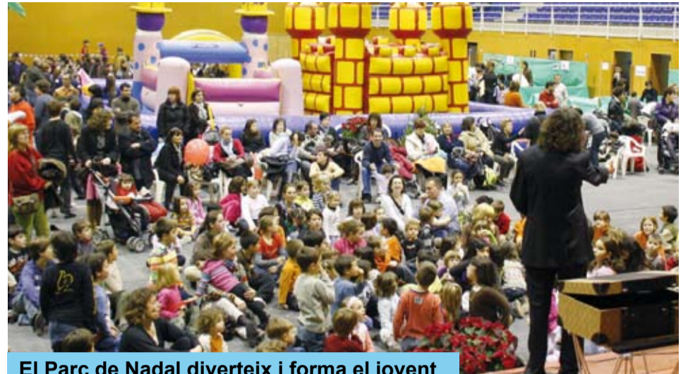
El Parc de Nadal diverteix i forma el jovent

El 29 i 30 de desembre, el Pavelló es va transformar novament en Parc de Nadal. Tallers i activitats organitzades per entitats locals, videojocs, rocòdrom i atraccions van fer per dos dies, el Parc de Nadal riudomenc.