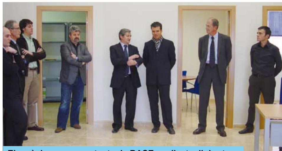
Els màxims representants de BASE, en l'acte d'obertura

Fins ara s'havia d'anar a Reus, però actualment ja es poden fer les següents gestions a l'oficina de BASE de Riudoms: