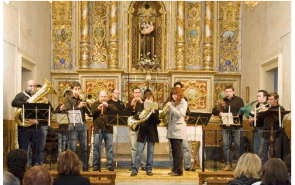
La Trobada de Sacaires, punt de referència de la música tradicional

La Trobada de Sacaires de Riudoms és, sens dubte, una data de referència pels músics i apassionats del sac de gemecs, esdevenint una de les convocatòries d'aquest àmbit tan concret més arrelades en el panorama tradicional català. L'objectiu que va fer néixer aquesta trobada era el de recuperar un instrument que deu anys enrere havia caigut en el desconeixement i actualment sembla que torna a viure un auge, discret però ferm.