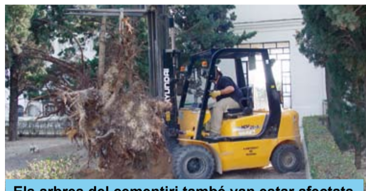
Els arbres del cementiri també van estar afectats

Durant les hores que va durar el fort vent, les actuacions coordinades des de la Casa de la Vila es van anar multiplicant: des d'evacuar amb mitjans propis un senyor gran que s'havia quedat aïllat en un mas i que, per qüestions de salut, havia de ser traslladat urgentment, fins a les feines per consolidar els xiprers de la plaça del Cementiri els quals representaven un perill imminent de caiguda damunt les cases veïnes.