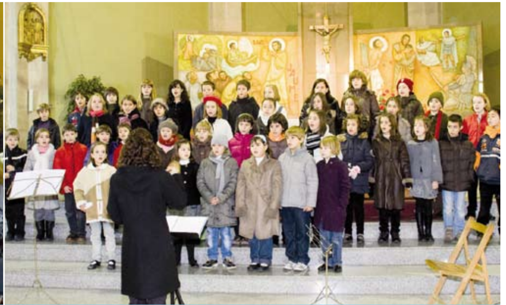
L'Escola de Música va oferir dos extraordinaris concerts a l'Església