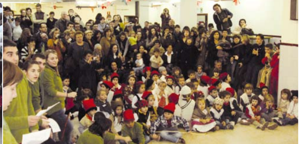
Les famílies van assistir a la cloenda dels tres dies d'activitats