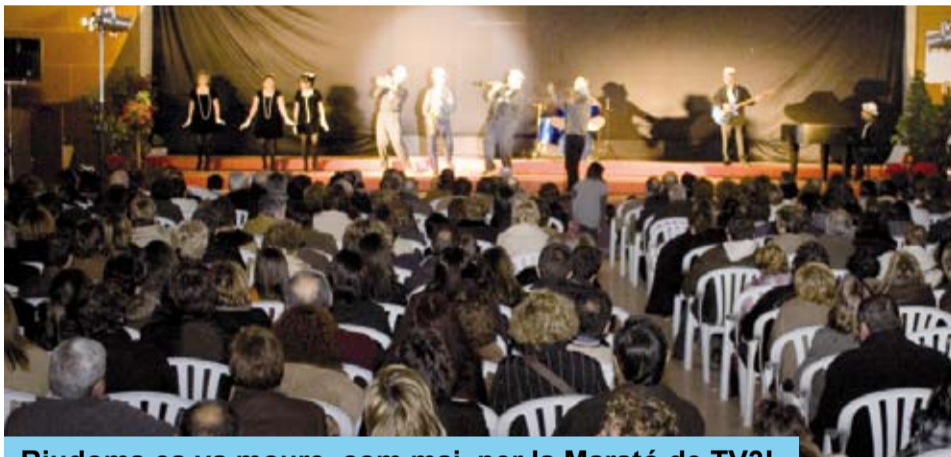
Riudoms es va moure, com mai, per la Marató de TV3!