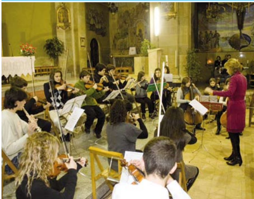
L'Escola de Música mostra cada any el seu bon nivell