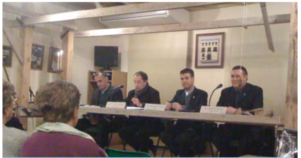
La brigada municipal va muntar un escenari per a la presentació

A partir del material trobat s'ha pogut elaborar una separata de 44 pàgines, una exposició fotogràfica que ha estat exposada a la Casa de Cultura i una projecció de les imatges que va tenir lloc a l'Església, abans del Concert de Nadal.