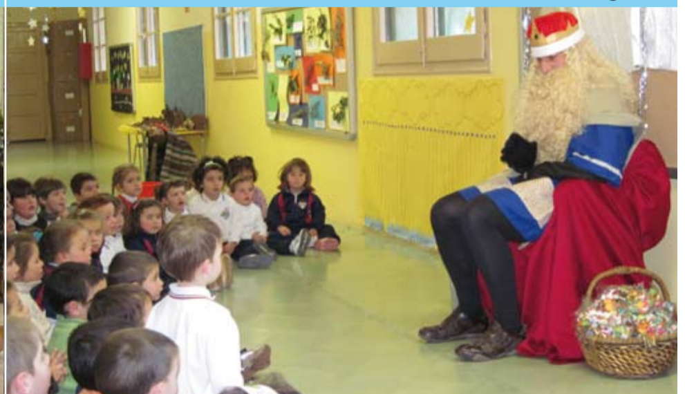
L'Escola Cavaller Arnau va rebre la visita del Patge Reial