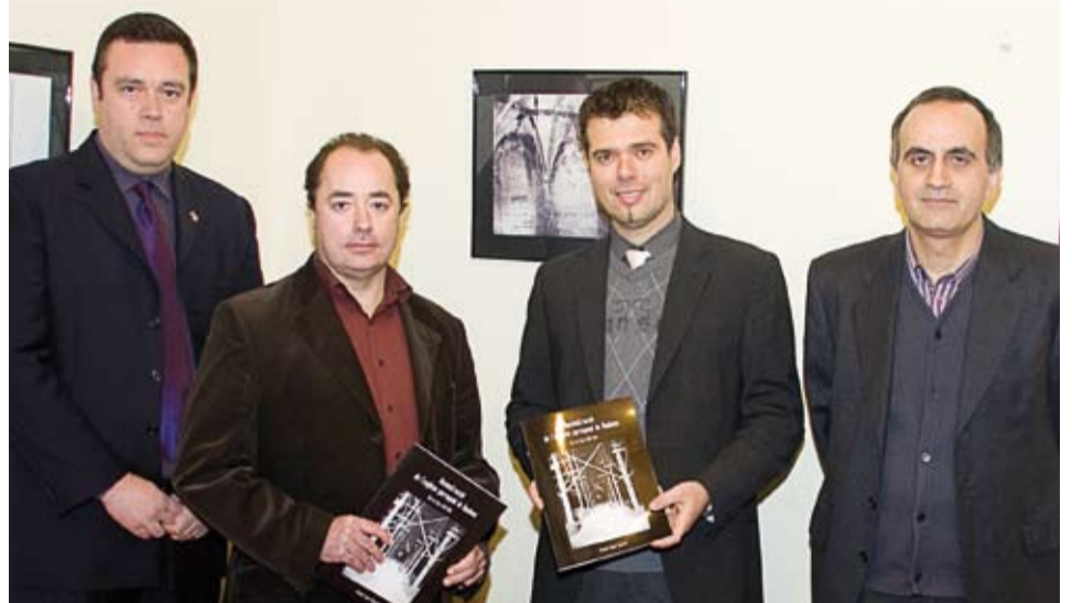
Aquest és el volum número 7 de la col·lecció Rivoulmorum.

Aquest nou volum de la col·lecció de separates Rivoulmorum porta per títol Reconstrucció de l'església parroquial de Riudoms. Diari de l'obra (1942-1944) .