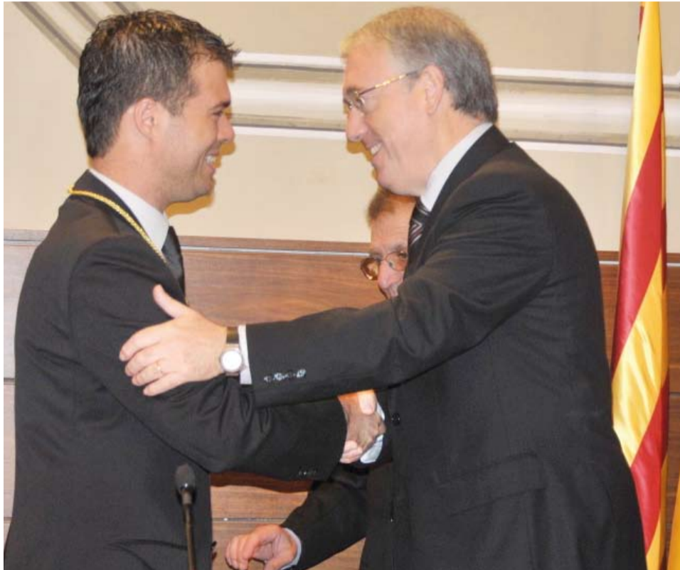
El President de la Diputació felicita l'Alcalde en el seu nomenament

Recentment, l'Alcalde de Riudoms ha estat nomenat diputat de la Diputació de Tarragona, entrant a formar part de l'Equip de Govern d'aquesta institució històrica.