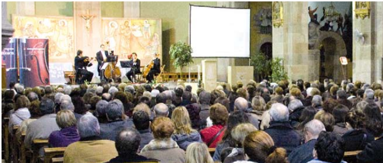
Caixa Tarragona va patrocinar el Concert de Nadal amb l'Orquestra Camerata XXI