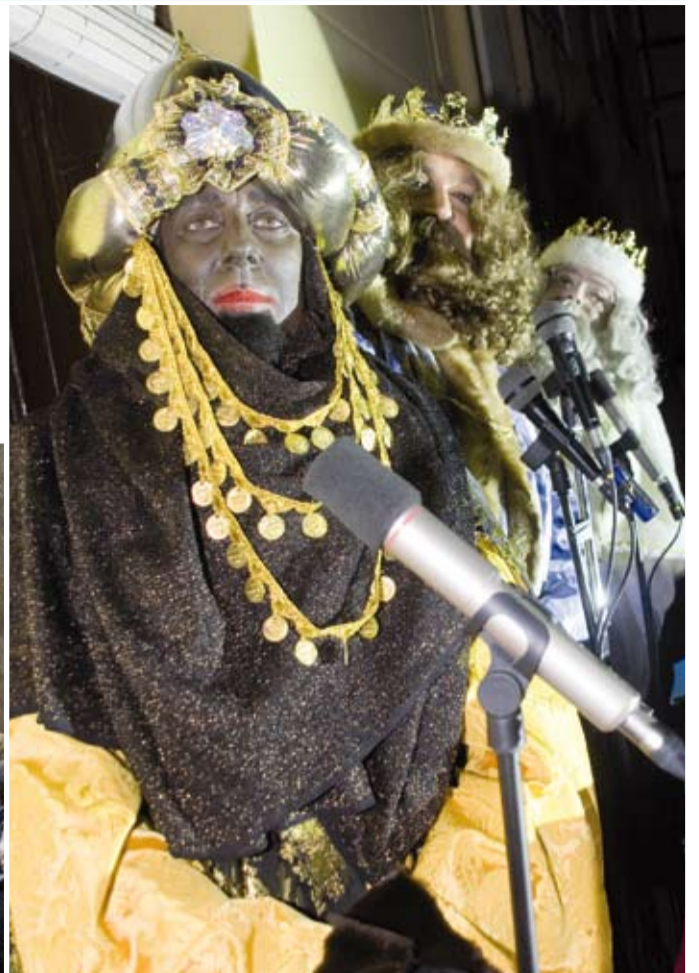
“Posem-nos-hi bé que sortirem al Patufet!”

De parts de tots, que tingueu un molt bon any 2010!