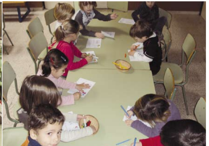
El Nadal Genial va tenir lloc a les instal·lacions escolars