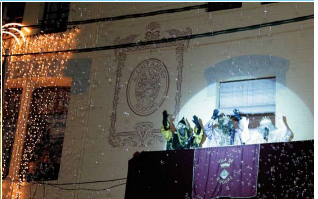
Una pluja de bombolles màgiques representava els desitjos dels riudomens

Es posen a la venda, 4 parcel·les al costat de la nova escola