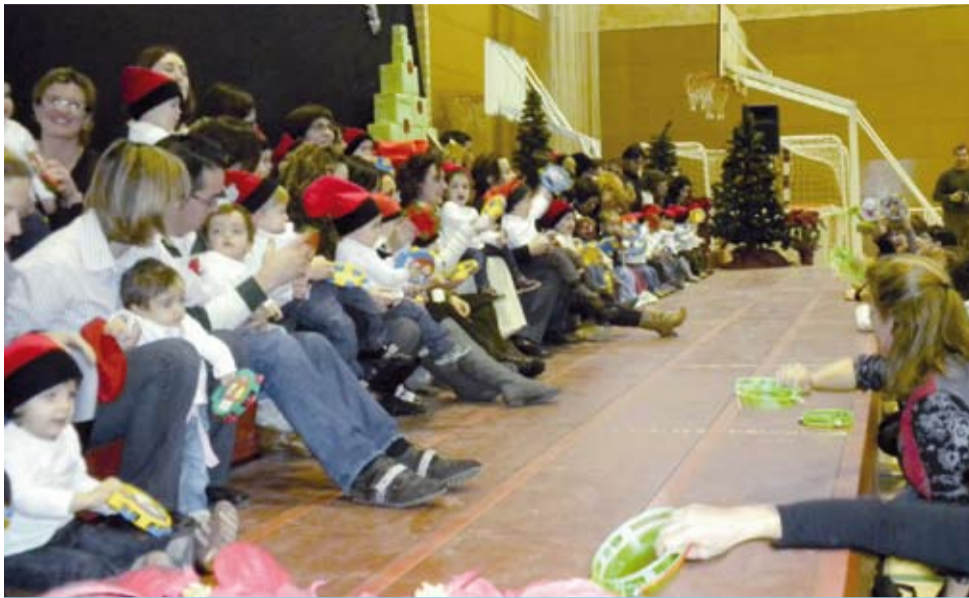
La Llar d'Infants Picarols va celebrar una gran festa nadalenca