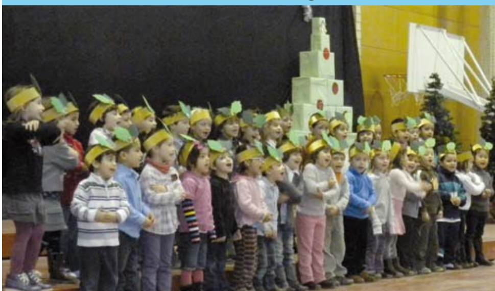
L'Escola Beat Bonaventura va fer un festival de nades al Pavelló