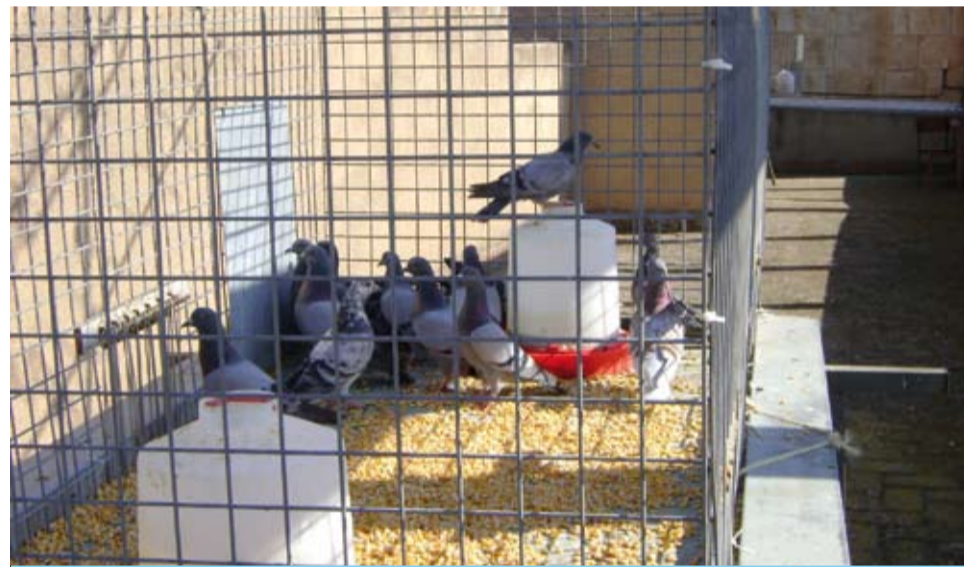
Una de les gàbies estava situada darrera el campanar de l'església

Les diferents gàbies que estan col·locades en punts estratègics del poble, permeten anar capturant coloms i poder així mantenir sota control la seva proliferació.