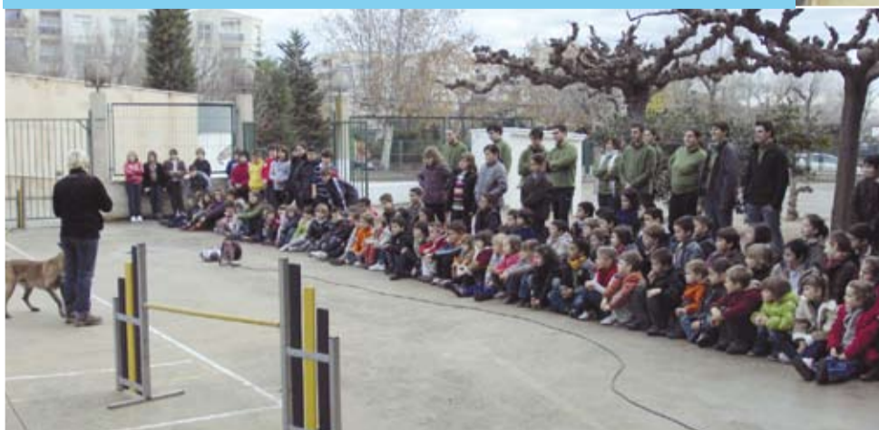
Els participants van fer tallers, visites i demostracions lúdiques