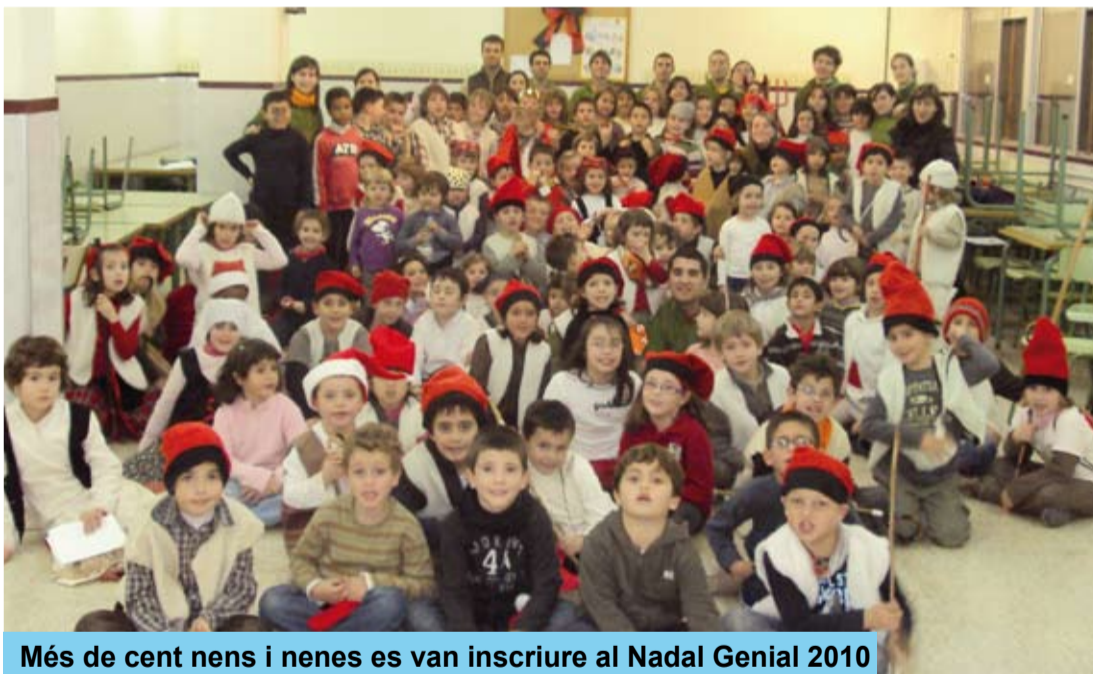
Més de cent nens i nenes es van inscriure al Nadal Genial 2010