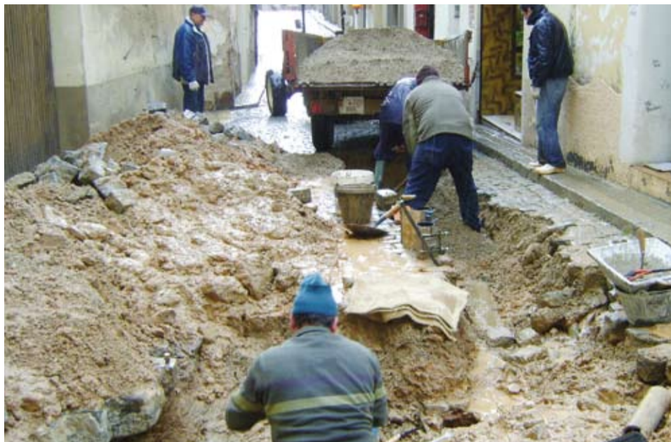
La reparació de la fuga va obligar a aixecar un tram del carrer Nou

Gràcies al seguiment diari que es fa del consum d'aigua, es va detectar un sobtat increment d'aproximadament 250 metres cúbics diaris. Immediatament es va iniciar un seguiment dels diferents sectors del poble, estudiant els consums i buscant possibles cabals anormals en la xarxa de clavegueram. Aplicant aquesta metodologia la Brigada Municipal va localitzar ràpidament una important fuga d'aigua i va poder procedir a la seva reparació.