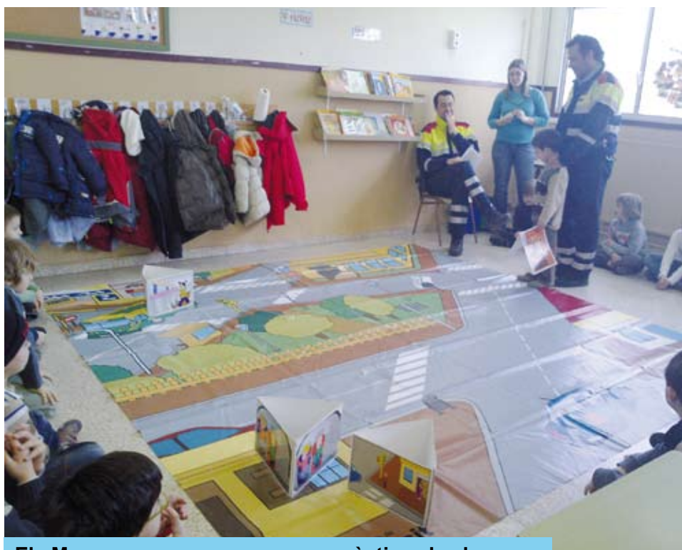
Els Mossos van proposar casos pràctics als alumnes

Els alumnes dels Centres Educatius de Riudoms no només van aprendre molt, sinó que també van passar una bona estona, doncs els agents van fer les sessions d'una manera divertida, amena i participativa.