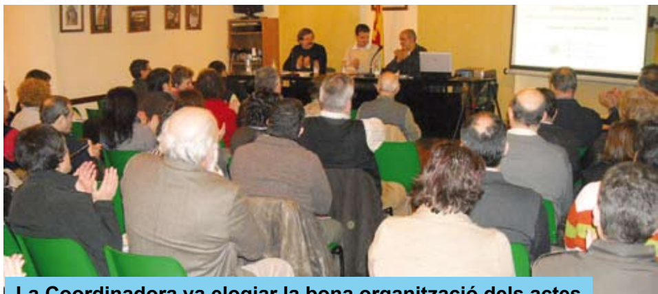
La Coordinadora va elogiar la bona organització dels actes