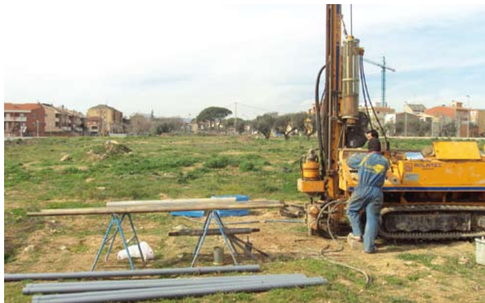
Els estudis geotècnics asseguraran la solidesa de l'edifici escolar

Segons el calendari establert, un cop adjudicat el contracte, es tardarà 4 mesos en redactar el projecte i 7 mesos més per a executar