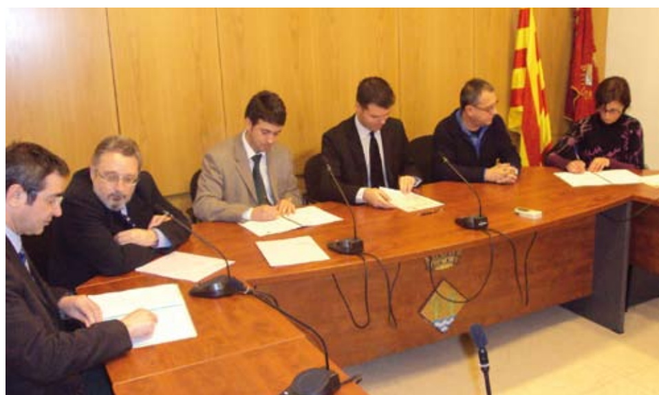
La signatura d'aquest conveni millorarà la protecció de la població

Atesa la rellevància del conveni, el Director de l'Agència de Protecció de la Salut es va desplaçar fins a Riudoms per signar-lo.