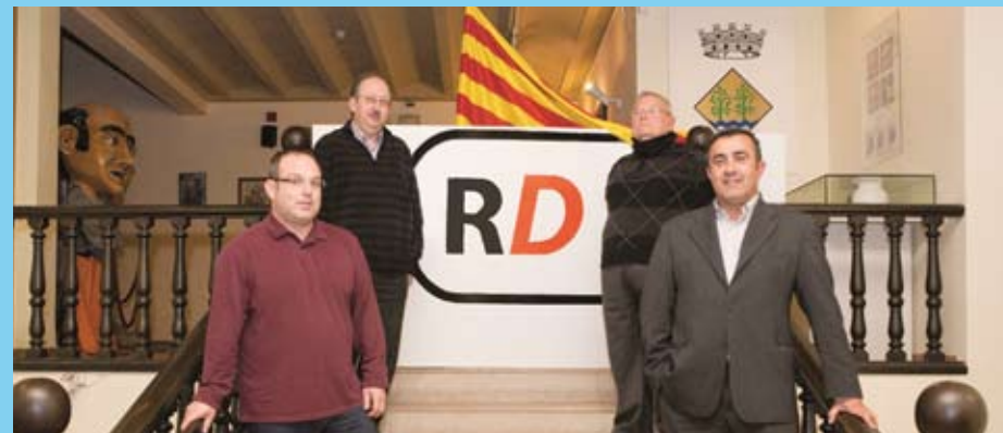
Els presidents locals de tots els grups polítics de Riudoms: CiU, ERC, PSC i PP donant suport a Riudoms Decideix