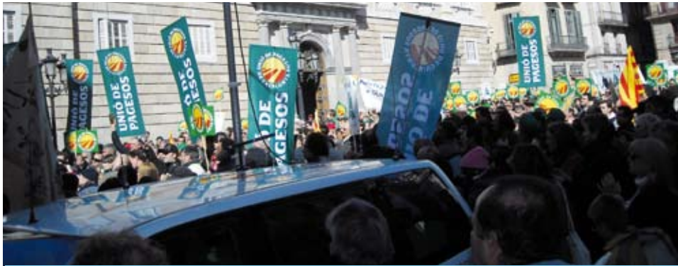
A la plaça de Sant Jaume de Barcelona es va sentir la veu del camp

Unió de Pagesos de Catalunya, amb el suport d'altres organitzacions agràries, va aplegar el dissabte 20 de febrer, més de 5.000 pagesos i pageses a Barcelona per reclamar mesures urgents al Govern català i central per fer front a una de les majors crisis del sector agrari. Durant els parlaments, davant el Palau de la Generalitat, els representants sindicals van demanar al Govern de Catalunya que prengui nota i abandoni l'actual indiferència i abandonisme envers la situació del sector i que continuaran les mobilitzacions.