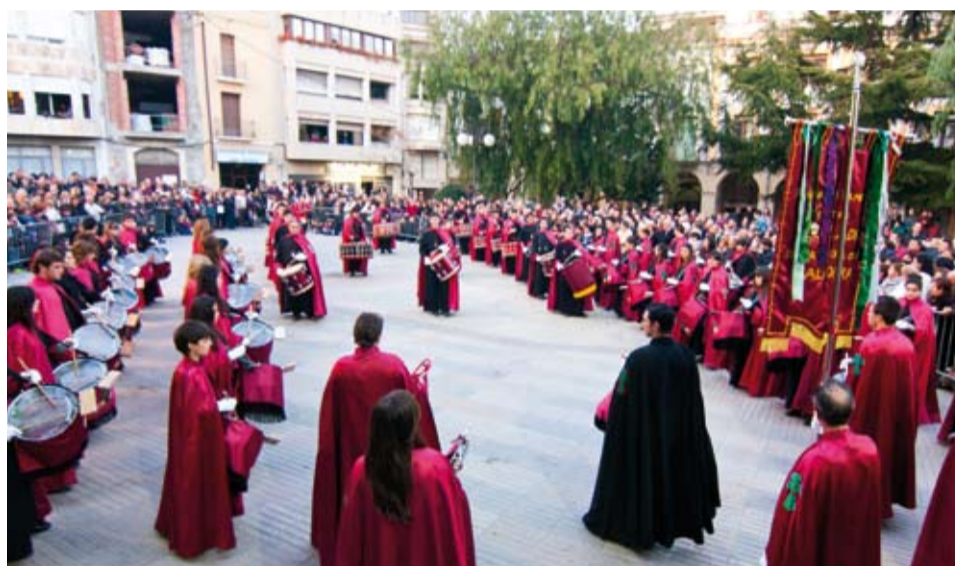
Banda de CCyTT de la Cofradía de la Santa Vera Cruz de Calahorra