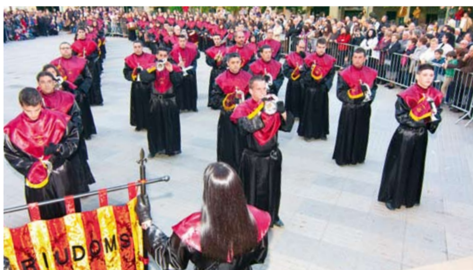
Banda de Cornetes i Timbals de la Confraria de Santa Llúcia