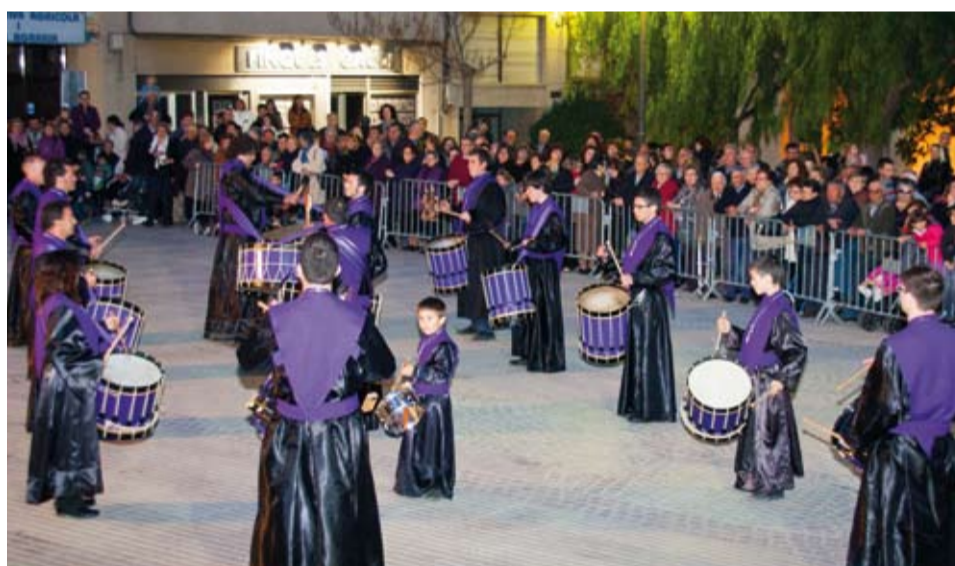
Banda del Pas del Sant Crist de Lepant de Valls