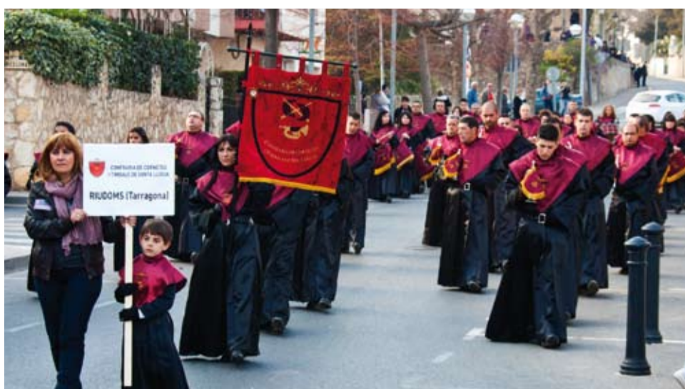
Els membres de la Banda de Riudoms van organitzar la trobada