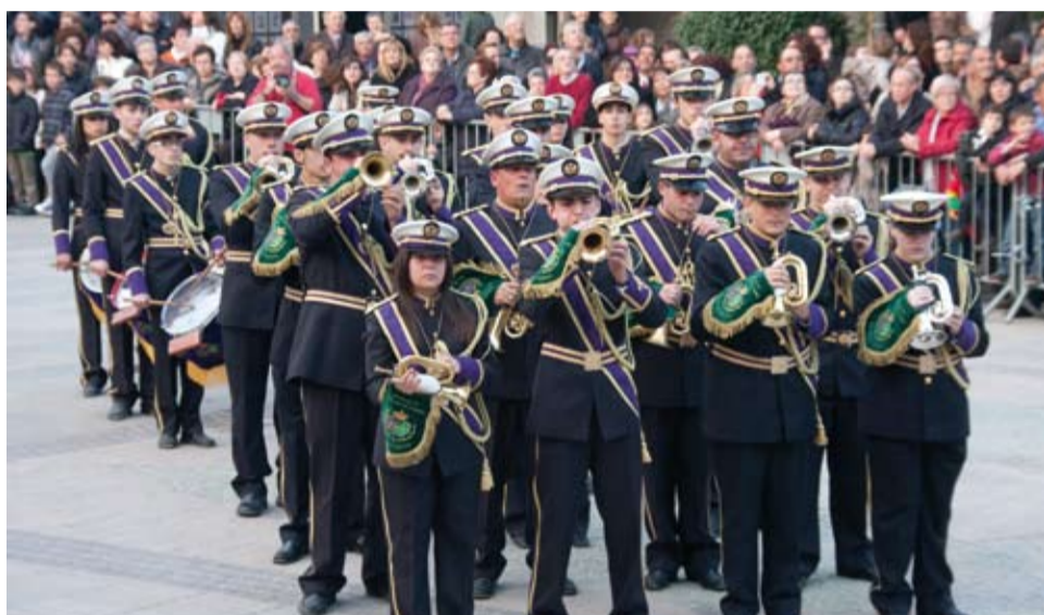
Banda de Jesús Nazareno y Ntra. Sra. de la Esperanza de Mataró