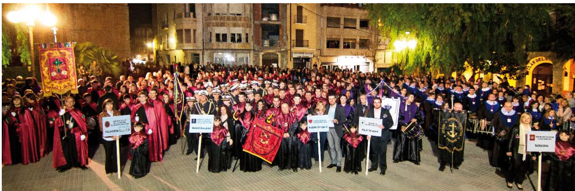
Les bandes de cornetes i timbals aplegar més de 400 músics i acompanyants, provinents de Calahorra, Mataró, Tarragona i Valls. Tots ells van ser perfectament acollits gràcies a l'esforç i implicació dels membres de la Banda de Cornetes i Timbals de Santa Llúcia de Riudoms.