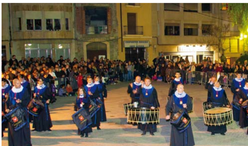
Banda del Sant Enterrament del Gremi de Marejants de Tarragona