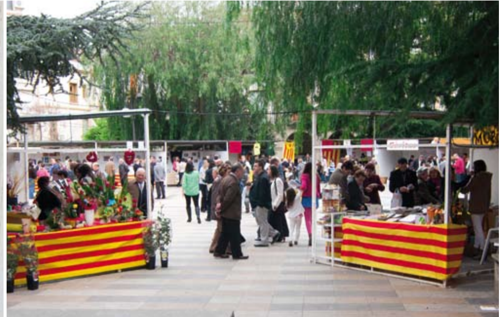
Per la Diada de Sant Jordi, la plaça de l'Església es converteix en el centre cultural i festiu de Riudoms. Els comerços ofereixen els seus productes lligats a aquesta festivitat i les diverses entitats i col·lectius aprofiten aquesta festa per a donar-se a conèixer.