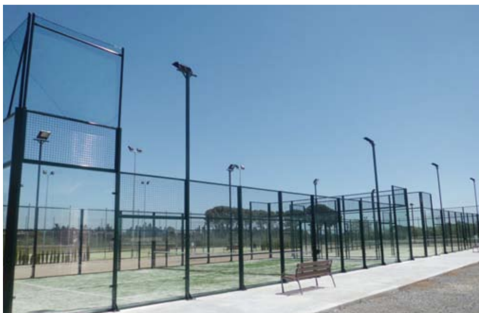
La segona pista de pàdel ja funciona a ple rendiment. El conjunt ofereix un millor servei a l'alta demanda d'aquesta instal·lació esportiva.

Finalment, aquesta actuació també contempla tota la senyalització vertical i horitzontal, així com unes bandes reductores prèvies al pas elevat.