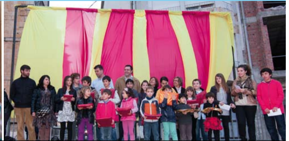
La primavera ens ofereix l'oportunitat de celebrar diverses festivitats a l'aire lliure, com ara Sant Jordi, Les Relíquies i Corpus. Aquestes festes ens permeten disfrutar d'actes tradicionals i festius que els donen sentit i continuïtat.