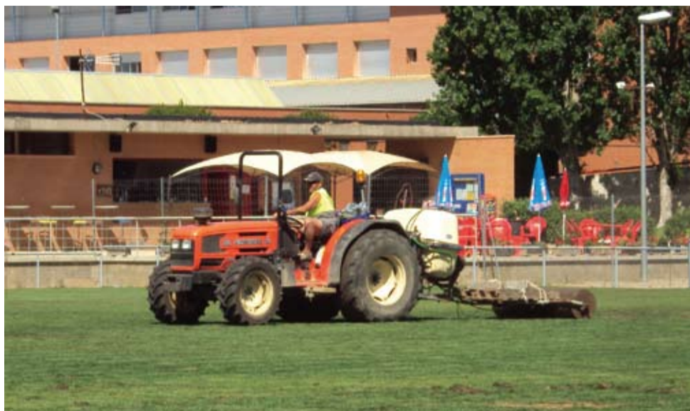
S'han fet tasques de sembra i manteniment als camps de futbol.