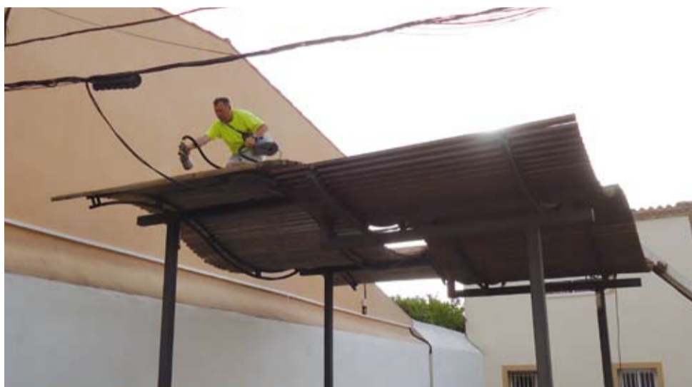
S'han restaurat els bancs i la pèrgola de la plaça del Barri Ferrant, així com la passarel·la de fusta de les restes romanes de La Mola.