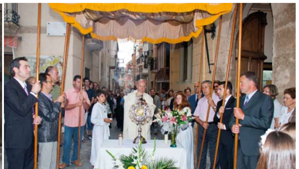
El veïnat de diversos carrers del centre de Riudoms dissenyen catifes amb motius florals per la festivitat de Corpus Christi.