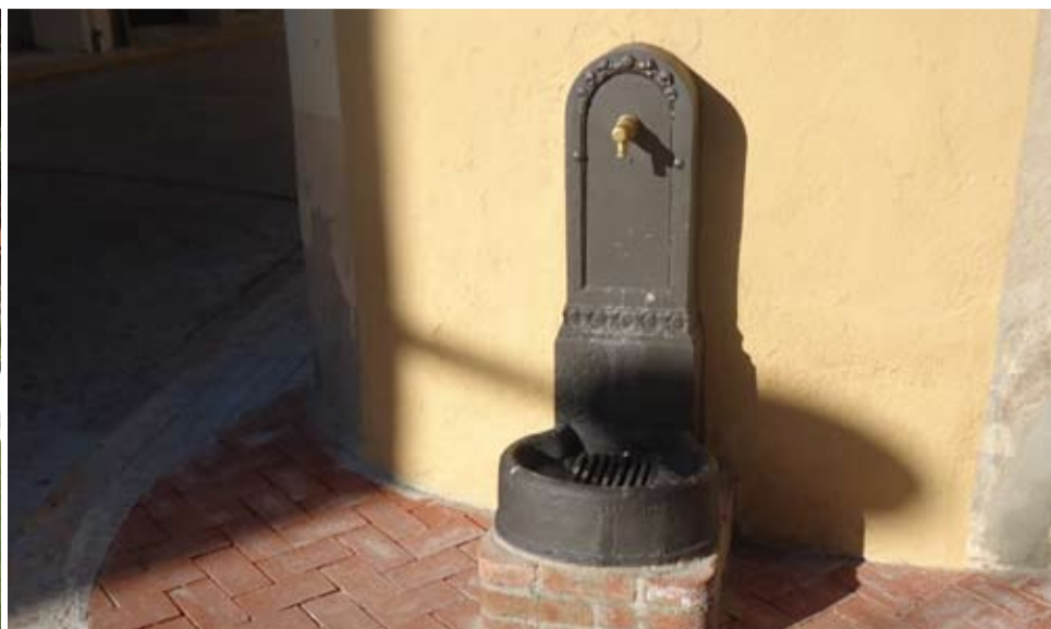
L'antiga font pública del carrer de Sant Pau s'ha remodelat.