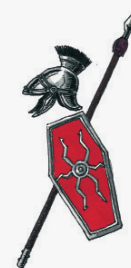
ARMATS DE RIUDOMS