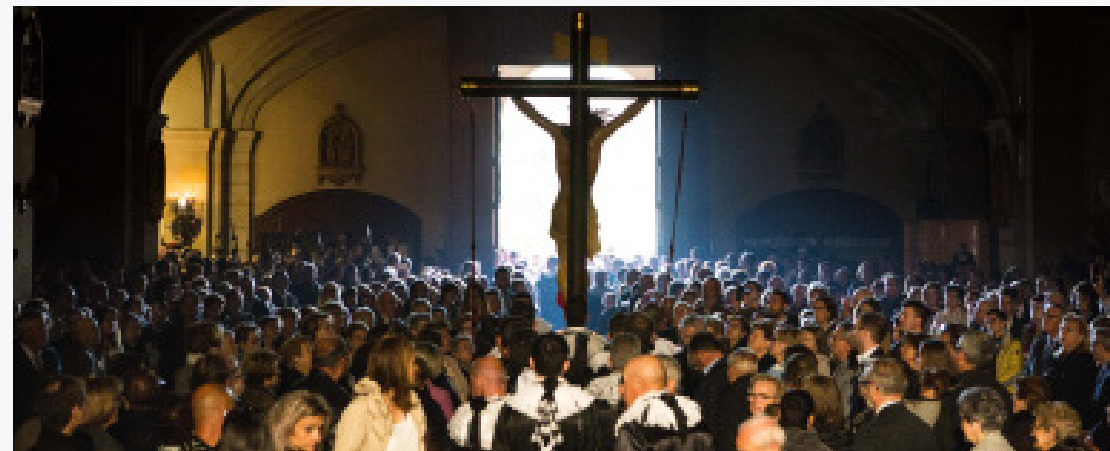
Setmana Santa 2019, Riudoms, arxiu històric Municipal, foto: Alba Mariné.