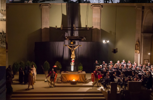
< Millor col·lecció fotogràfica del concurs “La Setmana Santa de Riudoms 2019”.