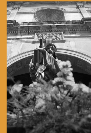
^ Millor fotografia del concurs “La Setmana Santa de Riudoms 2019”.

PARTICIPA FINS AL 30 DE JUNY veure bases a www.riudoms.cat