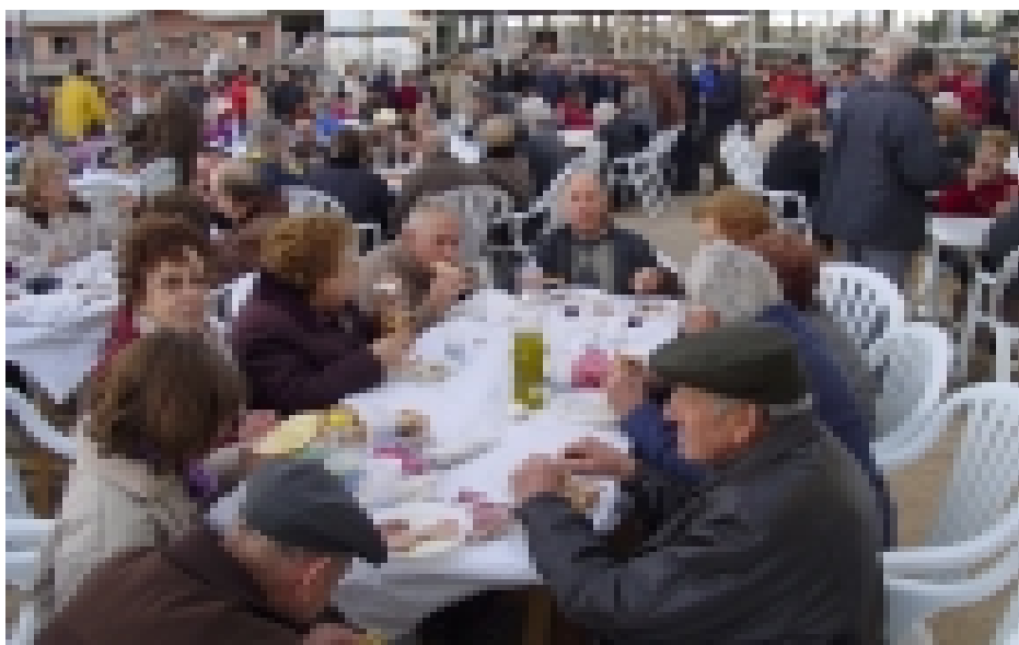
Els veïns de Riudoms van respondre multitudinàriament a la festa organitzada per la Cooperativa.

Relacionat amb aquest tema, el CERAP ofereix aquests mesos de gener i febrer un «Curs de valoració dels productes de la nostra terra» en el que hi haurà, entre d'altres, dues sessions d'iniciació al tast d'oli d'oliva verge per a qui estigui interessat en conèixer millor el món dels olis verges d'oliva.