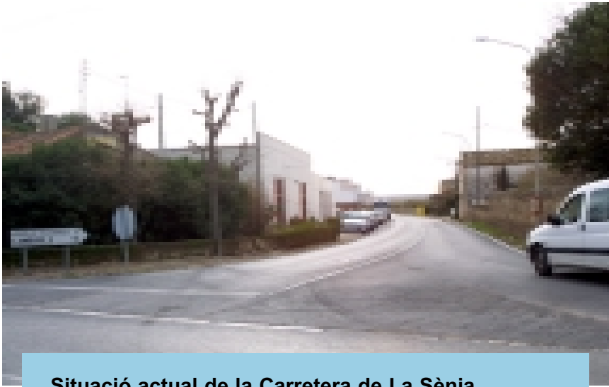
Situació actual de la Carretera de La Sènia.