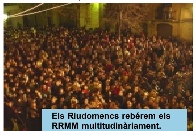
Els Riudomencs rebérem els RRMM multitudinàriament.

que anuncien novetats de cara a la cavalcada de l'any vinent, en què tornarà a arribar la màgia per als més petits.