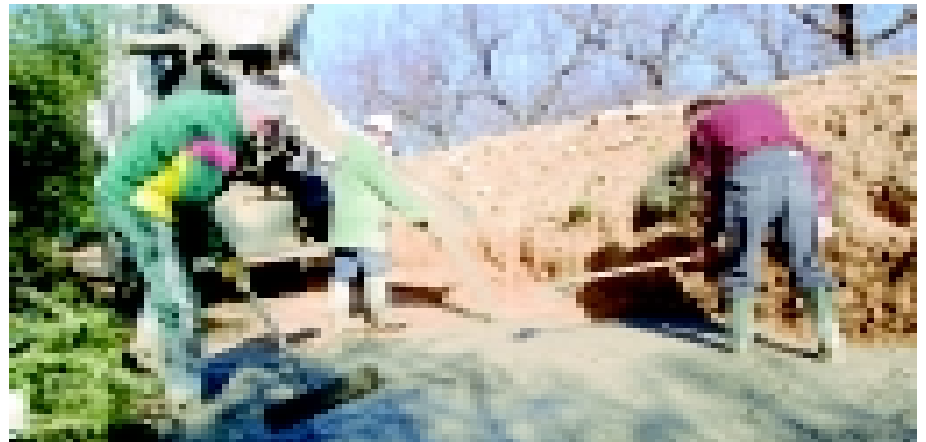
La brigada de l'Ajuntament fent els treballs de pavimentació.

Pel que fa a la realització de l'obra, aquesta l'ha fet la Brigada municipal i s'ha finançat amb les quotes del veïns, una subvenció del Consell Comarcal i una aportació de l'Ajuntament de Riudoms del 20% del cost.