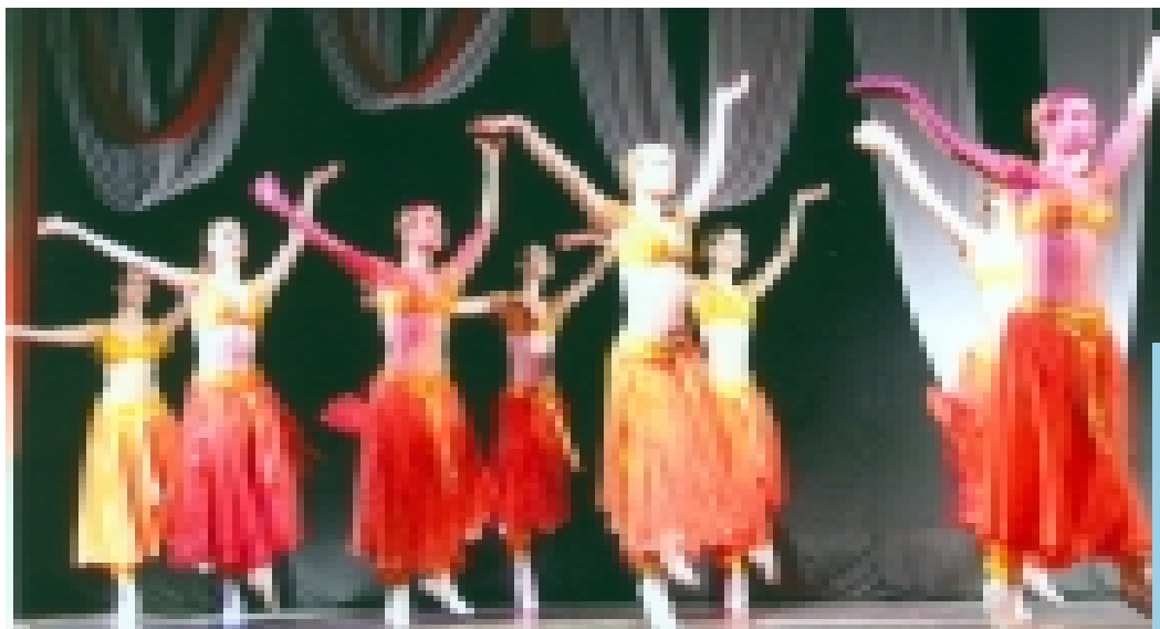
L'actuació de la Companyia Bolsoy-Kiev de Moscú va ser un dels actes centrals dels festivals.

Les Regidories de Cultura i de Festes de l'Ajuntament de Riudoms van programar sota el nom de Festivals de Nadal 2003 una sèrie d'actes festius, culturals i tradicionals per aquestes festes. Els actes més destacats van ser, sens dubte, el Parc Infantil de Nadal, la representació de «l'Estel de Natzaret», l'espectacle de dansa de la Companyia Bolsoy-Kiev de Moscú i la Cavalcada de Reis. Més de 2.500 persones (sense contar els assistents a la cavalcada de reis) van participar en les diferents activitats englobades sota els Festivals de Nadal 2003.