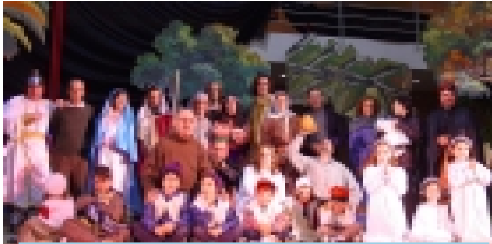
Els membres de la companyia van satisfer el nombrós públic assistent, el qual els animà per a tornar-hi el pròxim Nadal.