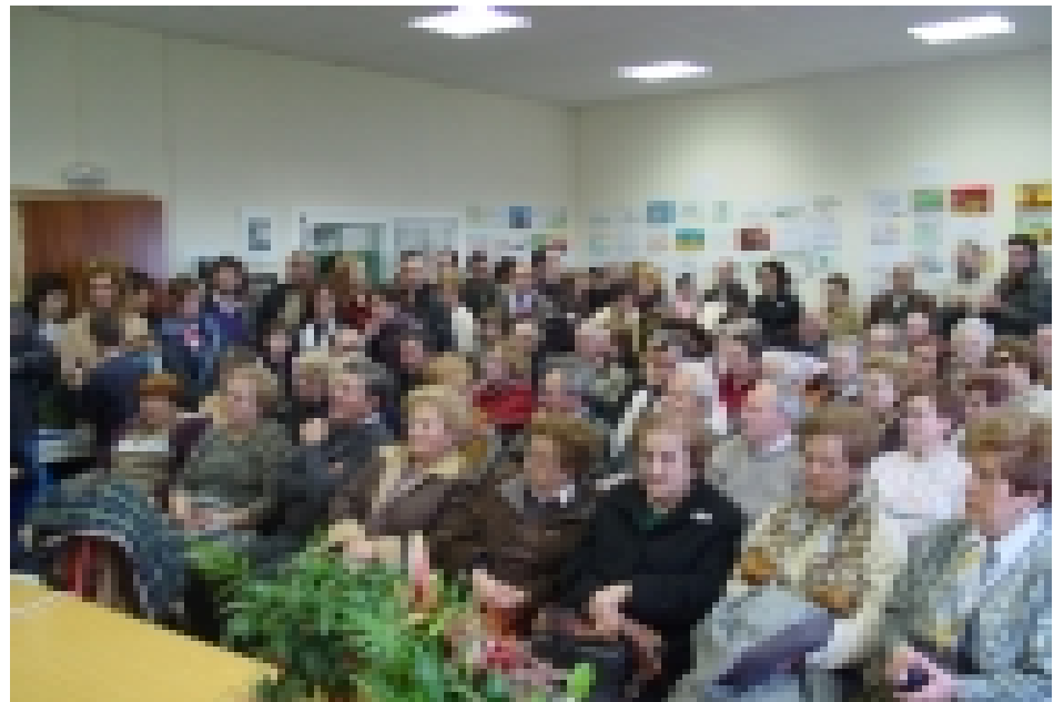
La Sala d'Actes de la Cooperativa plena de gom a gom durant la celebració de les xerrades tècniques.

La sala d'actes es va tornar a omplir pel lliurament d'aquests premis.