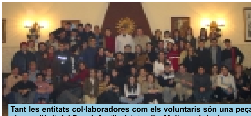
Tant les entitats col·laboradores com els voluntaris són una peça clau en l'èxit del Parc Infantil. A tots ells, Moltes gràcies!

El primer dia en horari de tarda i el segon al matí i a la tarda, el Pavelló Municipal d'Esports va presenciar un bon nombre d'atraccions, tallers, jocs i activitats diverses. Per exemple, els nens i nenes de seguida es senten atrets pels inflables i els tallers (de calendaris, collarets i pulseres, imants per la nevera, música, danses...). Pels de