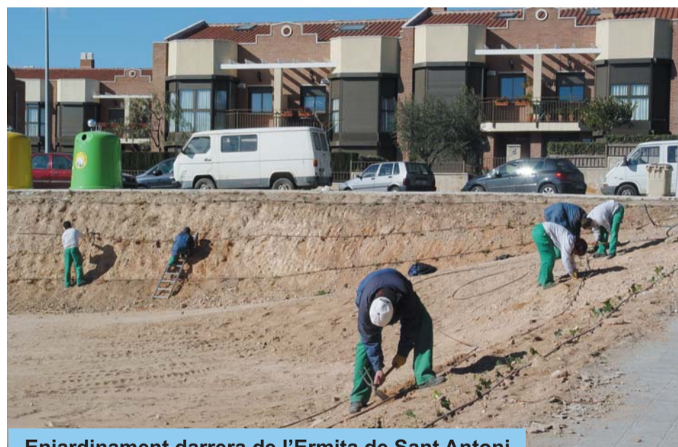
Enjardinament darrera de l'Ermita de Sant Antoni.

muntatge dels elements de fusta de les noves carrosses de Ses Majestats els Reis Mags d'Orient.