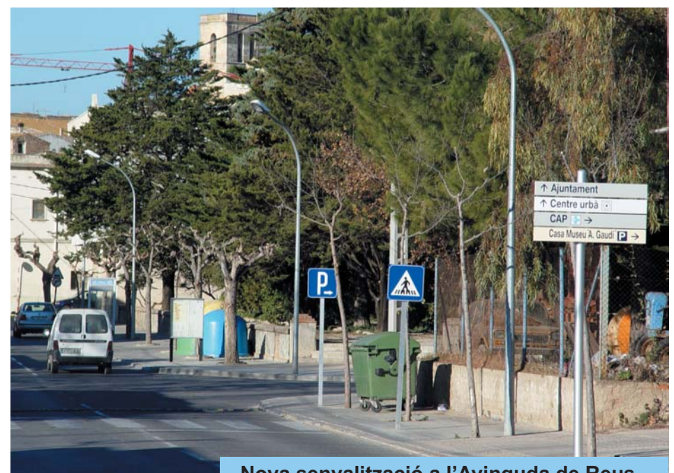
Nova senyalització a l'Avinguda de Reus.

Aquestes darreres setmanes s'han instal·lat un gran nombre d'elements informatius per tot el poble. Aquesta important inversió econòmica implicarà una substancial millora en la informació visual per a tots aquells visitants de Riudoms que no coneguin en detall els carrers del poble. A partir d'ara, trobar la Casa Gaudí, el pavelló, el Centre d'Assistència Primària, o l'Ajuntament, entre d'altres, serà molt més fàcil.