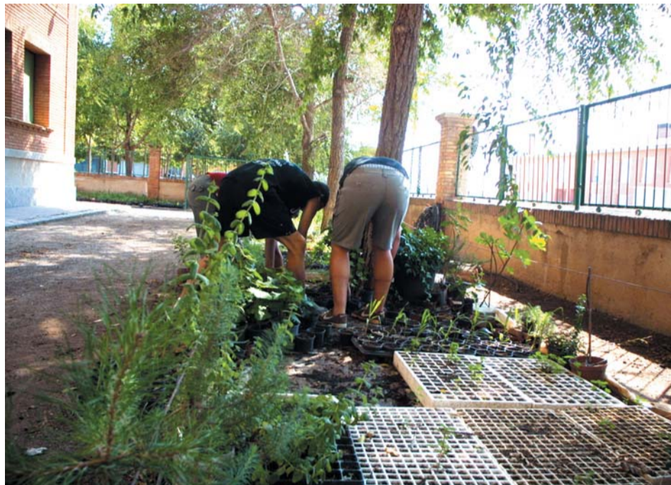
Un grup d'alumnes del Taller d'Ocupació preparant les plantes destinades a enjardinar diferents zones del poble.

Aquestes darreres festes de Nadal, els alumnes han col·laborat en la instal·lació de l'ambientació lumínica dels carrers, i en el