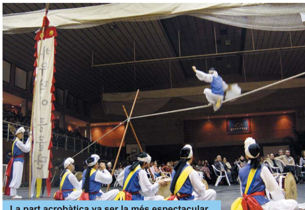
La part acrobàtica va ser la més espectacular.