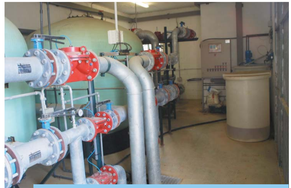
Planta potabilitzadora d'aigua del Pantà de Riudecanyes.

Seguint aquesta política, està garantit per molts anys el flux d'aigua, l'energia vital del poble.