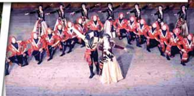
COMPANYIA ESTATAL DEL CAUCAS (Juliol 2005, Reviu les places)