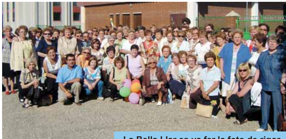
La Bella Llar es va fer la foto de rigor.