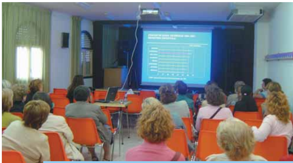
Dins del Cicle de Xerrades d'Educació Sanitària, aquesta ha estat la que més assistència va tindre.

La xerrada va comptar amb una notable assistència de públic femení que van escoltar totes les explicacions que va donar la doctora, i que al final van poder fer totes aquelles preguntes per tal d'estar més informades.