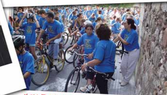
XIV BICICLETADA POPULAR (Juliol 2005, Festa Major de Sant Jaume)