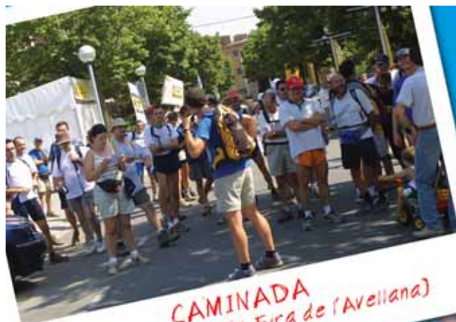
CAMINADA (Agost 2005, 25a. Fira de l'Avellana)