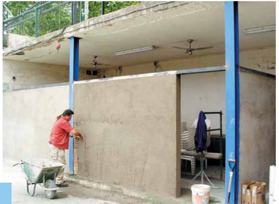
Obres de millora a les instal·lacions de la piscina municipal.

Aprofitant l'ocasió també s'ha fet una actuació important a nivell de jardineria i electricitat. Els veïns que us acosteu a la piscina podreu veure com aquest any s'han instal·lat uns llums aquàtics que donaran un aspecte visual diferent durant les nits d'estiu.