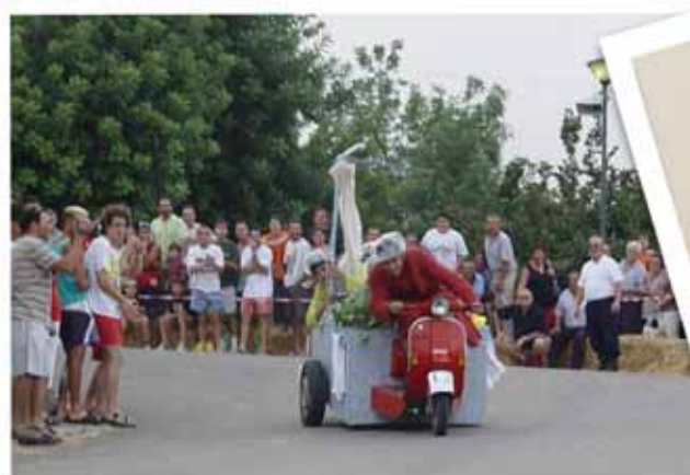
II BAIXADA D'ORNIS