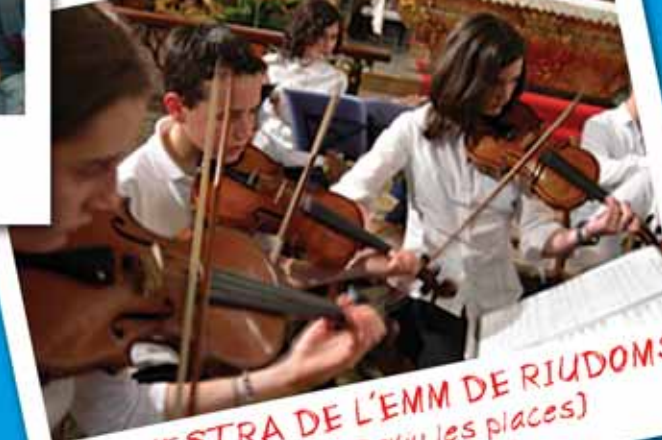
ORQUESTRA DE L'EMM DE RIUDOMS (Reviu les places)