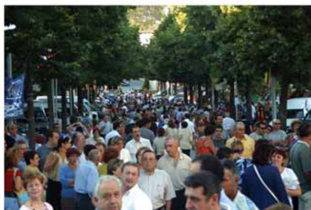
FIRA DE L'AVELLANA (Agost 2005, 25a. Fira de l'Avellana)