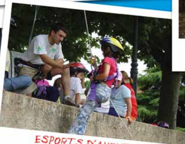
ESPORTS D'AVENTURA (Juliol 2005, Escola de Lleure)