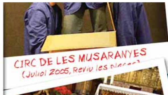
CIRC DE LES MUSARANYES (Juliol 2005, Reviu les places)