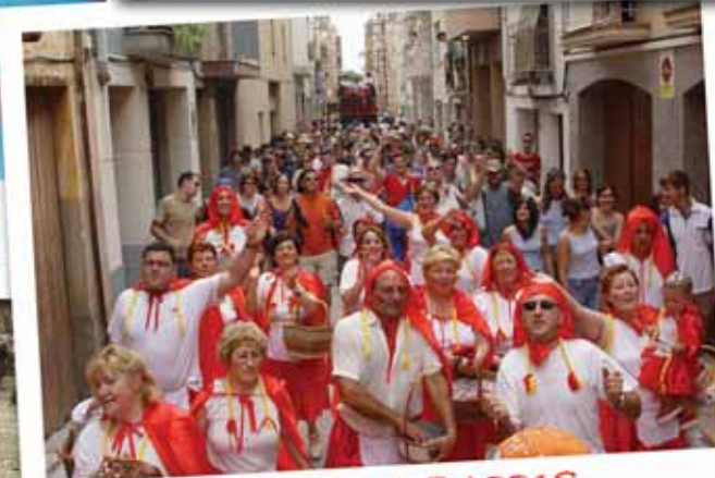
FESTA DE BARRIS (Juliol 2005)