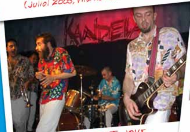
CONCERT JOVE (Juliol 2005, Festa Major de Sant Jaume)