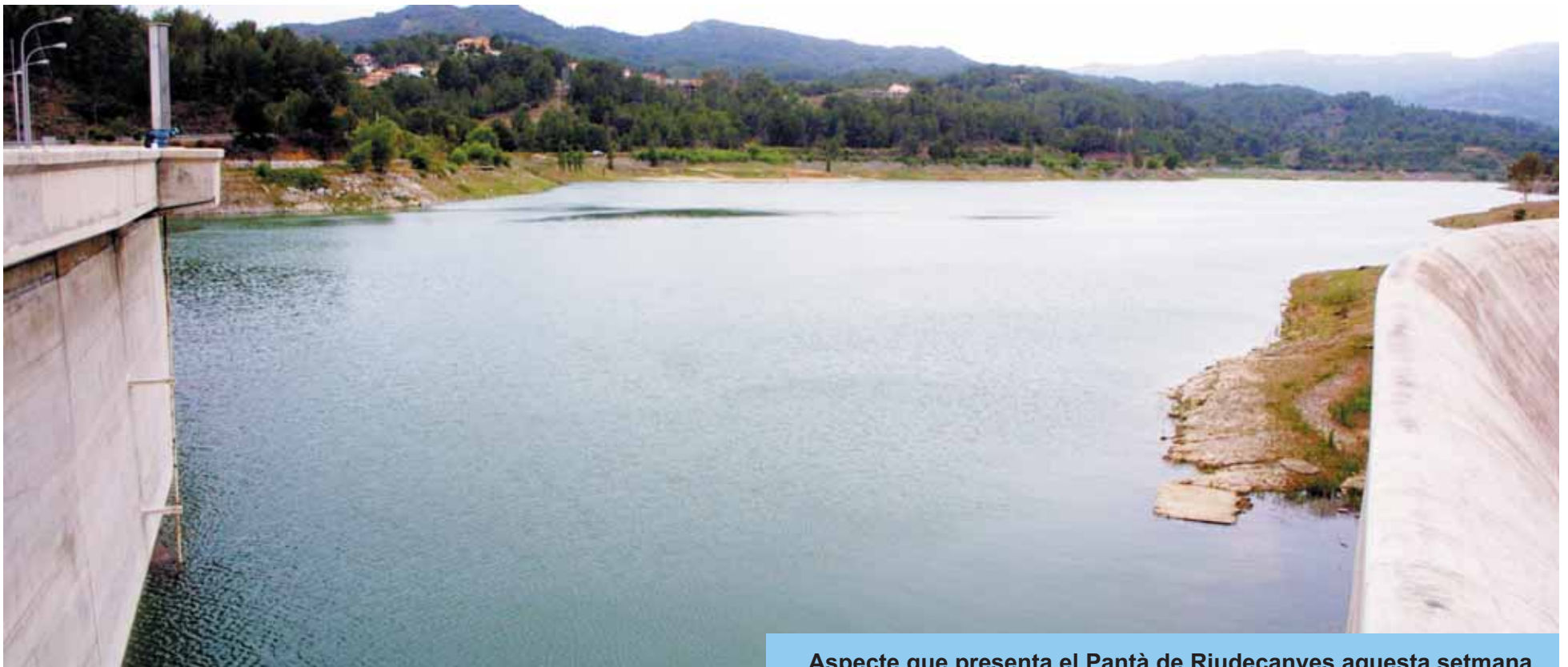
Aspecte que presenta el Pantà de Riudecanyes aquesta setmana.

Fa mesos que les pluges són molt inferiors al que és habitual. Això s'ha reflexat en la quantitat d'aigua emmagatzemada en els diferents embassaments del nostre país. Les dues fotografies d'aquesta portada il·lustren la diferència entre l'aigua que aquest any té emmagatzemada el Pantà de Riudecanyes i la que hi havia l'any passat.