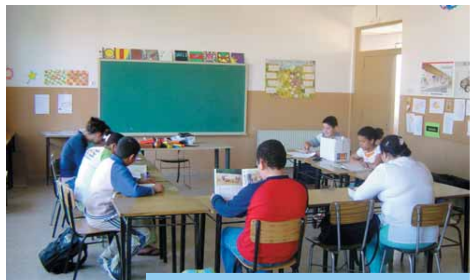
Moment durant les classes del Centre Obert.

Les activitats que es realitzen són berenar, activitats escolars de reforç i/o ajudar a fer els deures (en coordinació amb els centres d'ensenyament), jocs i tallers, i altres (sortides, excursions, teatre, vídeo.....).