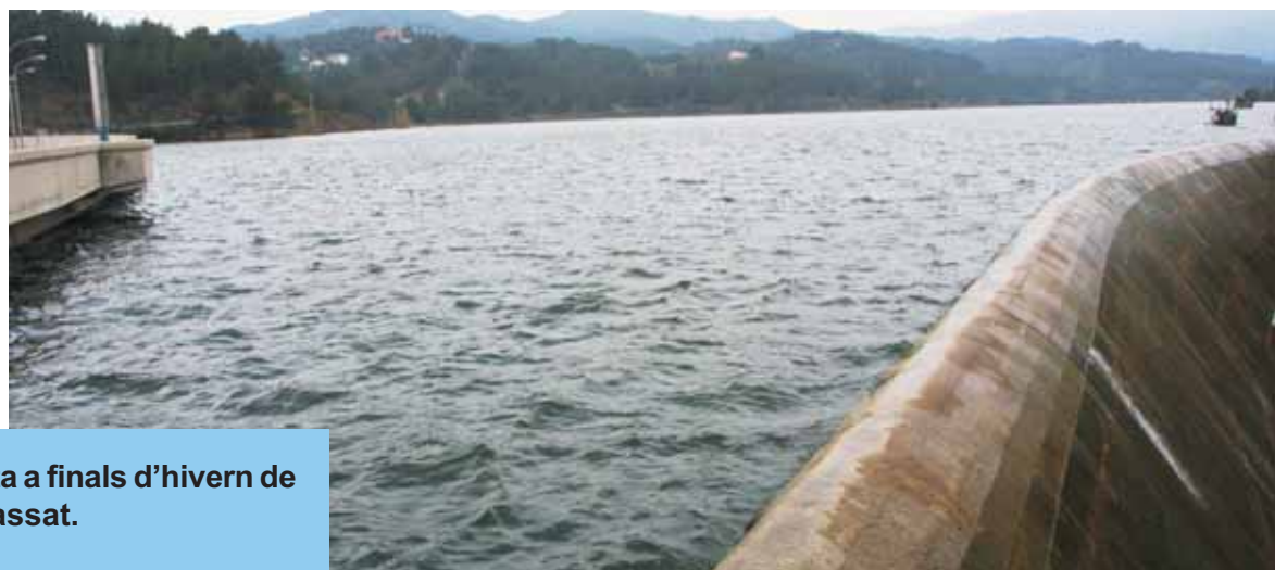
Foto feta a finals d'hivern de l'any passat.

Fa mesos que les pluges són molt inferiors al que és habitual. Això s'ha reflexat en la quantitat d'aigua emmagatzemada en els diferents embassaments del nostre país. Les dues fotografies d'aquesta portada il·lustren la diferència entre l'aigua que aquest any té emmagatzemada el Pantà de Riudecanyes i la que hi havia l'any passat.