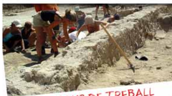
CAMP DE TREBALL (Juliol 2005, Vila Romana de la Mola)