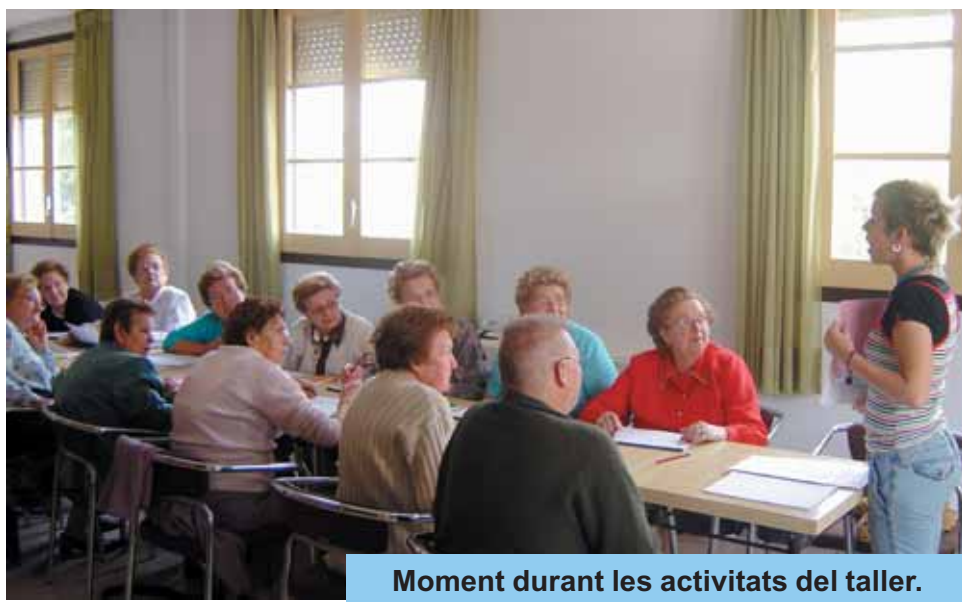
Moment durant les activitats del taller.

El Taller ha estat realitzat per una educadora social del Consell Comarcal del Baix Camp, en horari de matí, els dimecres del mes de maig i el primer de juny a la Llar de Jubilats de Riudoms. Al curs hi han assistit 15 persones. Atesa la molta demanda, es va tenir de realitzar una selecció.