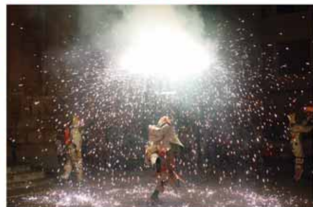
CORREFOC (Juliol 2005, Festa Major de Sant Jaume)