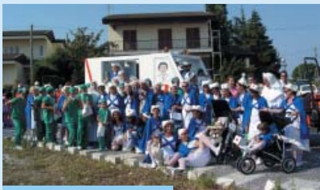
Barri Molí d'en Marc.