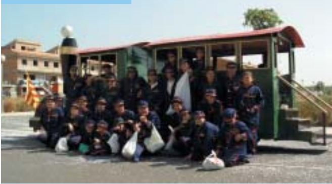
Barri del Raval.