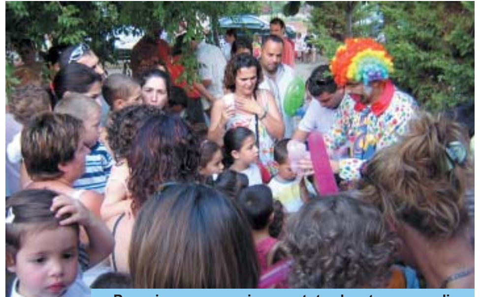
Pares i mares, nens i nenes, tots plegats van gaudir de les festes de final de curs.

divendres 1 de juliol. Tots els pares i infants van estar-hi convidats. Durant la setmana s'havien repartit «les notes» i mentre els pares en parlaven amb les educadores, el pallasso Raül, va distreure l'acte. Els més de cent nens i nenes, tot i l'espera, van poder marxar amb el seu record de la festa.