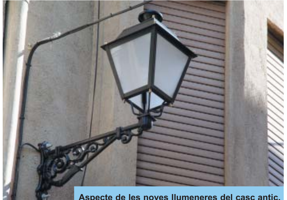
Aspecte de les noves llumeneres del casc antic.

Aquestes millores representen la continuació de la feina feta anteriorment a l'Avinguda Josep M. Sentís, Plaça de la Palmera, Plaça dels Gegants,