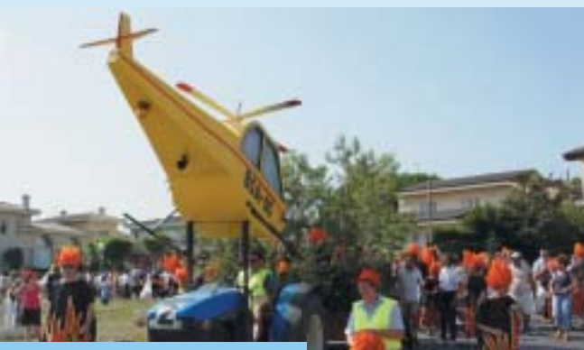
Barri de Sant Antoni.