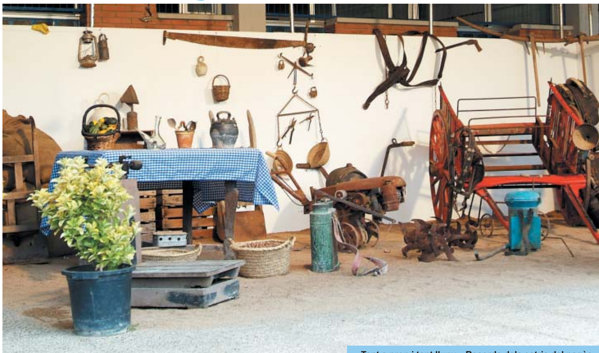
Tant a prop i tant lluny... Records dels estris del pagès.