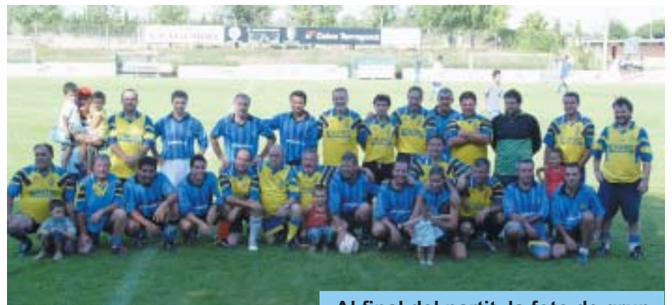
Al final del partit, la foto de grup.

A les dotze del migdia a la Cooperativa Agrícola, Unió de Pagesos va fer la xerrada «El paper dels espais agraris en àrees de forta pressió urbana», que va tancar les Jornades Tècniques de formació agrícola que cada any tenen lloc en el marc de la Fira de l'Avellana. A continuació es van lliurar els guardons del 7è concurs del conreu de l'avellaner.