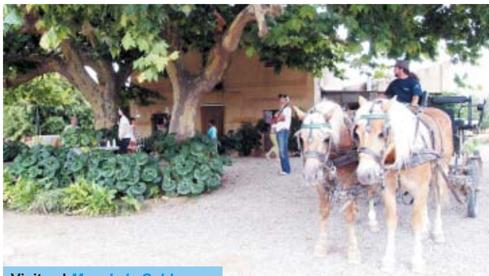
Visita al Mas de la Calderera.

A partir de les set de la tarda, els visitants més menuts van poder fer una petita passejada amb ponis pel pati de les Escoles Velles.