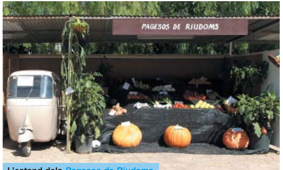
L'estand dels Pagesos de Riudoms.

La jornada festiva va continuar molt animada amb una cercavila i una posterior actuació castellera, amb els Xiquets de Reus que van completar el 5 de 7, el 3 de 7, el 2 de 6 i un pilar de 5.