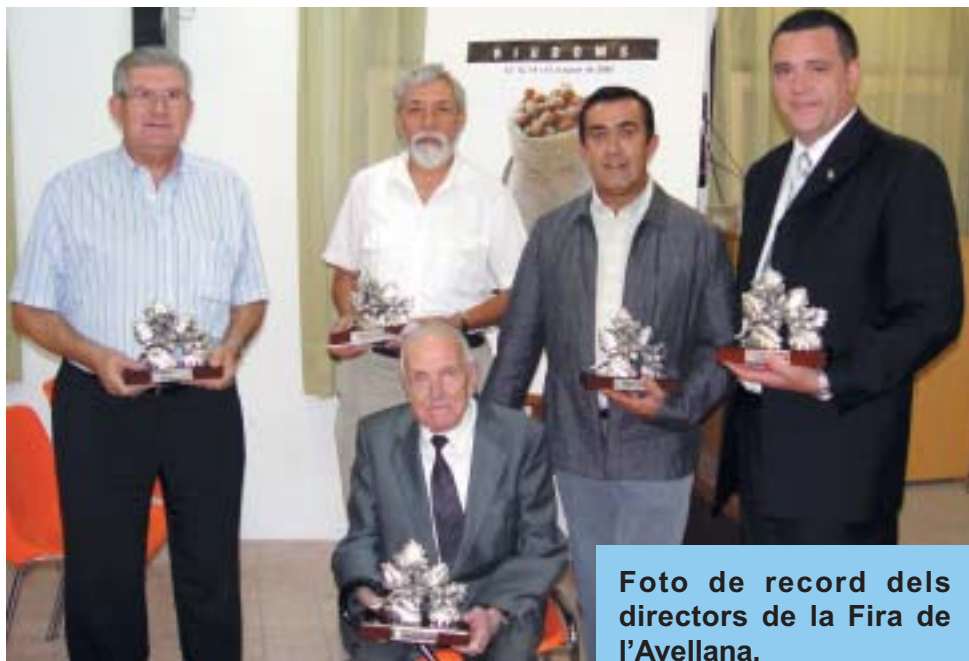
Foto de record dels directors de la Fira de l'Avellana.