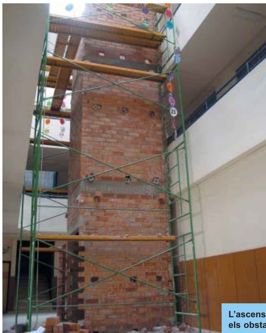
L'ascensor eliminarà tots els obstacles.