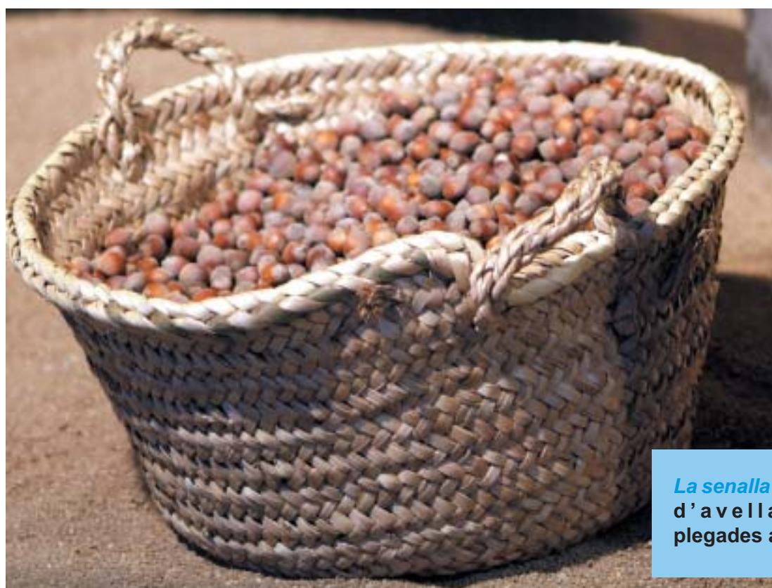
La senalla plena d'avellanes plegades a mà.