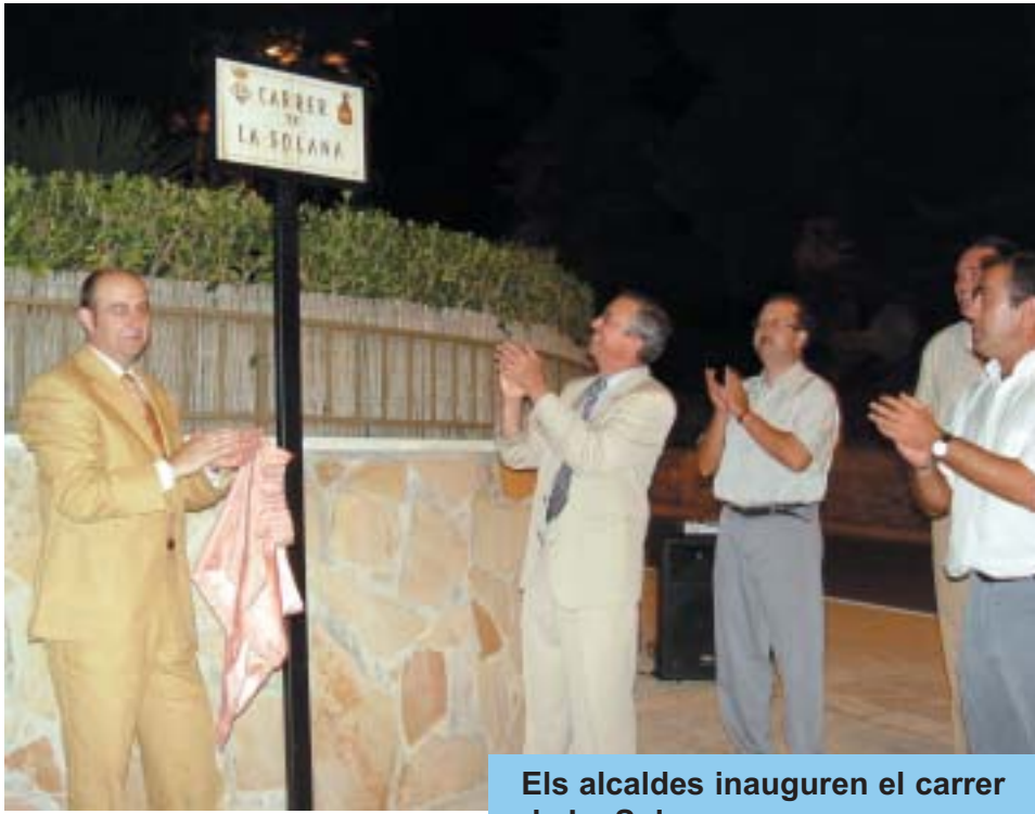
Els alcaldes inauguren el carrer de La Solana.