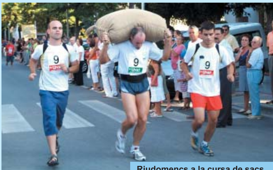
Riudomencs a la cursa de sacs.