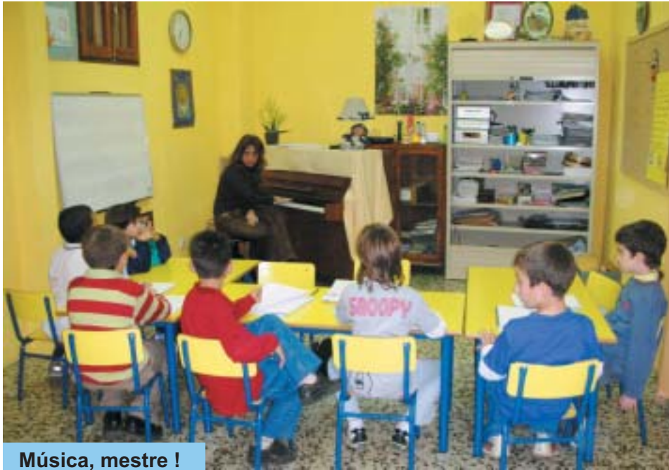
Música, mestre !

Anunciar-vos la posada en funcionament de la nova Escola Municipal de Música. Des de d'aquí us volem convidar a la inauguració de les noves dependències que tindrà lloc durant les properes Festes del Beat.