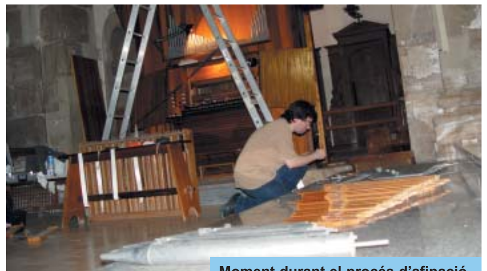
Moment durant el procés d'afinació.