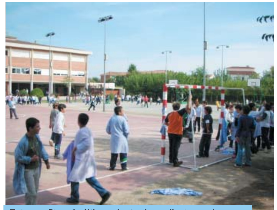
Tots aprofiten els últims minuts abans d'entrar a classe.

Respecte el curs passat cal felicitar-se pels bons resultats obtinguts en les Olimpíades Escolars, en les quals hi van participar un total de