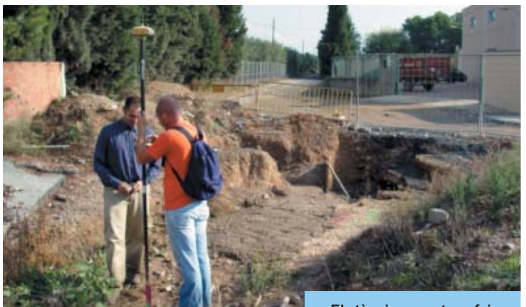
Els tècnics anant per feina.

L'adjudicació es va fer per un import de 207.408, 03 euros a l'empresa Agrovial, SA . El termini per a l'execució del contracte és de tres mesos, a comptar des de l'endemà de la data d'aprovació per part de l'Ajuntament del Pla de Seguretat i Salut en el Treball i amb l'arribada del nou any quedarà definitivament resolta l'arribada del Barranc del Molí de Vent a l'actual nucli urbà.