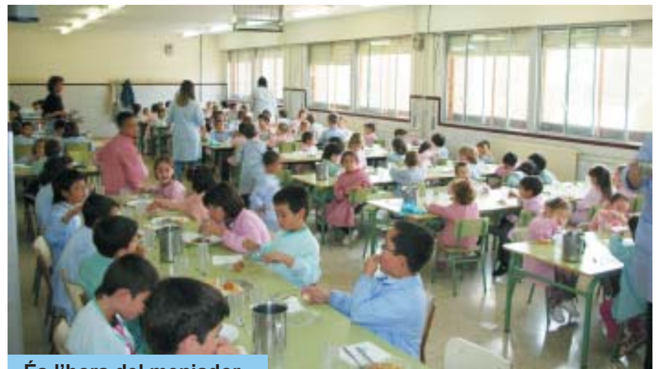
És l'hora del menjador.

S'ha incorporat la figura de la vetlladora i s'ha concertat amb l'Institut Català de la Salut l'assistència al centre d'una infermera durant 2h a la setmana per tal de tractar diferents problemes que puguin sorgir entre els alumnes.