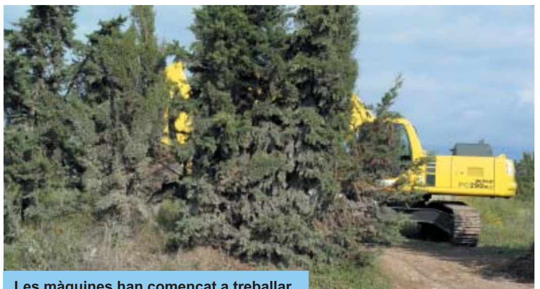
Les màquines han començat a treballar.