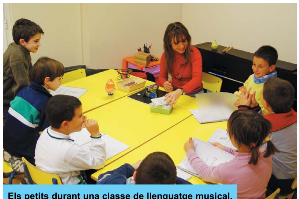
Els petits durant una classe de llenguatge musical.

Aquesta nova seu ha tingut un cost aproximat de 718.000 euros (66.000 dels quals a càrrec de la Diputació de Tarragona, 178.000 a càrrec de la Generalitat de Catalunya i els 474.000 restants a càrrec de l'Ajuntament de Riudoms). Aquest equipament s'afegeix i incrementa l'oferta social i educativa riudomenca. L'Escola Municipal de Música de Riudoms té aquest curs 173 alumnes de Riudoms i la comarca del Baix Camp i hi imparteixen classe 15 professores i professors.