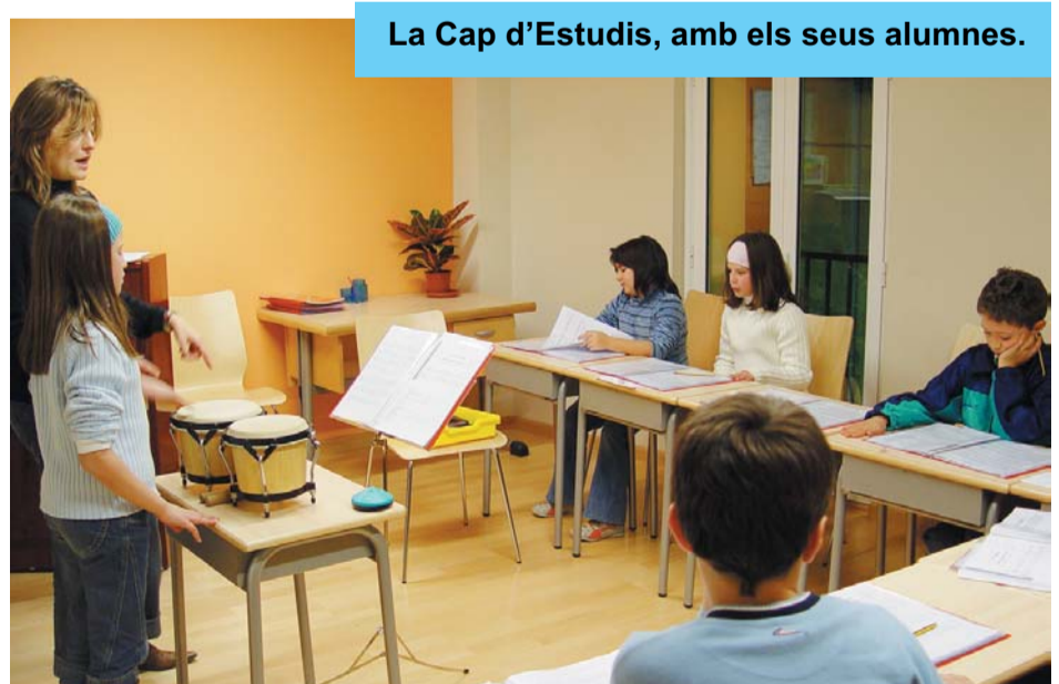
La Cap d'Estudis, amb els seus alumnes.

26 de desembre, durant tot el matí, jornada de portes obertes a l'Escola Municipal de Música