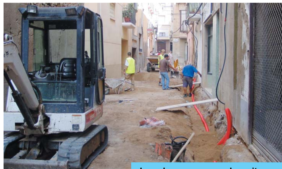
Les obres avancen a bon ritme.

El termini d'execució d'aquestes obres estava programat en sis mesos, de manera que a finals de gener quedarà ben poca feina per fer.