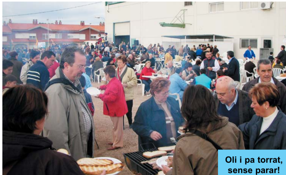
Oli i pa torrat, sense parar!

Qui va voler, va poder adquirir aquesta meravella d'oli, que la nostra cultura mediterrània tant sap apreciar, com és l'oli acabat de premsar.