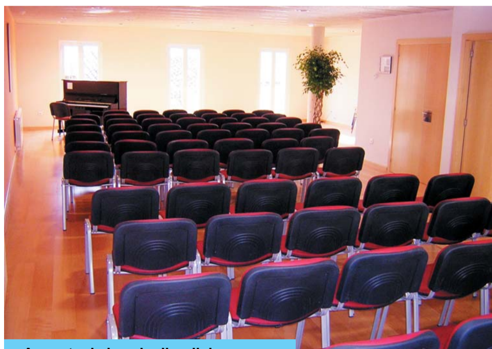
Aspecte de la sala d'audicions.