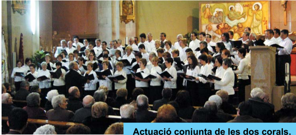
Actuació conjunta de les dos corals.

El darrer cap de setmana del mes de novembre ha estat nodrit d'actes amb motiu de les Festes del Beat, que com cada any, són festes per honorar el fill il·lustre de Riudoms, el Beat Bonaventura Gran. En l'àmbit religiós, s'han dut a terme les misses, novena, la Processó de Fanalets acompanyant el Reliquiari Major del Beat, el dia 20 al vespre, i la Solemne Processó presidida per l'urna del Beat el dissabte 26.