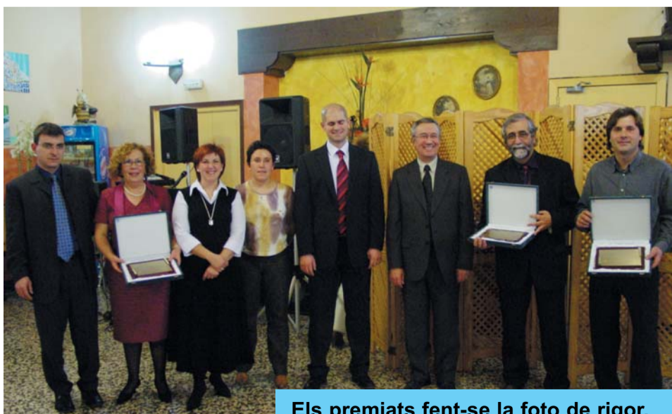
Els premiats fent-se la foto de rigor.