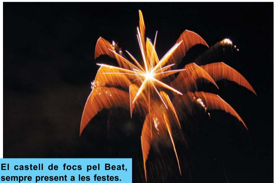
El castell de focs pel Beat, sempre present a les festes.