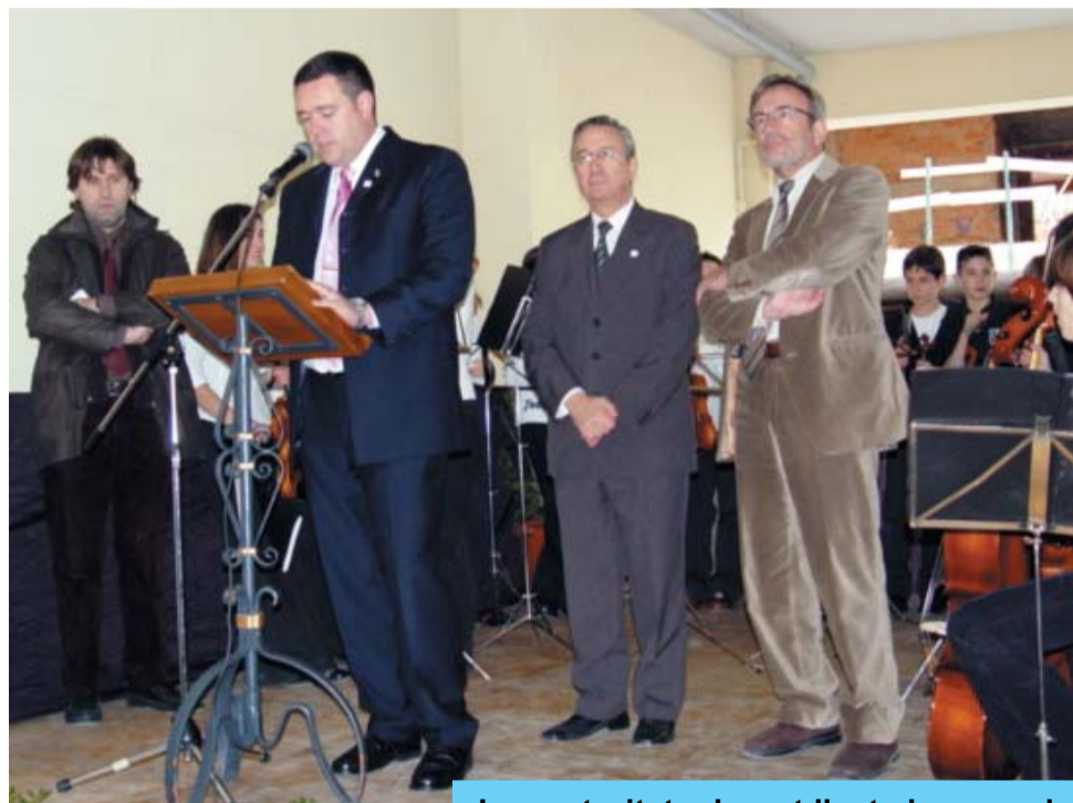
Les autoritats durant l'acte inaugural.