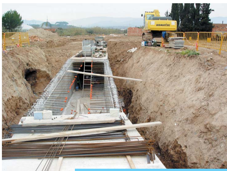
Estat actual de les obres d'endagament.

Està previst que en breu període de temps l'aigua de pluja ja passi per la nova llera i que l'obra estigui acabada a finals de gener.