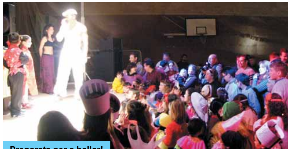
Preparats per a ballar!

A la Casa de Cultura, el Dimarts de Dol, es va col·locar la capella ardent del Rei Carnestoltes. Un Rei que després de la Rua Mortuòria pels carrers del poble i acompanyat d'un estol de vídues desconsolades, va ser cremat a la plaça de l'església. Aquest moment, sempre va ser amenitzat per una xaranga i pel repartiment de moscatell i pastes pels més grans i d'una llaminadura pels més petits.