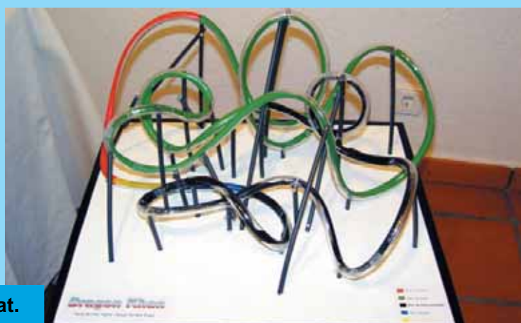
Treball de recerca exposat l'any passat.

L'alumnat de segon de Batxillerat de l'IES Joan Guinjoan i Gispert, el proper 10 de març a les 6h de la tarda i a la Casa de Cultura d'Antoni Gaudí presentarà i exposarà els seus treballs de recerca que han estat elaborant durant el curs 2005-2006.