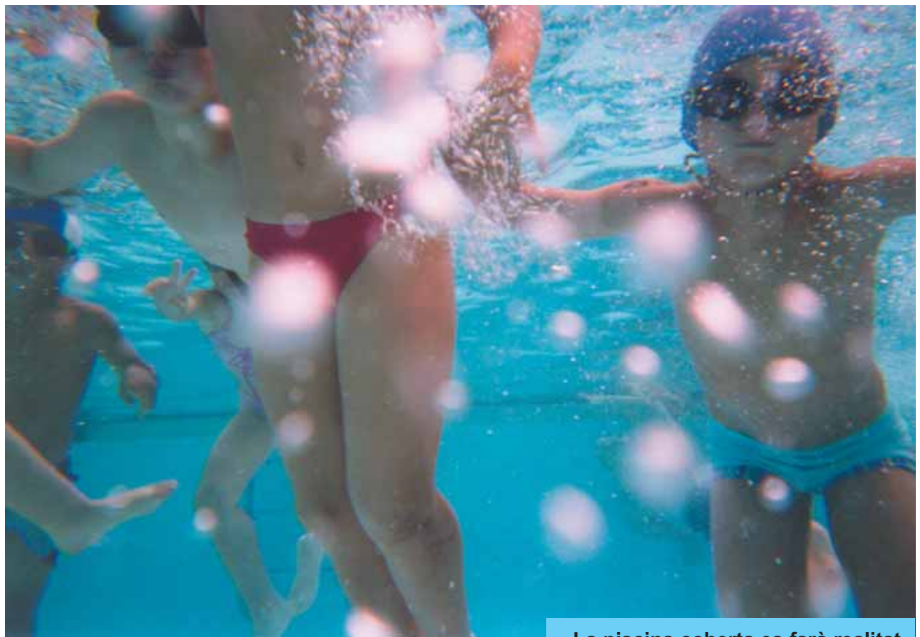
La piscina coberta es farà realitat.

Ara s'encomanarà el projecte constructiu i un rigorós estudi de gestió i seguidament l'Ajuntament iniciarà les obres de la nova piscina coberta.