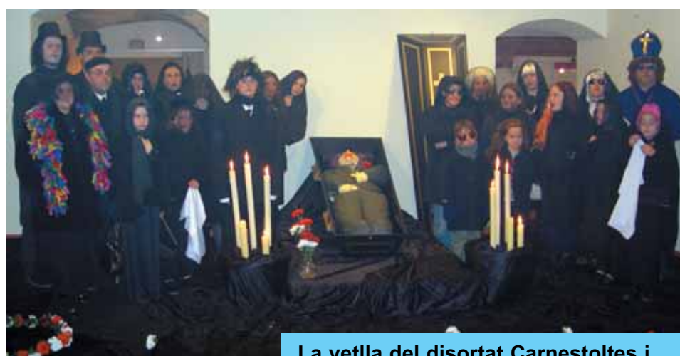
La vetlla del disortat Carnestoltes i ...