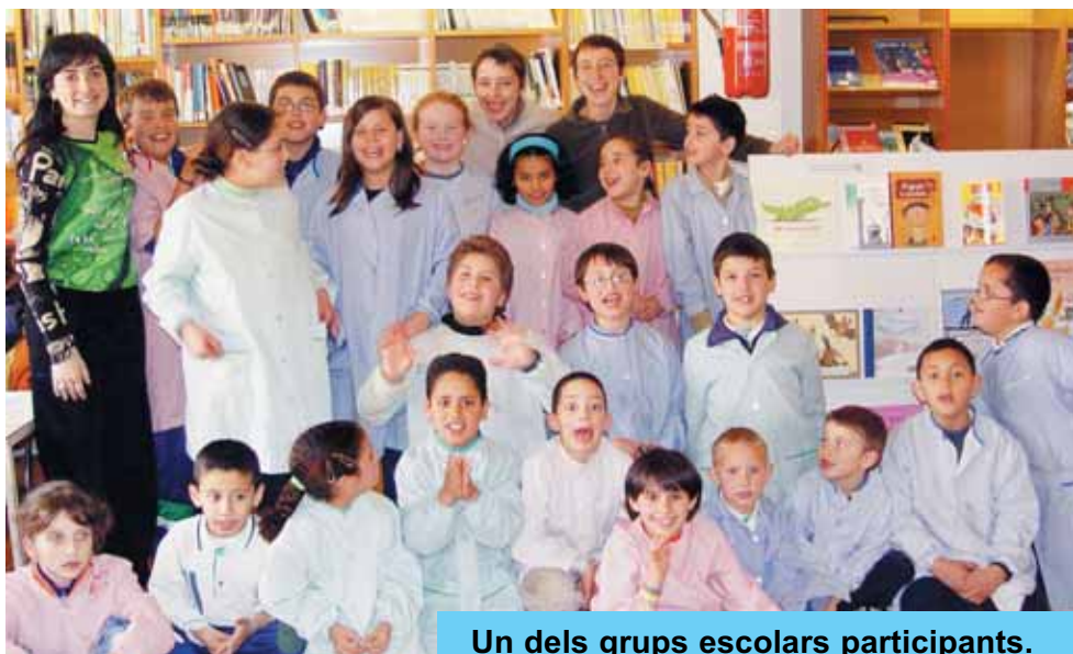
Un dels grups escolars participants.

Des del dia 6 fins el dia 26 de febrer, a la Biblioteca Pública Municipal Antoni Gaudí i Cornet, va tenir l'exposició «Per sucuar-hi pa», promoguda pel Consell Català del Llibre per a Infants i Joves. Aquesta exposició la van visitar cada matí els nens de l'escola acompanyats dels mestres.