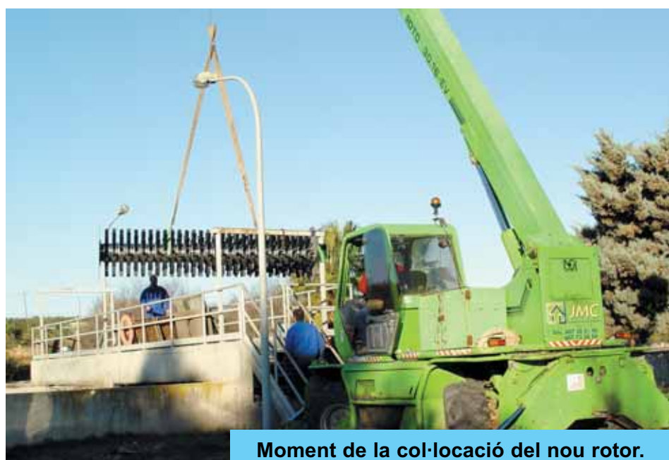
Moment de la col·locació del nou rotor.