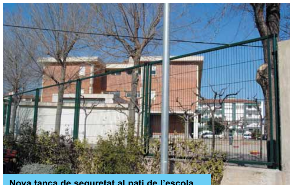
Nova tanca de seguretat al pati de l'escola .

Per a poder realitzar l'obra s'ha adquirit una perforadora per fer forats circulars al formigó que s'ha amortitzat en la col·locació de les tanques i queda com una eina molt útil de la Brigada alhora de col·locar pals, senyals i algunes pilones.