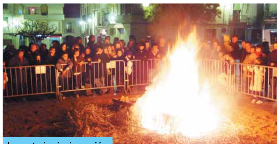
la posterior incineració.