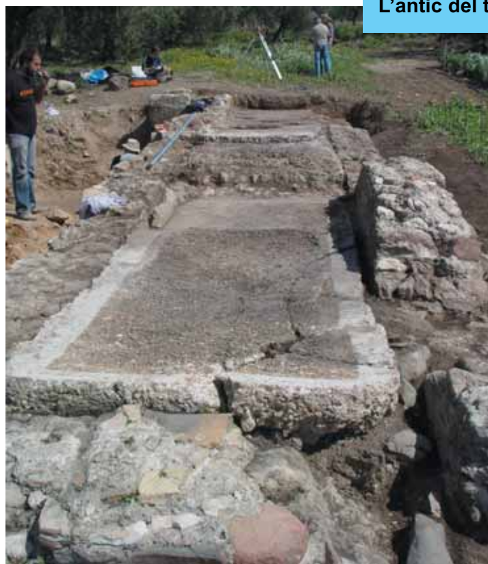
L'antic del trull d'oli.