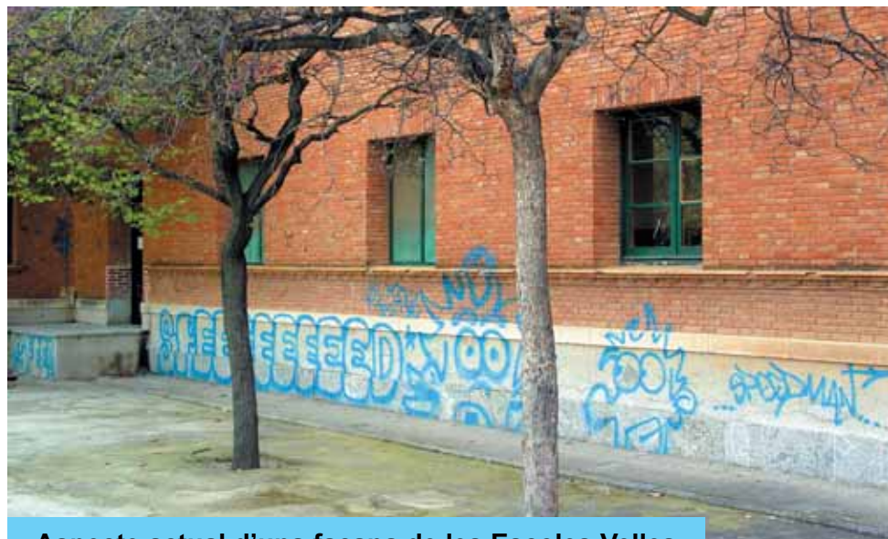
Aspecte actual d'una façana de les Escoles Velles.

Però aquests actes tenen conseqüències importants per tots els veïns de Riudoms. Algunes d'elles són immediates: la degradació de la imatge de determinats indrets, la pèrdua de qualitat de vida pels veïns de l'entorn i la manca de tranquil·litat pel mal estar que això genera entre tots els que passen per la vora d'un indret on s'han fet desperfectes. Però hi ha altres conseqüències, tant o més importants que potser