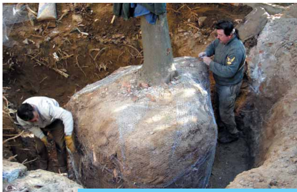
Moment en el que es col·loca la xarxa i el guix.

El trasplantament d'arbres d'aquestes característiques, per a tenir èxit ha de fer-se seguint unes pautes que primer que tot requereixen molt de temps (entre un i dos anys per a preparar els arbres), per contra, en el cas de les magnòlies únicament es disposava de tres mesos, ja que l'enderroc havia de fer-se ràpidament. Tot i això s'ha treballat per a poder trasplantar les magnòlies, fent les següents actuacions: