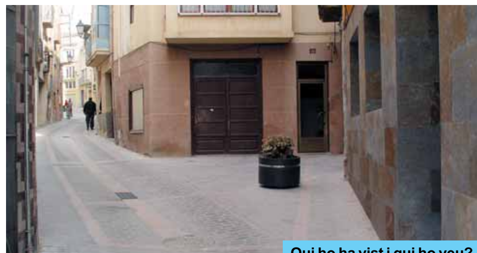
Qui ho ha vist i qui ho veu?.