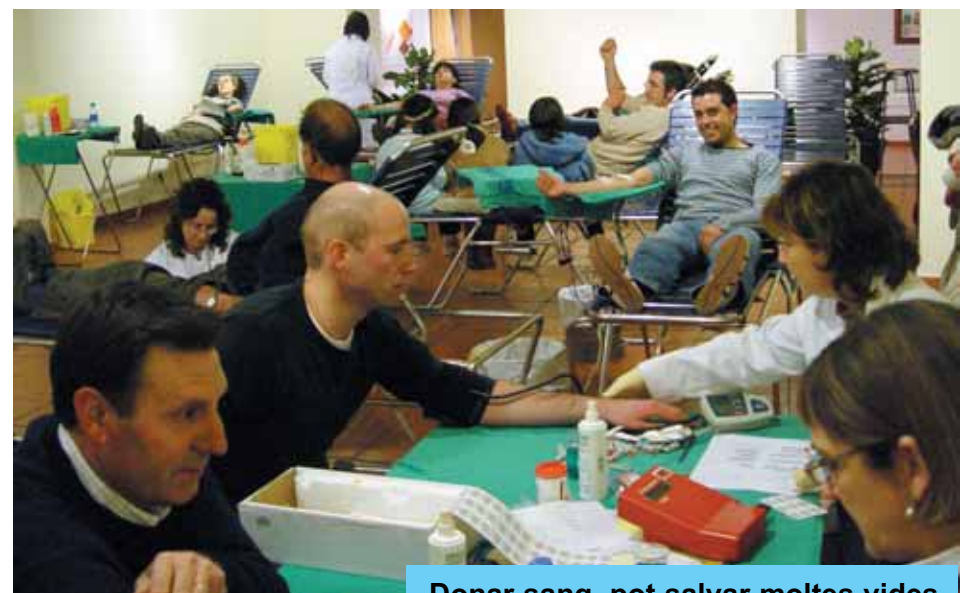
Donar sang, pot salvar moltes vides.