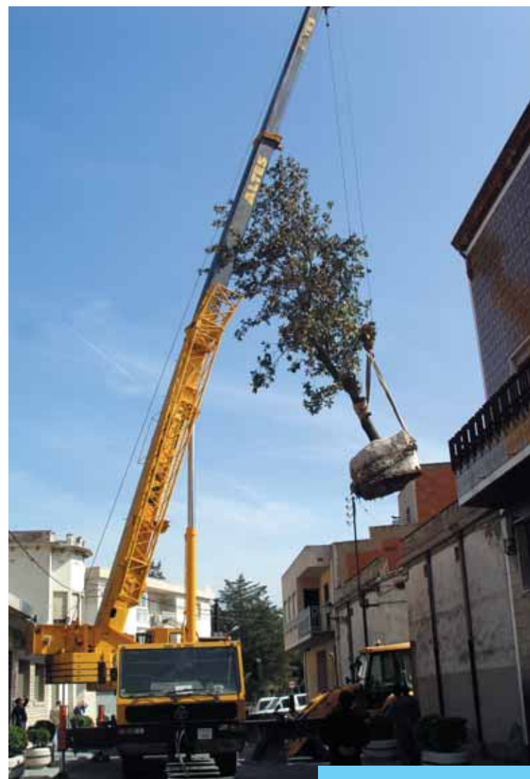
Transport de les magnòlies.

Amb la mateixa línia d'actuació, durant el més de juliol de l'any passat es van trasplantar els cinc tarongers que hi havia en una parcel·les de la Font Nova, col·locant-se en torretes, i els quals han sobreviscut tots, de manera que a partir de finals d'aquest estiu tindran un desenvolupament suficient per a poder ser trasplantats en una ubicació definitiva.