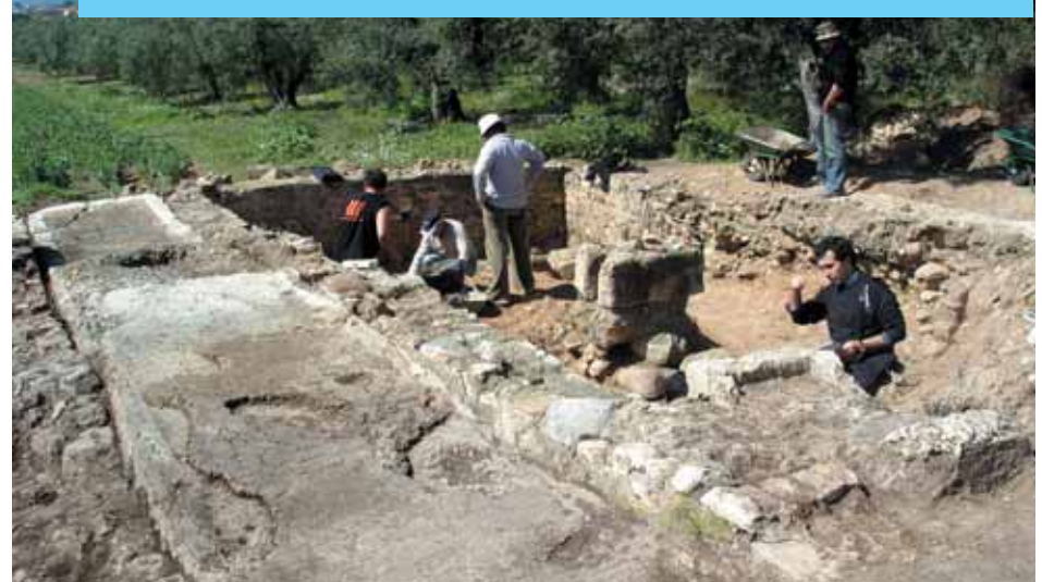
El grup d'arqueòlegs realitzant dels tasques de recuperació.

La Junta de Govern del dia 16 de juny de 2005 va aprovar un conveni entre l'Ajuntament de Riudoms i l'Institut Català d'Arqueologia Clàssica per tal de poder realitzar diferents treballs d'investigació històrica en el terme municipal del poble, emmarcats en un projecte global que es porta a terme a tota la zona geogràfica de la dreta del riu Francolí.