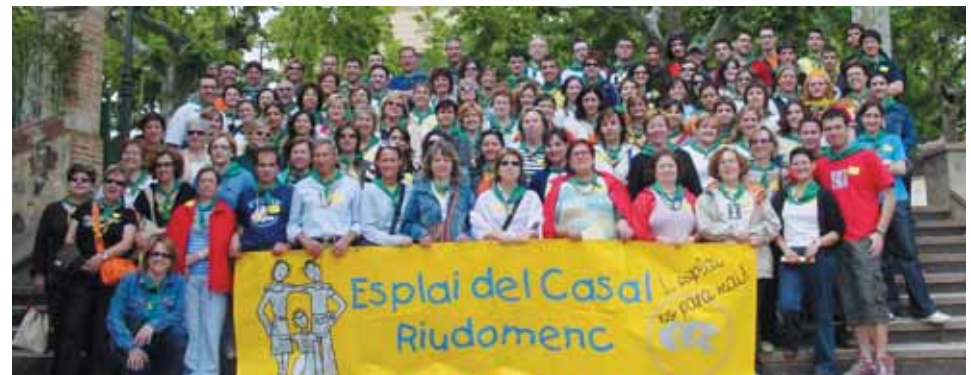
Monitors d'ara i de sempre

El diumenge 7 de maig, més de 100 persones vam participar en la 1a Trobada de Monitors i Ex-Monitors del Casal Riudomenc, que va tenir lloc al Parc de Sant Antoni.