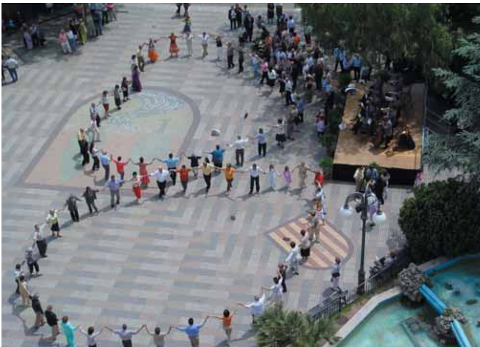
La Ballada de sardanes va anar a càrrec de la Cobla 'Maravella'