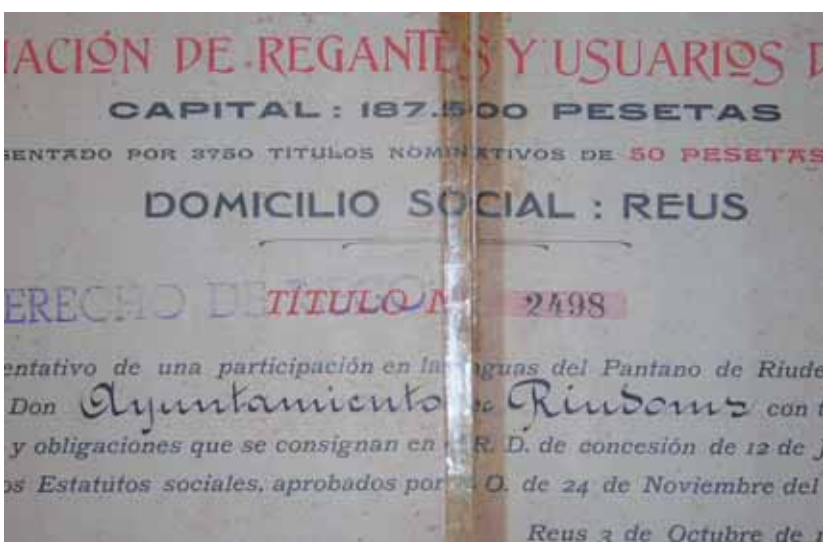
L'Ajuntament va ser un dels promotors del Pantà. Aquest títol original de propietat és de l'any 1916.

Aquesta temporada, s'ha fixat la temporada de Reg d'Estiu, en 12 setmanes de dues hores per cada dret de reg, subministrades entre els dies 5 de juny i el 27 d'agost de 2006. Tothom que necessiti regar abans o després del Reg d'Estiu, podrà fer servir el compte corrent d'aigua.