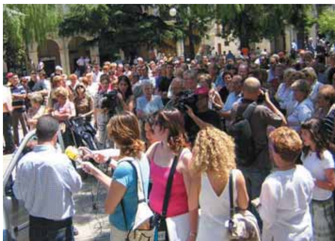
'Surt al carrer abans no entrin a casa teva!'

L'estat actual d'inseguretat ha arribat a límits inacceptables, fins el punt que la situació requereix mesures extraordinàries. Fa un any, l'alcalde i el regidor de Seguretat Ciutadana, van tenir una entrevista amb el Subdelegat del Govern a Tarragona, per demanar solucions. La reunió repetia els mateixos arguments que, des de fa anys, s'han exposat als successius subdelegats que han anat passant pel càrrec.