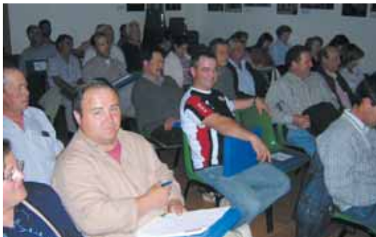
Assistents al curs d'aplicadors

Durant la primera quinzena de maig ha tingut lloc a la Casa de Cultura un Curs d'Aplicadors de Productes Fitosanitaris. Aquest curs ha estat organitzat pel sindicat agrari Joves Agricultors i Ramaders de Catalunya i la Regidoria d'Agricultura de l'Ajuntament.