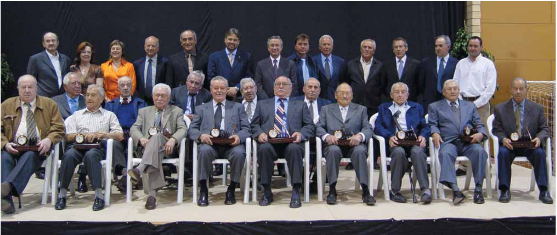
Els fundadors i la Junta de la Cooperativa Agrícola amb les autoritats