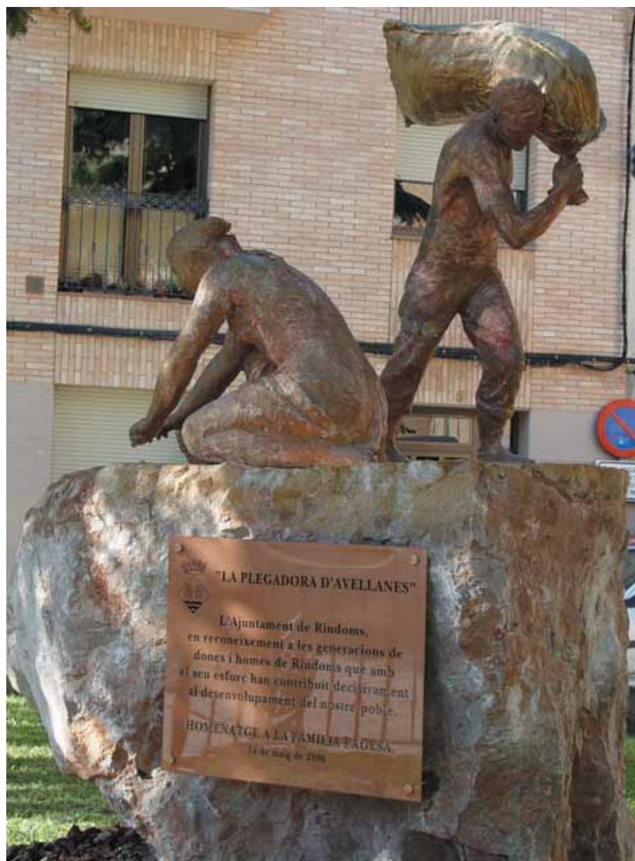
Conjunt escultòric 'La Plegadora d'Avellanes'

Considerant la gran importància de la dona pagesa en la família i en l'agricultura tradicional i en l'actual, en l'Homenatge s'ha donat la benvinguda a un conjunt escultòric, que se situarà al rovell de l'ou de la vida del poble: la Plaça de l'Església. L'hem titulat «La Plegadora d'Avellanes», fent clara referència a la feina, dura i esforçada de la recollida manual de l'avellana.