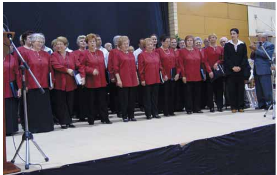
Emotiva actuació de la Coral Dolça Catalunya

Així mateix, també s'ha de saber aprofitar les oportunitats que se'ns presenten i poder-ne gaudir. Aquest any 2006, es compleixen 50 anys d'aquella fundació i l'actual Junta ha organitzat tot un cap de setmana d'actes institucionals i festius per a festejar aquest aniversari.