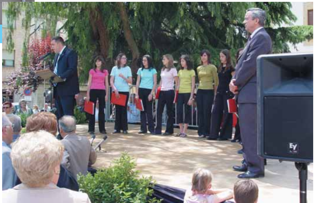
El Cor Jove va interpretar 'La Cançó de les Plegadores d'Avellanes'

La nostra terra, ha anat canviant i adaptant-se, quantes vegades hagi convingut, a través de l'acció de l'home. Però, ha estat i és, la família la base del funcionament de l'explotació agrària de Riudoms. Aquesta és el que una finca tiri endavant i cadascú en el seu rol, ajuda a que, collita rera collita, es puguin superar les dificultats del camí.