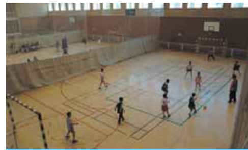
La 1a Diada, un èxit de l'AMPA

El dissabte 24 d'abril de 2006, l'AMPA del CEIP Beat Bonaventura Gran de Riudoms, va dur a terme la Primera Diada Esportiva Escolar, com a complement a les activitats extraescolars que organitza la mateixa entitat.