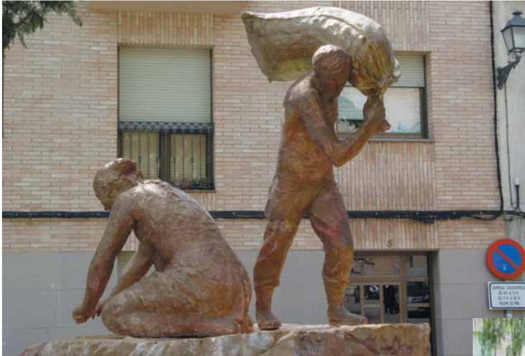
L'obra simbolitza el treball i l'esforç de la nostra pagesia

Considerant la gran importància de la dona pagesa en la família i en l'agricultura tradicional i en l'actual, en l'Homenatge s'ha donat la benvinguda a un conjunt escultòric, que se situarà al rovell de l'ou del poble: la Plaça de l'Església. L'hem titulat «La Plegadora d'Avellanes», fent clara referència a la feina, dura i esforçada de la recollida manual de l'avellana.