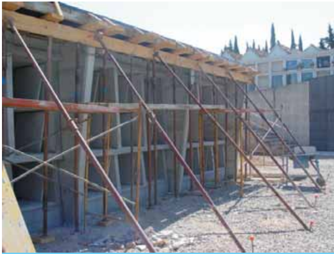
Estat actual de les obres d'ampliació

Aquests darrers mesos s'han realitzat les obres de construcció de tres mòduls de nínxols nous al cementiri municipal.