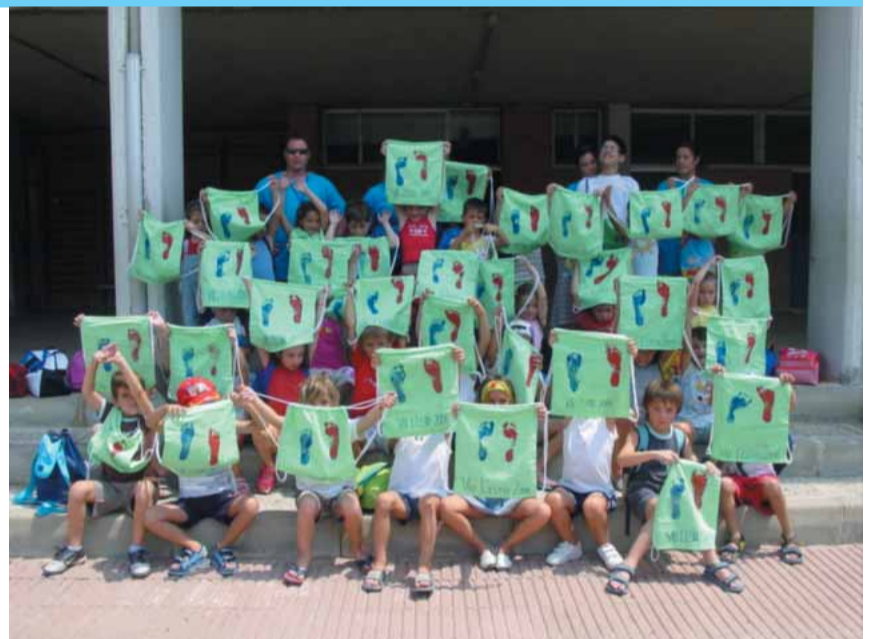
Els alumnes ens ensenyen les manualitats que han fet

El nostre plantejament era oferir diversió, activitat física i educació en un mateix projecte, i per a fer-ho, ens vam marcar uns objectius educatius, vam planificar activitats adequades a les diferents edats i vam crear un equip de monitors amb entusiasme, ple d'il·lusions i amb ganes de gaudir del goig d'educar en el lleure.