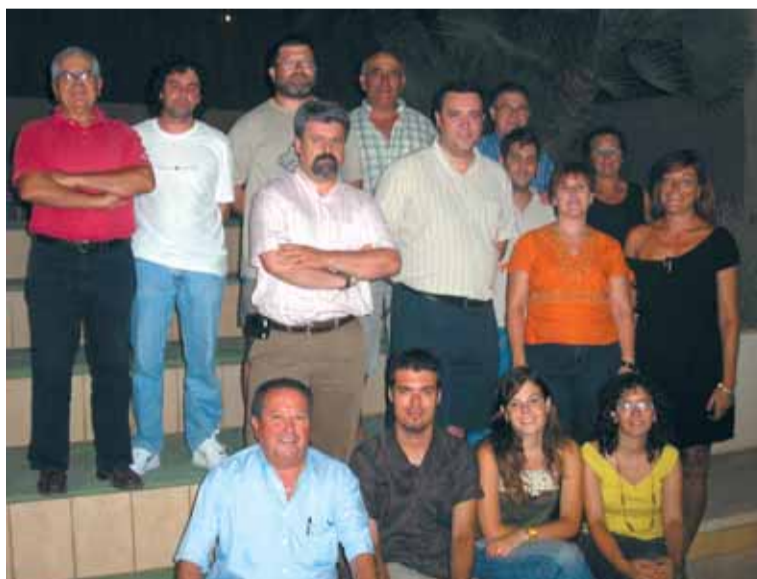
Membres del Comitè Organitzador de la Fira

L'organització i finançament de la Fira de Sant Llorenç i Fira de l'Avellana, depen del Patronat de la Fira de l'Avellana i de l'Ajuntament de Riudoms.