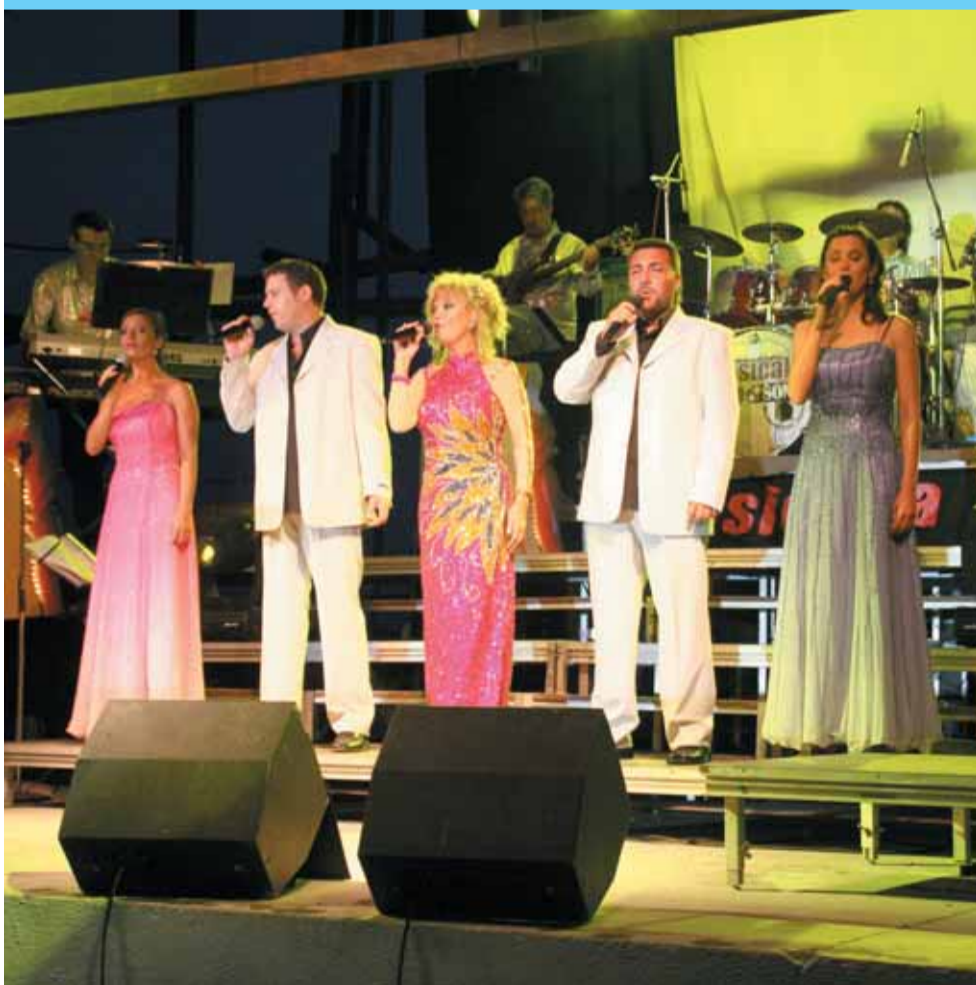
Ball de Gala a Sant Antoni amb l'orquestra Musicalia

La Festa Major de Sant Jaume 2006, es va anunciar amb el repic de campanes i la tronada del dia 21 al migdia. Va ser l'anunci que la Festa Major d'estiu s'iniciava amb tots els actes programats. Aquest mateix dia a la nit, tothom que es va apropar a la Plaça de l'Església va poder ballar i cantar temes molt coneguts amb el concert que ens va oferir l'Hotel Cochambre.