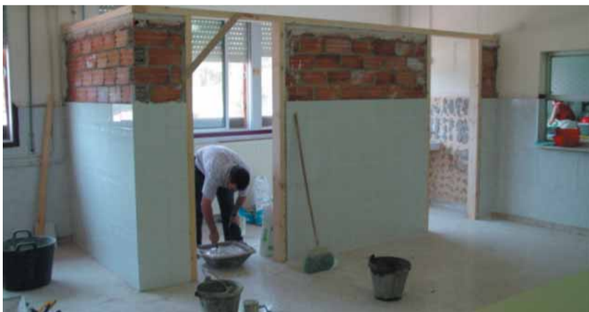
La Brigada municipal executant les obres

Des de fa anys, l'Ajuntament de Riudoms gestiona el servei de Menjador Escolar del CEIP Beat Bonaventura.