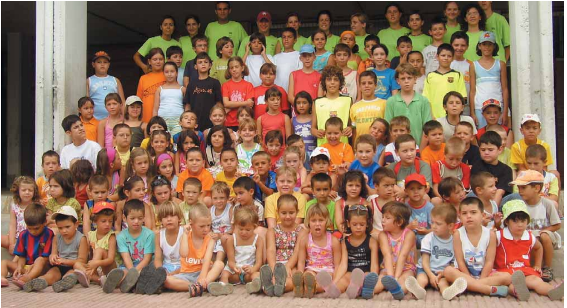
Alumnes i monitors del tercer torn de l'Escola de Lleure 2006

Com cada any l'estiu arriba ansiós i ple de ganes d'omplir les hores lliures amb activitats que s'adeqüin al desig de gaudir del bon temps i dels amics. Ens trobem que els més petits del poble acaben l'escola i el que els toca en aquest moment és jugar com tots hem fet de petits i sobretot aprofitar la màgia que acompanya l'estiu.