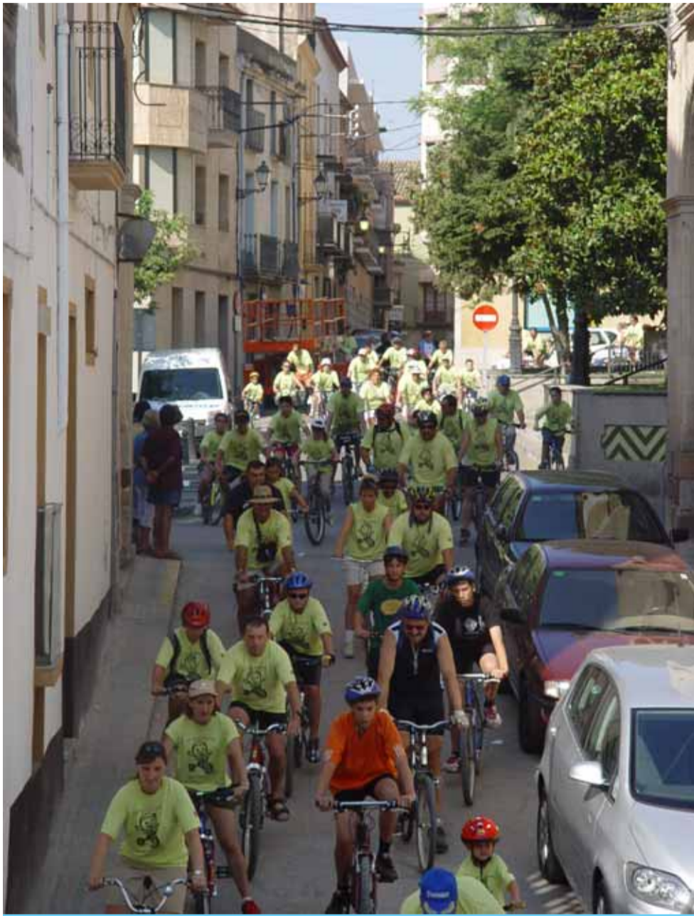
La bicicletada, pedalant cap al carrer de l'Arenal