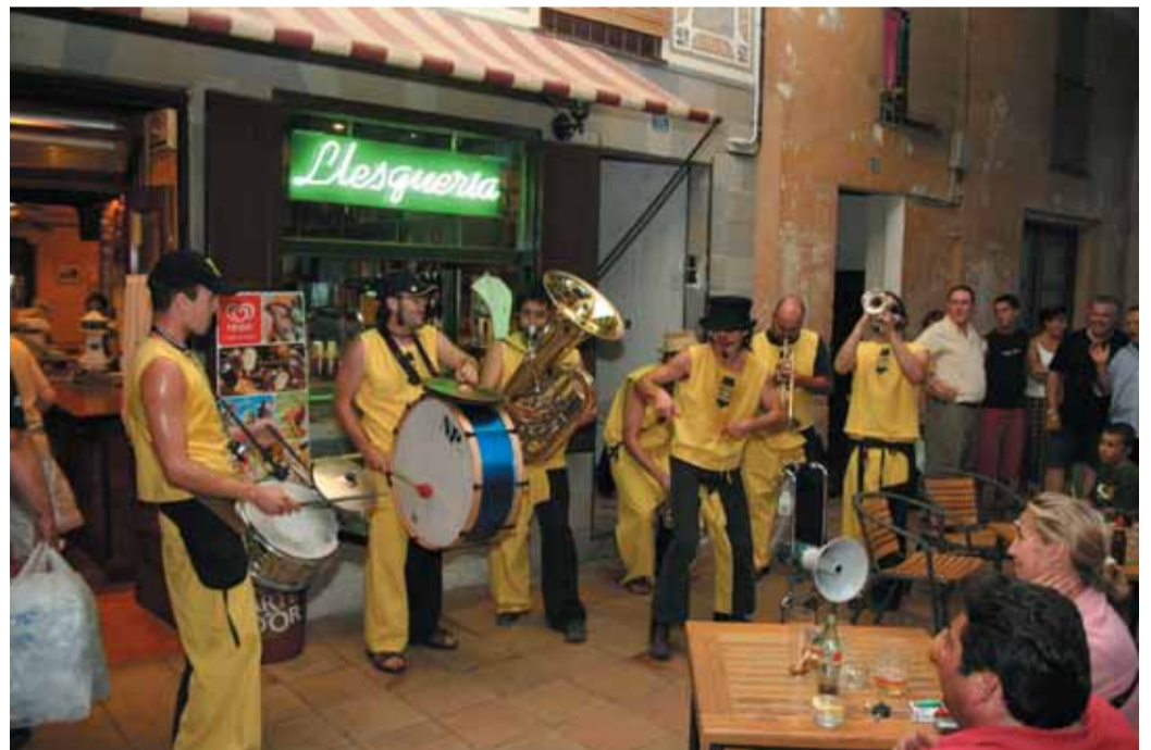
Cercavila d'inici del «Reviu les places 2006»

acte cultural. En aquesta primera plaça la combinació de la música en directe interpretant bandes sonores originals de pel·lícules, amb les imatges que les il·lustraven, va ser molt gratificant.