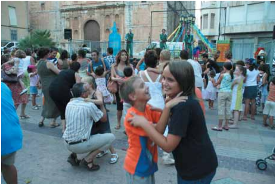
Petits i grans jugant a la plaça