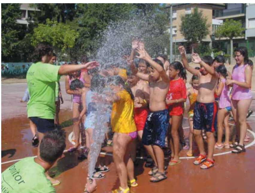
Per refrescar-nos, jocs d'aigua!

Veure com els infants del poble es diverteixen i a la vegada conviuen en un entorn educatiu i lúdic és el resultat més satisfactori. Hem descobert somriures, hem despertat ganes de treballar en equip, hem aconseguit donar sorpreses divertides, hem pogut gaudir de la natura tots junts i sobretot, hem jugat!!!