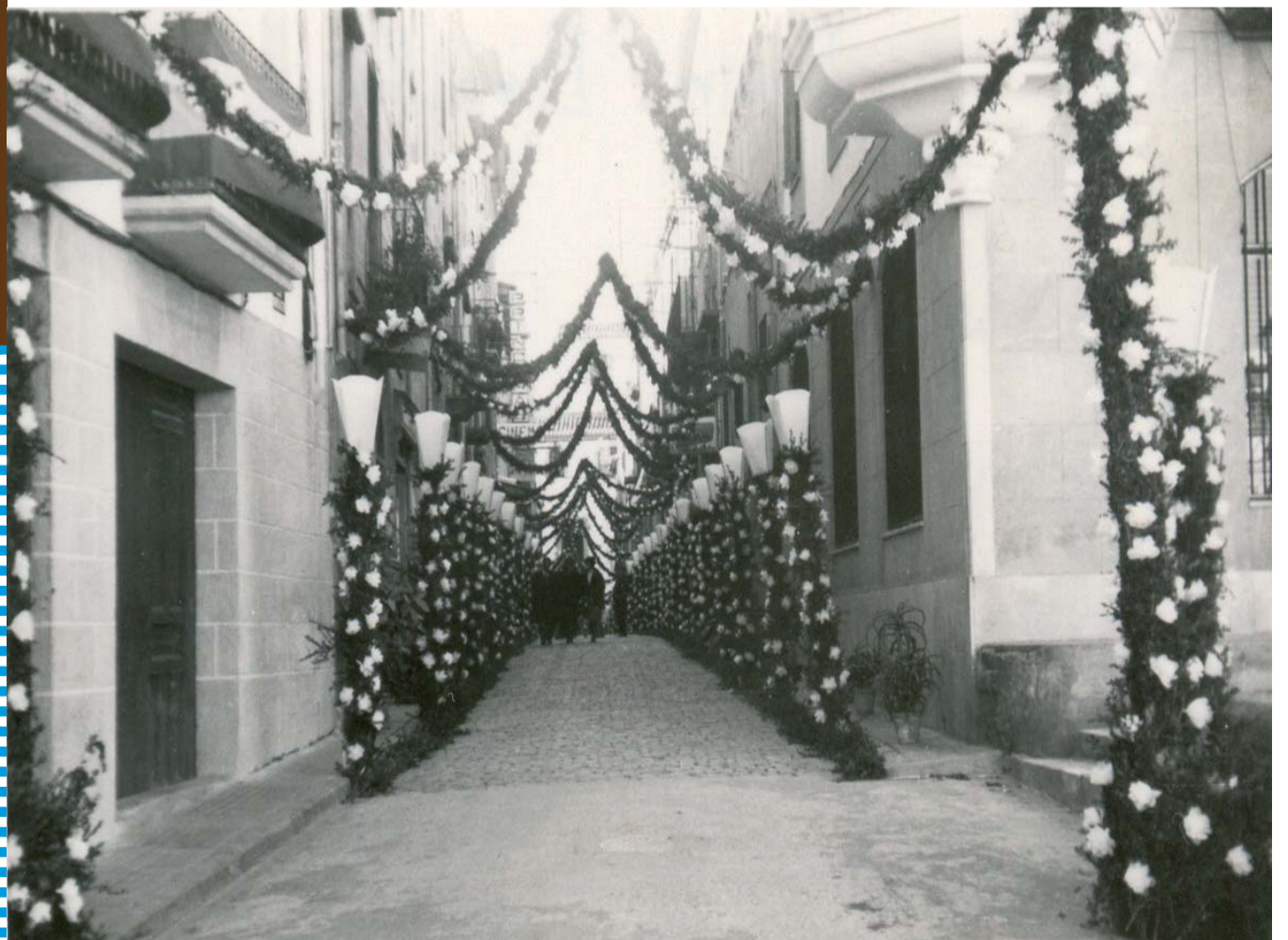
El carrer Sant Bonifaci l'any 1971

Des d'aquí, us fem una crida per a participar massivament a tots els actes programats en motiu d'aquesta gran festa.