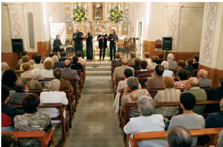
El quartet Qu4tre 5ing actuant a Sant Antoni

L'últim escenari del cicle d'enguany va ser l'Església de Sant Jaume Apòstol, traslladada a l'època medieval per espai d'una hora amb motiu del concert de l'Ensemble l'Albera, que va oferir un repertori de peces de música medieval dels segles XIII al XV, on prenen protagonisme els instruments propis de l'època, tals com el psalteri, la flauta de bec o la viola d'arc, amb les seves característiques melodies. El concert va anar acompanyat de les explicacions dels integrants de la formació, unes referides a l'origen de les melodies que interpretaven, ubicant als espectadors en el