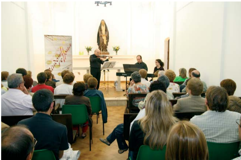
Instant del concert Tieleles - Torres a Verge Maria

La tercera edició del cicle de concerts de tardor Riudoms reSSona, organitzada per la Regidoria de Cultura, ens ha dut al poble un conjunt de suggerències musicals que han portat als espectadors que hi han assistit a fer un tomb per estils, èpoques i instruments ben singulars, en el sí dels edificis religiosos de Riudoms, ja per sí sols bells i admirables.