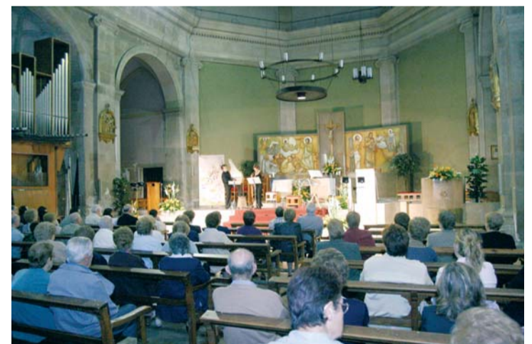
Música medieval a l'altar de l'Església

Seguint amb el criteri de la promoció de músics riudomencs o vinculats a la vila i el coneixement d'estils i instruments singulars i diversos, la convocatòria del cicle de concerts de tardor Riudoms reSSona es consolida en el mes d'octubre, ocupant l'espai que queda entre el final de l'estiu i les Festes del Beat.