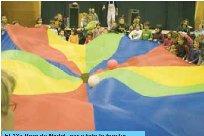
El 13è Parc de Nadal, per a tota la família

El Parc de Nadal de Riudoms va entretenir, un any més, als més joves durant el 28 i 29 de desembre, al Pavelló d'Esports Municipal, amb tallers, activitats, espectacles i jocs.