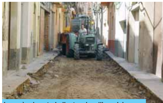
Les màquines treballant en la millora del carrer

Aquesta obra tindrà un cost aproximat de 480.000 euros, dels quals una part han vingut del Pla d'Acció Municipal de la Diputació de Tarragona i del Pla Unificat d'Obres i Serveis de Catalunya. La resta ha estat costejada pel pressupost municipal.