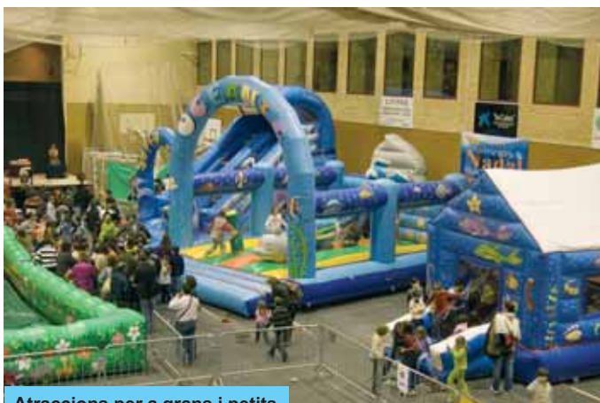
Atraccions per a grans i petits

Diverses entitats del poble van dedicar el seu temps a organitzar tallers diversos que van ser molt concorreguts, a l'igual que els tallers que van dur a terme experts en titelles de goma-escuma i de circ també presents. Les atraccions inflables, els jocs recreatius i el rocòdrom amb la tirolina, completaven l'oferta d'oci del 13è Parc de Nadal de Riudoms.