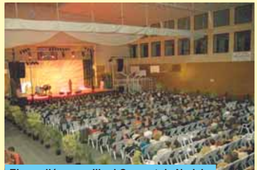
El pavelló va acollir el Concert de Nadal