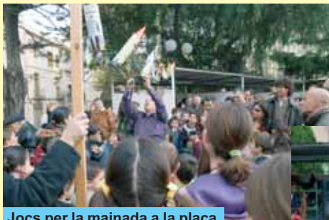
Jocs per la mainada a la plaça