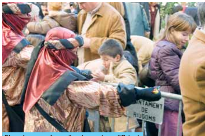
Els patges van fer arribar les cartes a l'Orient

Els Patges Reials, que com és costum van arribar a cavall per l'avinguda Josep M. Sentís, van escoltar com de bé s'havien portat tota la mainada de Riudoms durant l'últim any i van encomanar-los continuar així de bé durant el 2007. La recollida de cartes es va dur a terme a la Capella de Verge Maria, davant l'atenta mirada de pares, mares i familiars.