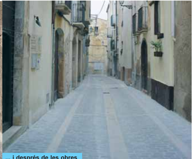
... i després de les obres