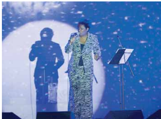
L'espectacular posada en escena va aixecar el públic dels seients

La nit del 23 de desembre va ser el moment de l'espectacle central dels Festivals de Nadal, enguany a càrrec de la reconeguda cantant nordamericana afincada a Catalunya Mònica Green, amb un repertori de peces de gospel, soul i jazz combinades amb nades tradicionals catalanes, acompanyada de les notes d'un excel·lent pianista.