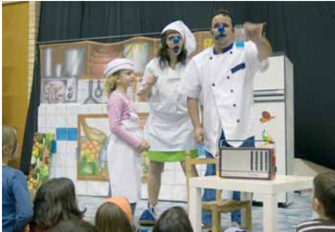
Actuacions, diversió, inflables, ... un Parc per a tots els gustos

El Parc de Nadal de Riudoms va entretenir, un any més, als més joves durant el 28 i 29 de desembre, al Pavelló d'Esports Municipal, amb tallers, activitats, espectacles i jocs.