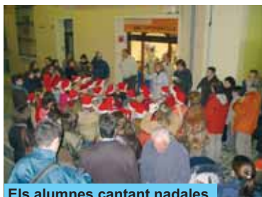
Els alumnes cantant nades

El ja tradicional concert de Nadal dels alumnes de l'Escola Municipal de Música de Riudoms es va celebrar a l'Església, el dimecres 20 de desembre. L'endemà va ser el torn de la popular cantada de nades que l'alumnat de l'Escola Municipal de Música van dur a terme pels carrers del nucli antic del poble, creant-se al seu voltant una entranyable atmosfera nadalenca al compàs de les seves veus.