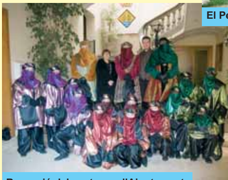
Recepció dels patges a l'Ajuntament