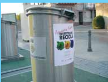
Contenidors de recollida selectiva

Per altra banda s'han iniciat les obres per a la construcció d'un terrer previ a l'entrada, per tal de reduir els problemes a les bombes i fer un prefiltratge. Aquest terrer consta d'una arqueta profunda, amb la forma adequada per a poder-hi actuar amb una cullera bivalva submergible que, amb l'ajuda d'un pont-grua, transportarà la sorra i altres pòsits a un contenidor situat al lateral per a rebre el tractament pertinent com a residu.