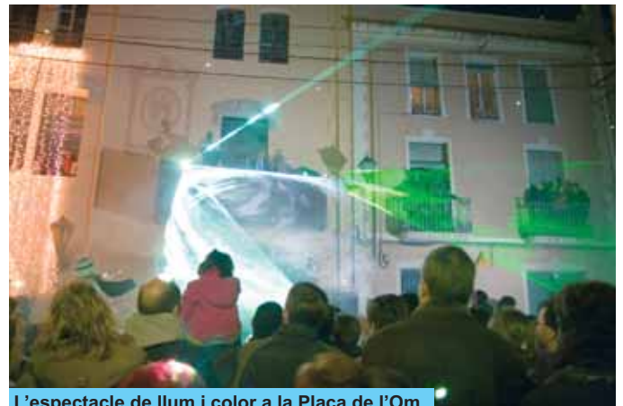
L'espectacle de llum i color a la Plaça de l'Om

Van cobrir de caramels tota l'avinguda i el recorregut posterior fins a l'Ajuntament de Riudoms, on rebuts per la Corporació Municipal, encapçalada per l'alcalde, van poder-se dirigir a tots els presents des del balcó de la Casa de la Vila. Un cop acabats els parlaments, els Reis portaven una sorpresa per a tota la gent de Riudoms: van connectar un gran interruptor «màgic» que va engegar un espectacle de llum, so i efectes especials, com a regal per a tots els riudomenys i riudomenques que van anar a saludar a ses majestats a la Plaça de l'Om.