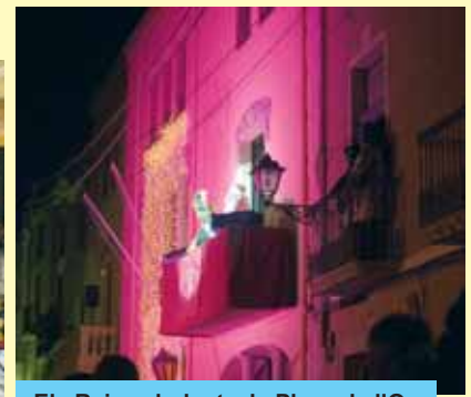
Els Reis saludant a la Plaça de l'Om