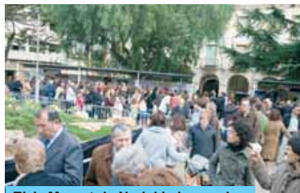
El 1r Mercat de Nadal i el pessebre

El pessebre que va acompanyar-nos durant totes les festes de Nadal va ser dissenyat per la regidoria de Serveis Públics i elaborat pels membres de la Brigada Municipal. Aquest any el pessebre representava un ambient