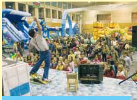
Grans i petits gaudint del Parc de Nadal