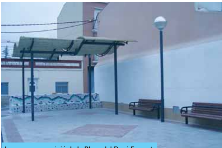
La nova composició de la Plaça del Barri Ferrant

La zona de 1159m 2 s'ha anivellat, s'hi han delimitat els espais d'aparcament, s'ha il·luminat amb tres focus per a garantir l'accés durant la nit i finalment s'han plantat diferents arbres provinents del viver municipal per tal que ben aviat facin ombra als aparcaments. És en aquest espai on també s'han resultat els dos pebrers trasplantats de la plaça del Barri Ferrant.