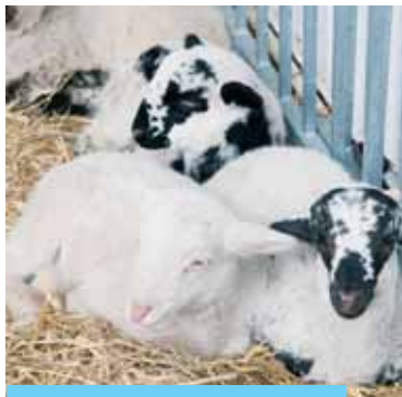
Els cabridets jaient a la plaça

El Mercat de Nadal de Riudoms, dut a terme el diumenge 17 de desembre, va ser la novetat dels Festivals de Nadal d'enguany i el primer acte pròpiament nadalenc. Un important nombre de comerços del poble es van adherir a la iniciativa promoguda des de la Regidoria de Festes i la Regidoria de Promoció econòmica i van oferir els seus productes nadalencs al voltant de la Plaça de l'Església, presidida per un pessebre de grans dimensions que es va instal·lar al bell mig de la plaça durant totes les festes. Un tió gegant va acompanyar els més petits mentre es repartien garrofes per poder alimentar el seu tió. Aquest fruit era del que es nodrien antigament tots els tions de les cases. Al vespre, un grup de música tradicional va amenitzar l'espai amb nades a toc de gralla i timbal, mentre que un bon nombre de gent realitzava les seves compres i passejava per davant de les parades de regals, flors, queviures i d'altres elements típics d'aquestes festes.