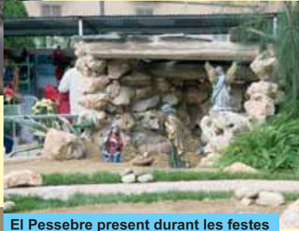
El Pessebre present durant les festes