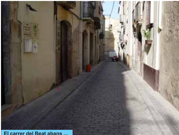
El carrer del Beat abans ...

Amb l'arribada de l'any nou s'han acabat les obres de reforma del carrer del Beat. Han consistit en la incorporació d'un sistema de recollida de pluvials, la substitució de la xarxa d'aigua potable i la de clavegueram, la modernització de l'enllumenat públic i l'adequació del ferm mitjançant la col·locació de llambordes llises que permeten caminar-hi de manera molt còmode i mantenir, a la vegada, l'estètica tradicional del nucli antic de Riudoms.