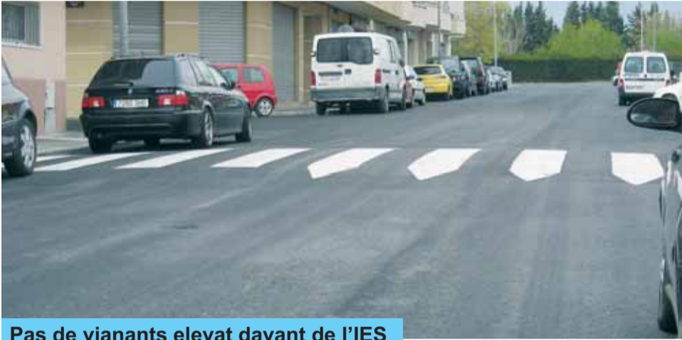
Pas de vianants elevat davant de l'IES

Aprofitant la presència de la maquinària per a fer aquestes feines a Riudoms, també s'han fet tres passos de vianants elevats: per entrar al pavelló i al camp de futbol, per entrar a l'Institut Joan Guinjoan i per entrar a la Plaça dels Gegants. Durant les pròximes setmanes s'avaluarà el seu funcionament i en cas que tingui una bona acceptació entre els veïns del poble es podran implantar en altres espais.