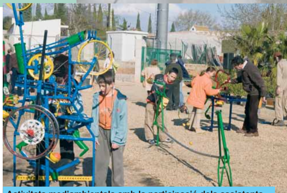
Activitats mediambientals amb la participació dels assistents

Per tal de conscienciar, encara més, a la nostra població sobre la necessitat d'efectuar cada cop millor la recollida selectiva, se segueixen fent les campanyes d'informació sobre aquests aspectes a les persones recent arribades i a les zones de nova implantació dels contenidors soterrats.