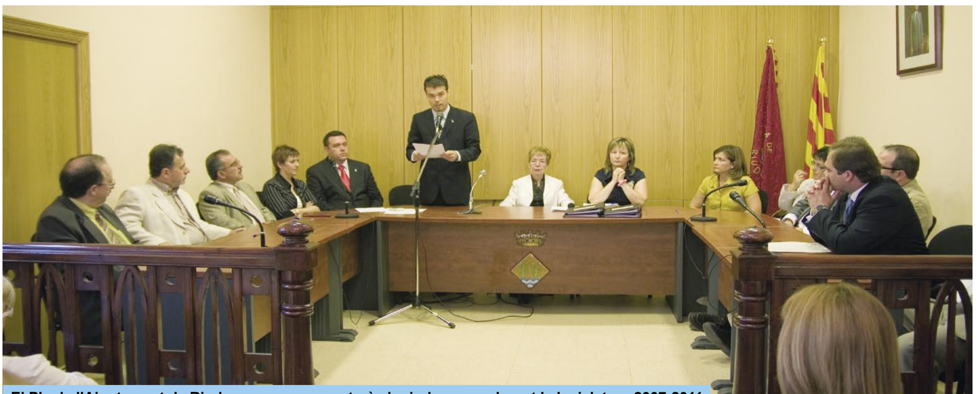
El Ple de l'Ajuntament de Riudoms que representarà els riudomencs durant la legislatura 2007-2011

Aquest ple és un dels més emotius i esperats de cada legislatura, donada la transcendència de l'acte i és per això que la Sala de Plens estava ben repleta de públic.