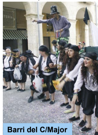
Barri del C/Major

Tot i que les campanes no van sonar amb l'esplendor habitual perquè les tenim encostipades, les traques de coets i un afrancesat canó van engegar els Barris, amb un gran rebombori, el divendres al vespre. Cada Barri va fer esclatar de forma simultània la seva traca. El canó, va resseguir els carrers del centre, amb la seva singular i esbojarrada