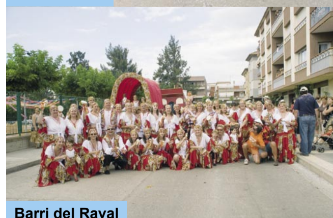
Barri del Raval