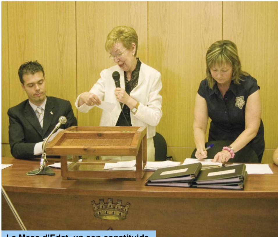
La Mesa d'Edat, un cop constituïda

El funcionament d'aquest ple extraordinari és especial, donat que en alguns moments s'usen fórmules i procediments que no s'empren durant la resta de la legislatura.