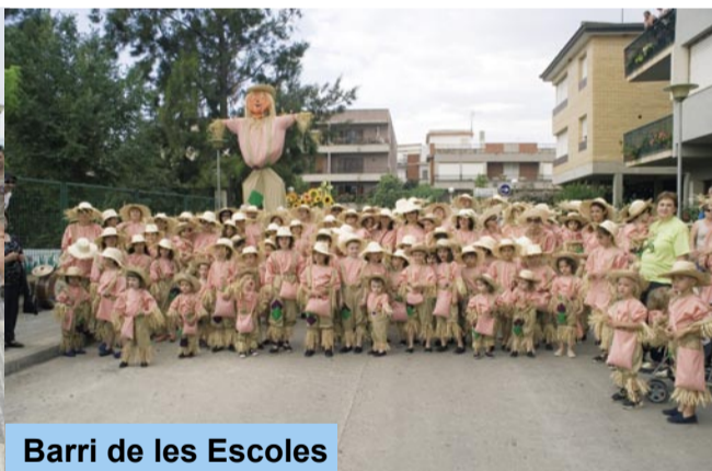
Barri de les Escoles