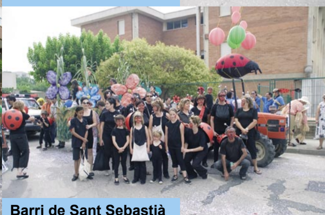
Barri de Sant Sebastià