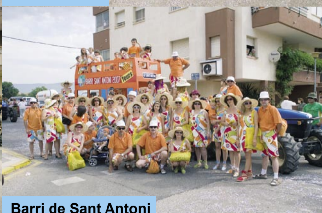
Barri de Sant Antoni