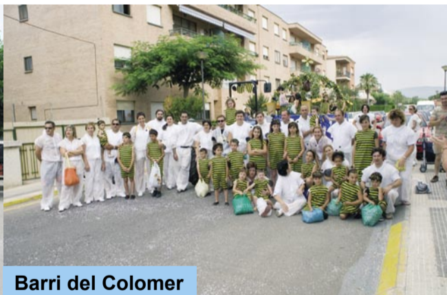
Barri del Colomer