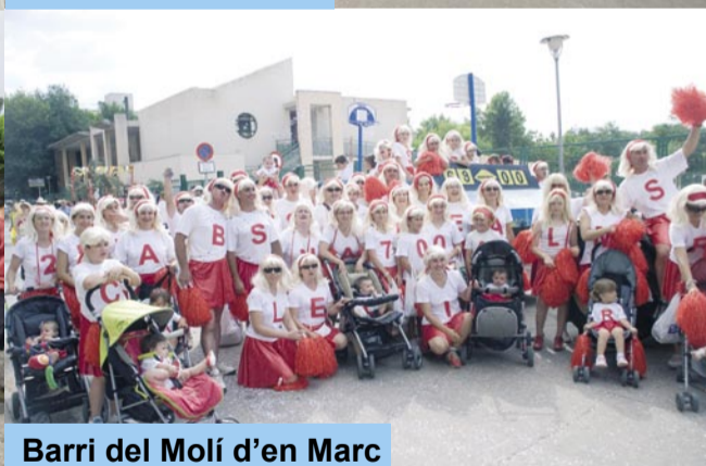
Barri del Molí d'en Marc