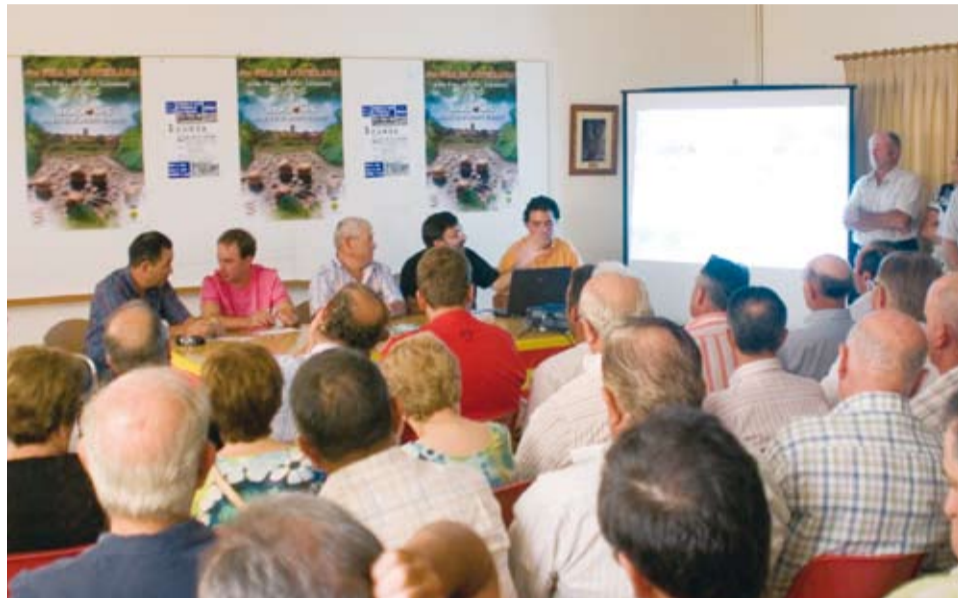
Xerrada sobre el present, passat i futur del conreu de l'avellaner

El diumenge 12, Amics de Riudoms, van tornar a organitzar l' "Anar a mar". Excursió a peu, fins la platja de Vilafortuny, per a recordar aquest costum dels nostres avant-passats, en la qual hi van pendre part unes 200 persones. A les Quadres Julivert es va disputar la 3a Cursa popular de Cavalls de la Fira de l'Avellana. A les 12h, la Sala d'actes de la Cooperativa Agrícola va acollir a la Unió de Pagesos, que va oferir la xerrada: "Present, passat i futur del conreu de l'avellaner al Camp de Tarragona". A continuació es va lliurar el 8è Premi del Conreu de l'Avellaner i el Patronat de la Fira de l'Avellana i la Cooperativa de Riudoms van oferir un refrigeri pels assistents.