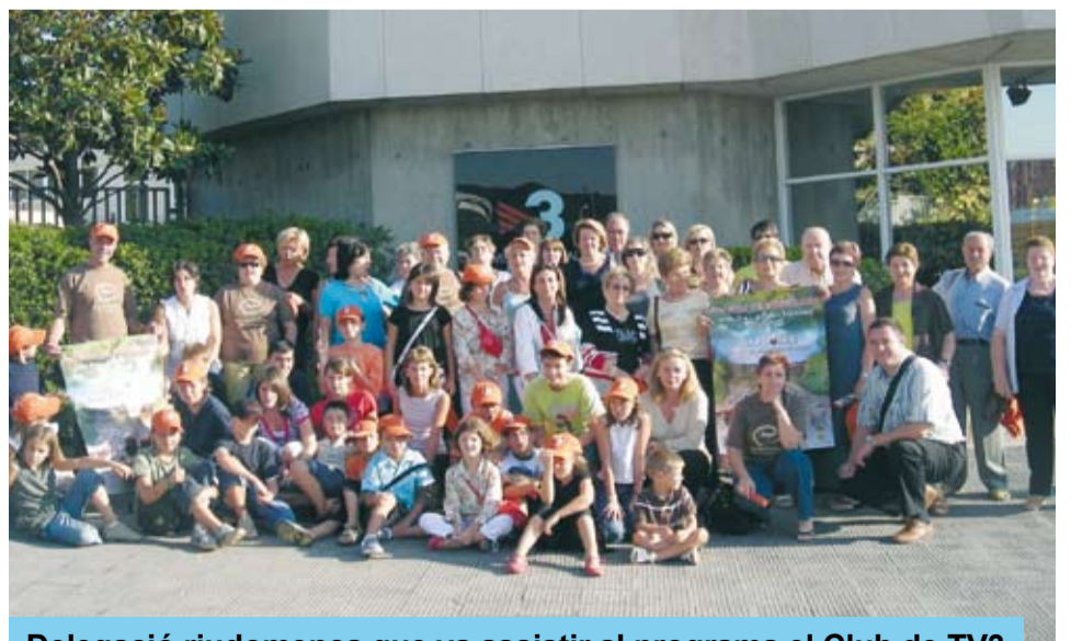
Delegació riudomenca que va assistir al programa el Club de TV3

Ja estem treballant en l'edició de l'any vinent, que tindrà lloc els dies 8, 9 i 10 d'agost de 2008. Mentrestant, mengeu avellanes!