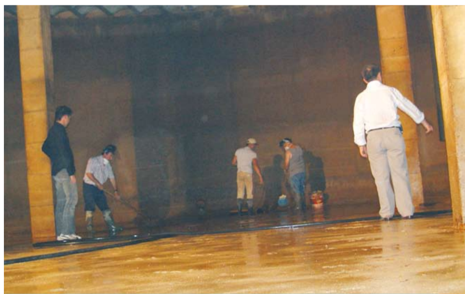
Neteja anual dels dipòsits d'emmagatzematge d'aigua potable

Actualment la capacitat d'emmagatzematge dels dos dipòsits municipals és de 2.000 m 3 (dos milions de litres d'aigua). Aquest volum és més que suficient per a garantir el proveïment d'aigua durant més de 24 hores. Aquest marge de temps és el que es considera necessari per tal de poder fer front a possibles averies sense haver de tallar el subministrament de tot el poble i, per altra banda no suposa problemes sanitaris per excés de temps amb l'aigua aturada.