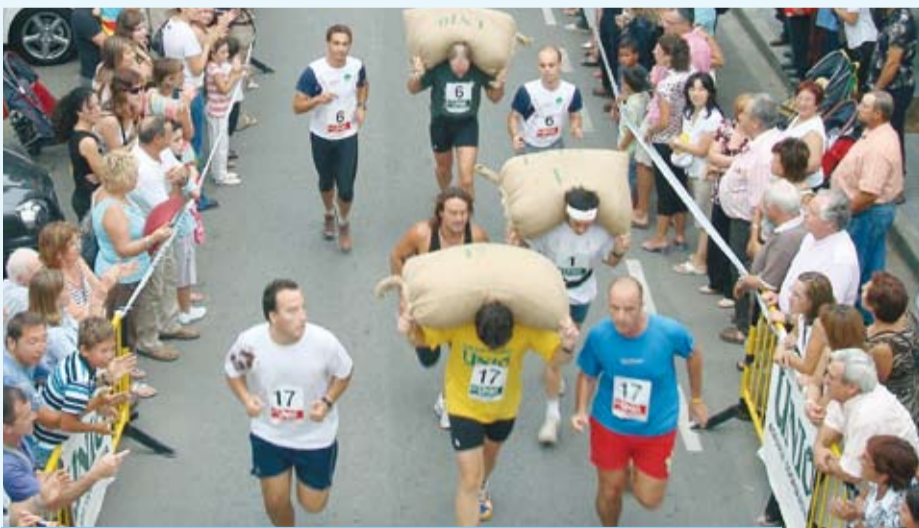
Els tres primers classificats en un punt del recorregut