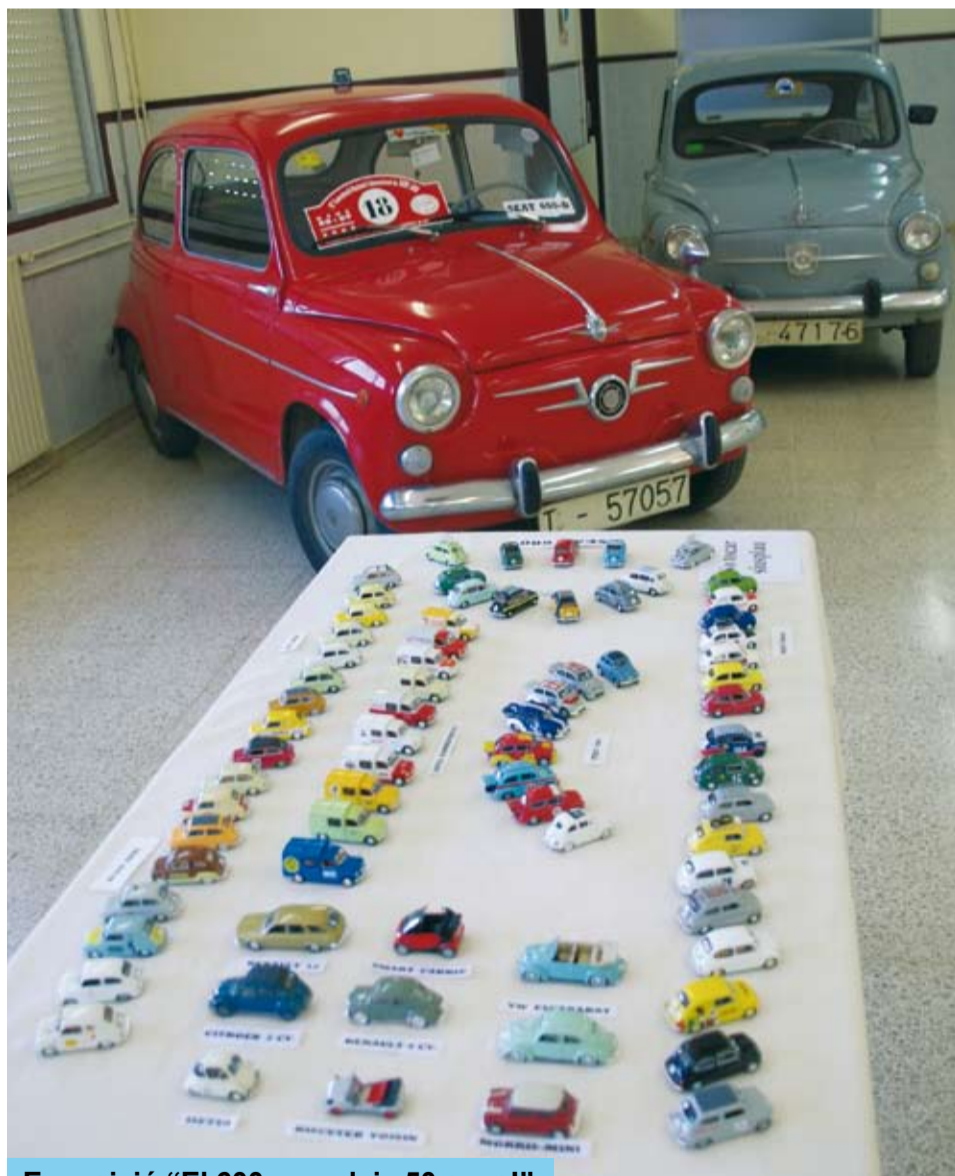
Exposició "El 600 compleix 50 anys!"

A la tarda, es va jugar el partit de futbol entre el CD Riudoms i el CD Salou, amb el resultat de 1 a 2, i es va celebrar la 3a Cursa d'Exhibició d'Automodelisme, a càrrec de l'Associació d'Automodelime RC Reus.