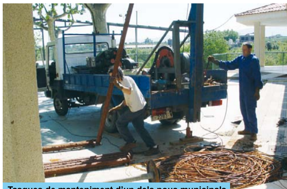
Tasques de manteniment d'un dels pous municipals

Tot i les mesures que s'han explicat, per tal de garantir una aigua de qualitat, a més a més, l'Ajuntament de Riudoms té contractat el servei d'un prestigiós laboratori que periòdicament realitza les anàlisis de l'aigua de consum que subministrem a la xarxa, tal i com marca la legislació actual, de forma que tenim un estricte control de qualitat sobre les condicions sanitàries de l'aigua consumida pels riudomencs.