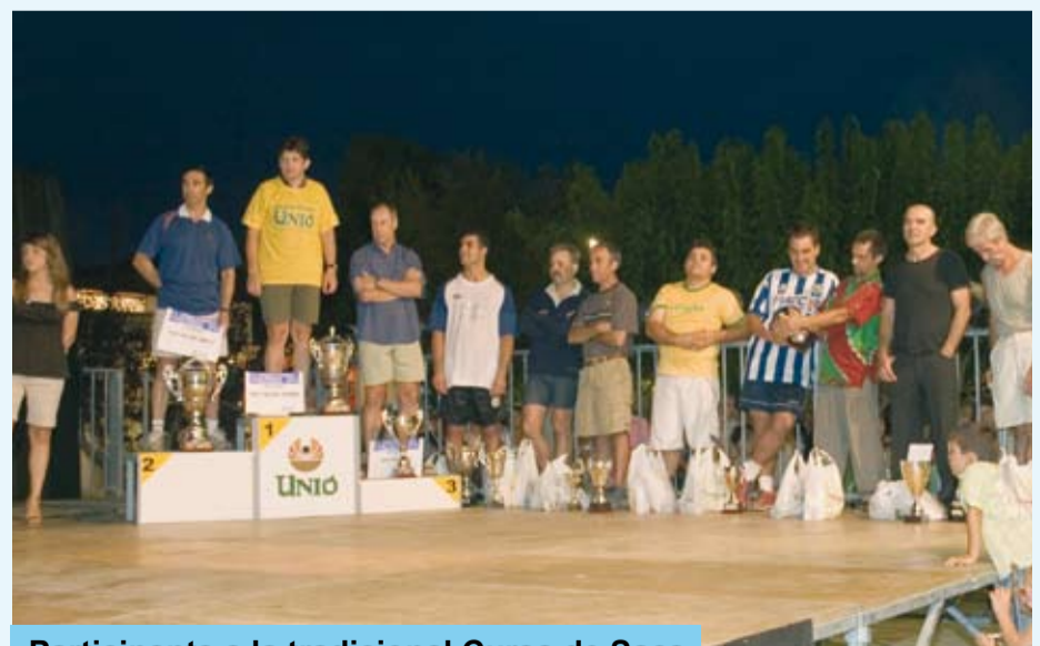
Participants a la tradicional Cursa de Sacs