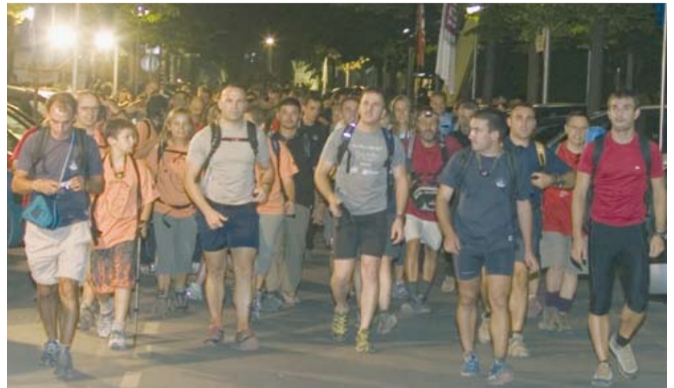
Sortida de la 2a Caminada Nocturna "Les llàgrimes de Sant Llorenç"