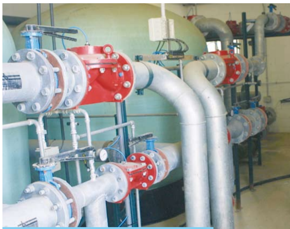
Part de l'Estació de Tractament d'Aigua Potable

Abans d'emmagatzemar l'aigua que arriba de les diferents fonts de proveïment, aquesta es passa per l'Estació de Tractament d'Aigua Potable (ETAP). Aquesta estació fa passar l'aigua, mitjançant potents bombes, per filtres de sorra i carbó els quals li retiren les possibles impureses que aquesta porti, i posteriorment li afegeix el clor necessari per acabar-la de potabilitzar (així s'eliminen els microorganismes).