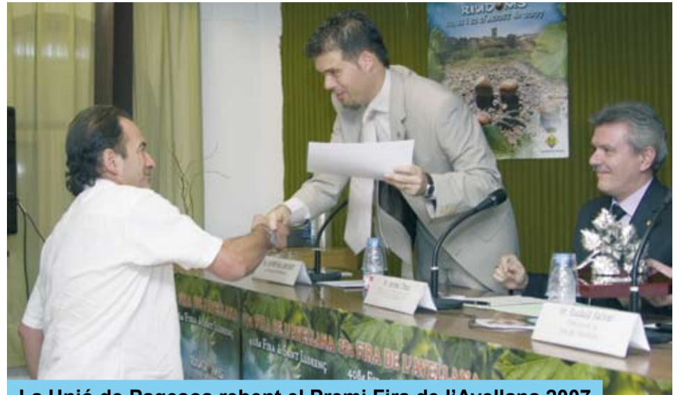
La Unió de Pagesos rebent el Premi Fira de l’Avellana 2007

En aquesta primera edició, el Jurat ha volgut manifestar el seu reconeixement per la seva llarga tradició històrica en la defensa de la pagesia i de l’avellana en particular i pel seu destacat paper en l’associacionisme agrari i per la defensa dels drets dels pagesos. Per això, es va acordar concedir el “PREMI FIRA DE L’AVELLANA 2007” al sindicat agrari UNIÓN DE PAGESOS DE CATALUNYA.