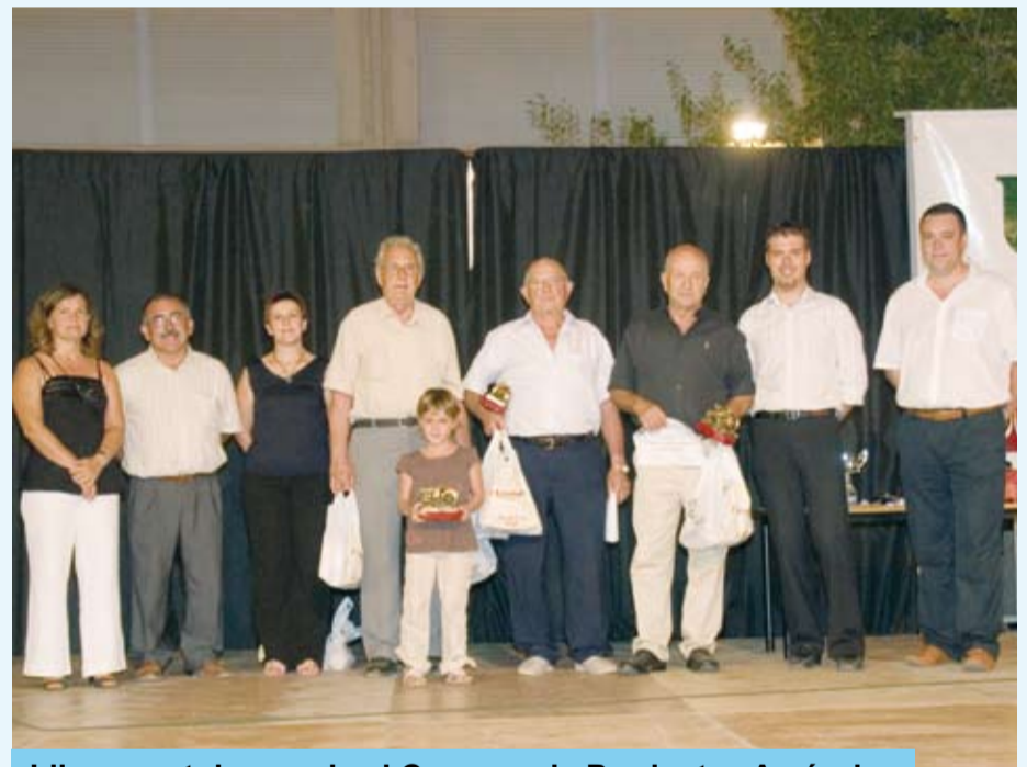
Lliurament de premis al Concurs de Productes Agrícoles