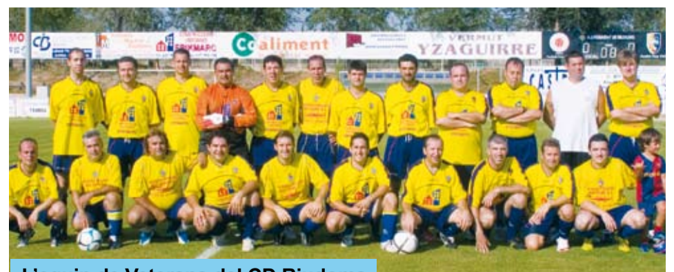
L'equip de Veterans del CD Riudoms

Com sempre, a partir de les 6 de la tarda, van començar les activitats firals. Es va jugar el partit de veterans entre el CD Riudoms i el Reus Deportiu, es va poder veure una demostració d'Agility, organitzada pel centre d'ensinistrament de gossos Tossuts, la cercavila i actuació castellera a càrrec dels Xiquets de Reus, el Cos de Bastoners i Grallers de l'Orfeó Reusenc i després de sopar, el Gran Ball de Nit, a Sant Antoni, amb l'Orquestra "Costa Brava".