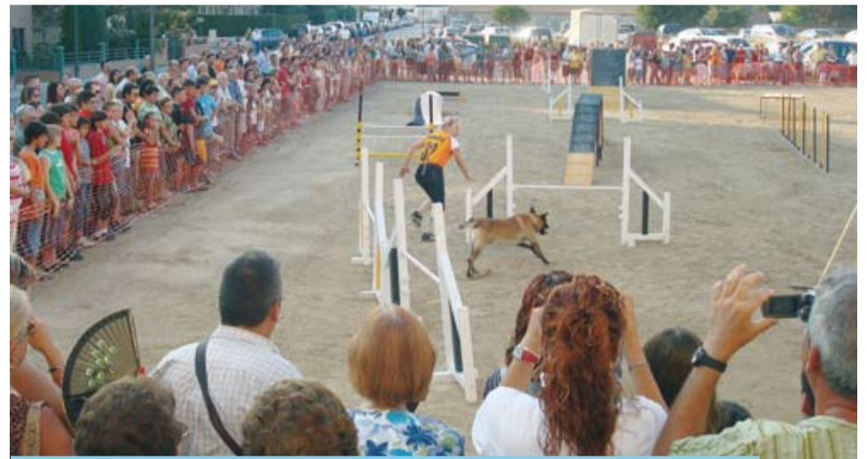
Els assistents van poder gaudir de la demostració d'Agility