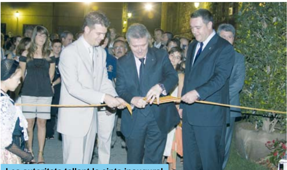
Les autoritats tallant la cinta inaugural