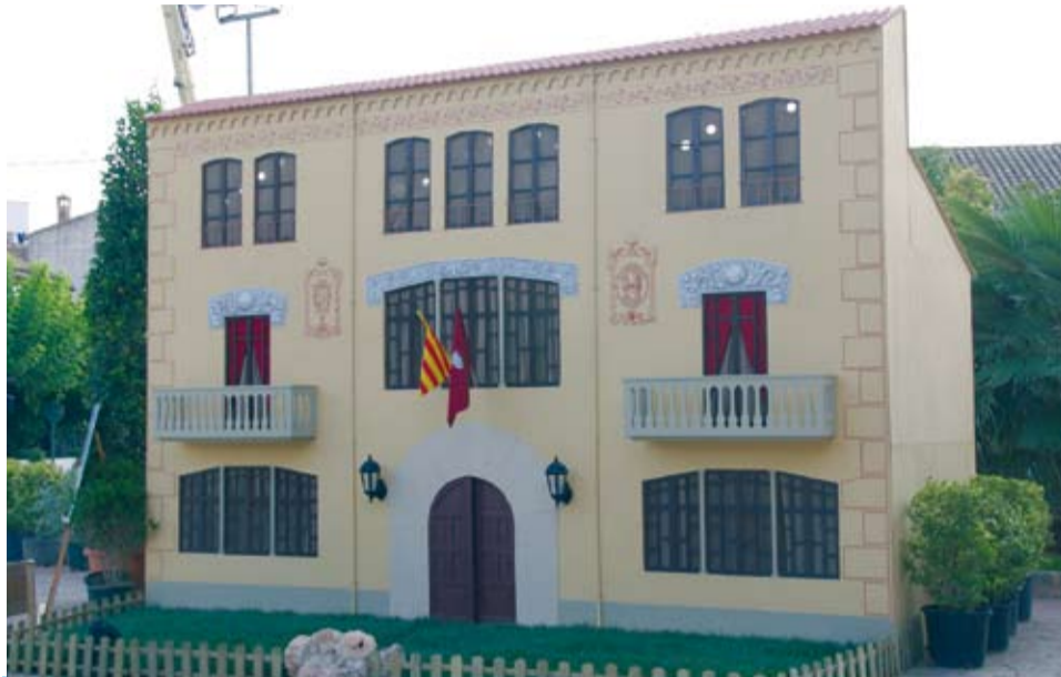
La façana de l'Ajuntament realitzada pels alumnes de l'Escola Taller

La Fira de Sant Llorenç i Fira de l'Avellana, permeten que Riudoms es converteixi, per uns dies, en centre d'atenció promocional i cultural de la comarca.