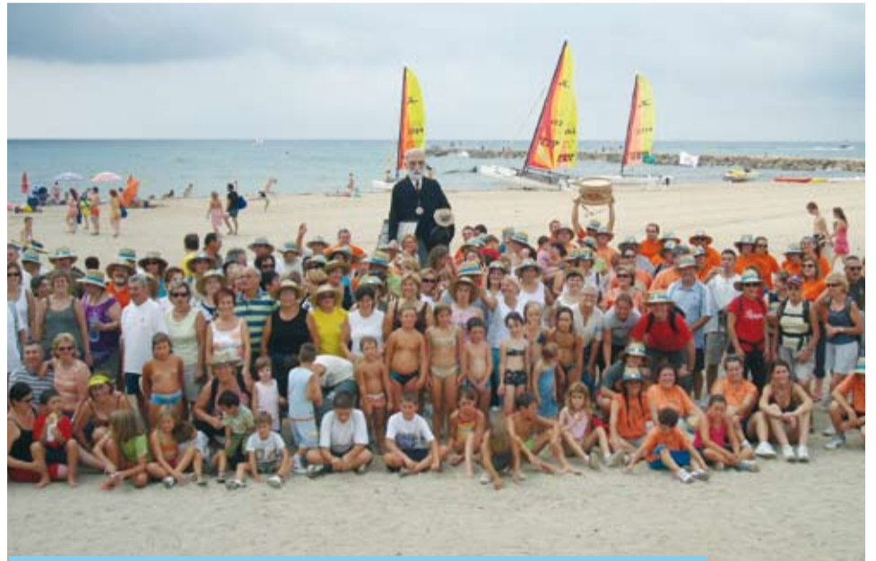
Els participants a l'"Anar a mar" a la platja de Cambrils