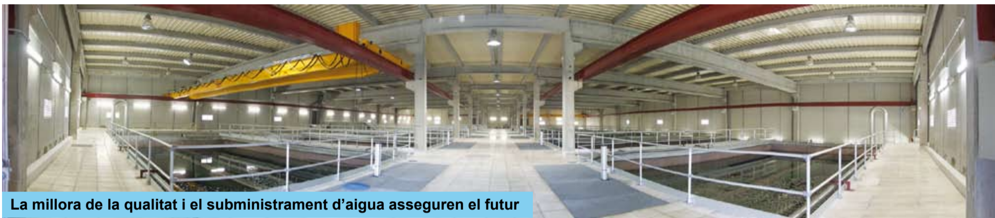
La millora de la qualitat i el subministrament d'aigua asseguren el futur

El Consorci d'Aigües de Tarragona (CAT), del que en forma part l'Ajuntament de Riudoms, ha realitzat importants obres de millora, valorades en més de 15 milions d'euros, que permetran assegurar la qualitat i l'arribada de l'aigua de l'Ebre al Camp de Tarragona.