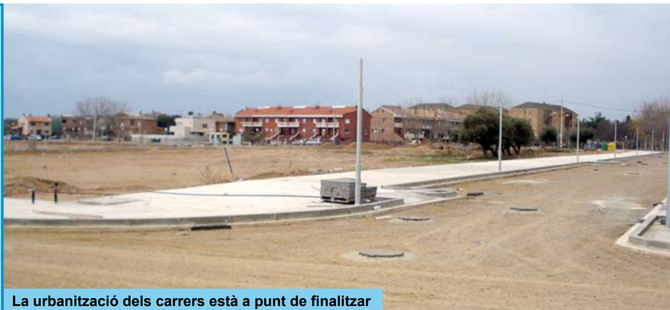
La urbanització dels carrers està a punt de finalitzar