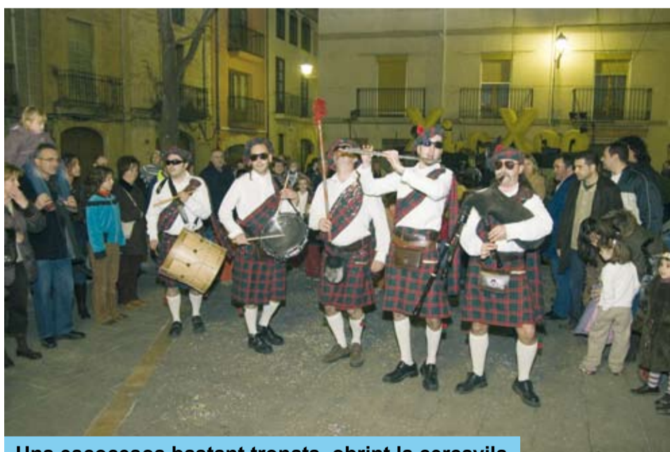
Uns escocesos bastant tronats, obrint la cercavila

Des de la Plaça de l'Om, va arrancar la cercavila musical que encetava la Xa Trobada de Sacaires, a càrrec dels McKensy's Clan Band que, vestits a l'estil escocès, van encomanar el seu ritme al nombrós grup de riudomencs que van seguir-los pels carrers del centre, mentre feien simpàtiques malifetes als comerços que es trobaven al seu pas. A la Plaça de l'Església van cloure la cercavila amb una sonora escenificació escocesa.