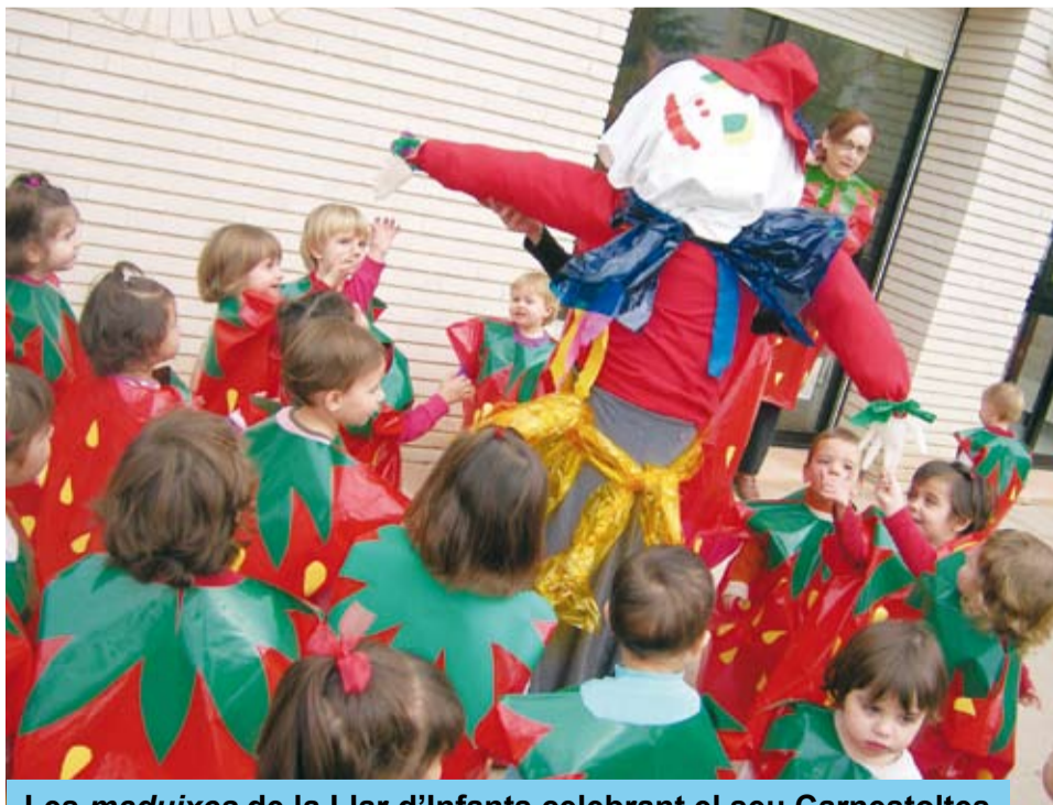
Les maduixes de la Llar d'Infants celebrant el seu Carnestoltes

El divendres 1 de febrer, a la Llar d'Infants Picarols, també es va celebrar el Carnaval. Des de feia dies les educadores preparaven l'arribada del Carnestoltes, tot empolainat i ple de coloraines. Els infants van cantar i ballar la seva cançó tot esperant el dia de la festa en que estrenarien la disfressa. Enguany la disfressa va ser "de maduixes". Les educadores havien organitzat un Taller de disfresses en què les famílies havien pogut confeccionar-les. Aquestes activitats milloren la relació amb les educadores.