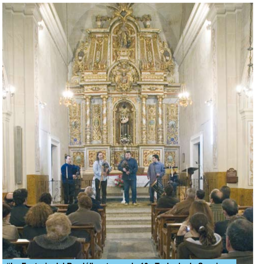
"La Factoria del Bordó" va tancar la 10a Trobada de Sacaires

A les sis de la tarda, la formació "La Factoria del Bordó", de la que en són integrants alguns professors d'instruments tradicionals catalans, van omplir l'ermita de Sant Antoni per gaudir d'un repertori de peces catalanes interpretades amb diversos instruments tradicionals, entre els quals no podia faltar el protagonista de la nostra trobada: el sac de gemecs. Entre peça i peça, es va fer la explicació de l'origen i la història de les cançons interpretades.