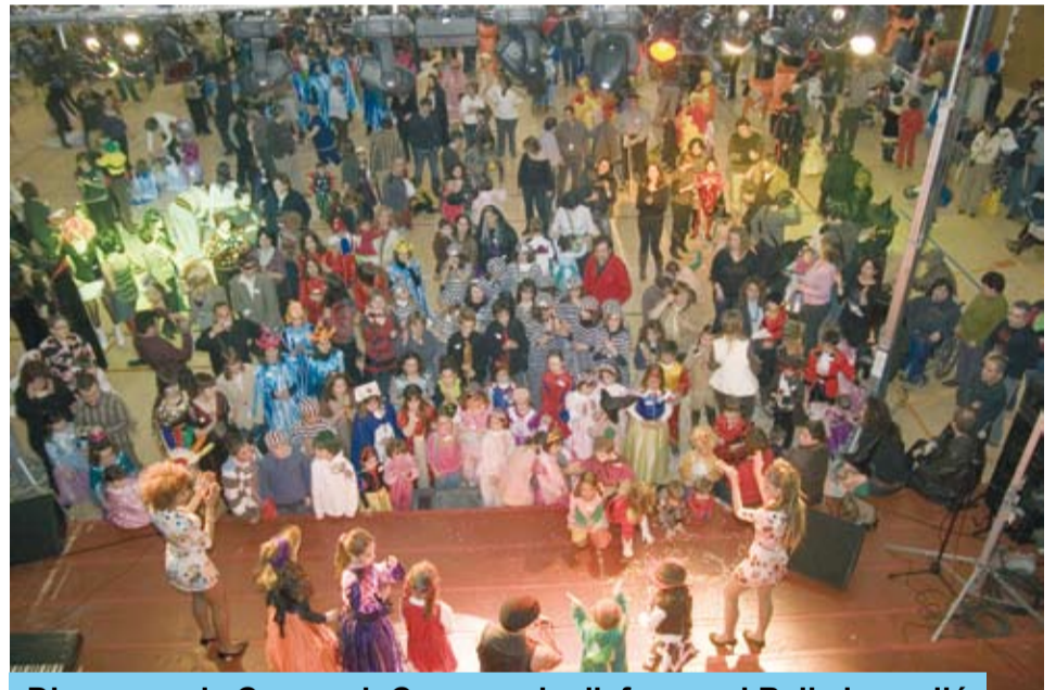
Diumenge de Carnaval: Concurs de disfresses i Ball al pavelló

El Diumenge de Carnaval es va tornar a omplir el pavelló. Un miler de persones van ballar al ritme de la música i el punt àlgid va ser quan es van fer públics els guanyadors del Concurs de disfresses, en totes les seves modalitats. Els premis van ser diversos: des de jocs de sobretaula fins a lots d'embotits. Un any més, el Jurat ho va tenir complicat per emetre el veredict. Van fer constar la qualitat i originalitat de les disfresses, fet que contribueix a que la festa sigui encara més lluída.