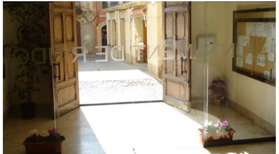
La nova porta automàtica millora la seguretat i l'estalvi energètic

Totes aquestes actuacions, a més a més de millorar la qualitat del servei, permetran oferir una imatge més actual de l'Ajuntament de Riudoms.