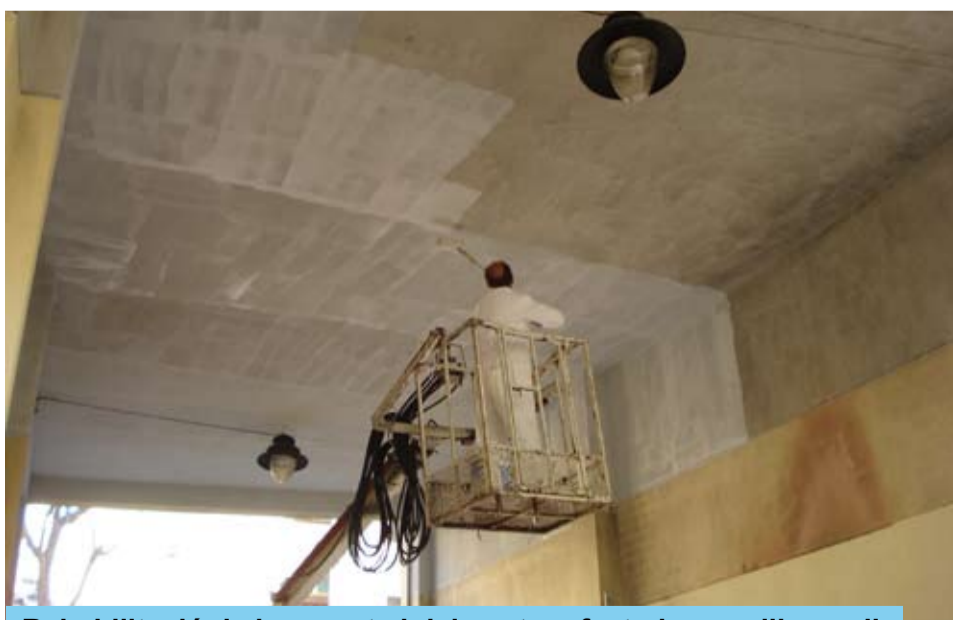
Rehabilitació de les parets i del sostre afectades per l'incendi

Una vegada finalitzada aquesta rehabilitació, el carrer de la Música torna a oferir l'aspecte adequat, com a important zona de comunicació pels veïns d'una part i altre del poble i, sobretot, com accés a l'Escola de Música.