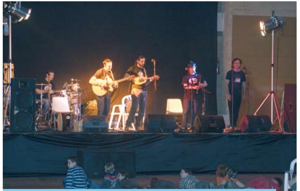
El pavelló va acollir el Concert de folk i el Ball amb orquestra

pas del copatró de Riudoms, que anava acompanyat d'una representació del Consistori i de la Banda de Música "la Principal de Riudoms", sota la direcció del mestre Josep Tell. En finalitzar la processó i reconfortats per un assolellat dia d'hivern, els grups de sacaires van oferir una exhibició musical a l'escenari de la Plaça de l'Església.