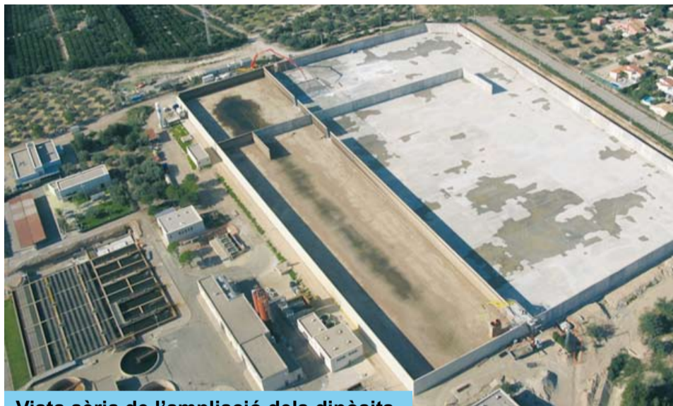
Vista aèria de l'ampliació dels dipòsits

Es tracta de disposar d'una reserva d'aigua crua, aquella que s'acumula abans d'iniciar els tractaments, de 175.000 m 3 (125.000 m 3 més dels actuals). Aquest dipòsit dóna una reserva de 12h de subministrament d'aigua a tot el Camp de Tarragona, millora l'aigua tractada i permet un estalvi econòmic.