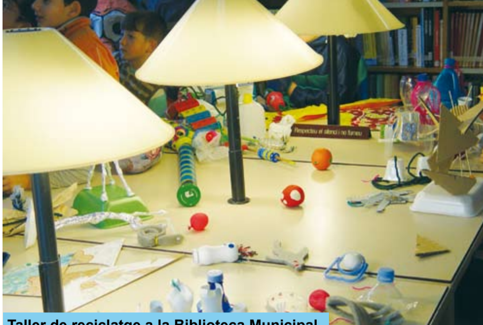
Taller de reciclatge a la Biblioteca Municipal

El dijous 10 de gener, a la Biblioteca Pública Municipal "Antoni Gaudí" es va dur a terme una activitat educativa dirigida als nens de l'aula d'acollida del CEIP Beat Bonaventura de Riudoms. L'activitat consistia en un taller de reciclatge on els monitors van ensenyar totes les possibilitats que es poden fer amb material de rebuig. Aquest taller va tenir molt bona acollida per tots els nens i nenes que en van participar i ells mateixos van crear diferents objectes amb el material de rebuig.