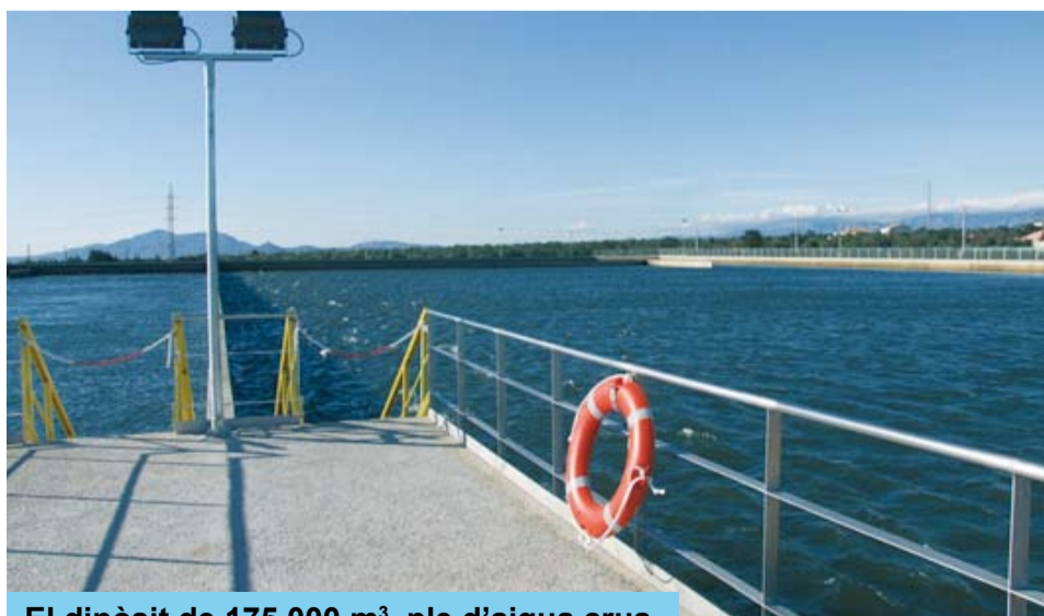
El dipòsit de 175.000 m 3 , ple d'aigua crua

El nou dipòsit ja està actualment en servei. Les obres s'han executat en dotze mesos, vuit menys dels vint establerts en el projecte i han costat 3,8 milions d'euros.