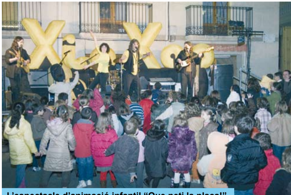
L'espectacle d'animació infantil "Que peti la plaça!"

Les campanes, que antigament eren l'únic mitjà per fer saber al poble que la Festa Major arrencava, van iniciar de la festa, dissabte 19, al punt del migdia.