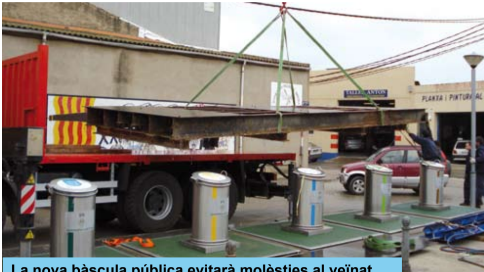
La nova bàscula pública evitarà molèsties al veïnat

Tot i així, la voluntat de l'Ajuntament és la de continuar oferint a Riudoms el Servei de Bàscula pública. És per això, que s'ha situat a un nou espai, més adient, per aquest servei. Després de diferents opcions, es va determinar que la Bàscula s'instal·lés al principal carrer del Polígon Industrial El Prat. Actualment, les obres estan molt avançades i ja s'ha traslladat la maquinària cap a la seva nova ubicació.