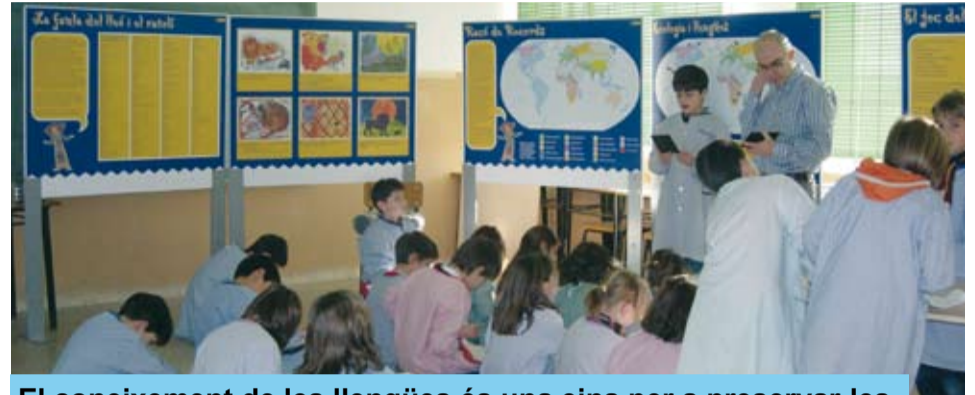
El coneixement de les llengües és una eina per a preservar-les

Diversos materials permeten visualitzar diferents alfabetos, mapes sobre la diversitat lingüística, contes en diverses llengües i poder establir paral·lelismes entre la desaparició de monuments històrics, espècies animals i vegetals i la desaparició de les llengües.