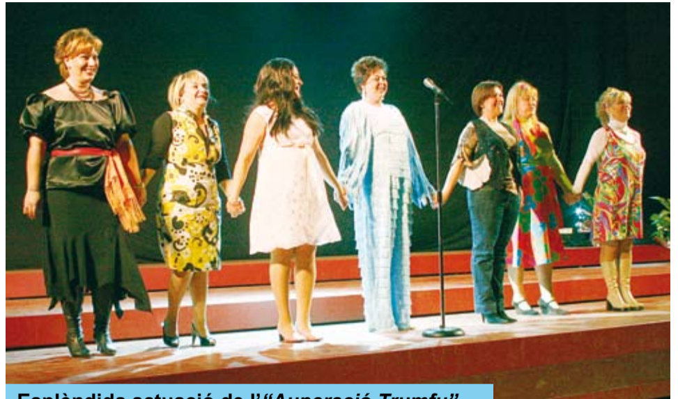
Esplèndida actuació de l'"Auperació Trumfu"

El divendres al vespre, el Pavelló d'Esports va ser l'escenari d'un espectacle que vol completar l'oferta de diversió carnavalesca, amb del Grup Independent d'Art: "Auperació Trumfu". Aquesta proposta neix amb la pretensió de ser un espectacle desenfadat i participatiu, on el play-back sigui l'eix d'una proposta local i de qualitat.