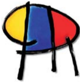
COOPERATIVA AGRÍCOLA RIUDOMS