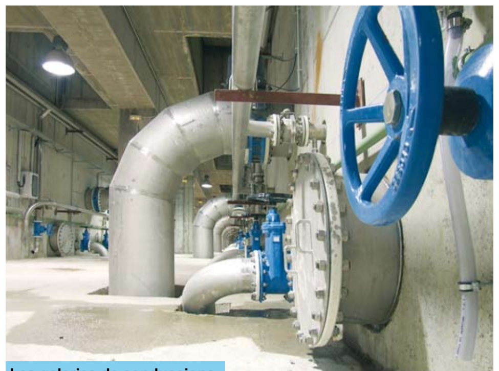
Les galeries de conduccions

Les obres s'han executat en el termini previst de dotze mesos i han costat 11,7 milions d'euros. El nou sistema de filtratge ja està actualment en funcionament.