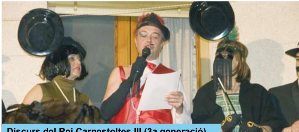
Discurs del Rei Carnestoltes III (3a generació)

La Comitiva del Carnaval, formada per gent diversa a títol individual, ha organitzat novament l'arribada i el funeral del Rei Carnestoltes. La Comitiva està oberta a tothom, amb voluntat de fer poble i de possibilitar noves propostes festives i atrevides.