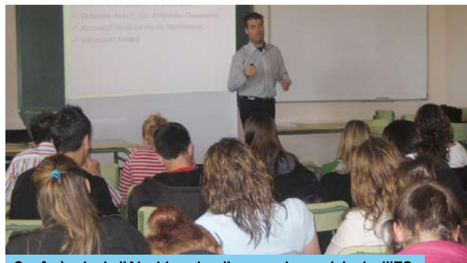
Conferència de l'Alcalde sobre l'economia municipal a l'IES

Es vol destacar que els joves van mostrar, en tot moment, molt d'interès en tot allò que se'ls mostrava i van acreditar la seva consciència, com a futurs contribuents, de l'existència de drets i deures, així com la importància de contribuir en el manteniment i preservació del patrimoni públic.