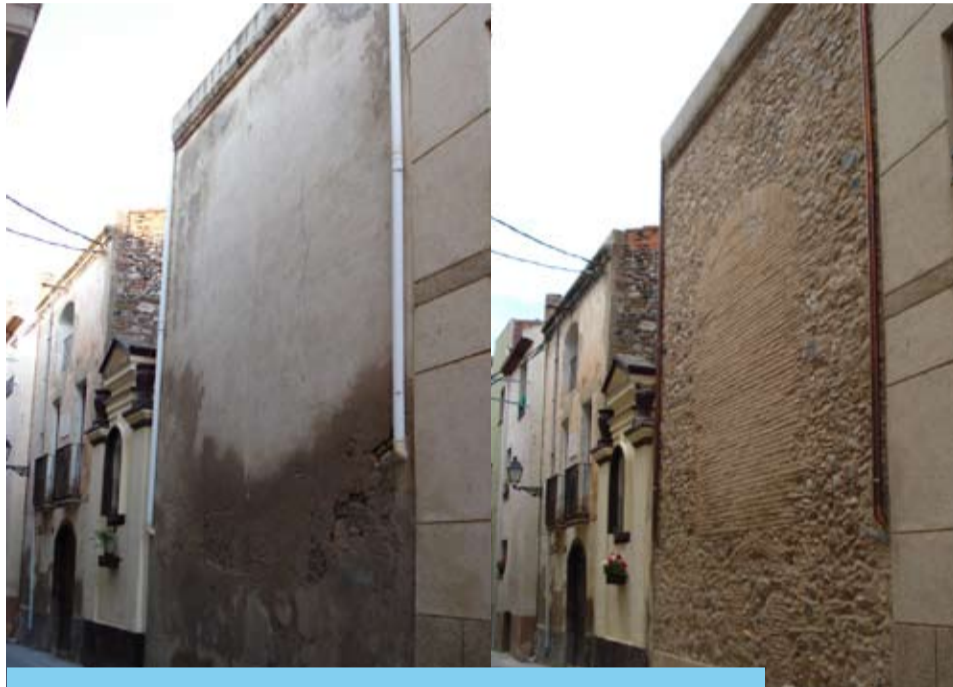
La façana posterior de Verge Maria, abans i després

Es va repicar l'antic morter degradat pel pas dels anys i va aparèixer l'antiga paret de pedra, amb les seves obertures originals i una estructura de totxo, posterior, que va servir per a crear la volta on, a l'interior de la capella, hi ha la imatge de la Verge Maria de Gràcia.