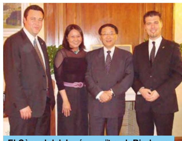
El Cònsol del Japó, agraït amb Riudoms

En aquesta ocasió hi havia un nou propòsit: estudiar la possibilitat d'impulsar iniciatives econòmiques i empresarials entre Riudoms i Japó. Amb aquest objectiu, el Consolat General del Japó convidarà l'Alcalde de Riudoms a participar en diferents actes organitzats per aquesta institució amb la finalitat d'actuar de pont d'unió entre Riudoms i empreses de capital japonès que estan implantades a Catalunya. També s'explorarà la possibilitat d'establir mecanismes per a facilitar l'exportació al Japó de productes locals.