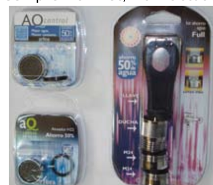
L'Ajuntament ofereix difusors per a l'estalvi d'aigua

Durant el període de sequera es va reduir el consum fins a 111 litres diaris per persona, la qual cosa representa un estalvi del 22% respecte els anys anteriors i fins i del 36% respecte l'any 2004.