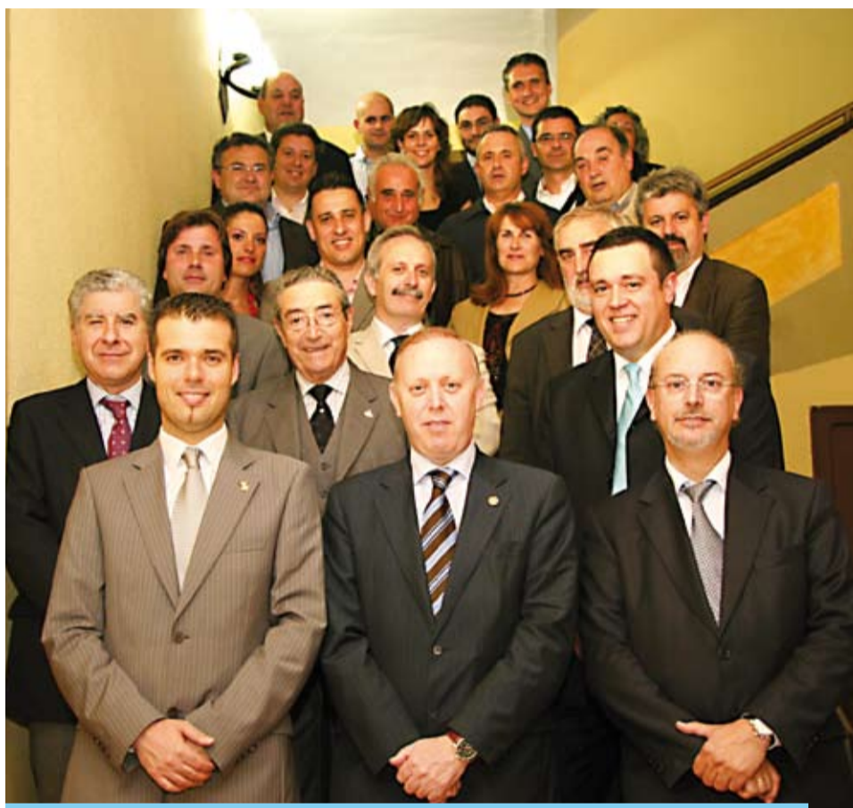
Trobada entre la Cambra de Comerç i l'empresariat riudomenc

Aquests contactes sempre han servit per a analitzar les dificultats més habituals en que es troben les empreses i buscar sinèrgies entre les dues institucions i fer actuacions conjuntes davant de les administracions implicades en la resolució. Per posar un exemple, fruit d'aquestes actuacions