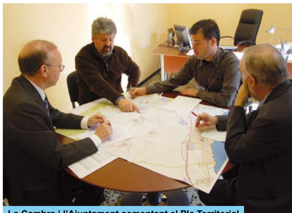
La Cambra i l'Ajuntament comentant el Pla Territorial

s'ha aconseguit que la Generalitat de Catalunya estudiï la problemàtica de la carretera de Riudoms a Reus a l'hora d'enllaçar-se amb la variant.