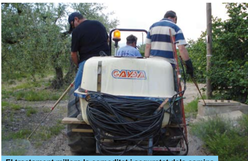
El tractament millora la comoditat i seguretat dels camins

Durant aquesta primavera els operaris de la Brigada han fet un tractament herbicida als camins municipals.