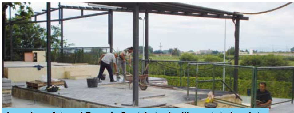
Les obres fetes al Parc de Sant Antoni milloren tot el recinte

El recinte de Sant Antoni és un dels espais d'oci de més tradició al nostre poble. Banyar-se a la piscina, refrescar a l'ombra dels plataners, participar d'alguna trobada, festa, espectacle o ball és un costum que reuneix molts veïns durant l'època més calorosa.