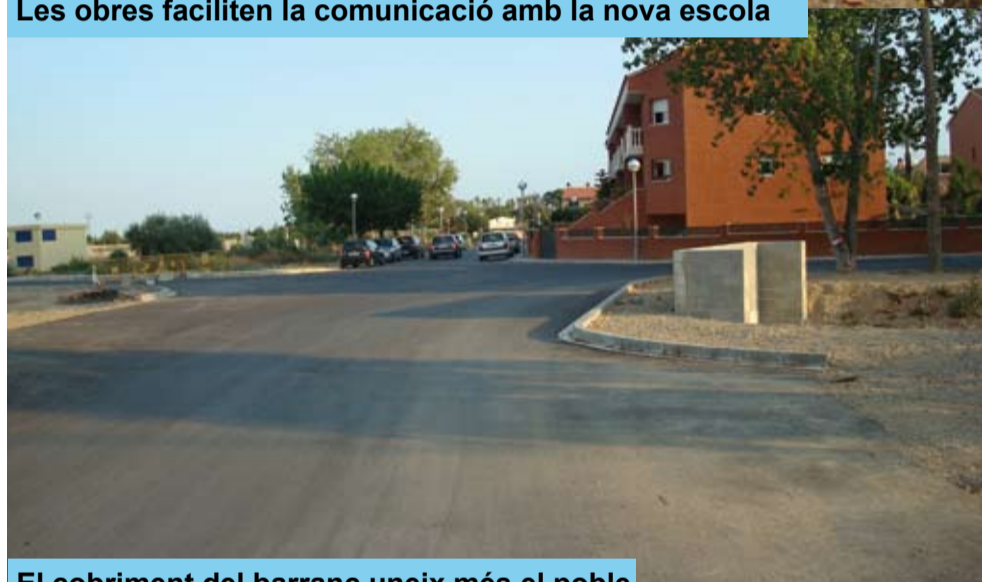
El cobriment del barranc uneix més el poble