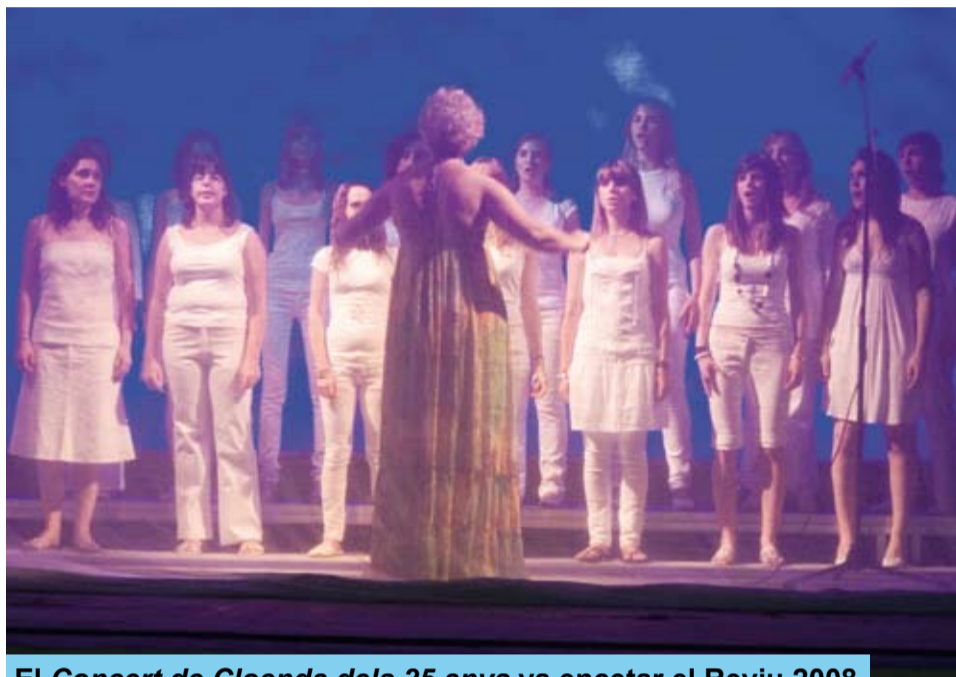
El Concert de Cloenda dels 25 anys va encetar el Reviu 2008

Les propostes d'enguany es van encetar a la Plaça de Sant Antoni, amb un aniversari molt significatiu: el Concert Extraordinari de Cloenda de la celebració dels 25 anys de l'Escola Municipal de Música de Riudoms. Antics i actuals alumnes de l'Escola van dur a terme un espectacle musical i escènic que va servir per a fer un repàs en clau sentimental a tots els anys d'existència de l'Escola de Música.