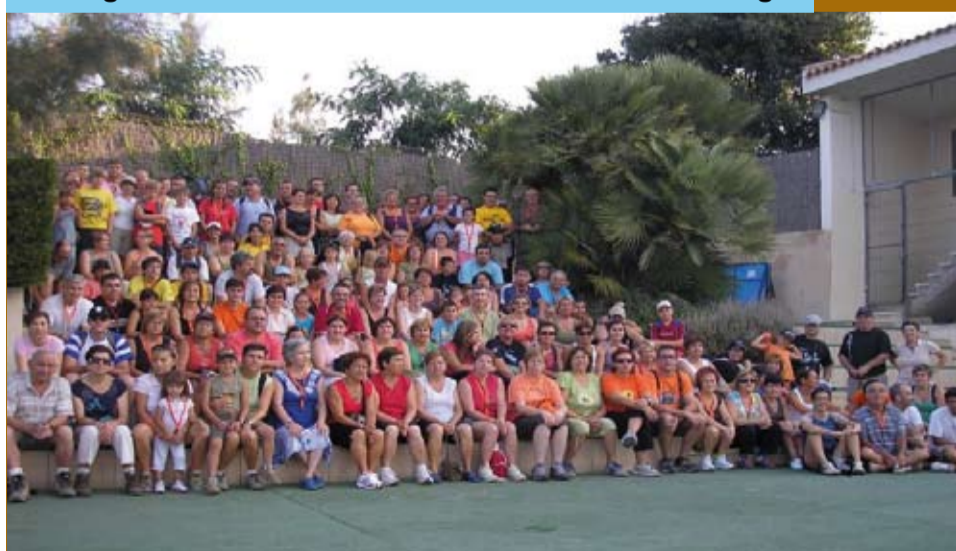
L'Anar a Mar, és la recuperació d'una antiga tradició riudomenca