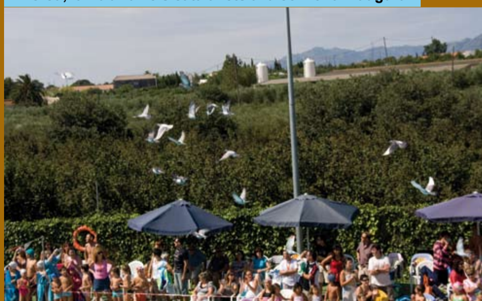
Més de 250 coloms missatgers es van repartir per tot Catalunya