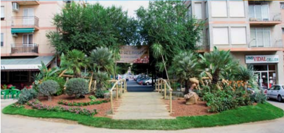
Entrada al Recinte Firal dissenyat per Vivers i Jardineria Jordis