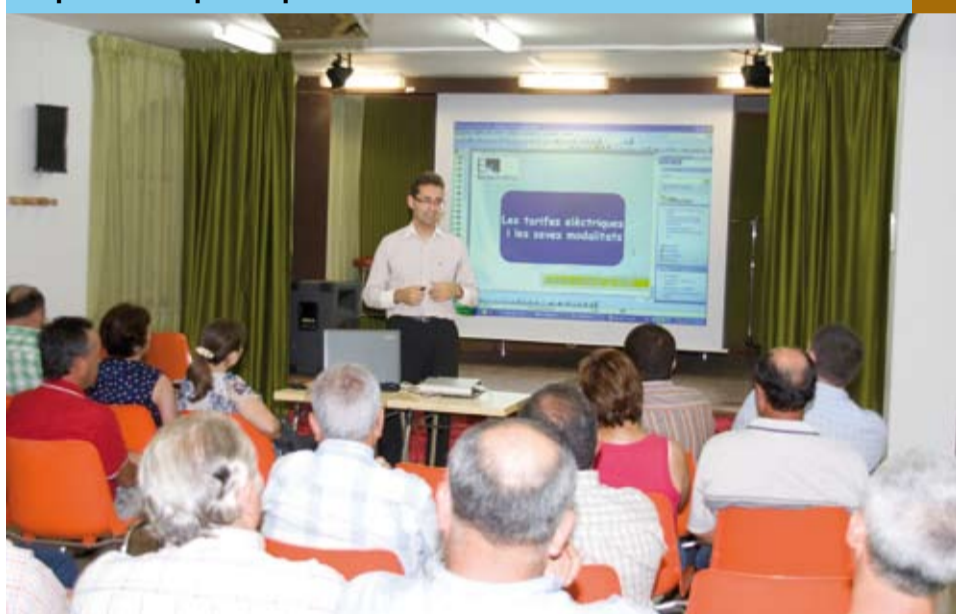
Les Jornades Tècniques formen i informen el sector