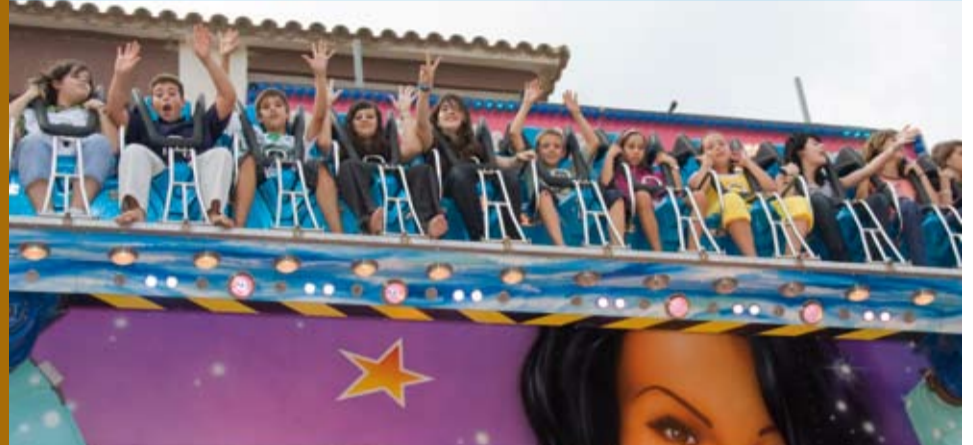
La Fira és un dels grans moments per als més joves riudomencs