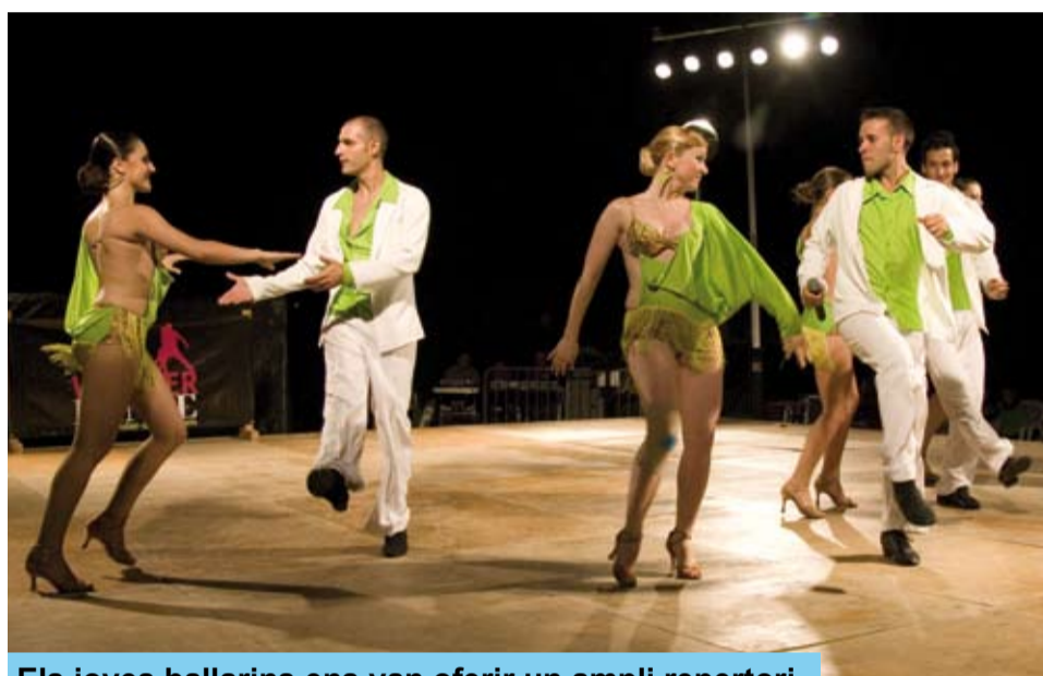
Els joves ballarins ens van oferir un ampli repertori

través de propostes culturals i d'entreteniment que volen generar emocions, sensacions, pensament divers i opinió. Aquests poden ser alguns objectius dels molts que es poden atribuir al fet cultural, emfatitzats pel context de l'estiu, l'època de l'any en la que la llargària del dia sembla fer més dilatades les hores dedicades al nostre gaudi personal i més plaents i tranquil·les les activitats que ens dediquem a nosaltres mateixos.