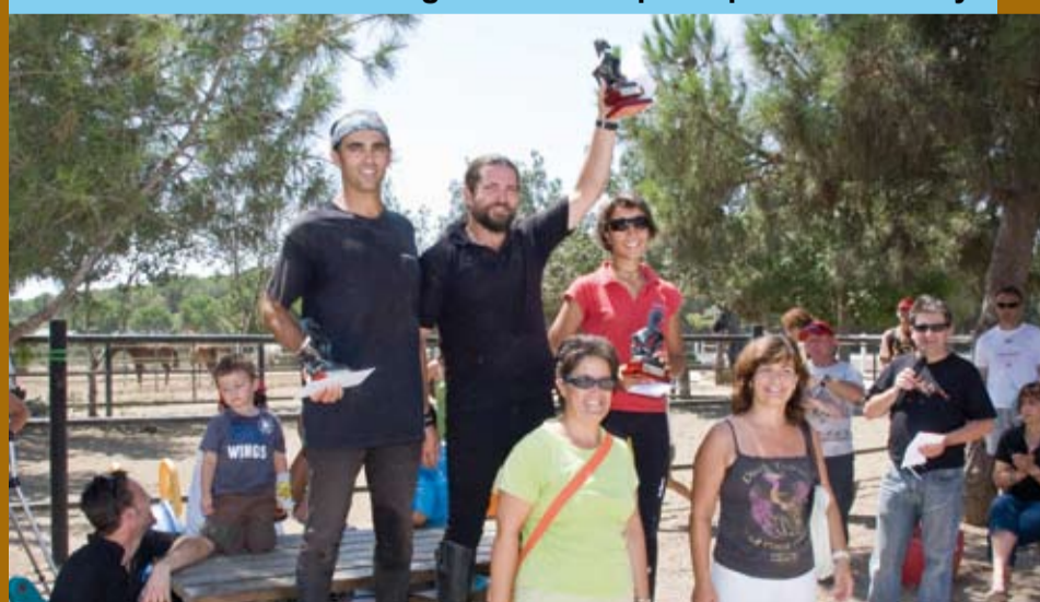
Quadres Julivert organitza la Cursa de Cavalls de la Fira