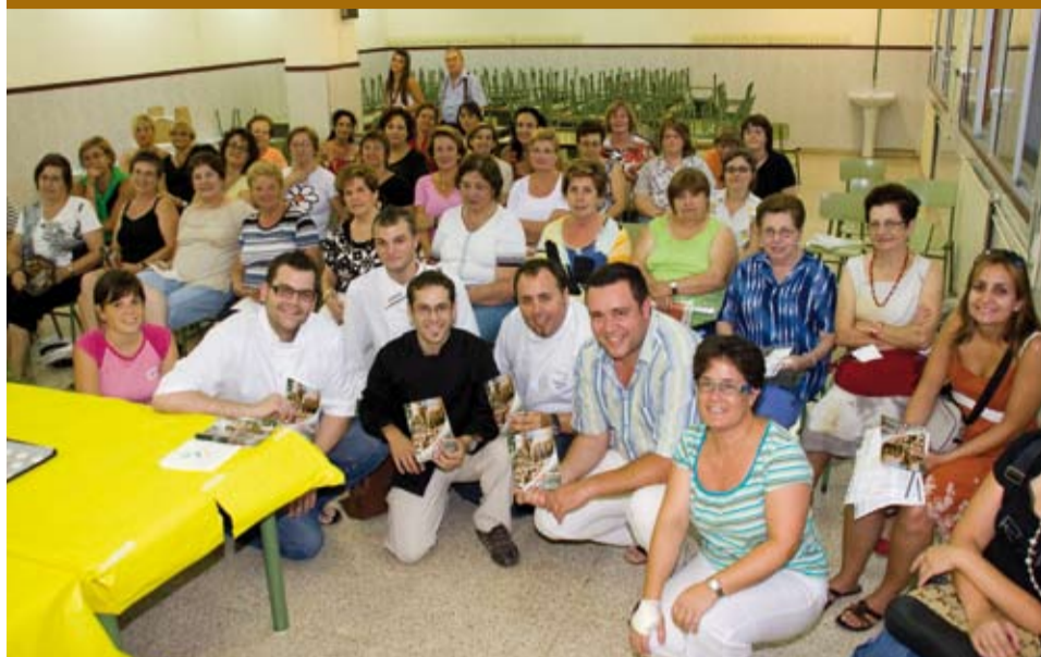
50 persones participaren del 12è Curs de la Cuina de l'Avellana