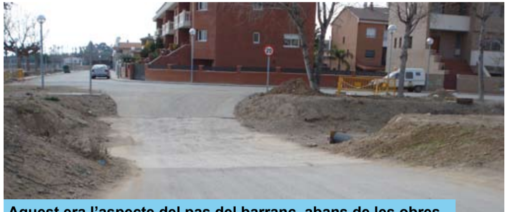
Aquest era l'aspecte del pas del barranc, abans de les obres