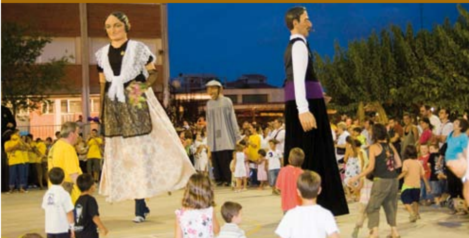
La Colla Gegantera fent ballar els nous gegants a la Fira