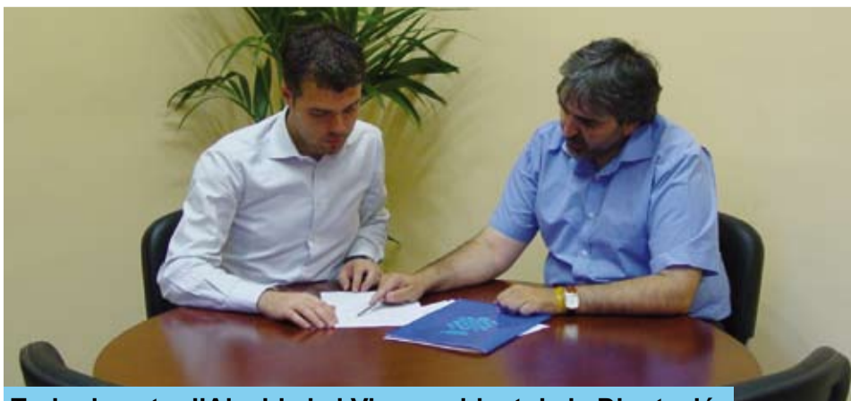
Trobada entre l'Alcalde i el Vicepresident de la Diputació

En una primera part de la reunió es va repassar com es troba actualment la feina per a fer nova la carretera de Riudoms a Vinyols. Pel que va confirmar el Vicepresident, actualment ja s'han firmat molts acords amb els propietaris afectats per la millora del traçat de la carretera, tant de Riudoms com de Vinyols, i aquests darrers dies està previst poder signar els documents amb els darrers propietaris.