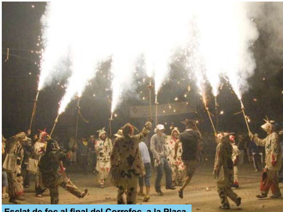
Esclat de foc al final del Correfoc, a la Plaça

Durant els dos dies de les Ulé Barraques es van dur a terme en el recinte altres activitats a càrrec de les entitats que configuraven la Comissió de Barraques, com un partit de handbol, una ballada de gegants i una exhibició de hip-hop, a més d'un espectacle d'animació que la Regidoria de Festes hi va ubicar. L'afluència de públic al recinte va ser destacada ambdós dies.