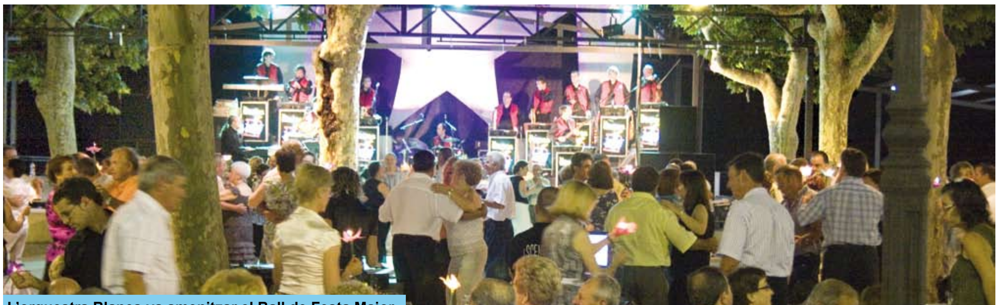
L'orquestra Blanes va amenitzar el Ball de Festa Major