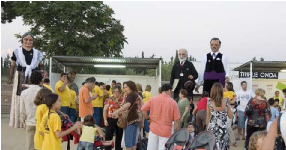
Les entitats molt implicades en la primera edició de les Barraques

La Festa Major d'un municipi és la que, per tradició, se celebra en honor al seu patró, una a l'hivern i l'altra a l'estiu, i acostuma a ser la més lluïda i concorreguda de totes. Ara bé, a Riudoms, la Festa Major de Sant Jaume té una digna competidora que, sense ànims de prendre-li protagonisme ni rellevància, ostenta conjuntament amb la Festa Major el títol de celebració més reeixida de l'estiu. Estem parlant de la Festa dels Barris que, a poques setmanes de la Festa Major, escalfa els motors dels riudomenques i riudomenques de cara a totes les festes de l'estiu.