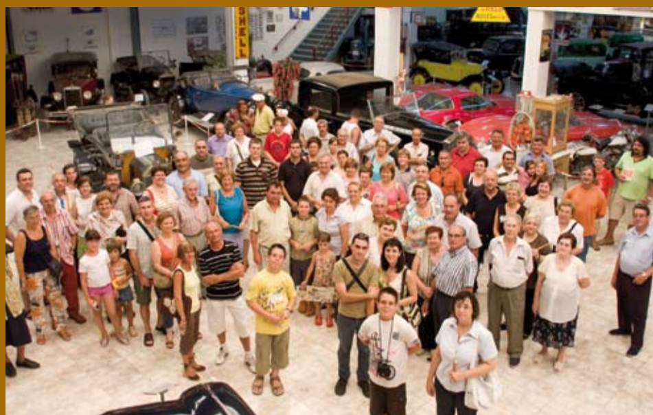
Visita a les Caves i Museu de Cotxes d'Època Marc Vidal