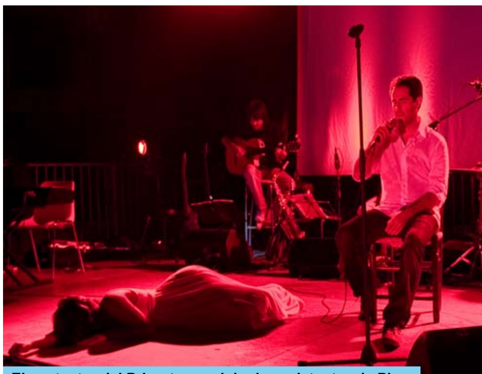
El cantautor del Priorat va seduir els assistents a la Plaça

La Plaça de la Palmera va acollir, el dimecres 16, la formació Wonder Dance amb un espectacle en el que els balls de saló eren els protagonistes, des de ritmes actuals fins als ritmes clàssics més intemporals.