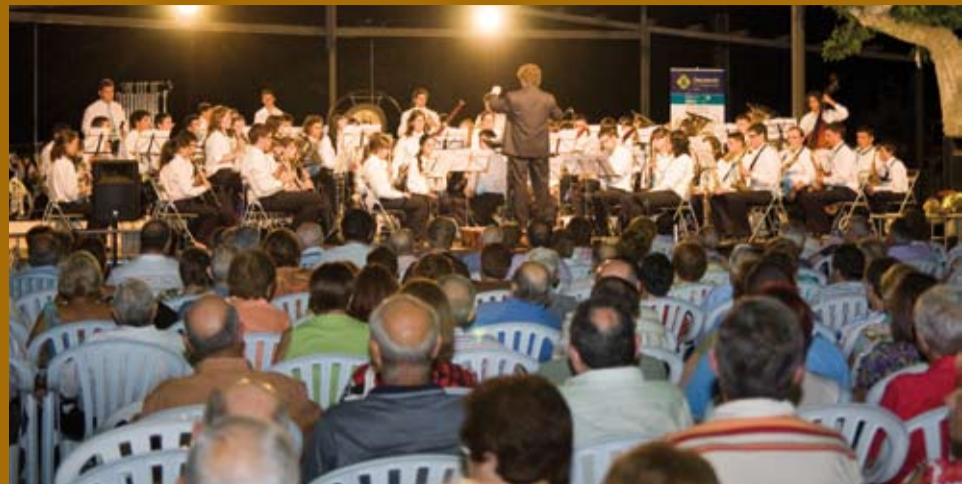
Concert de Cloenda, amb més de 70 músics de la Banda de Valga