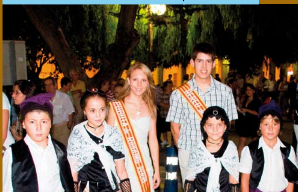
L'Hereu, la Pubilla i els catalanets a la comitiva inaugural