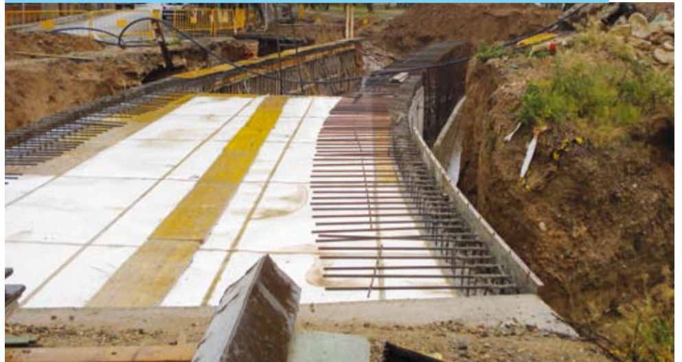
Les obres faciliten la comunicació amb la nova escola