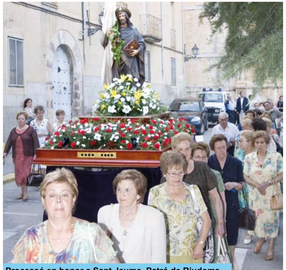
Processó en honor a Sant Jaume, Patró de Riudoms

L'endemà, dia de Sant Jaume, es van dur a terme els actes litúrgics de rigor, com la Missa en honor al patró i la processó pels carrers del centre de la vila, per donar pas, a continuació, a l'obertura de l'espai de les Ulé