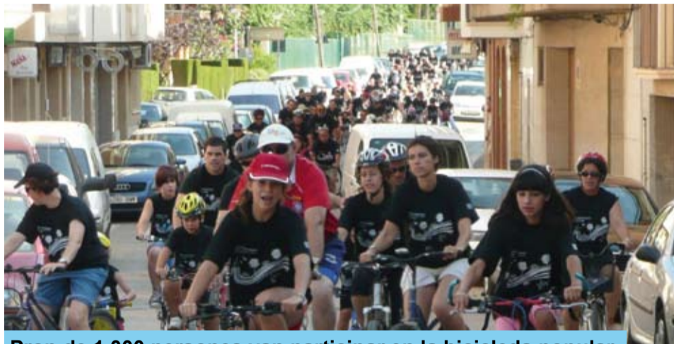
Prop de 1.000 persones van participar en la bicicleada popular

Altres actes que van donar-se en el marc de la Festa Major van ser les terceres 16 hores de petanca, a càrrec del Club Petanca la Masia de Riudoms i la revetlla de l'Associació de Jubilats i Pensionistes.