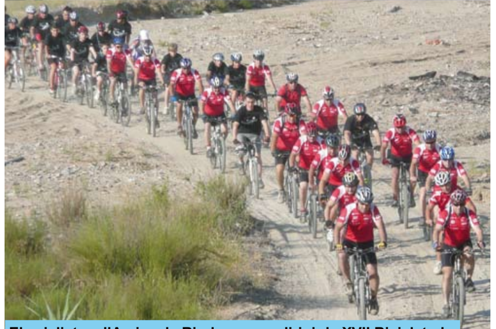
Els ciclistes d'Amics de Riudoms van dirigir la XVII Bicicletada