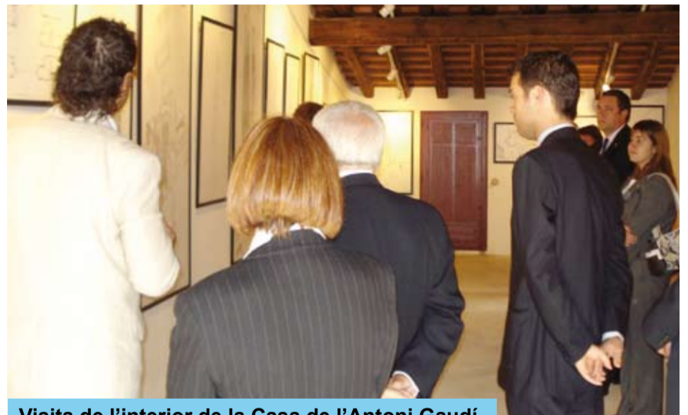
Visita de l'interior de la Casa de l'Antoni Gaudí

En aquest sentit, el Patronat Municipal de Turisme i Comerç de Reus vetllarà perquè hi hagi material informatiu de l'Epicentre Gaudí de Riudoms a l'Oficina de Turisme del Gaudí Centre. De la mateixa manera, la Regidoria de Cultura de Riudoms disposarà de material promocional del Gaudí Centre a l'Epicentre Gaudí.