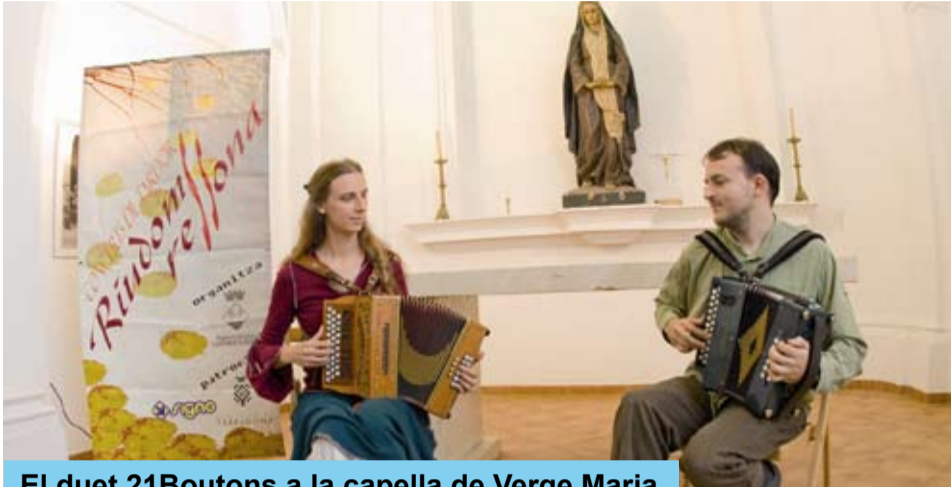
El duet 21Boutons a la capella de Verge Maria

El programa del Cicle de concerts de tardor de Riudoms, el Riudoms Ressona, ha comptat enguany amb tres propostes que novament han girat al voltant dels eixos que motiven la pròpia existència del cicle: la promoció d'autors locals o vinculats amb la vila, el coneixement d'instruments singulars i els muntatges que siguin representatius d'una època o d'un estil determinat, sempre des de la perspectiva de la qualitat i el compromís amb el públic.