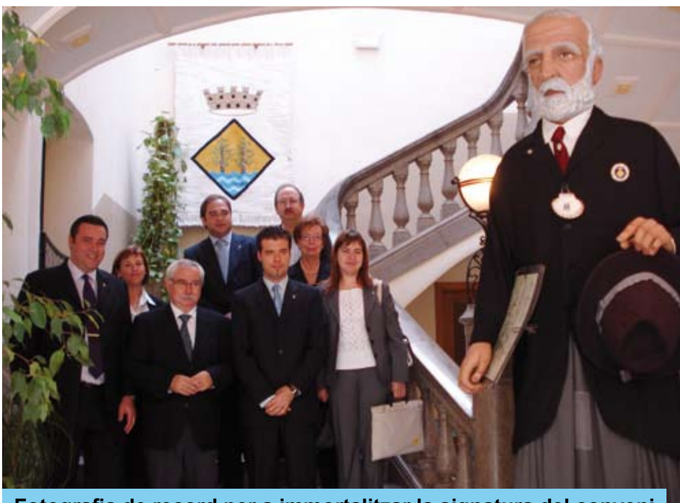
Fotografia de record per a immortalitzar la signatura del conveni

Així, Reus i Riudoms col·laboraran en la promoció turística dels equipaments que cadascun dels municipis ha dedicat a la figura de l'arquitecte Antoni Gaudí.