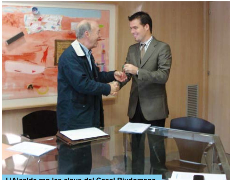
L'Alcalde rep les claus del Casal Riudomenc

Tots estareu d'acord que, en el context econòmic actual, no seria prudent afrontar a la vegada, les obres d'adaptació del Casal Riudomenc i les de construcció de la Sala Polivalent .