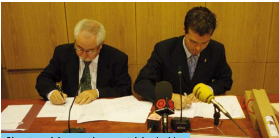
Signatura del conveni per part dels alcaldes

Les accions contingudes en aquest conveni, relatives a la promoció conjunta de Gaudí des de l'Epicentre Gaudí de Riudoms i el Gaudí Centre de Reus, aniran prenent forma durant els propers mesos.