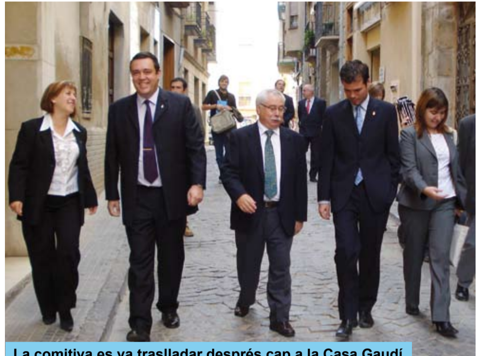
La comitiva es va traslladar després cap a la Casa Gaudí

En aquest sentit, el Patronat Municipal de Turisme i Comerç de Reus vetllarà perquè hi hagi material informatiu de l'Epicentre Gaudí de Riudoms a l'Oficina de Turisme del Gaudí Centre. De la mateixa manera, la Regidoria de Cultura de Riudoms disposarà de material promocional del Gaudí Centre a l'Epicentre Gaudí.