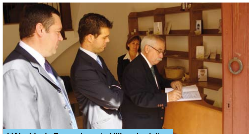
L'Alcalde de Reus, signant el llibre de visites

Així mateix, la pàgina web del Gaudí Centre comptarà amb un nou enllaç al web de l'Ajuntament de Riudoms per millorar el coneixement d'aquest espai riudomenc dedicat a Gaudí i viceversa.