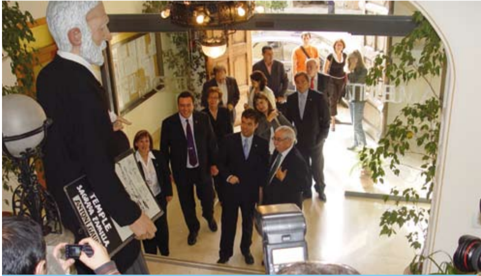
El gegant Gaudí rebrent les autoritats al vestíbul de l'Ajuntament

L'acord no modifica el convenciment dels riudomencs de que l'Antoni Gaudí va nèixer a Riudoms, però deix al marge aquesta discussió amb Reus i busca els punts d'unió entre les dues poblacions.