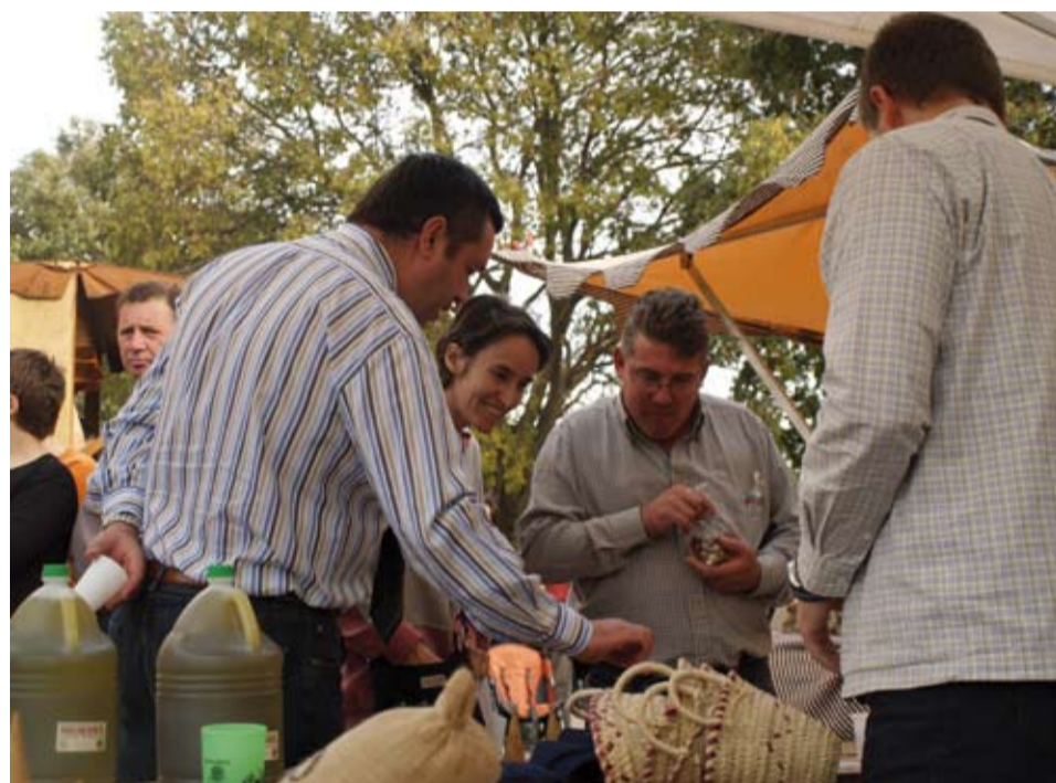
El visitants de la Fira de Brunyola es van interessar per Riudoms

La tornada d'aquest agermanament serà durant la propera Fira de l'Avellana de Riudoms, que tindrà lloc els dies 7, 8 i 9 d'agost de 2009.