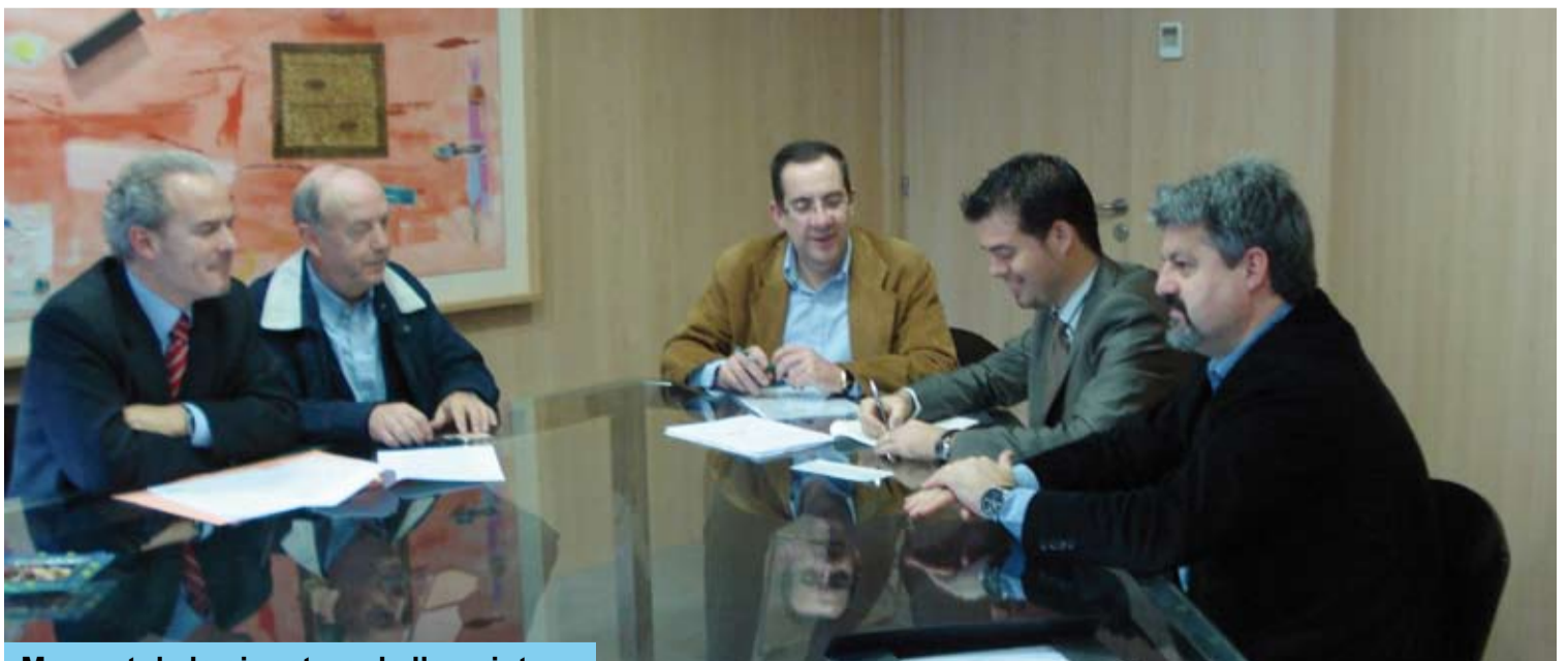
Moment de la signatura de l'escriptura

Com m'heu sentit dir en diferents ocasions, els dos equipaments són perfectament compatibles i un, no exclou pas l'altre.