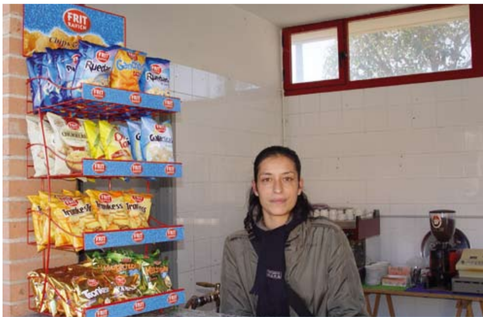
El bar del camp de futbol complementa aquests espais municipals

El telèfon de contacte és el 695.031.742