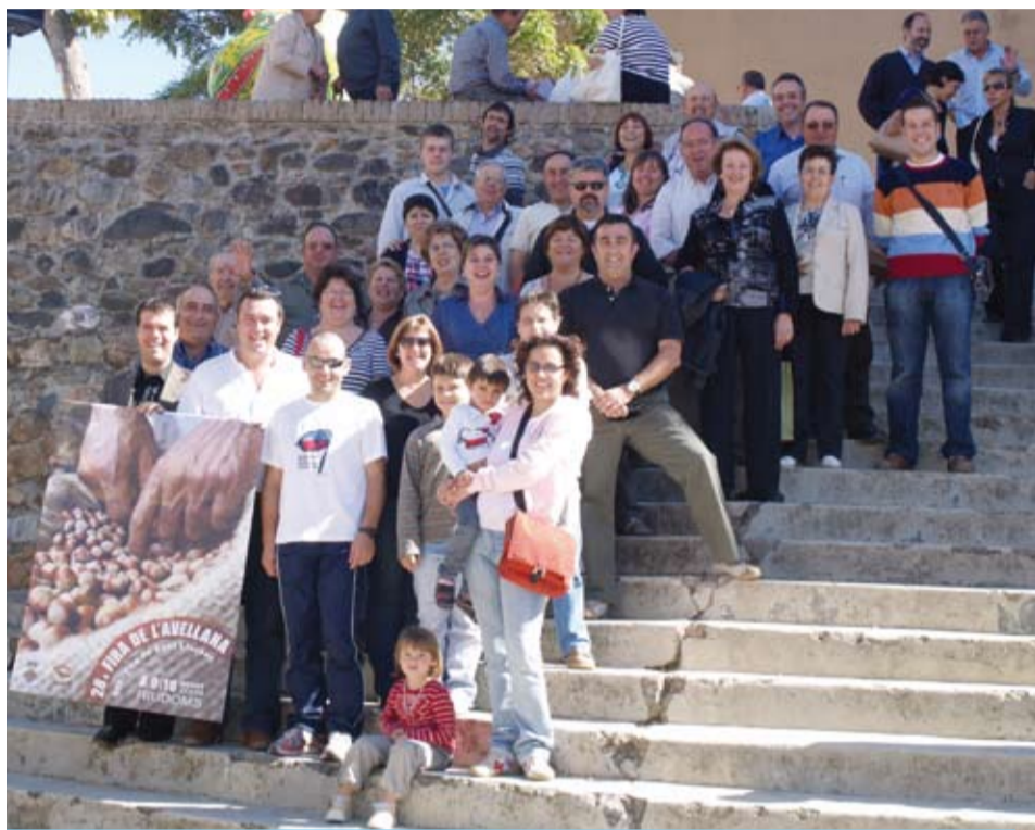
Delegació riudomenca que es va desplaçar a la Fira de Brunyola

Així, la primera part d'aquest agermanament ha consistit en la presència d'una representació de riudomencs a la 14a Fira de l'Avellana de Brunyola, on vam promocionar Riudoms, la nostra Fira i els productes locals, que van tenir una molt bona acceptació entre els visitants de les comarques gironines.