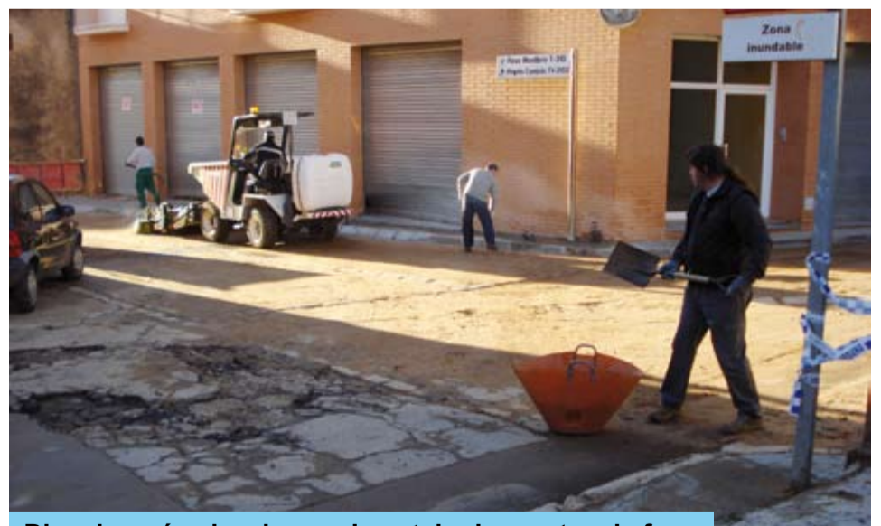
Dies després s'acabaren de netejar les restes de fang

Tot i que encara s'estan analitzant, els costos derivats d'aquest episodi de pluges han estat quantiosos.