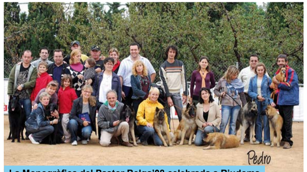
La Monogràfica del Pastor Belga'08 celebrada a Riudoms

Durant el cap de setmana de l'11 i 12 d'octubre de 2008 el Club d'ensinistrament caní Tossuts de Riudoms ha organitzat una Monogràfica del Pastor Belga on han participat gossos d'aquesta raça de tot l'estat.