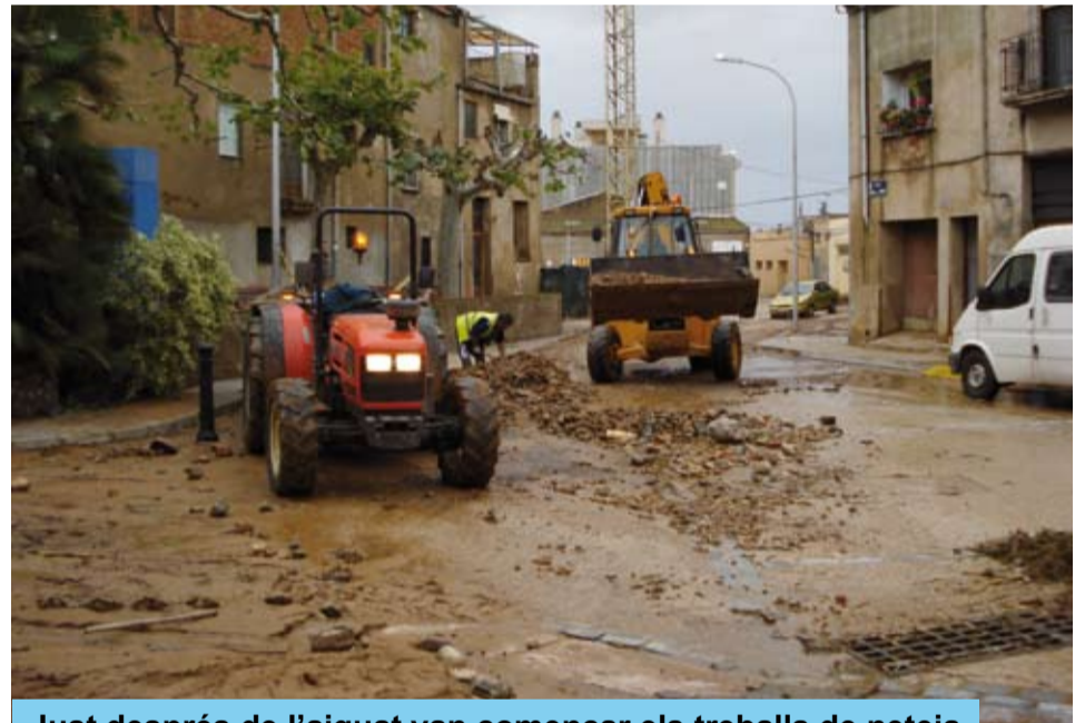
Just després de l'aiguat van començar els treballs de neteja

Els desperfectes podrien haver estat molt més importants, però davant la previsió de pluges l'Ajuntament havia netejat el barranc aigües amunt per tal d'evitar que les canyes i la vegetació embocessin els tubs soterrats. Aquesta actuació de prevenció va reduir els danys que s'haurien causat en cas de no portar-se a terme.