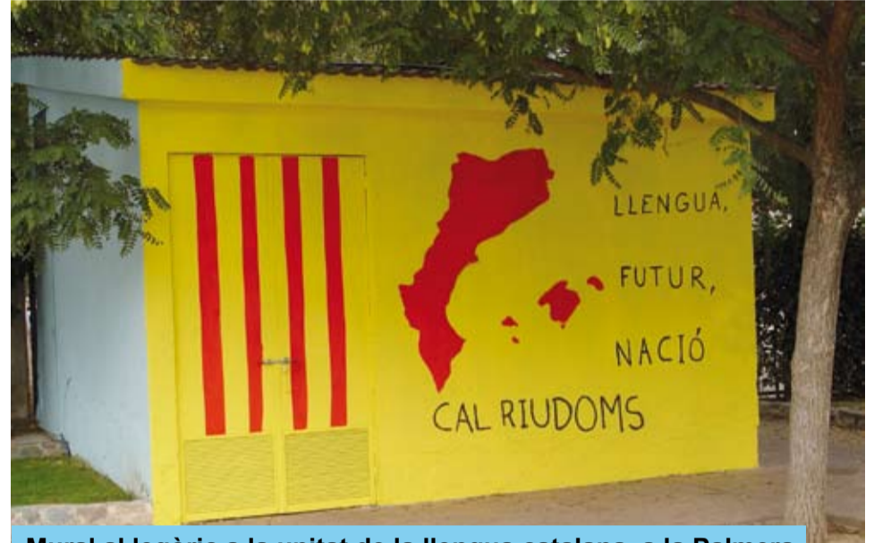
Mural al·legòric a la unitat de la llengua catalana, a la Palmera

Durant el pas del Correllengua 2008 pel poble de Riudoms, entre el 17 i el 25 d'octubre, diverses entitats i col·lectius locals, coordinades per la CAL Riudoms, com el Casal Popular La Calderera, el CERAP, la Colla de Diables, l'AMPA del CEIP Cavaller Arnau i les regidories de Política Lingüística i de Cultura han col·laborat en els diferents actes.