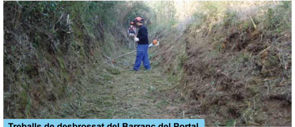
Treballs de desbrossat del Barranc del Portal

Les fortes pluges de la primera nit de novembre van causar importants desperfectes en diferents parts del terme municipal.