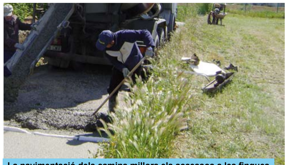
La pavimentació dels camins millora els accessos a les finques

La col·laboració conjunta, durant els darrers anys, entre els propietaris de les finques, l'Ajuntament de Riudoms i puntualment d'altres administracions públiques, fa que Riudoms disposi d'una de les xarxes de camins agrícoles més àmplia i més ben conservada de tot el Camp de Tarragona.