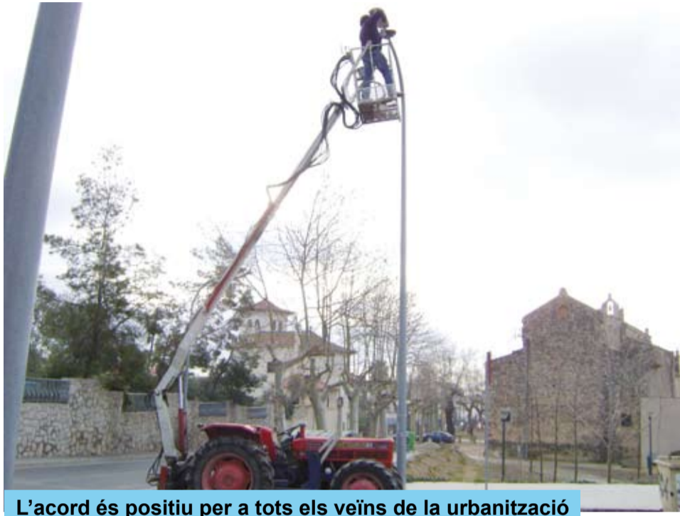
L'acord és positiu per a tots els veïns de la urbanització

Mitjançant la consecució d'un acord entre l'ajuntament de Riudoms i els veïns dels carrers de La Solana i de Mas Libori, la Brigada Municipal ha portat a terme unes obres en la xarxa d'enllumenat elèctric que ha permès adequar-la a la normativa actual.