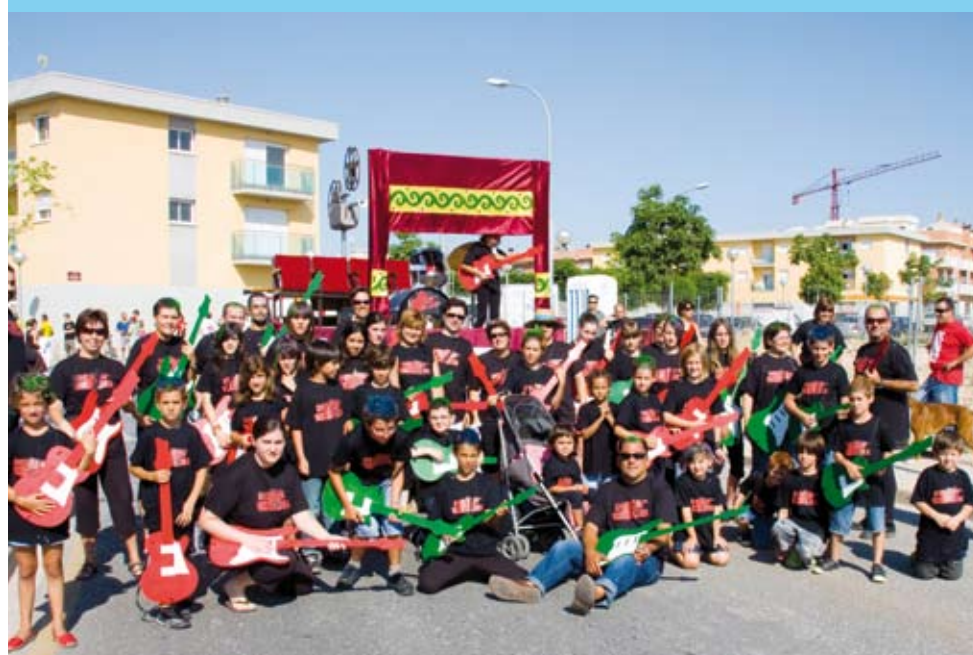
Barri del Colomer