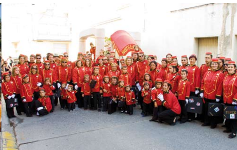
Barri de la Raval