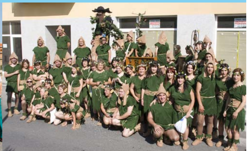
Barri de Sant Sebastià