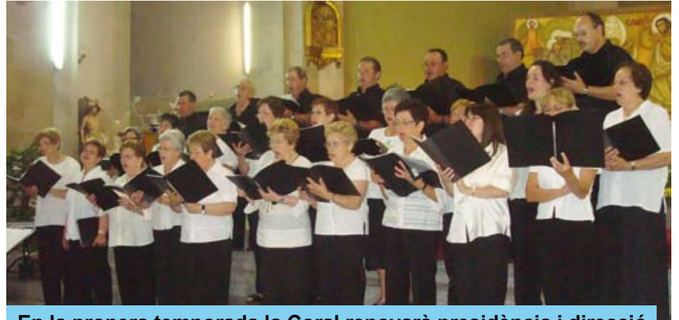
En la propera temporada la Coral renovarà presidència i direcció

La Coral Dolça Catalunya de Riudoms i la Coral del Pla de Santa Maria van actuar en el Concert de Fi de Curs, que va tenir lloc diumenge 28 de juny, a l'Església de Riudoms.