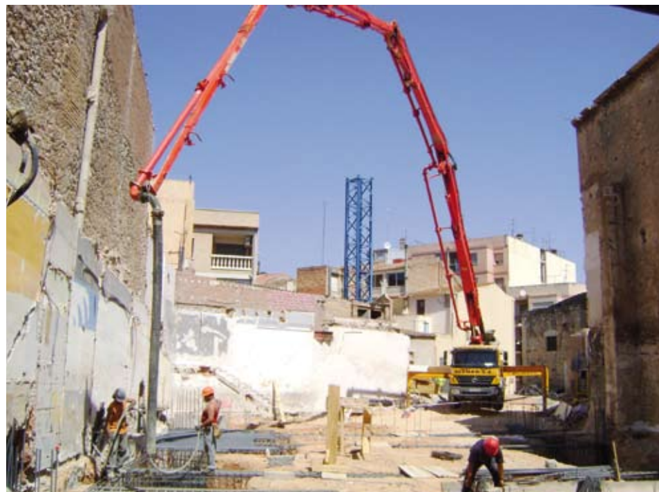
Construcció de les bases del forjat que suportarà tot el nou edifici

Posteriorment, s'han extret els materials que no es poden barrejar amb els enderroc de construcció: ferros, fustes, plàstics, etc.