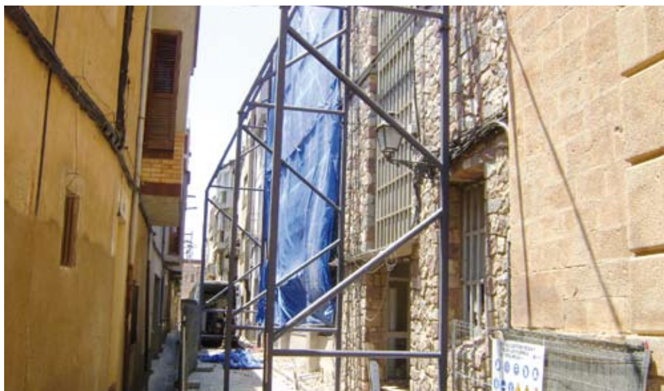
Aquesta estructura permetrà conservar la façana de pedra original

El primer que s'ha fet ha estat recuperar tot allò que tingui algun tipus de valor. Tant perquè pot ser reutilitzat, com perquè pugui tenir un valor sentimental o històric per als riudomencs.