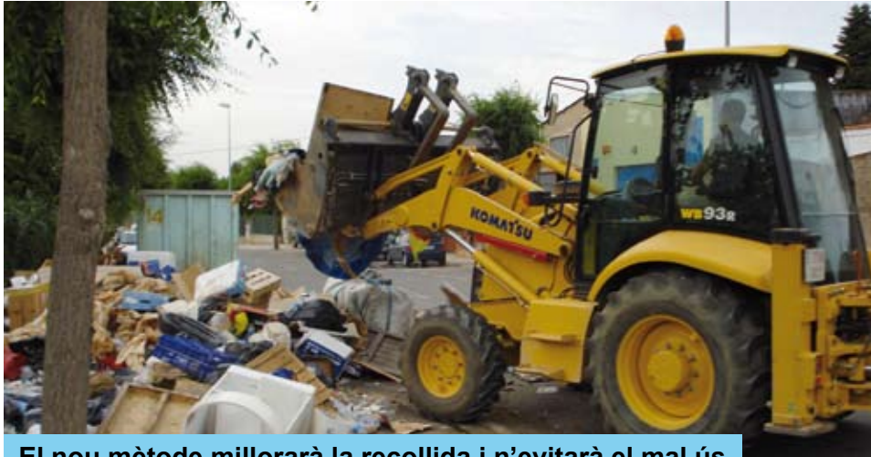
El nou mètode millorarà la recollida i n'evitarà el mal ús

La ubicació del polígon industrial El Prat en una zona de pas i molt fàcil accés representa un avantatge per a les empreses que hi estan situades. Però, aquesta ubicació ha fet que, des del començament, les seves àrees de contenidors hagin estat utilitzades per usuaris externs, malauradament, sovint fent-ne un molt mal ús.