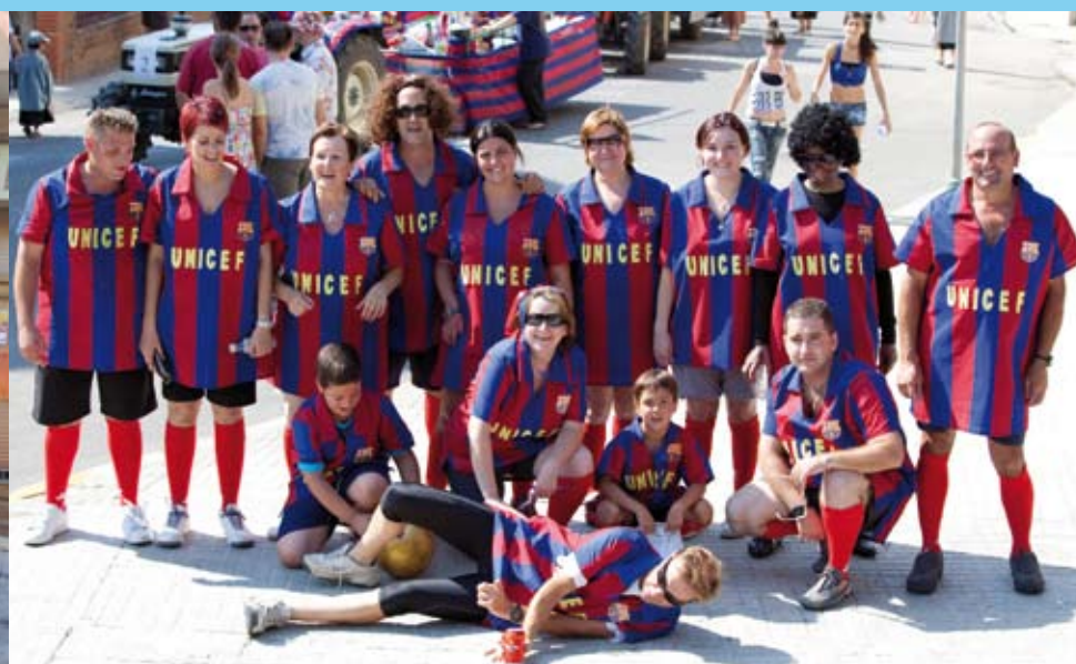
Barri carrer Major