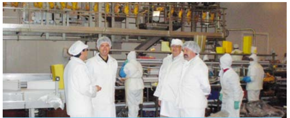
Amb aquesta inversió l'empresa podria arribar als cent llocs de treball

L'empresa riudomenca Mytidasa SL, pertanyent al Grup Crusvi, acaba d'inaugurar una nova planta destinada al procés de trossejat i envasat d'aviram. La nova nau representa una ampliació de 3.000 m 2 en les seves instal·lacions situades a la partida de les Planes del Roquís. Amb aquesta inversió de 2,5 milions d'euros ha demostrat la seva opció per a arrelar-se i convertir-se en una de les empreses de més importància del poble.