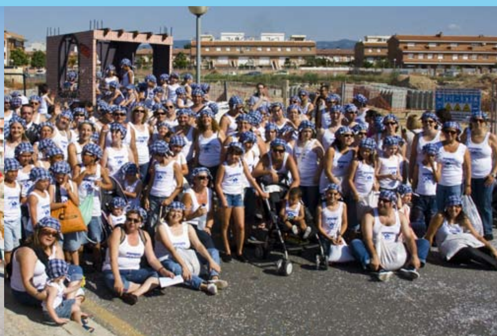
Barri de les Escoles