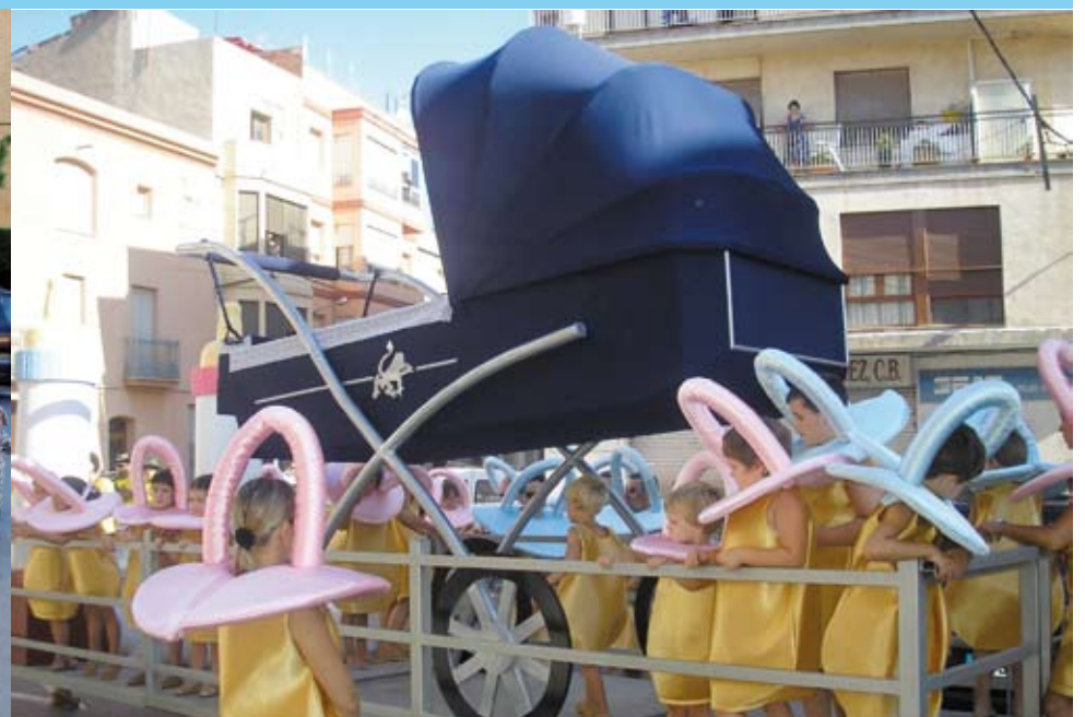
Barri de Sant Antoni