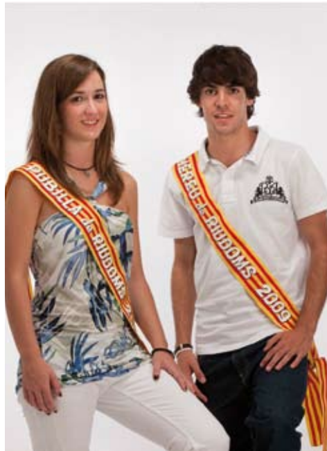
La Pubilla i l'Hereu 2009