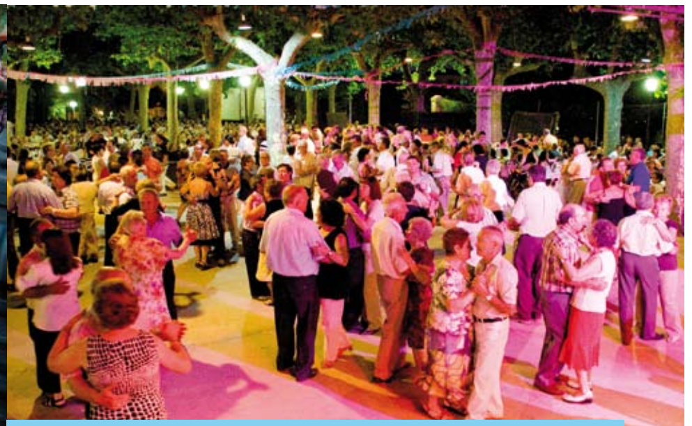
El recinte de Sant Antoni acull el concorregut ball de cloenda