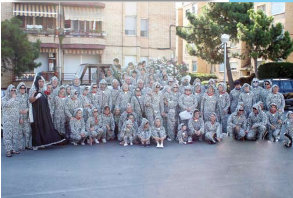
Barri Molí d'en Marc