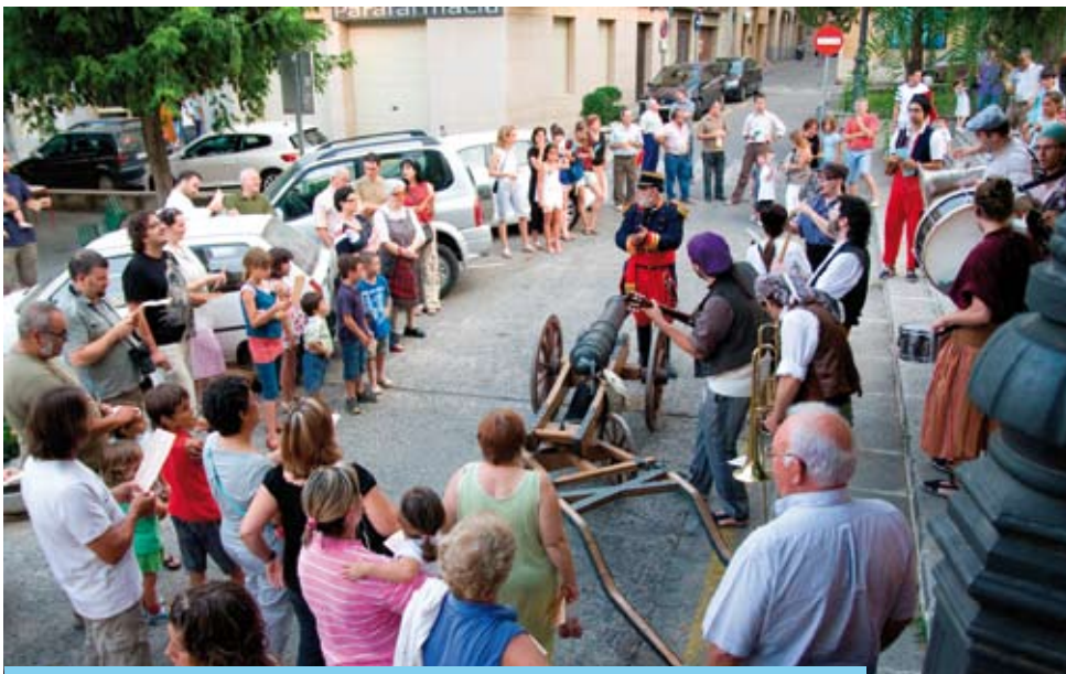
La Cercavila del Canó dóna inici a la Festa dels Barris