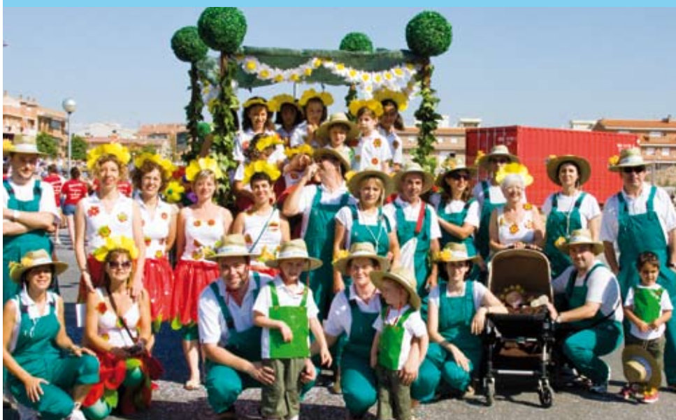
Barri de la Plaça