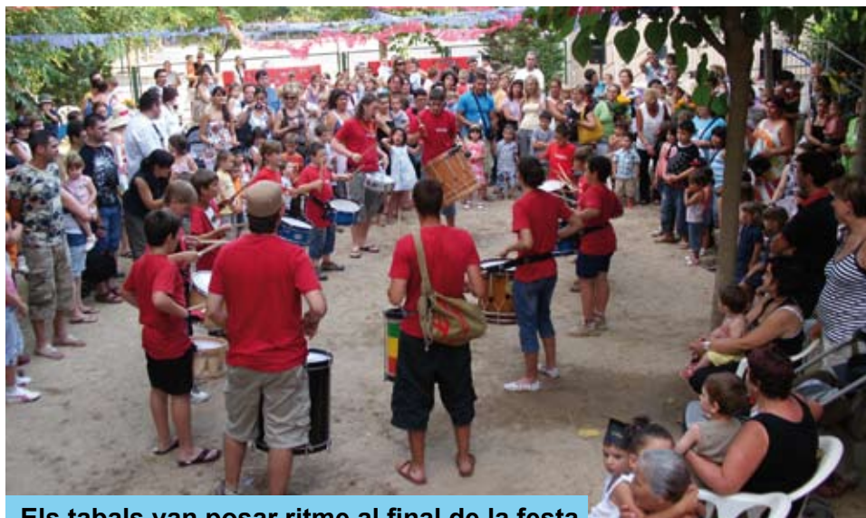
Els tabals van posar ritme al final de la festa

Des d'aquestes línies, us fem arribar l'agraïment a tots els que heu confiat i heu fet possible aquest curs 2008/2009 a la Llar d'Infants Picarols.