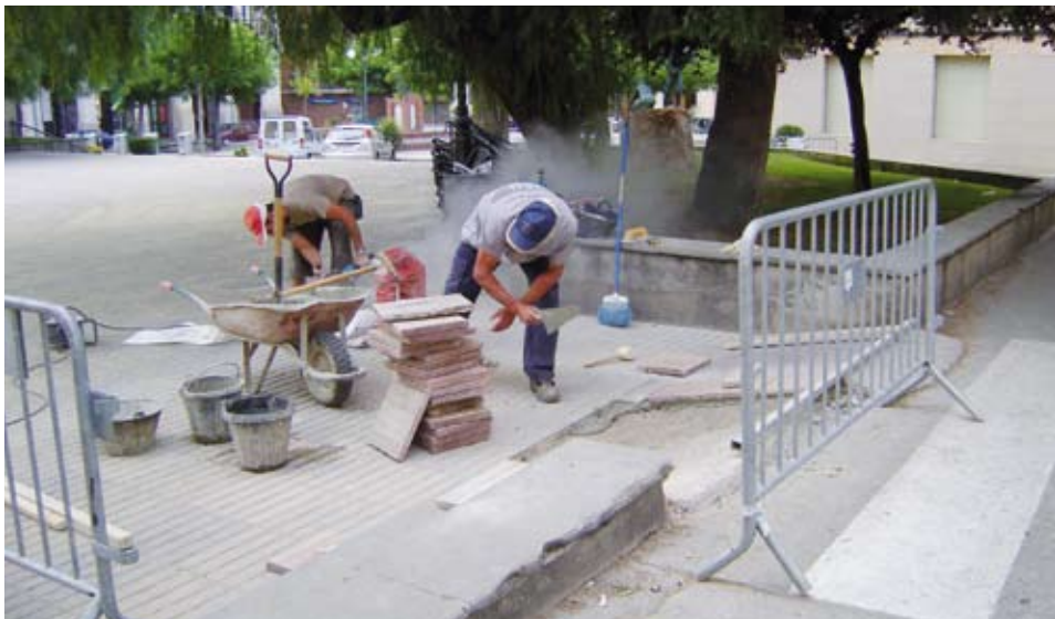
La millora de l'accessibilitat als espais públics beneficiarà tothom

És en aquest context que la Brigada Municipal ja ha fet tot un seguit d'actuacions a la Plaça de l'Església. S'ha doblat l'amplada d'una de les rampes d'accés lateral a la plaça, s'ha col·locat una barana en una de les escales, s'han substituït tot un seguit de rajoles que podien representar un risc per a les persones amb dificultats a l'hora de caminar i també s'ha col·locat una barana a la rampa d'accés als porxos.