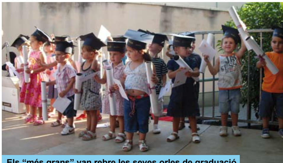
Els "més grans" van rebre les seves orles de graduació

Tot seguit va venir la part més emotiva: la graduació dels infants de P2 que deixen la Llar d'Infants i que el proper curs faran P3 d'Educació Infantil. Com en tota bona graduació, els "més grans de la llar" van rebre els corresponents barrets i orles de la promoció.