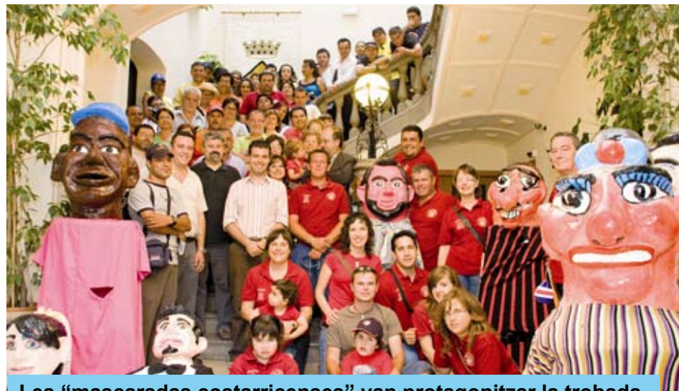
Les "mascaradas costarricenses" van protagonitzar la trobada

En commemoració dels 10 anys del bateig del gegant Antoni Gaudí, la Colla Gegantera de Riudoms va organitzar la 2a Trobada Internacional de Gegants de Riudoms amb la participació de diverses colles i agrupacions geganteres i culturals.