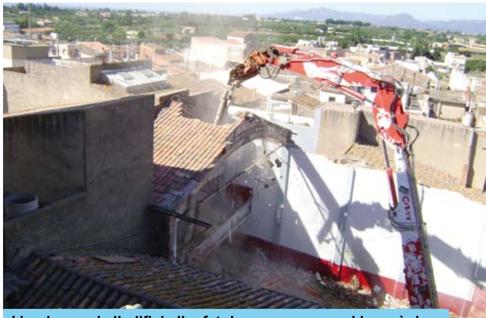
L'enderroc de l'edifici s'ha fet de manera manual i mecànica

Les primeres setmanes de treball han servit per anar avançant molta feina. Encara que, com sempre que es fan obres d'aquestes característiques, inicialment es veu poc la progressió.