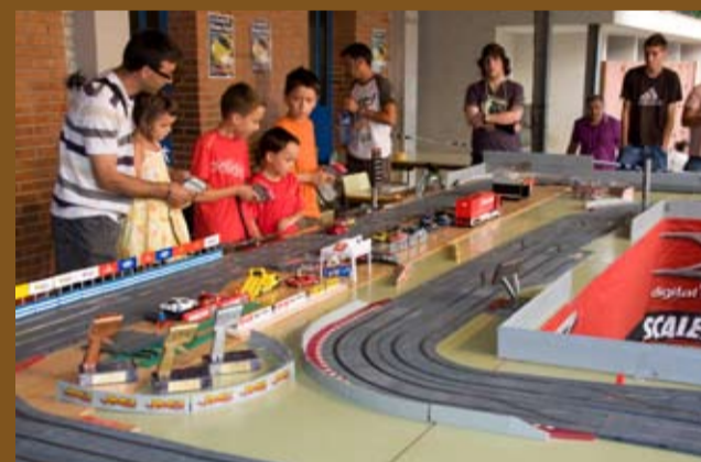
Emoció en el Torneig d'Scalètric