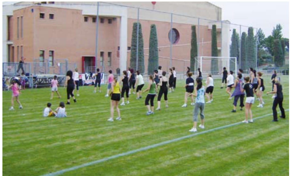
Els dimarts i els dijous es va poder practicar gimnàstica a la fresca