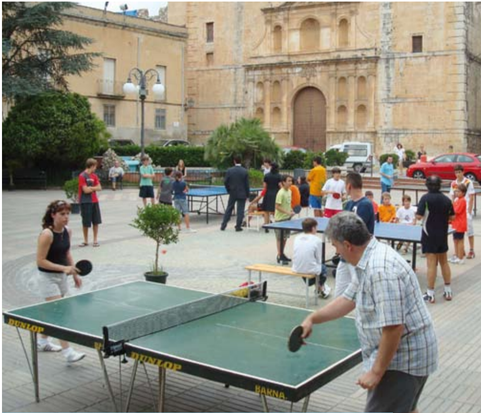
La Plaça va acollir les taules i jugadors de ping-pong