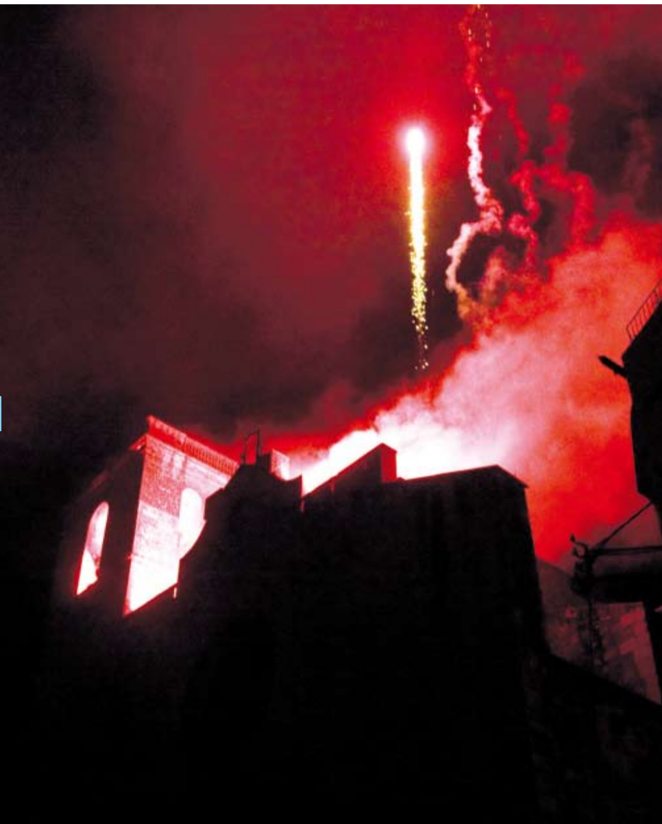
Sorprenent aspecte visual de l'Església