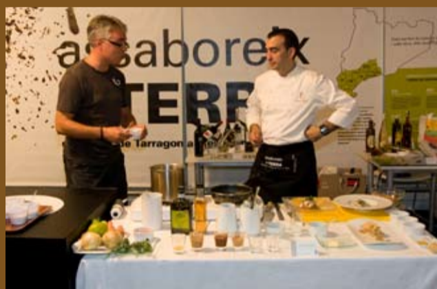
La Diputació va promocionar l'Avellana