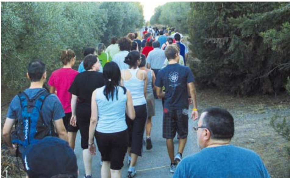
Durant 4 divendres de juliol es van recórrer diversos camins del terme