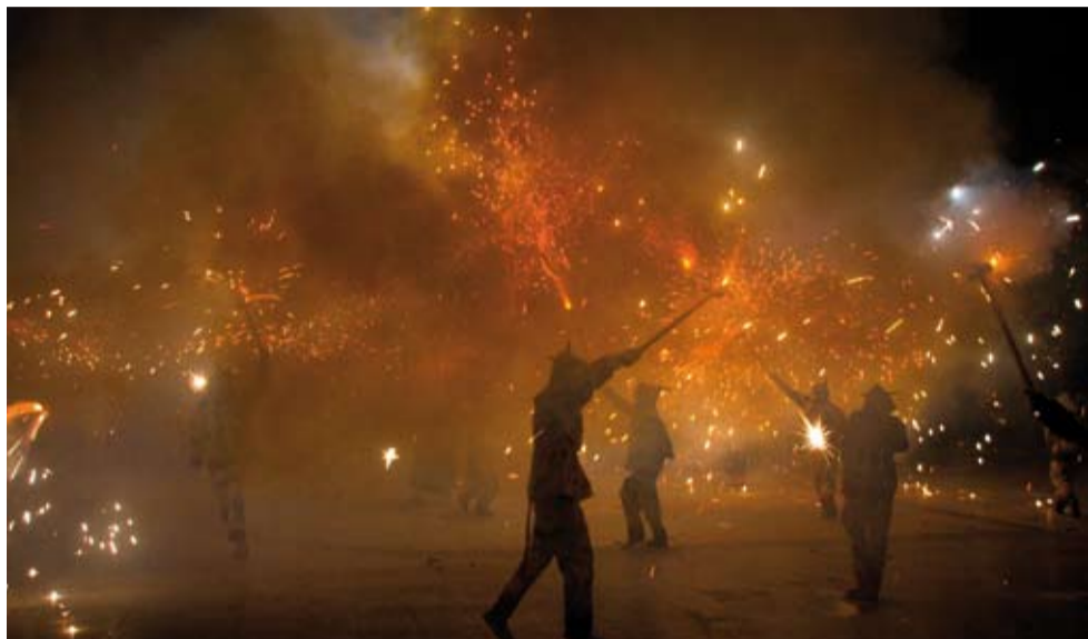
La carretillada final sempre és molt espectacular

Rosaleda, la segona edició de les Ulé Barraques, el Correfoc i la Bicicletada, passant pels actes religiosos en honor al patró de Riudoms i l'espectacle d'animació pels més menuts, en tots s'ha perseguit l'objectiu de seduir a qui n'ha volgut prendre part, convertint Riudoms en el pol d'atracció festiu de la comarca durant tot el cap de setmana de Sant Jaume. La inestimable i ferma implicació de moltes entitats del municipi en l'organització d'una gran part dels actes programats ha donat com a resultat un conjunt d'actes sòlids i molt concorreguts.