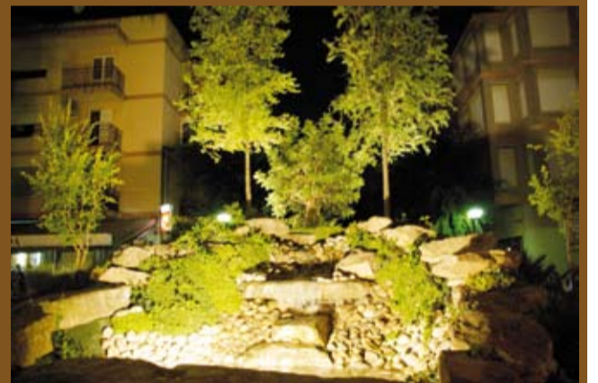
L'entrada simbolitzava l'escut de Riudoms