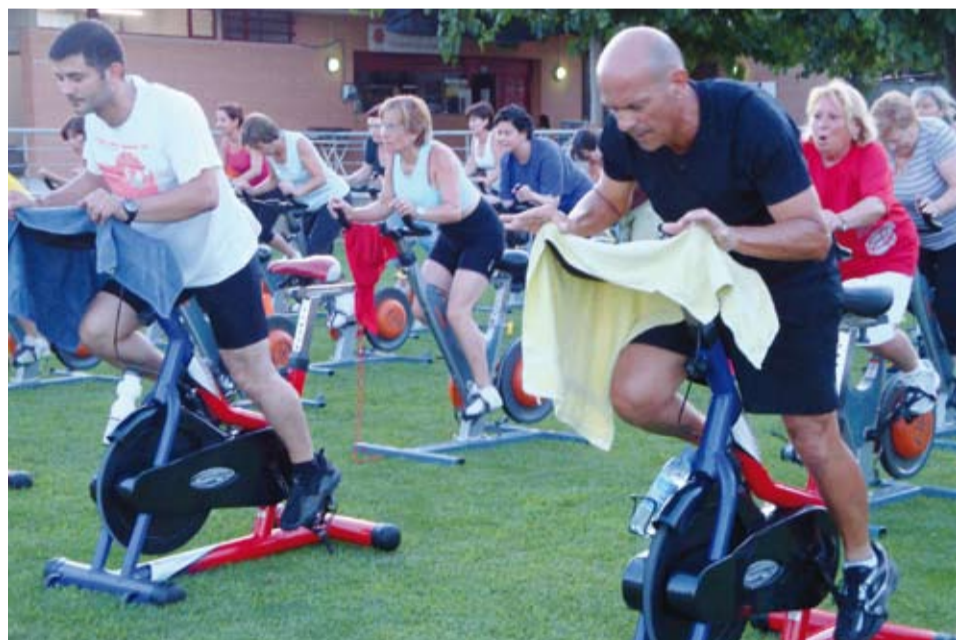
Activitat d'Spinning al Camp de Futbol

Sota el concepte d'Estiu Esportiu s'han agrupat i coordinat les diferents propostes esportives que han tingut lloc aquest juliol al nostre poble.