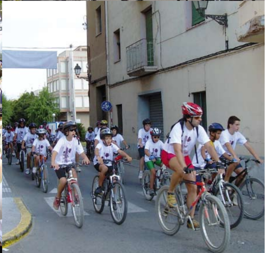
Els 18 anys de la bicicletada van anar acompanyats per la major participació!