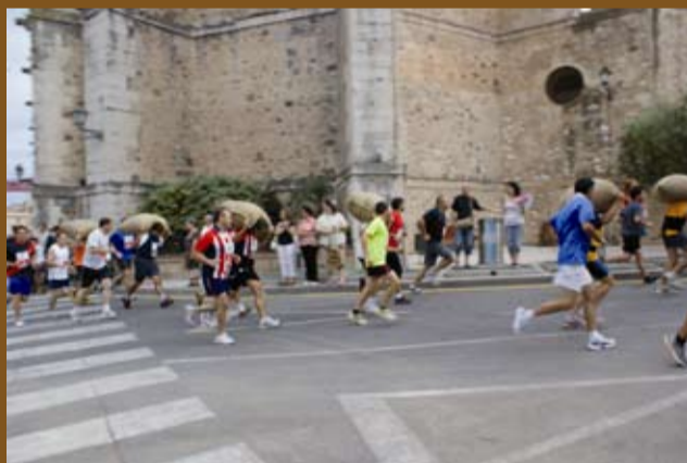
25 anys de la Cursa de Sacs de Riudoms