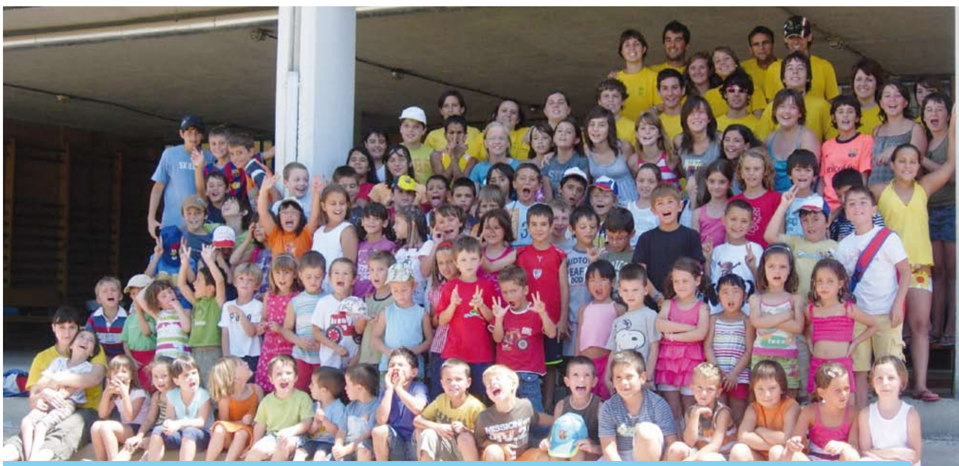
Un altre any, més de 100 nens i nenes han participat en l'Escola de Lleure 2009, amb la col·laboració d'una quinzena de monitors