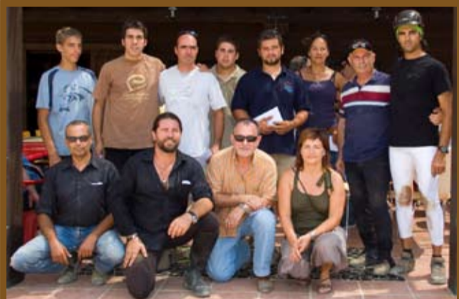
Guanyadors de la Cursa Popular de Cavalls