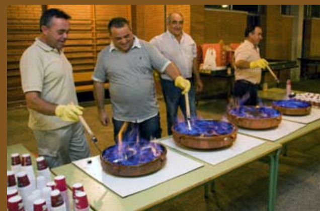
Per acabar la Fira, una mica de rom cremat!

La Fira de l'Avellana és el fruit de la implicació de tot el poble. Agraïm la vostra participació i desitgem que l'hagueu viscut plenament.