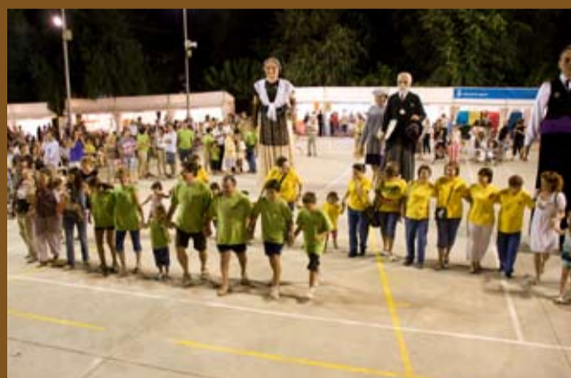
Actuació final de gegants i grallers