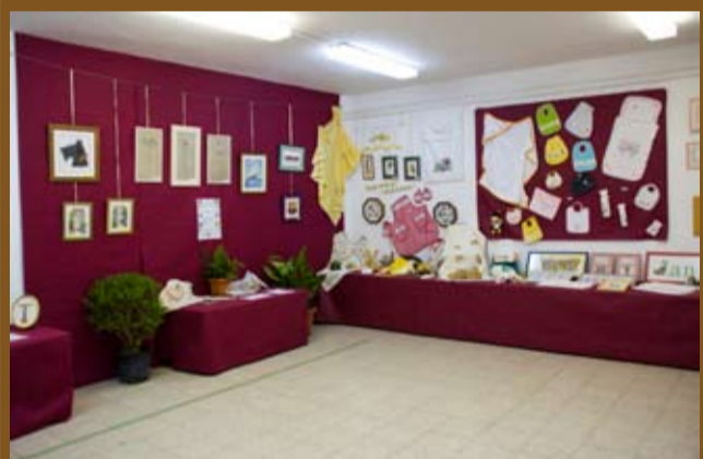
Punt de creu de senyores de Riudoms