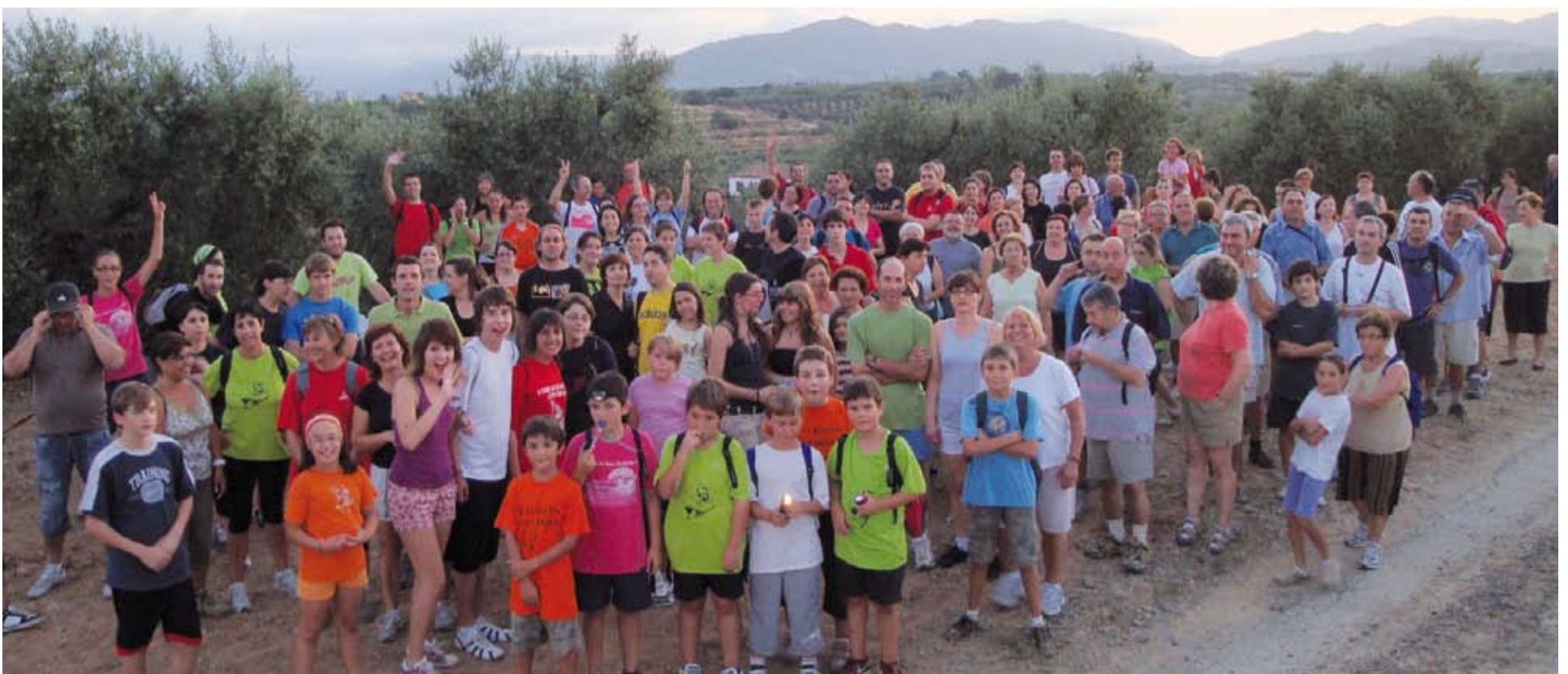
Van ser molts els riudomencs que es van afegir a caminar durant els vespres de juliol