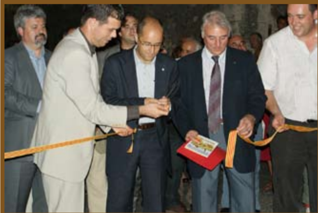
Les autoritats tallant la cinta inaugural