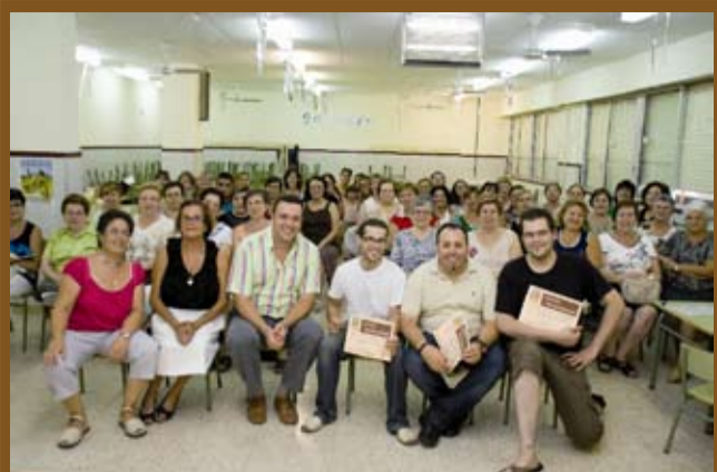
Curs de la Cuina de l'Avellana