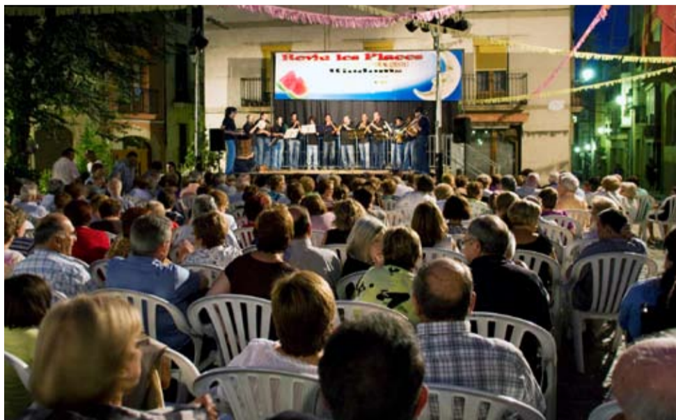
La música dels "Va de Vent" va encetar el Reviu, a la Plaça de l'Om

A partir de l'endemà de l'última actuació, ja hem començat les tasques de preparació de la programació del Reviu les Places 2010.