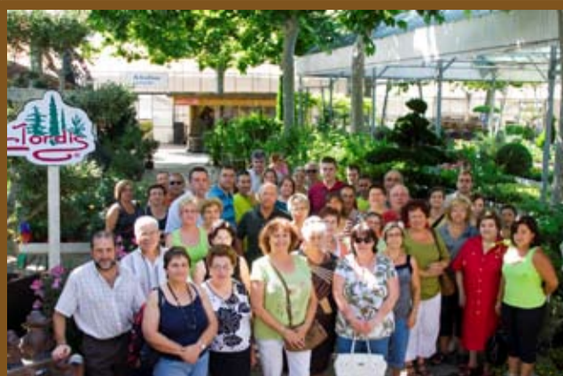
Visita als Vivers i Jardineria Jordis