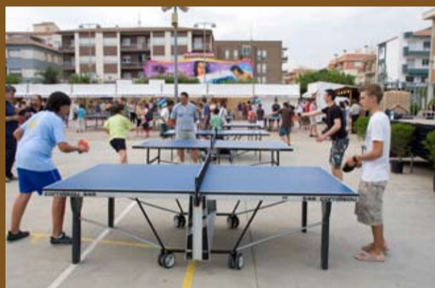
El tenis taula es va disputar en 9 taules