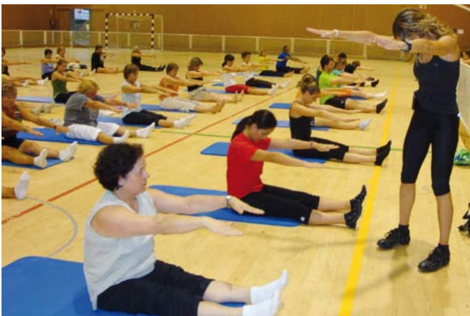
Activitat de Pilates al Pavelló Municipal