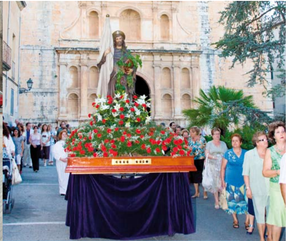
El patró de Riudoms, Sant Jaume Apòstol, en processó