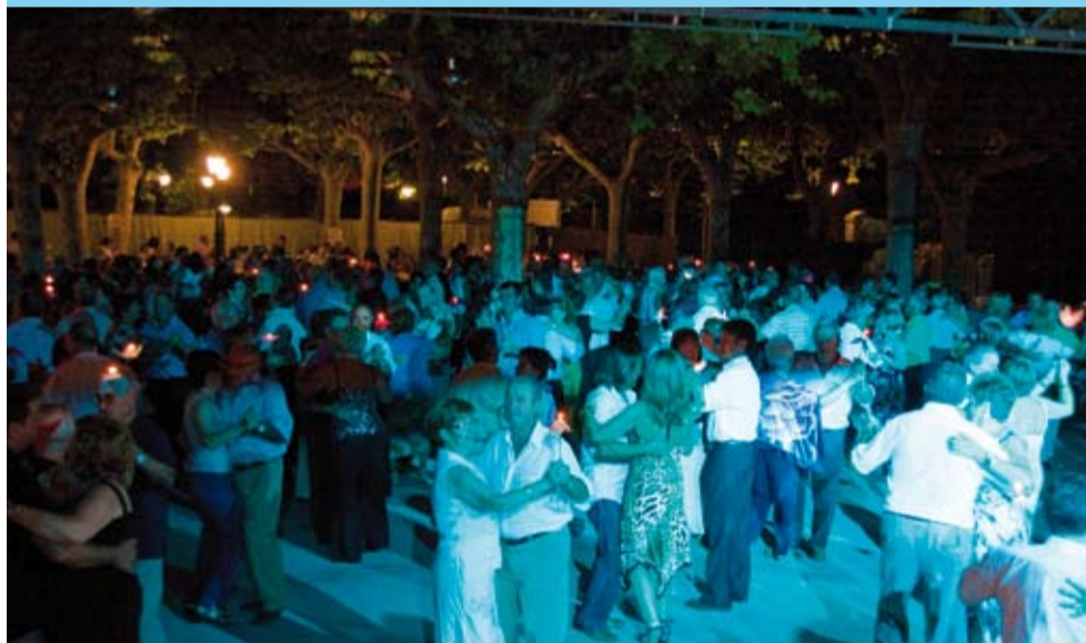
La tradicional revetlla de Sant Jaume a Sant Antoni