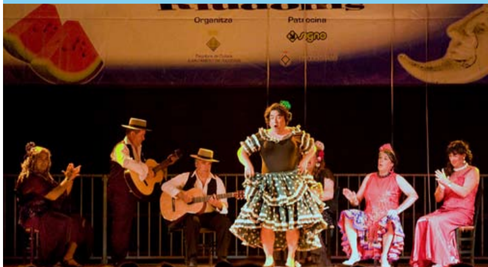
El Grup Independent d'Art va fer disfrutar la Plaça de la Palmera