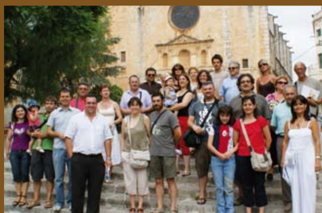
Participants al "Coneix Millor Riudoms"