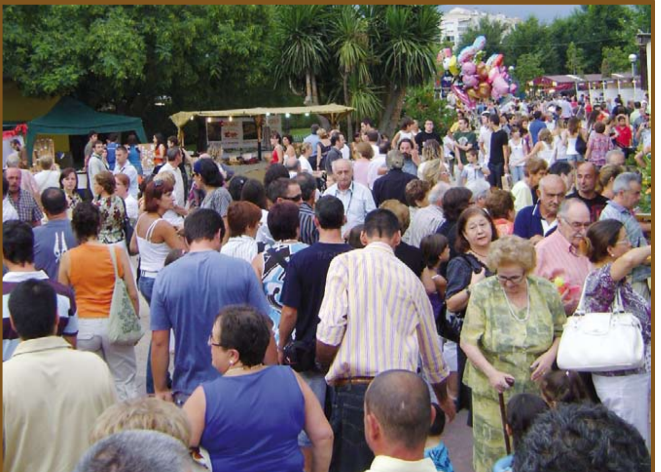
La gran participació a la Fira de l'Avellana fa de Riudoms el centre de les nostres comarques