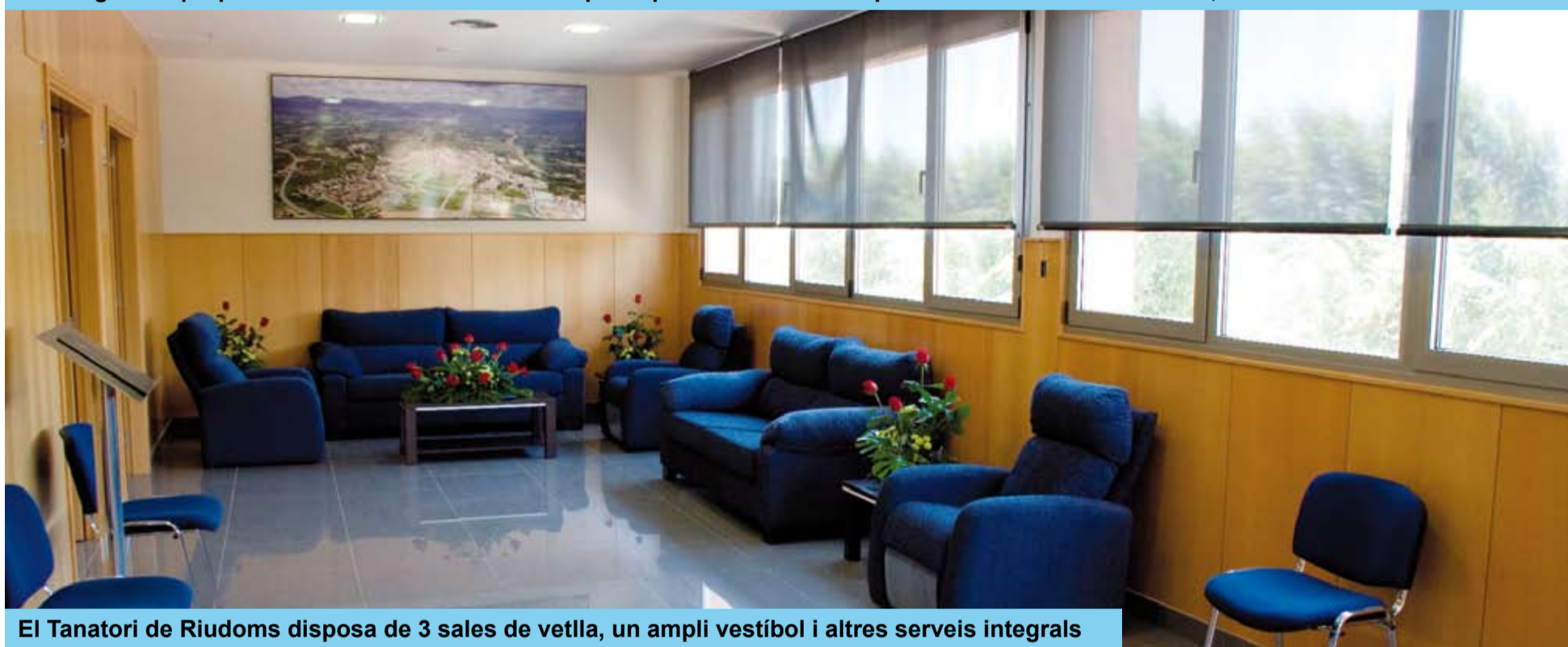
El Tanatori de Riudoms disposa de 3 sales de vetlla, un ampli vestíbol i altres serveis integrals