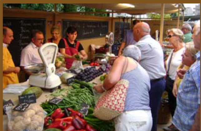
L'Ajuntament promocionant productes locals