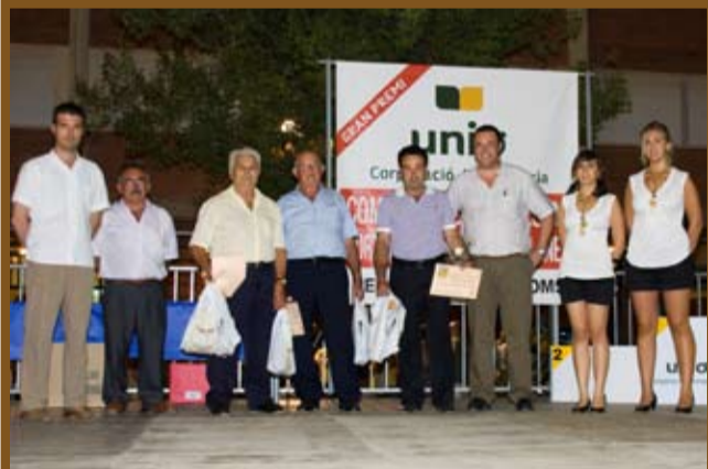
Concurs de productes agrícoles