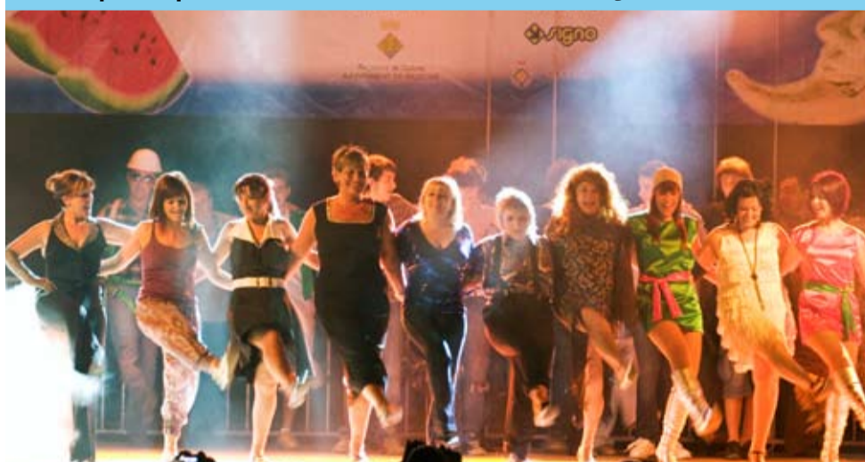
Una cinquantena de persones participen en els seus playbacks