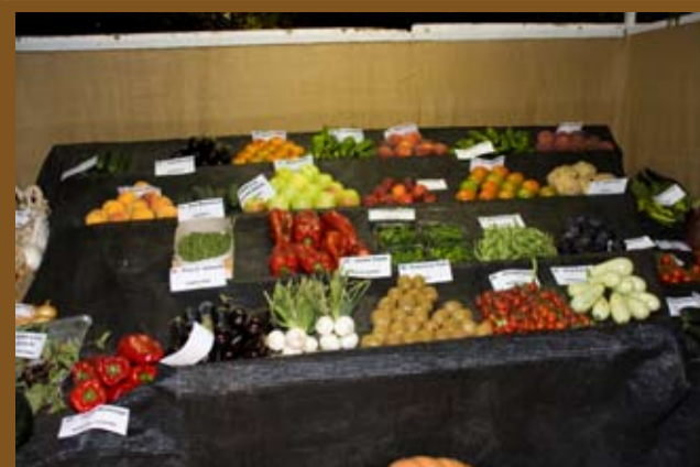
Exposició dels productes de Riudoms