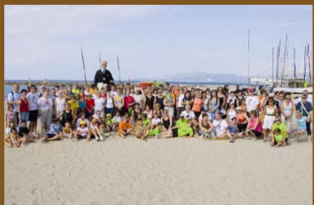
Participants al 7è Anar a Mar fins a Cambrils