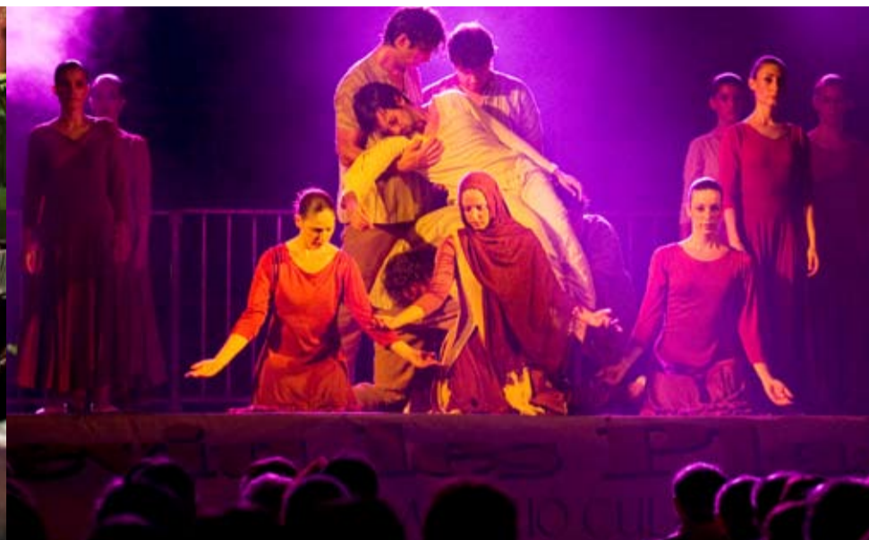
Espectacle de dansa amb l'Esbart Sant Martí, a la Plaça de l'Església