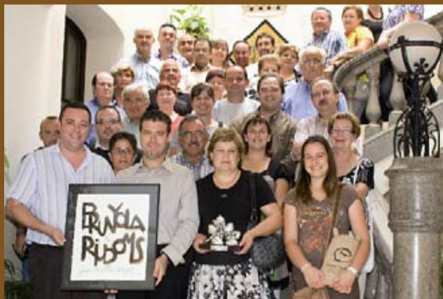
Agermanament amb la Fira de Brunyola