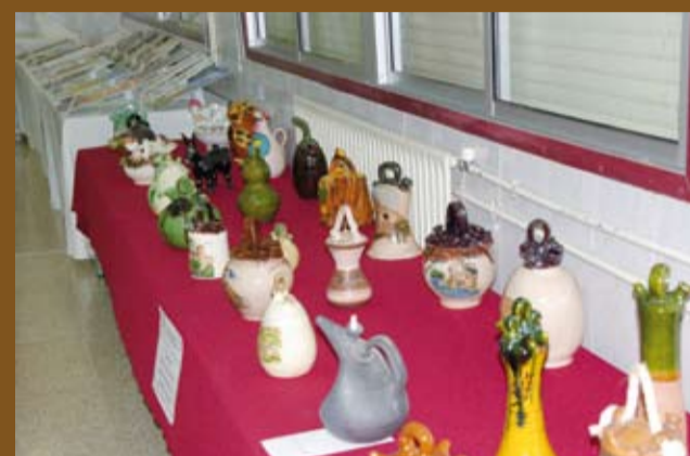
Exposició de càntrics de la família Teixell