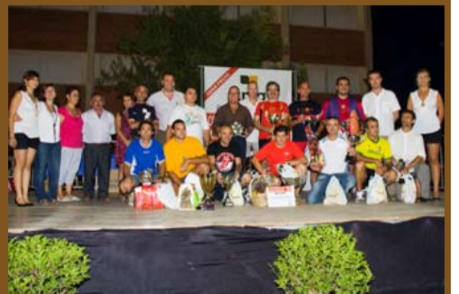
Tots els participants a la 25a Cursa de Sacs