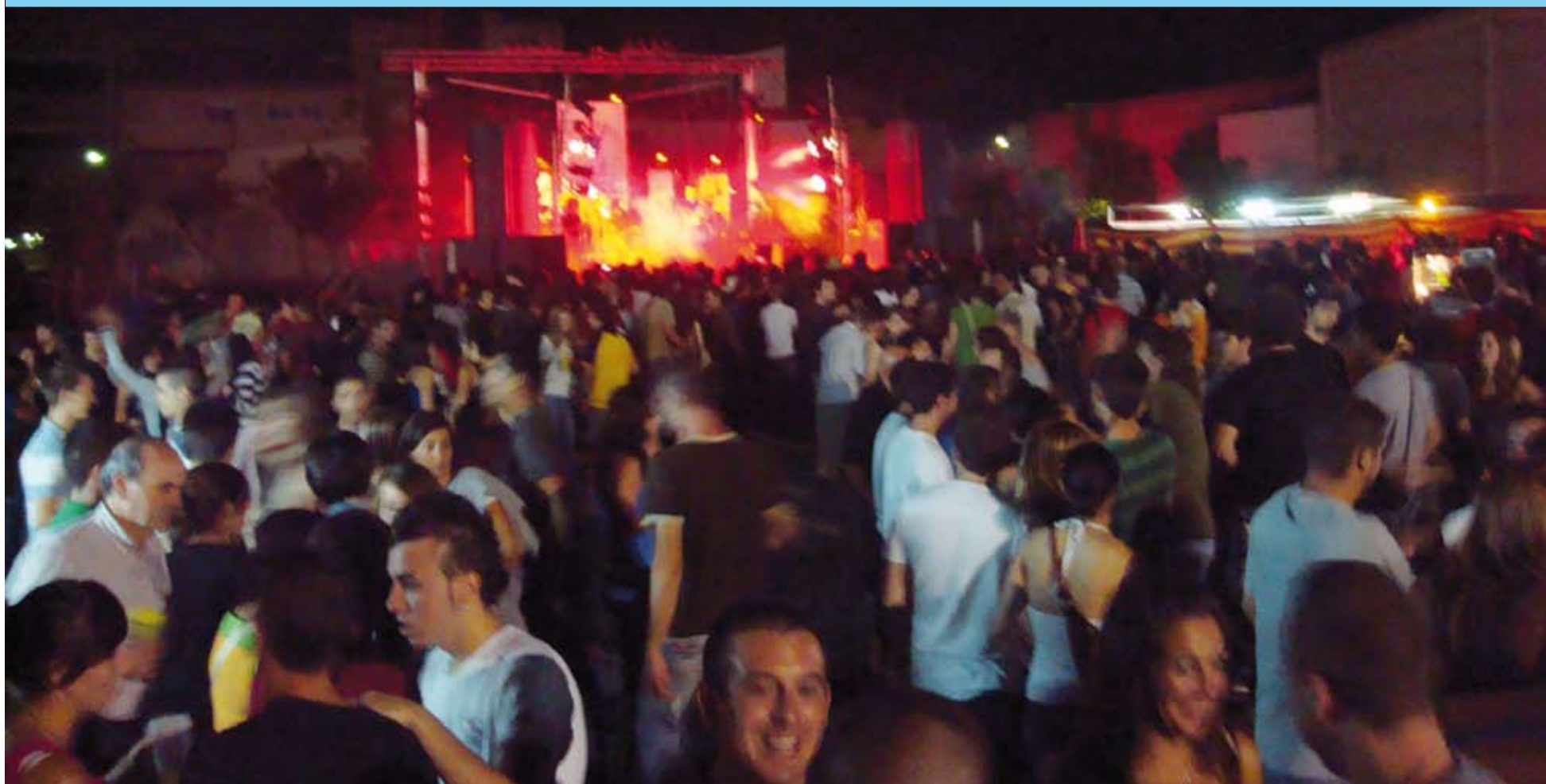
La Comisió de Barraques ha organitzat, amb gran èxit, les segones Ulé Barraques de Riudoms. L'enhorabona!