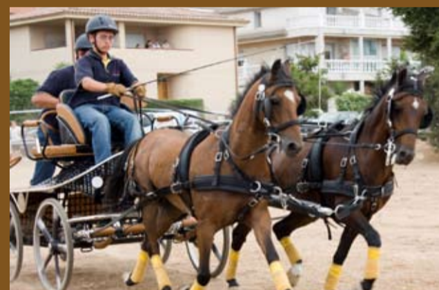
Prova de la Copa de Catalunya d'Enganxe