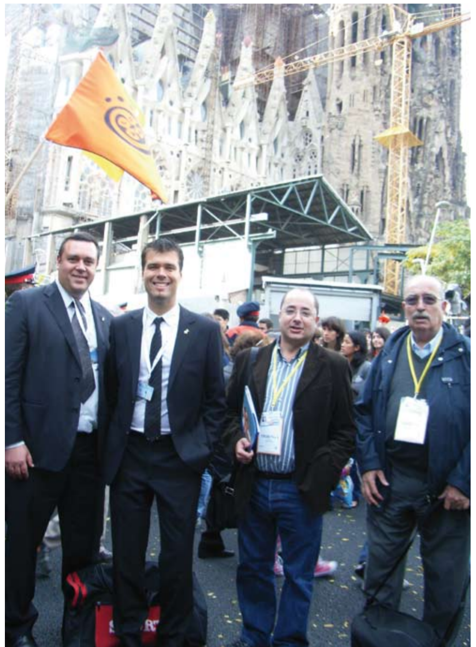
Representants de la Revista l'Om, de la Colla Gegantera, de la Parròquia i de l'Ajuntament de Riudoms es van desplaçar a Barcelona per ser presents en el gran moment històric de la Dedicació del Temple de la Sagrada Família a càrrec del Sant Pare Benet XVI.

Diumenge 7 de novembre de 2010 el món va mirar a Catalunya amb admiració i respecte i Riudoms hi era present, fent-nos notar, però amb tot el respecte que mereix el nostre fill il·lustre més universal.