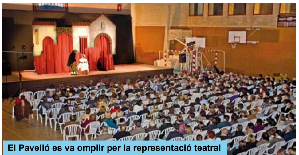
El Pavelló es va omplir per la representació teatral