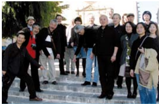
Els arquitectes, on Gaudí es va fotografiar

Una delegació del col·legi d'arquitectes del Japó va ser a Riudoms, per tal de conèixer l'origen del genial arquitecte Antoni Gaudí.