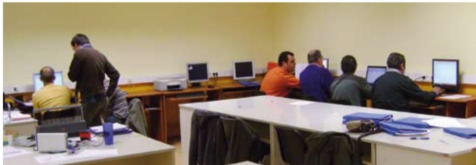
Els treballadors del pla d'ocupació reben formació complementària