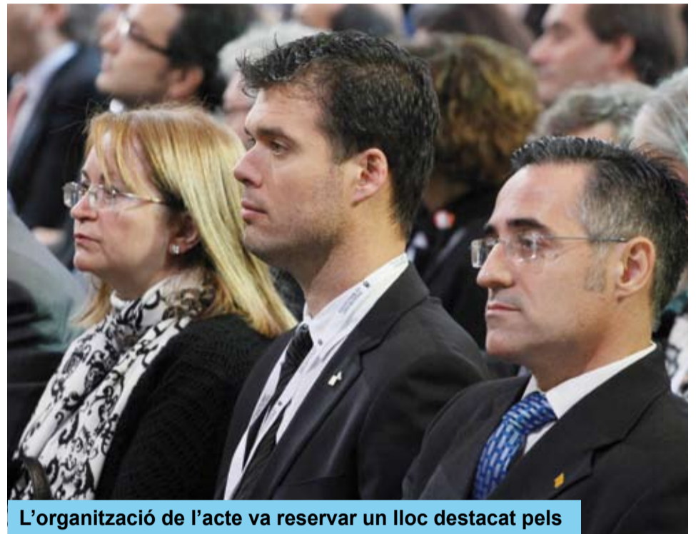
L'organització de l'acte va reservar un lloc destacat pels representants del poble de Riudoms

Vocació internacional, cultura de l'esforç i del sacrifici, devoció per la feina ben feta, creativitat i innovació, valor afegit. Gaudí l'artista, l'arquitecte que volia posar Catalunya al món. Gaudí el patriota que l'any 1924 va ser detingut per voler assistir a una missa en honor dels màrtirs de 1714 i va ser empresonat per utilitzar la llengua catalana en el seu interrogatori.