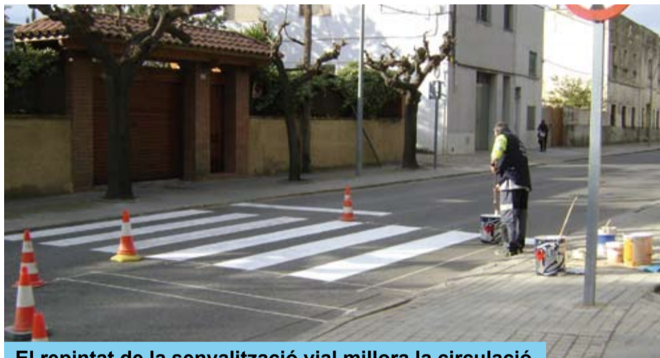
El repintat de la senyalització vial millora la circulació