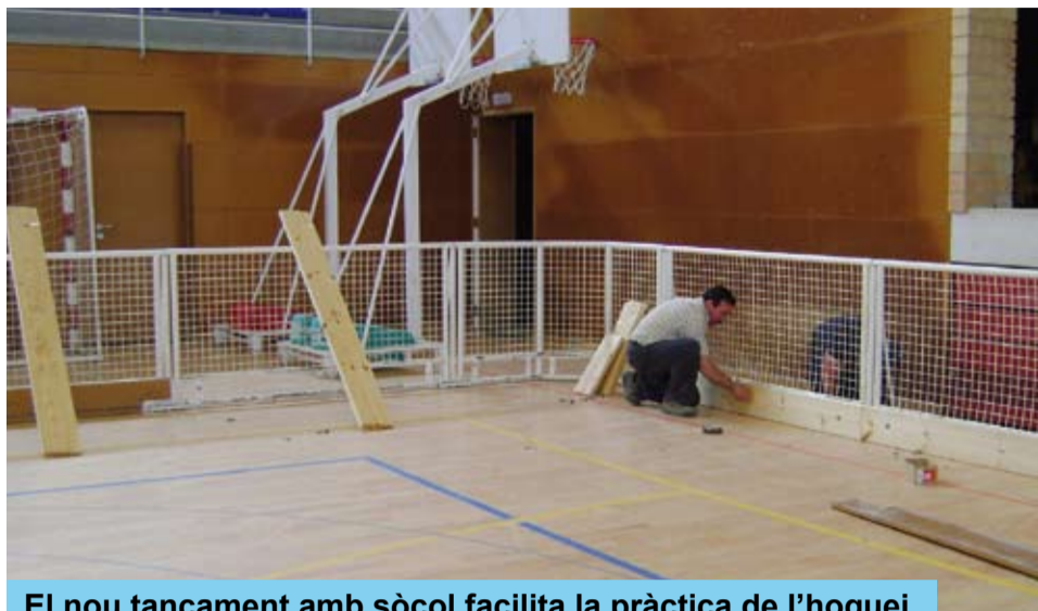
El nou tancament amb sòcol facilita la pràctica de l'hoquei