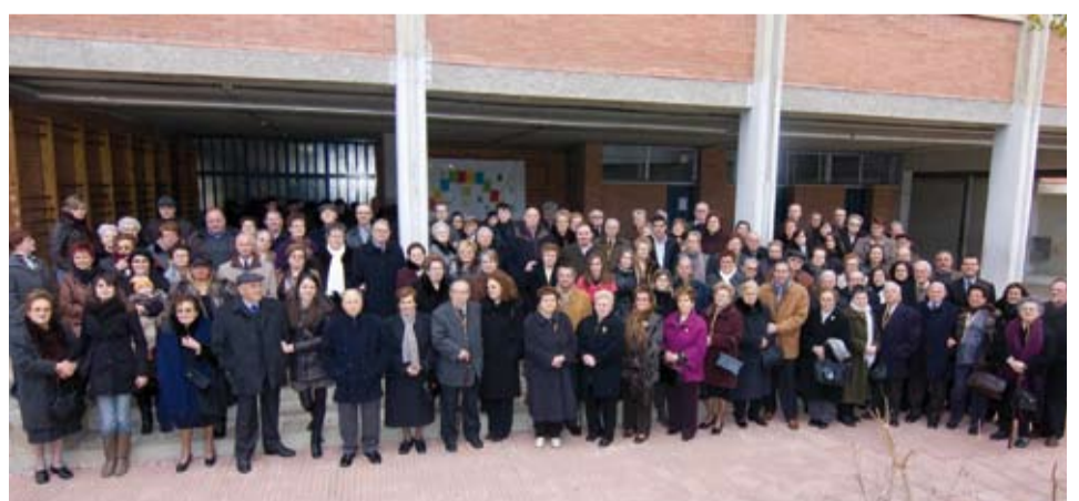
La Festa de la Vellesa va rebre una donació de 1000 € de "La Caixa"