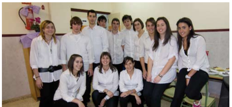
L'equip de voluntaris que van atendre als avis homenatjats