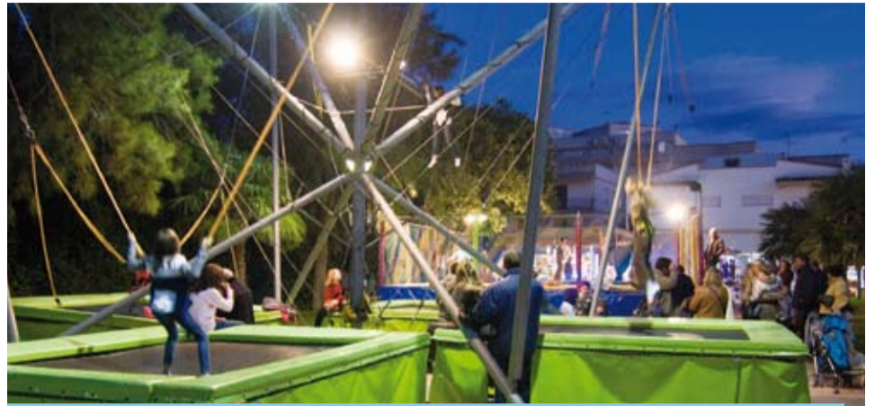
Les atraccions fan viure, als més petits, el Beat a la seva manera