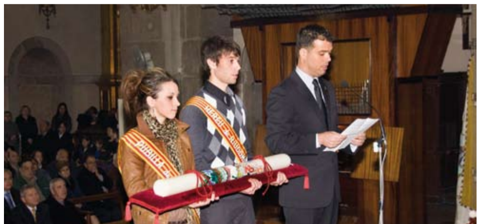
Discurs de l'Alcalde i ofrena del ciri al Beat, amb la Pubilla i l'Hereu