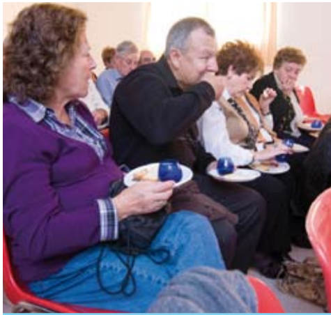
El saludable oli d'oliva verge extra protagonitza la Festa de l'Oli Nou