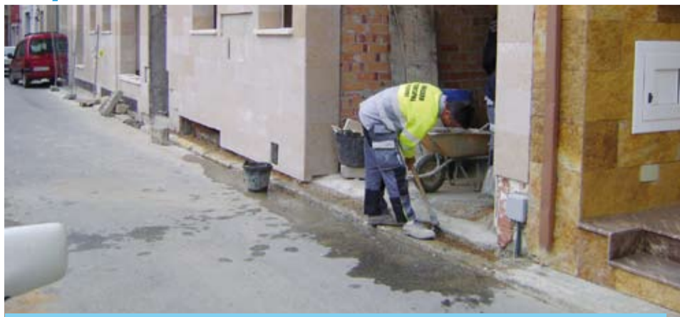
Aquesta obra facilita el pas de les persones pel carrer Mont-roig