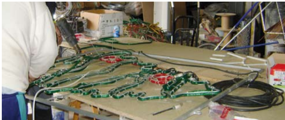
La il·luminació nadalenca es revisa prèviament al taller municipal