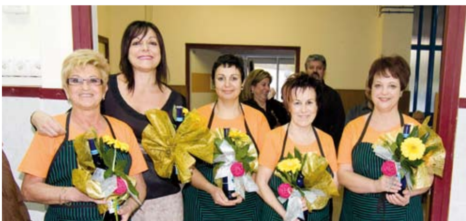
Agraïment a les persones que van preparar el dinar