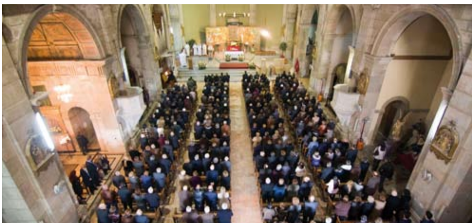
Ofici en honor del Beat Bonaventura Gran de Riudoms