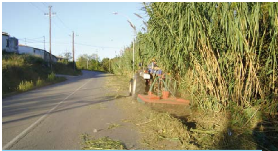
L'adquisició de la desbrossadora facilita els treballs de neteja