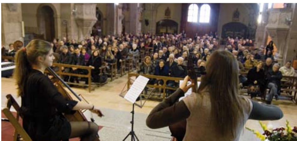
Concert que es va oferir en motiu de l'Homenate a la Vellesa