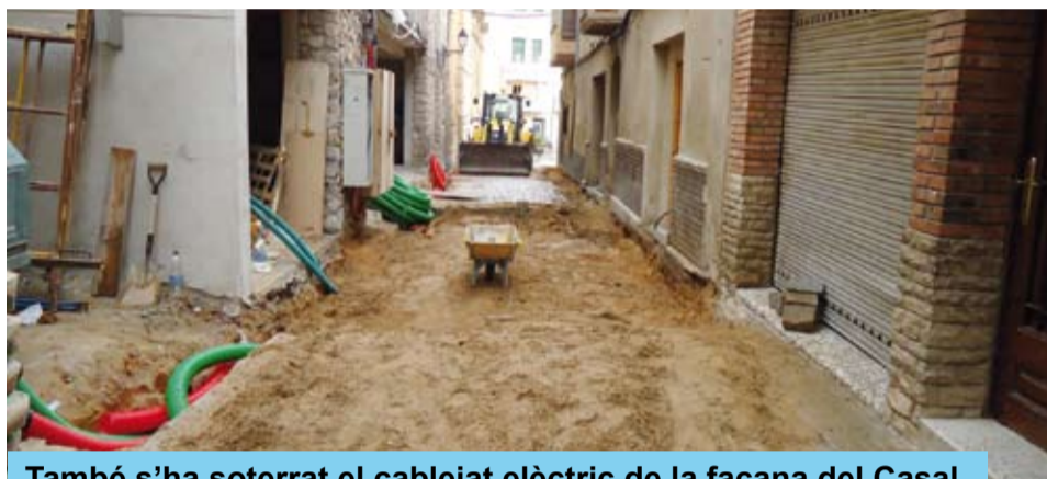
També s'ha soterrat el cablejat elèctric de la façana del Casal