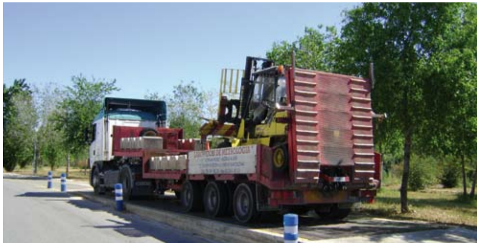
La bàscula pública del Polígon El Prat es controla periòdicament