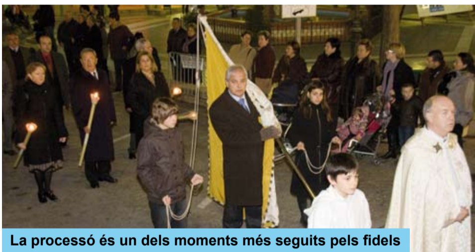
La processó és un dels moments més seguits pels fidels