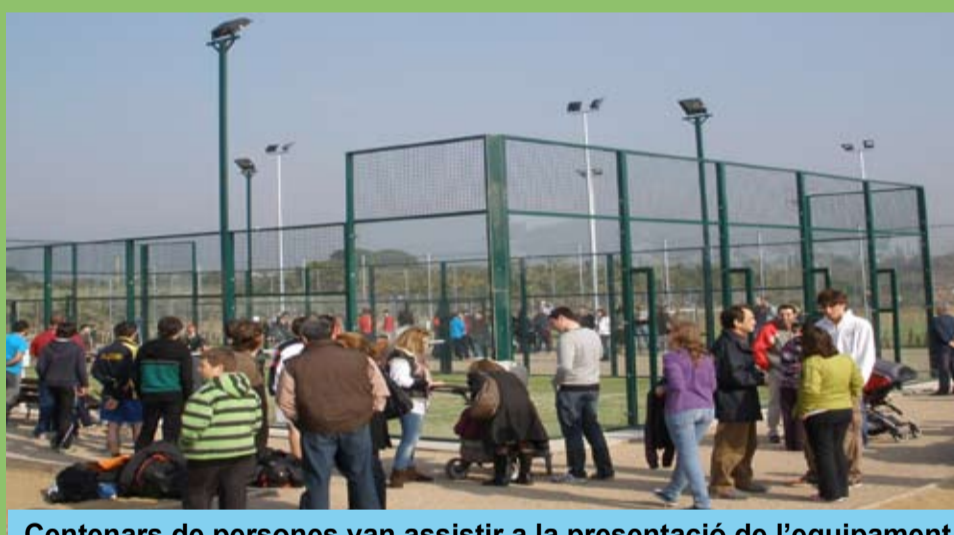
Centenars de persones van assistir a la presentació de l'equipament