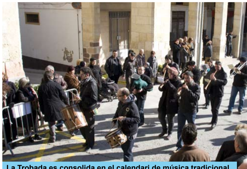
La Trobada es consolida en el calendari de música tradicional