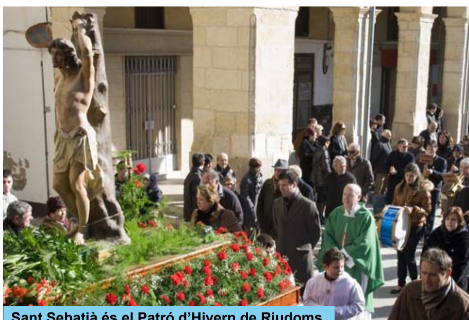
Sant Sebastià és el Patró d'Hivern de Riudoms