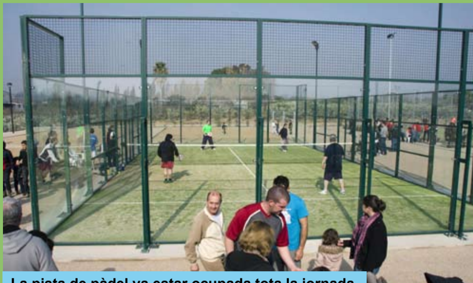
La pista de pàdel va estar ocupada tota la jornada