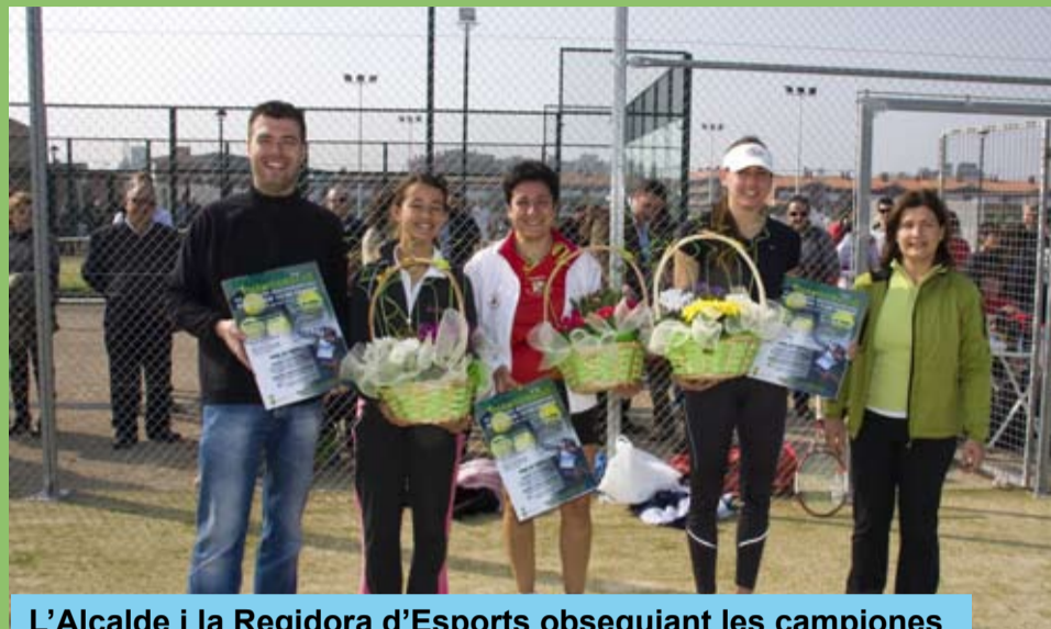
L'Alcalde i la Regidora d'Esports obsequiant les campiones