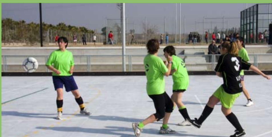
Demostració de l'equip de futbol sala femení de Riudoms