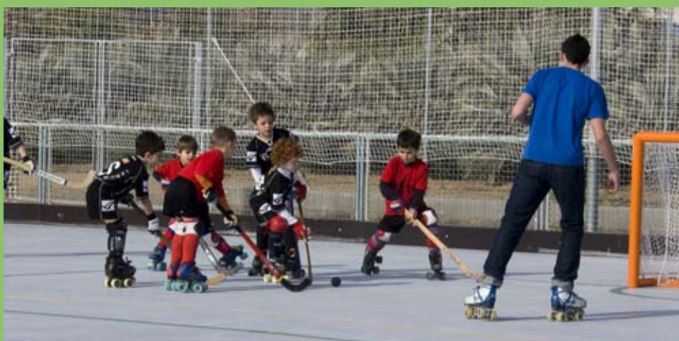
Imatge del partit d'exhibició de l'equip d'hoquei del CP Riudoms