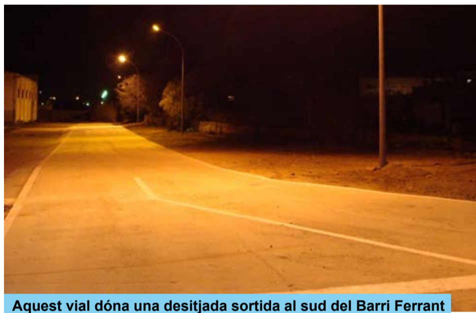
Aquest vial dona una desitjada sortida al sud del Barri Ferrant