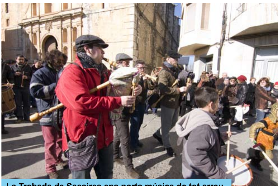
La Trobada de Sacaires ens porta músics de tot arreu