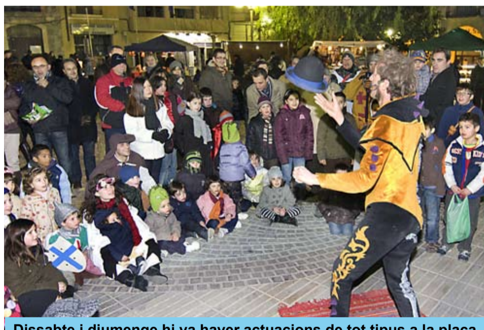
Dissabte i diumenge hi va haver actuacions de tot tipus a la plaça