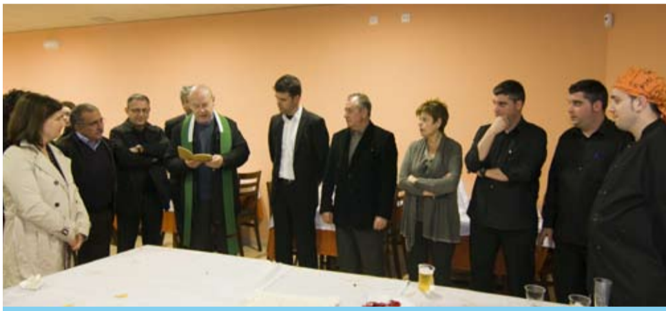
Les noves instal·lacions permetran gaudir tot l'any de Sant Antoni

Sense cap mena de dubte, el fàcil accés i aparcament, el recinte tancat que permet jugar els més petits i la qualitat de les noves instal·lacions garanteixen l'èxit d'aquesta actuació tant desitjada per tots els veïns de Riudoms.