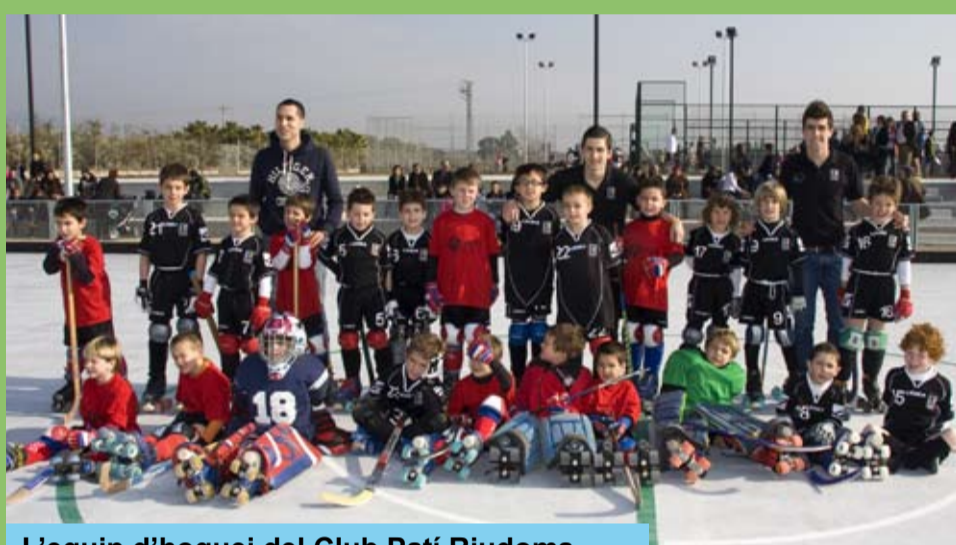
L'equip d'hoquei del Club Patí Riudoms