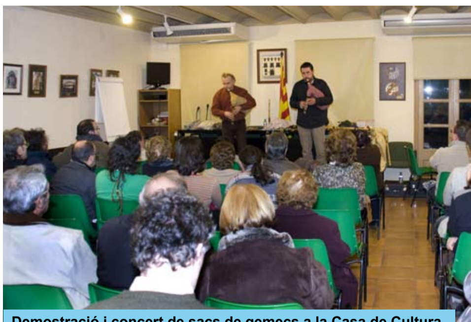
Demostració i concert de sacs de gemecs a la Casa de Cultura