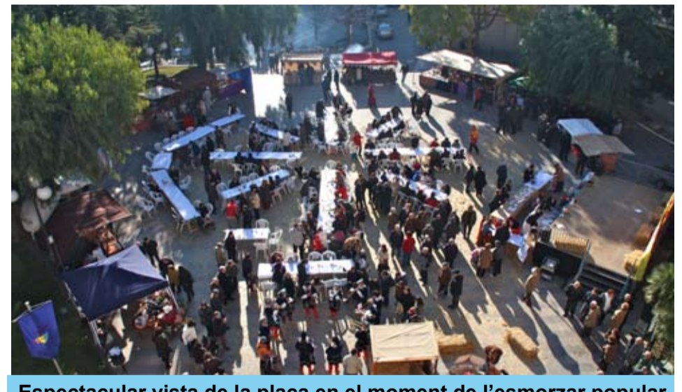
Espectacular vista de la plaça en el moment de l'esmorzar popular