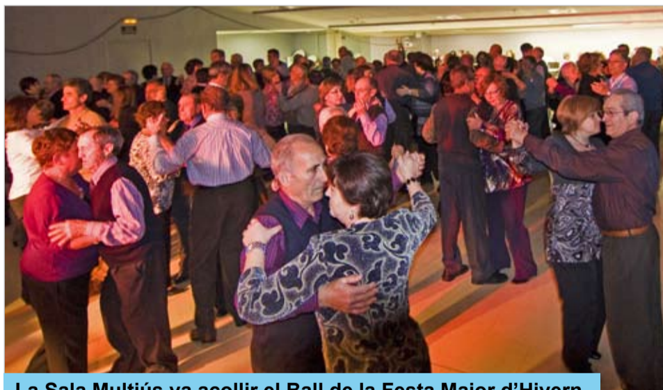
La Sala Multiús va acollir el Ball de la Festa Major d'Hivern