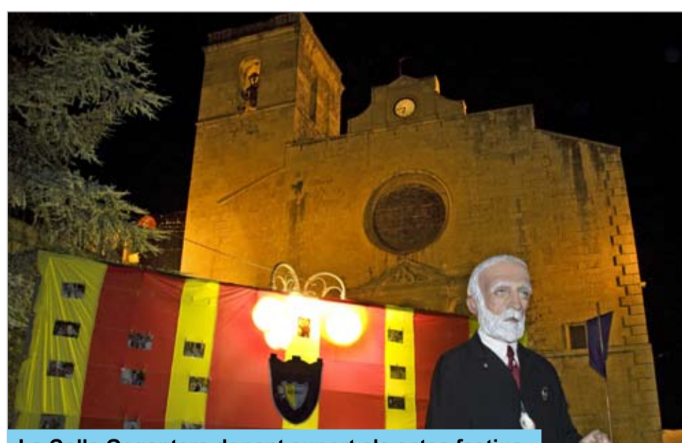
La Colla Gegantera donant suport als actes festius