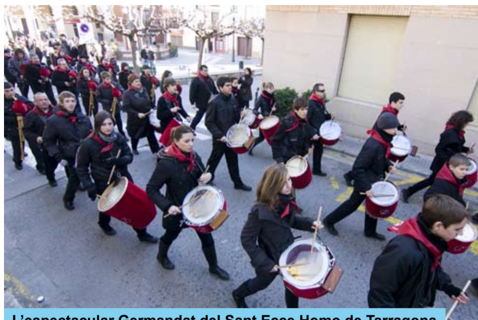
L'espectacular Germandat del Sant Ecce Homo de Tarragona