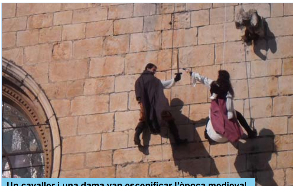
Un cavaller i una dama van escenificar l'època medieval