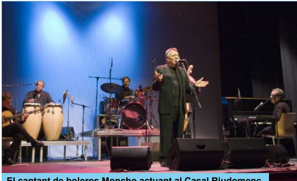
El cantant de boleros Moncho actuant al Casal Riudomenc