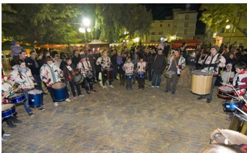
El Grup de Tabals participa cada any a la Festa del Repoblament