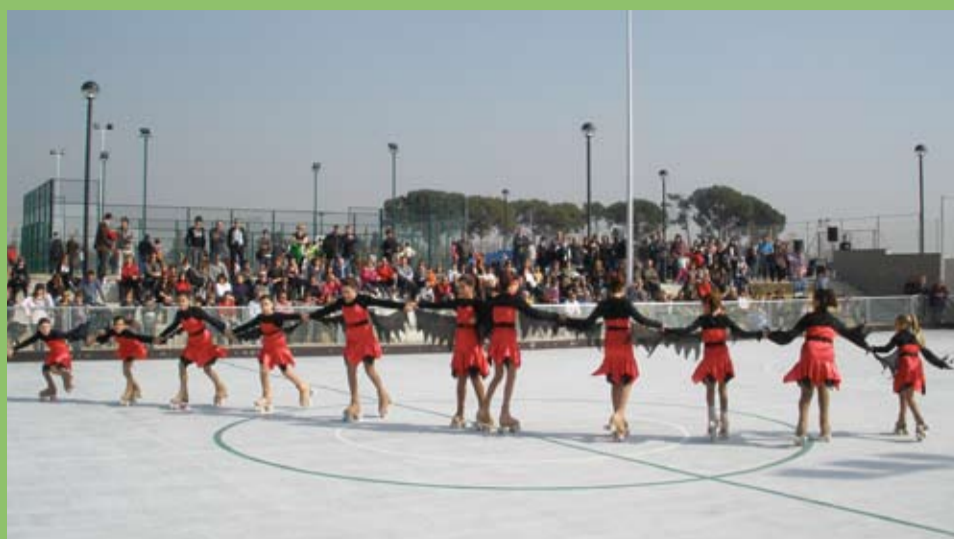
Demostració de patinatge artístic a càrrec del Club Patí Riudoms