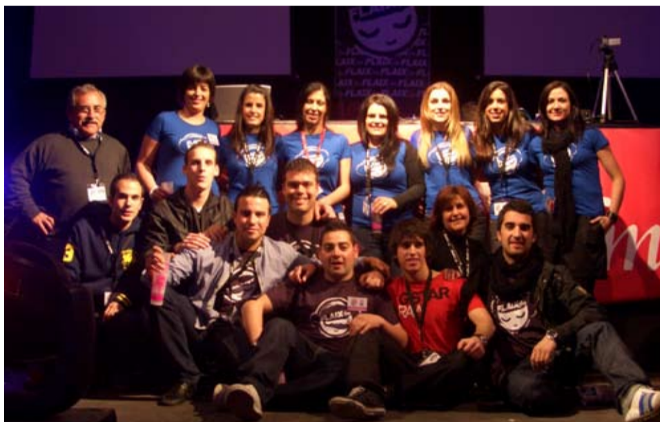
Foto de grup de la Comissió Organitzadora d'aquest espectacle