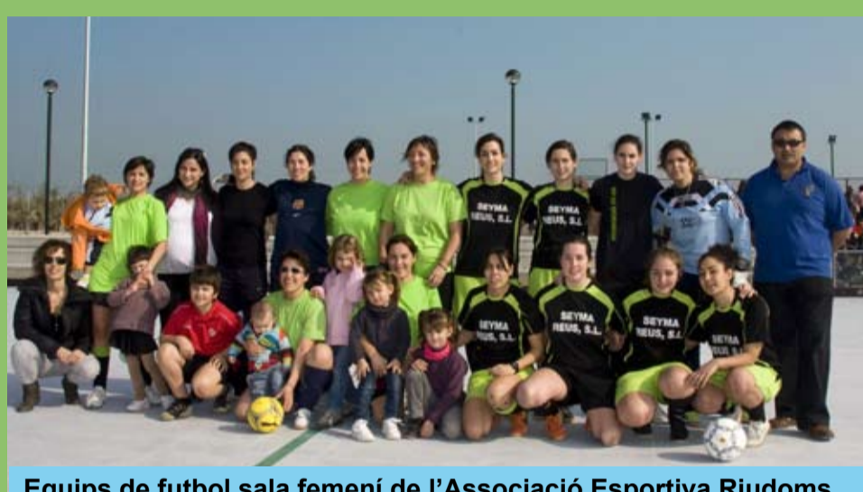
Equips de futbol sala femení de l'Associació Esportiva Riudoms

El diumenge 13 de febrer centenars de riudomencs es van acostar als nous equipaments esportius que aquell dia es posaven en servei.