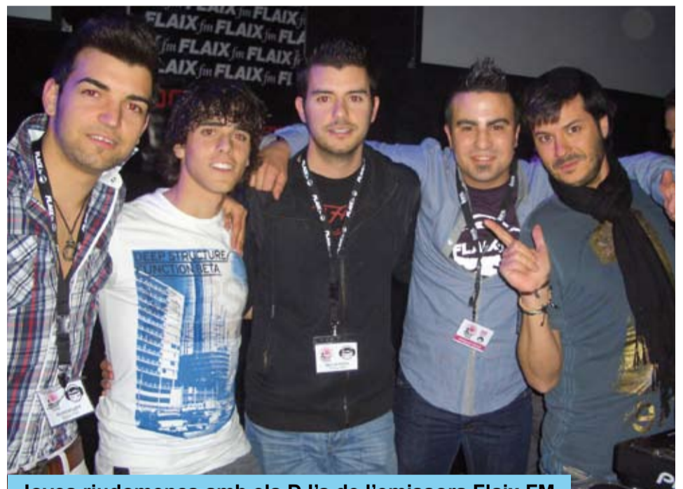
Joves riudomenscs amb els DJ's de l'emissora Flaix FM