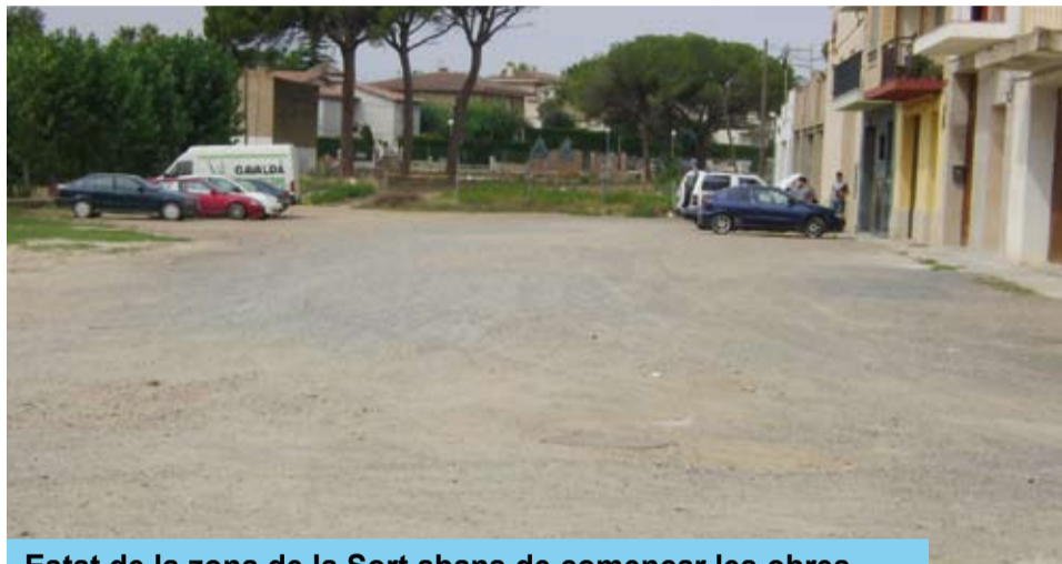
Estat de la zona de la Sort abans de començar les obres

Així doncs, la Brigada Municipal ha fet les obres de pavimentació i col·locació d'enllumenat públic per tal de resoldre provisionalment els problemes existents i deixant l'entorn en un perfecte estat.