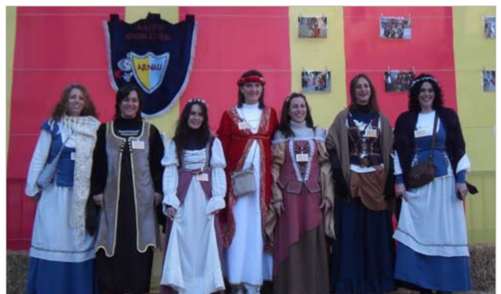
L'AMPA de l'Escola Cavaller Arnau i l'Ajuntament organitzen la festa