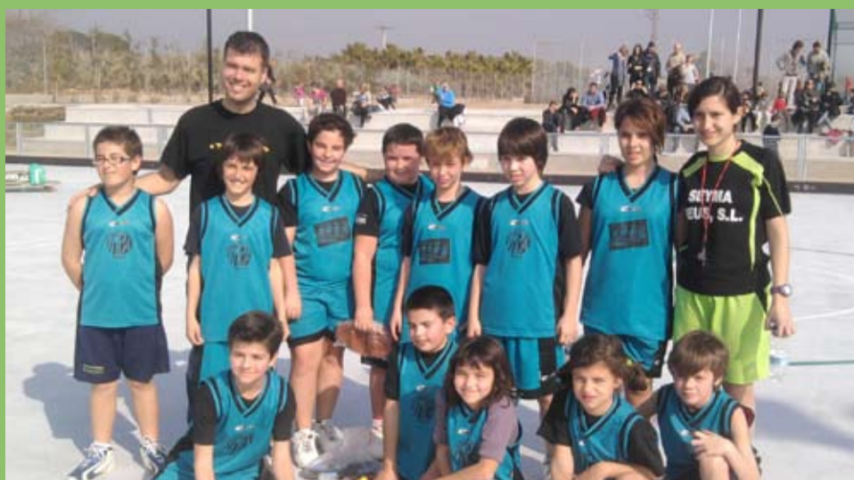
L'equip de bàsquet de l'AMPA de l'Escola Beat Bonaventura