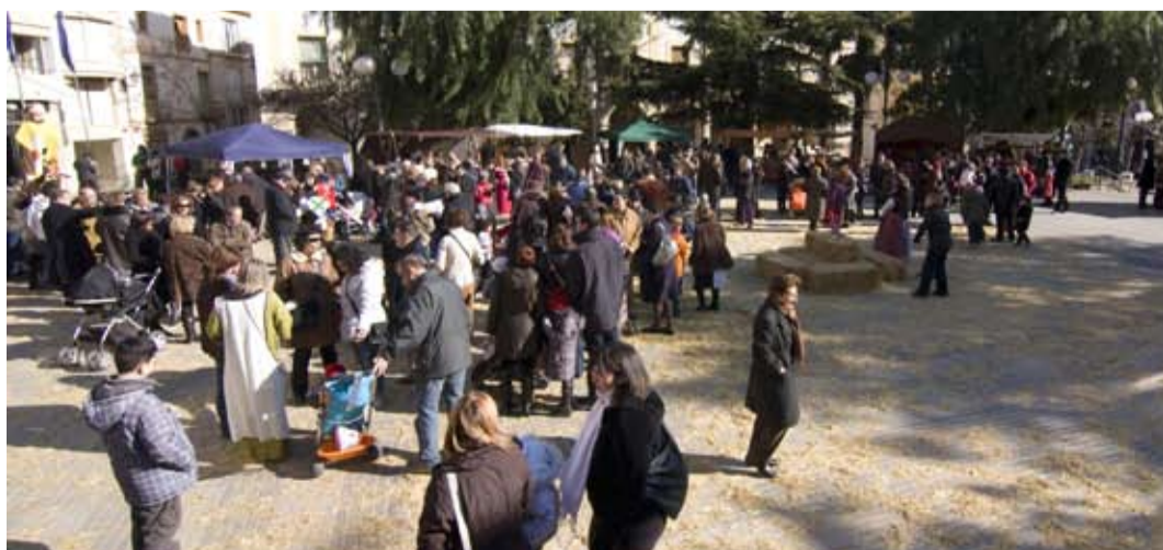
El 25 de gener de 1151 es va atorgar la Carta de Repoblament de Riudoms

Rivoulmorum, 1151 - Riudoms, 2011 860 anys d'història