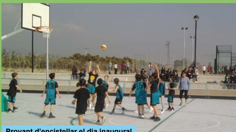
Provant d'encistellar el dia inaugural