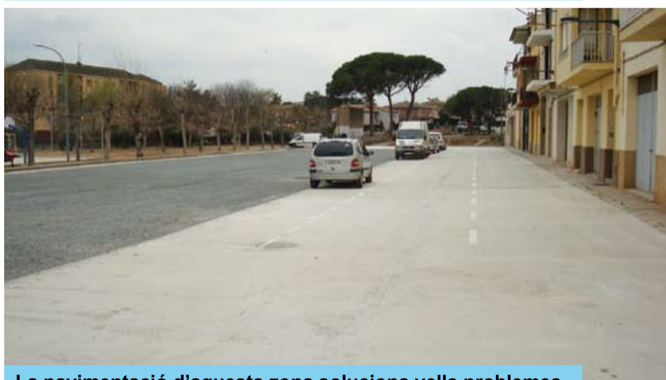
La pavimentació d'aquesta zona soluciona vells problemes