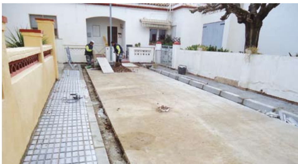
La Brigada Municipal impulsa diversos treballs de millora de carrers i espais públics, que amb el pas dels anys es poden haver malmès.