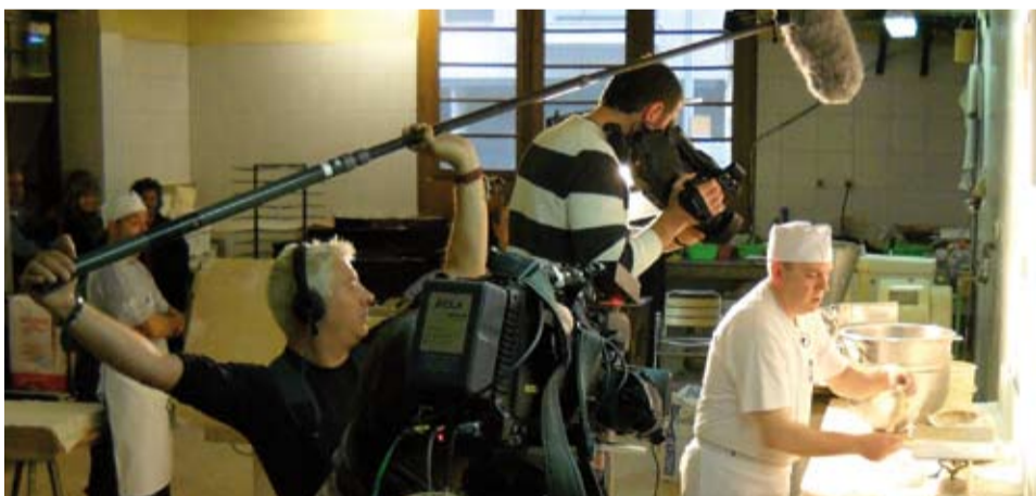
Tot un complet equip de televisió va gravar l'elaboració de la coca

Dissabte 12 de març el conegut actor Juan Echanove va seguir a Riudoms tot el procés d'elaboració d'aquest producte nostre, tan apreciat.