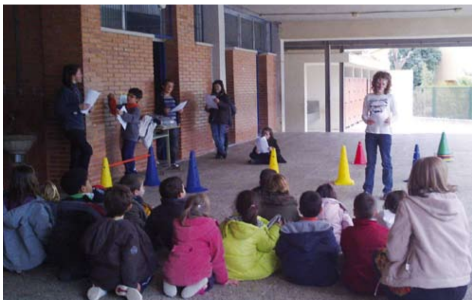
Més de 30 infants van participar a l'activitat impulsada per l'Ajuntament