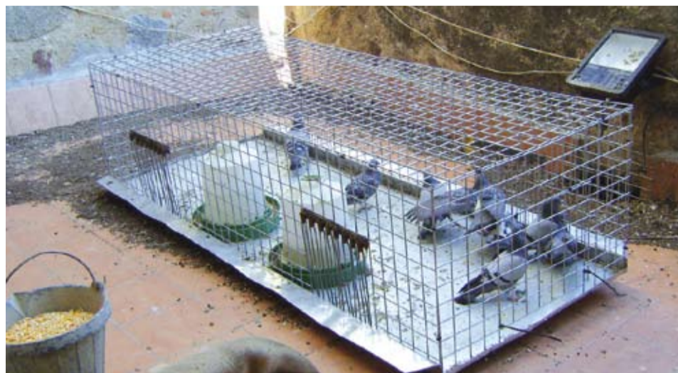
Les múltiples gàbies distribuïdes per diferents espais del poble permeten la constant reducció del nombre de coloms.