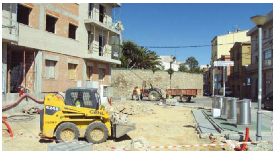
S'estan executant les obres de construcció d'una plaça pública al solar ocupat per l'antiga bàscula municipal.