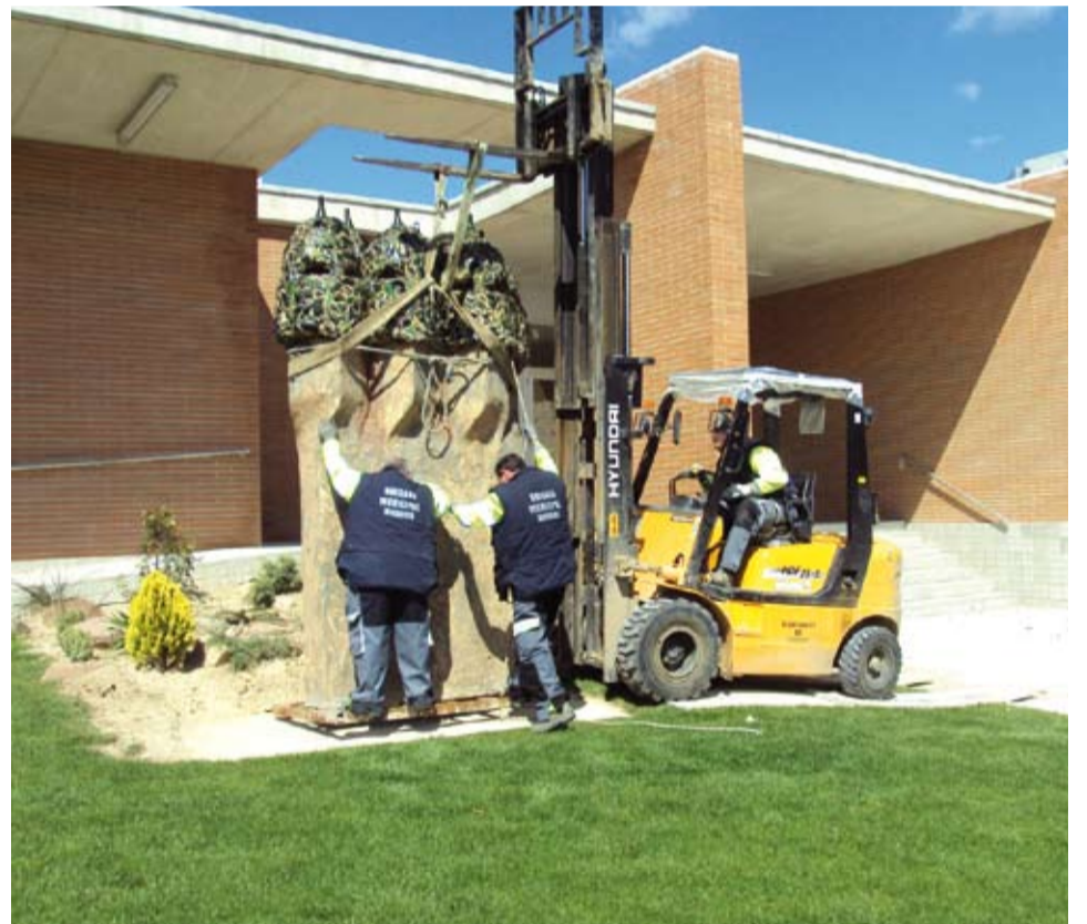
Les fumeres gaudinianes ja estan instal·lades a l'entrada principal