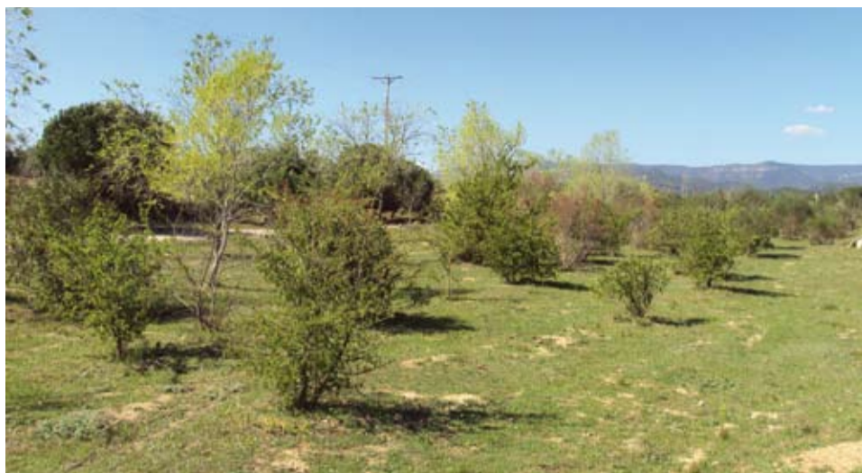
Comença a donar resultat l'esforç efectuat per l'Ajuntament en els darrers anys per a recuperar l'entorn de les rieres.