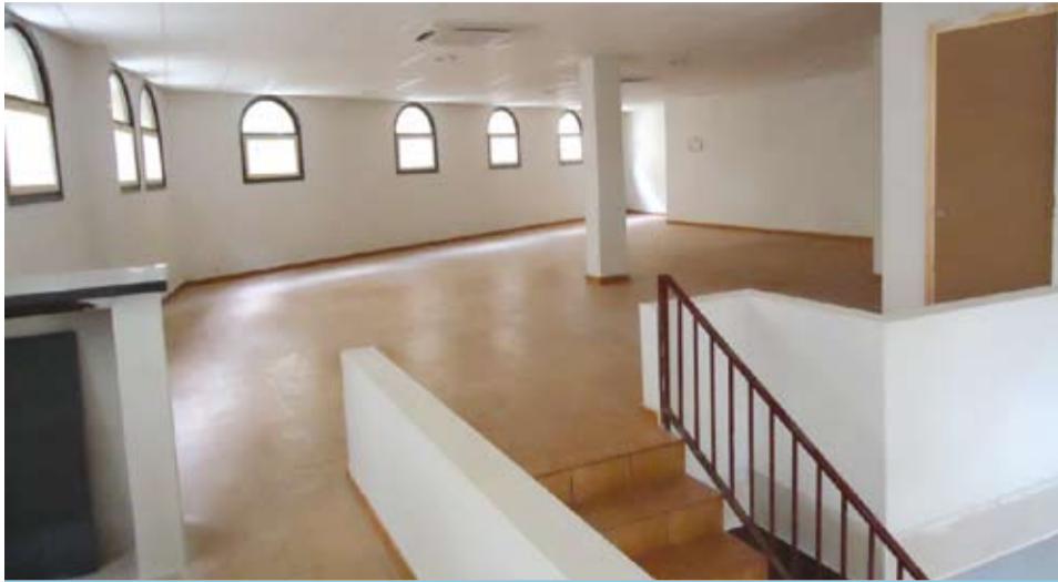
El Local Jove, situat a l'antic Mercat Municipal, disposa de dues plantes per a l'ús dels adolescents riudomencs de diferents edats.