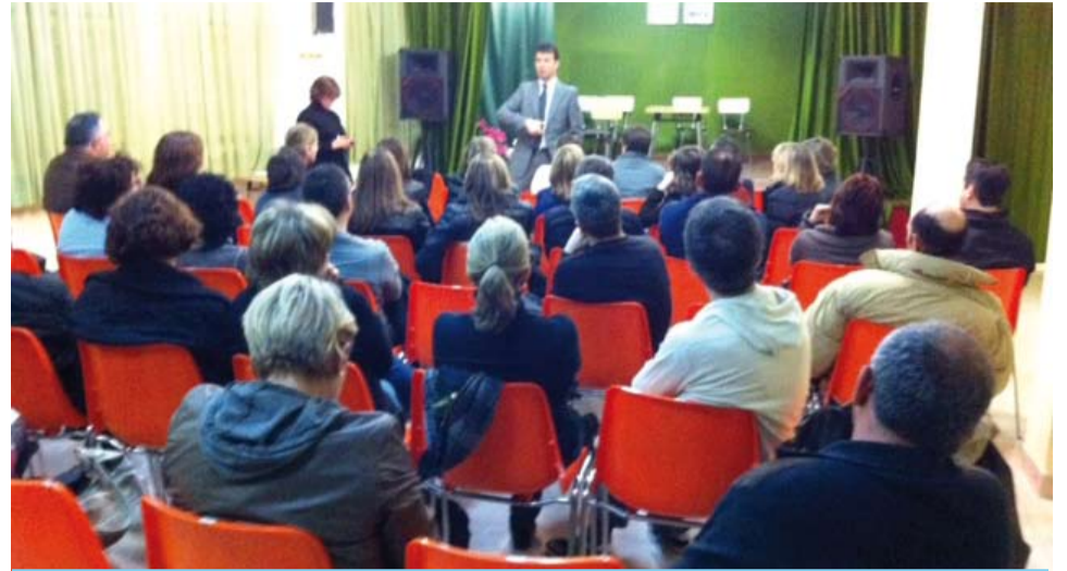
L'Ajuntament s'ha reunit amb els pares i amb els joves per tal de dissenyar conjuntament el nou Local Jove.