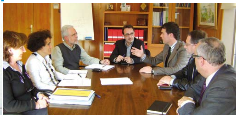
L'ampliació del CAP de Riudoms permetrà augmentar les prestacions i serveis d'aquest equipament, beneficiant a tots els usuaris