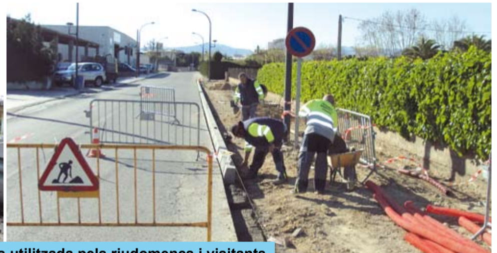
Aquestes obres permetran oferir una millor imatge per l'entrada més utilitzada pels riudomencs i visitants