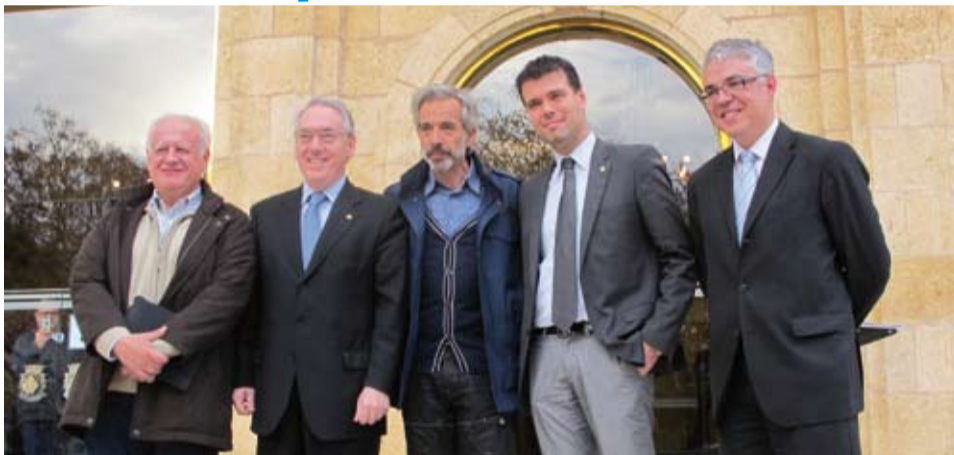
El programa també tractarà sobre altres productes tarragonins

Imanol Arias i Juan Echanove difondran la gastronomia de la Costa Daurada al programa de TVE "Un país para comérsele", amb la col·laboració de la Diputació de Tarragona.