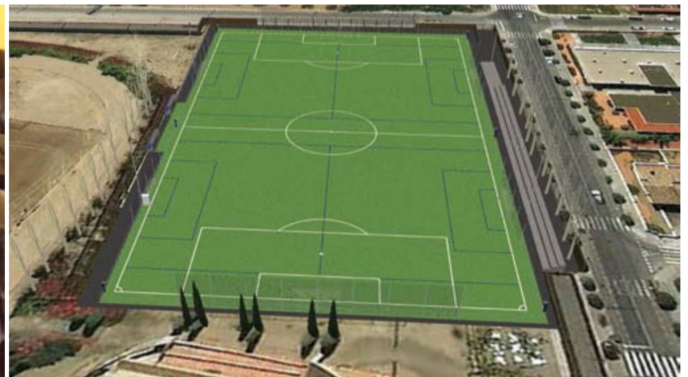
Una de les millors empreses instal·ladores de camps de gespa artificial ja ha lliurat a l'Ajuntament de Riudoms el projecte de l'obra