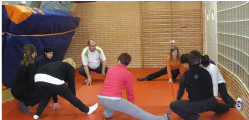
Organitzat per l'Ajuntament, en col·laboració de l'AMPA Beat Bonaventura