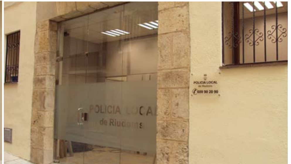
La creació de la Policia Local ha fet possible la posada en servei d'unes noves instal·lacions, situades a la planta baixa de l'antic Hospital