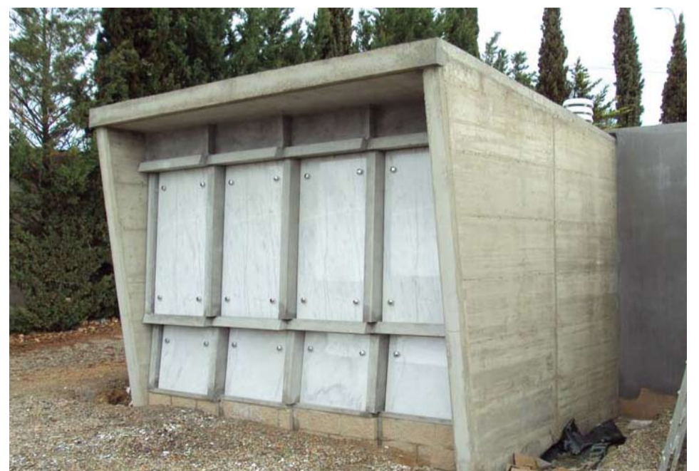
Dos mòduls de nous nínxols estan a disposició dels interessats