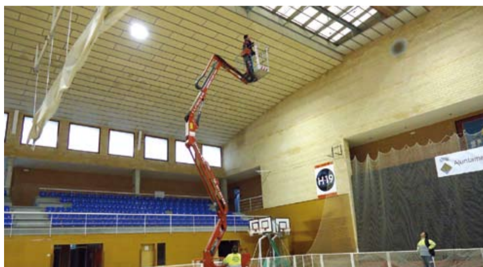
S'aprofita els dies de pluja per reparar les goteres del Pavelló