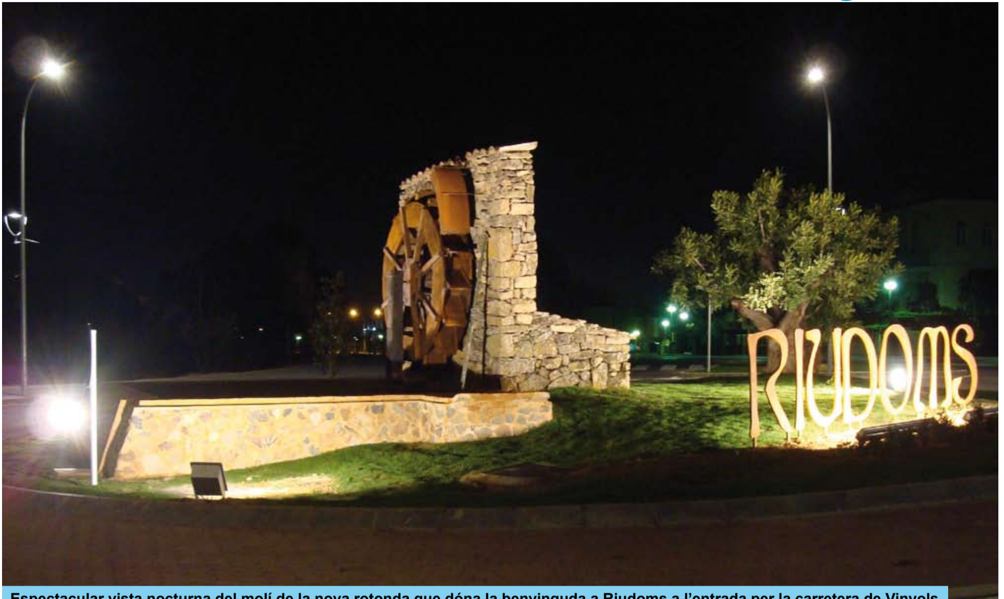
Espectacular vista nocturna del molí de la nova rotonda que dona la benvinguda a Riudoms a l'entrada per la carretera de Vinyols