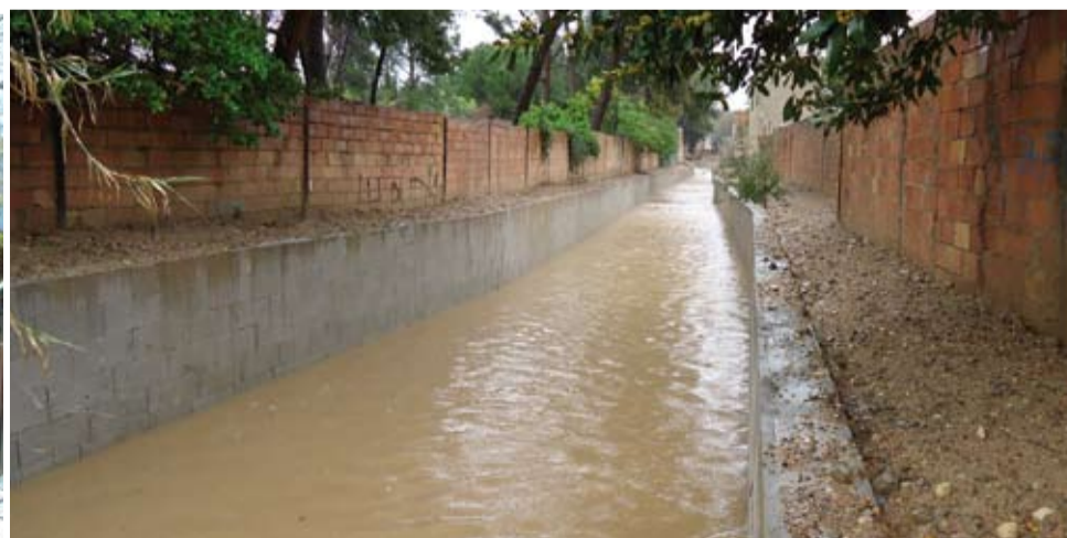
Aquesta demanda dels veïns ha estat resolta amb la canalització d'aquest barranc, alhora que ha permès treure la paret que l'ocultava