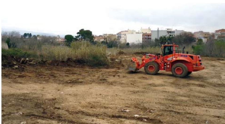
La neteja de l'antic Forn del Solé ha augmentat els aparcaments