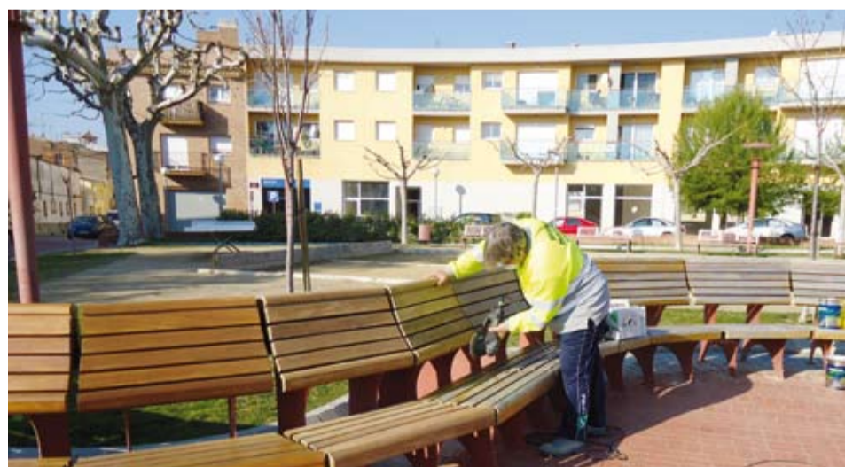
S'estan restaurant els bancs de fusta de la Plaça de l'Arbre