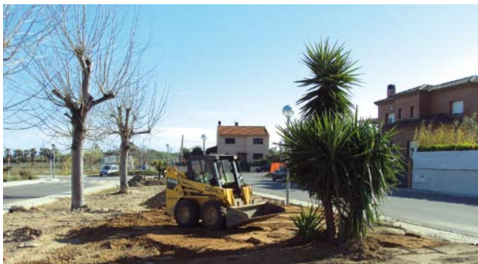
Enjardinament de diversos espais del Barri del Molí d'en Marc