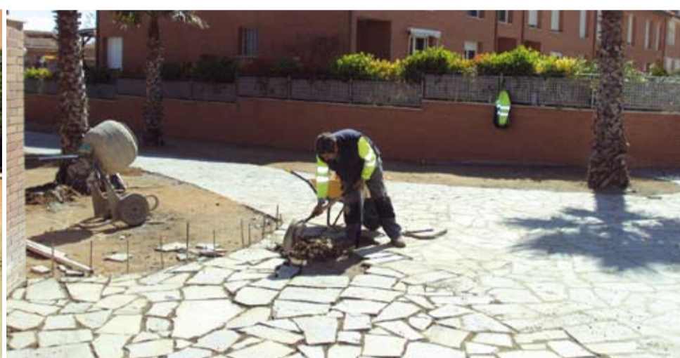
Les restes romanes i els seus voltants presenten un magnífic aspecte amb la finalització d'aquestes obres d'enjardinament