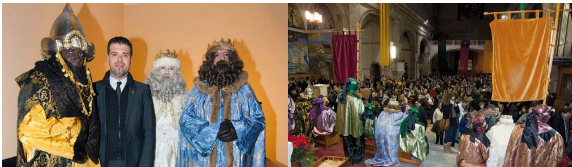
Ses majestats els Reis Mags d'Orient van portar desitjos de pau, amor i felicitat per a totes les llars i famílies riudomenques