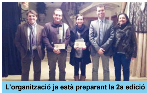
L'organització ja està preparant la 2a edició