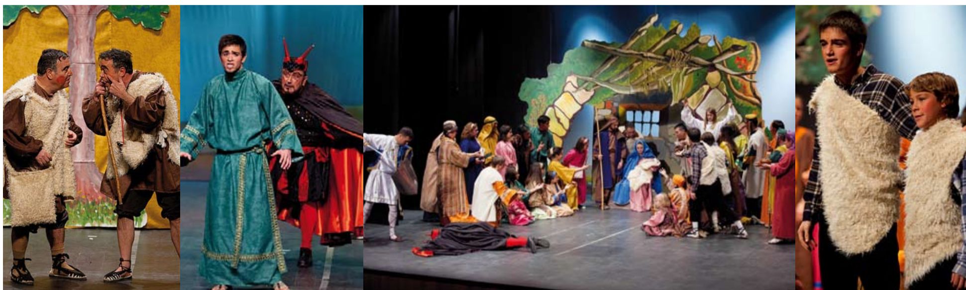
Al nou Casal, s'ha presentat una versió dirigida per Artur Fargas dels tradicionals Pastorets, amb la col·laboració de més de 150 persones