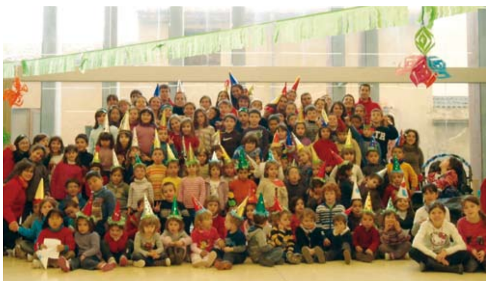
El Nadal Genial va oferir quatre dies d'activitats per als més petits