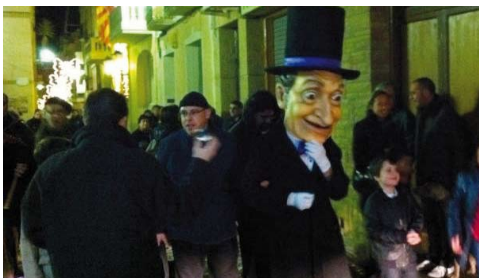
L'Home dels Nassos va tornar a ser a Riudoms el 31 de desembre