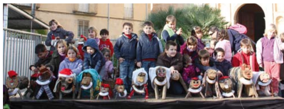
La Plaça de l'Església acull, durant tot el dia, activitats de promoció

El diumenge 11 de desembre, a la plaça de l'Església, es va instal·lar la 6a edició del tradicional Mercat de Nadal amb la participació dels comerços locals. Aquesta diada va servir perquè els riudomens i les riudomenques poguéssim fer les primeres compres nadalenes. Al matí, l'AMPA de l'escola Beat Bonaventura va organitzar una sortida per anar a "cridar el tió" i a la tornada, alguns es van voler fotografiar a l'escenari del Mercat de Nadal.