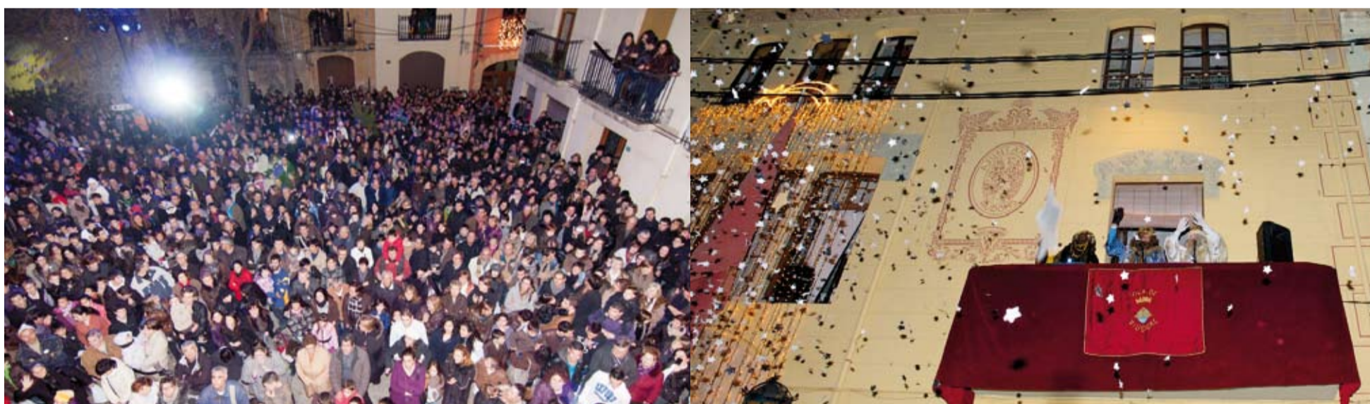
El seguiment massiu que els riudomencs oferim a l'arribada de la Cavalcada Reial, fa que Riudoms sigui un dels seus pobles preferits