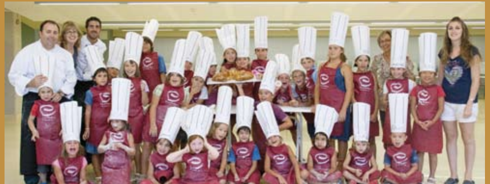
El curs infantil de cuina es va fer enguany durant dos dies