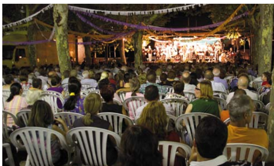
L'Orfeó Reusenc va omplir la plaça de Sant Antoni i ens va oferir un recull de grans èxits musicals de totes les èpoques

La programació cultural d'estiu Reviu les Places ha volgut comptar aquest any amb formacions de les nostres comarques i, especialment, vinculades amb Riudoms. La plaça de la Palmera va acollir la primera proposta d'enguany, el Grup Independent d'Art, que el dimecres 11 de juliol va oferir un espectacle musical de playbacks i coreografies amb diversos tocs d'humor. En l'espectacle que ens van presentar hi van col·laborar, de manera diversa i desinteressada, més de seixanta persones, que des de sempre, han estat o estan involucrades en el dia a dia de Riudoms.