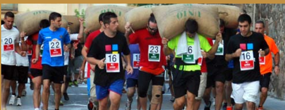
La cursa de portadors de sacs de Riudoms tanca la "Combinada"