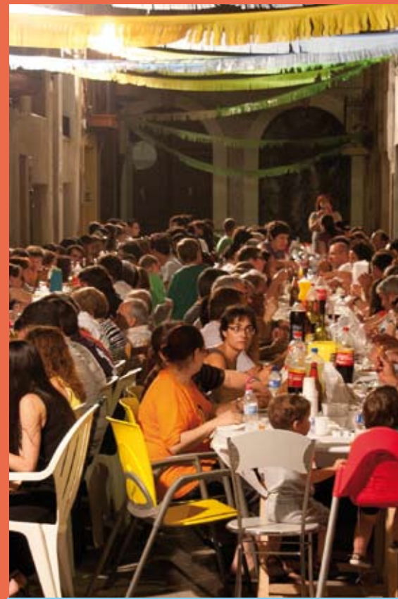
Sopar al Barri del Colomer

3r premi: BARRI DEL MOLÍ D'EN MARC (Rocieros)