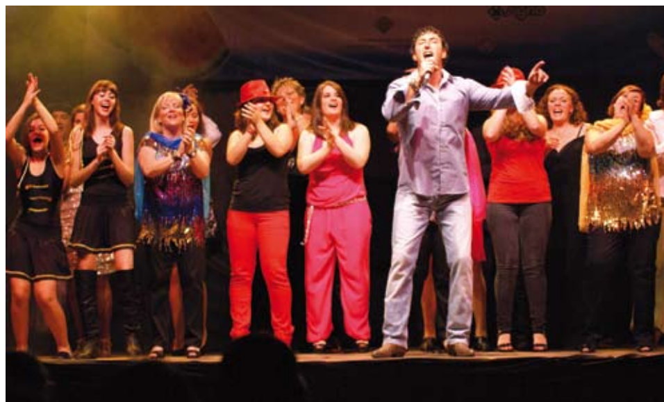
El Grup Independent d'Art de Riudoms va fer la primera de les actuacions, a la Plaça de la Palmera, del Reviu les Places 2012