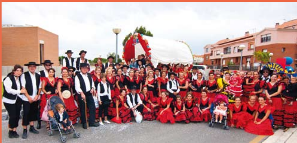
Barri Molí d'en Marc