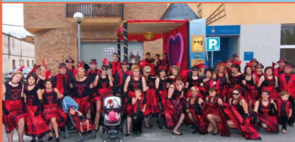
Barri de la Raval