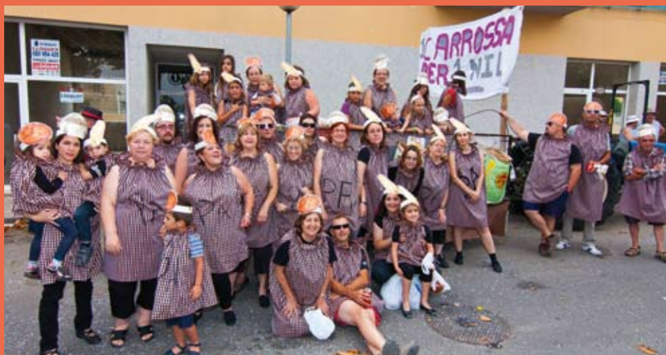
Barri del Carrer Major