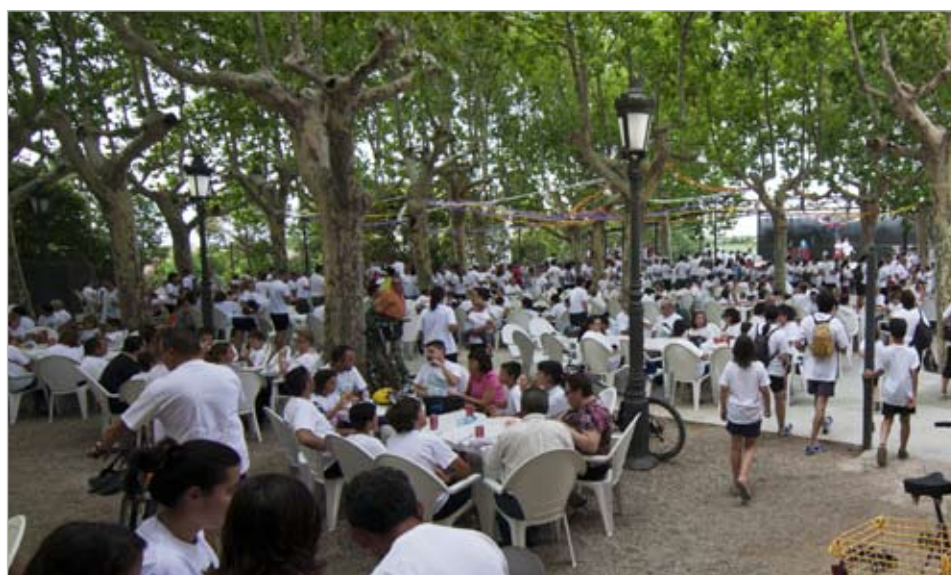
La Bicicletada Popular va arribar enguany als 1.300 participants. Els dos circuits proposats asseguren diversió per a tots els gustos