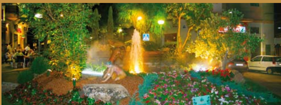
L'enjardinament de l'entrada dissenyat per "Vivers i Jardineria Jordis"