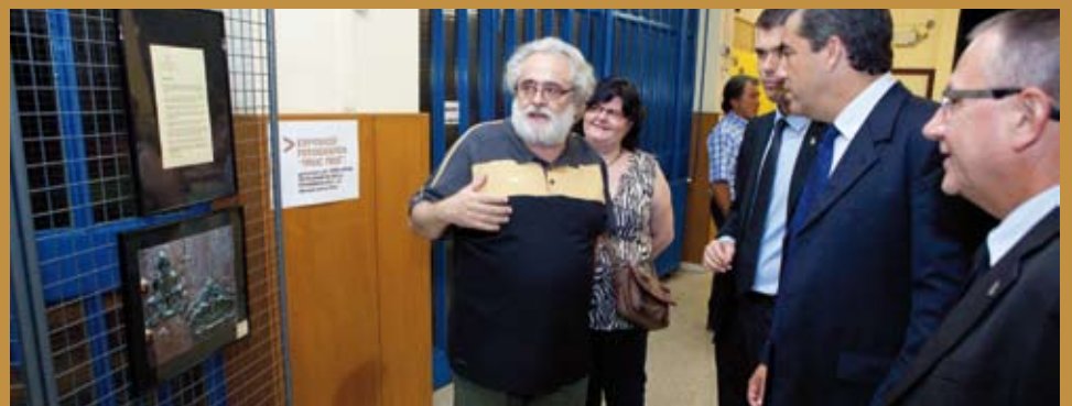
Sebastià Griñó, autor de les fotografies d'antics trucadors de portes