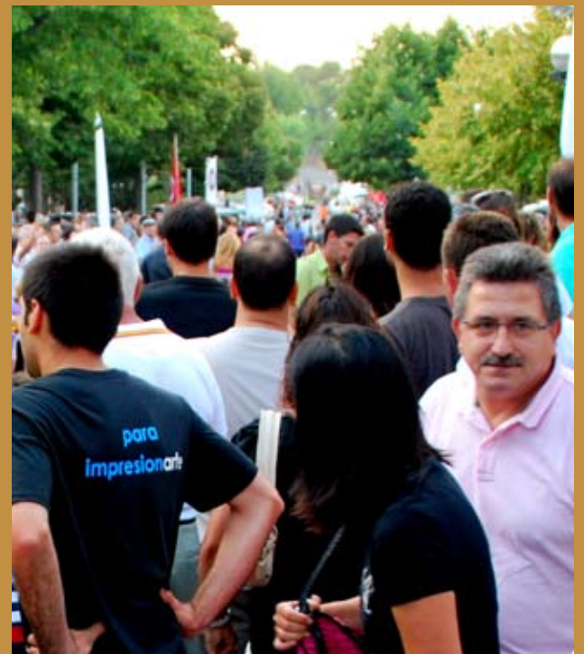
La Fira sempre aplega molts visitants