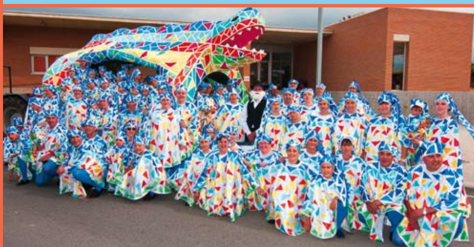
Barri de les Escoles