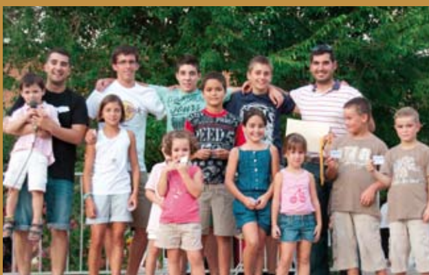
Els llençadors de mòbils usats