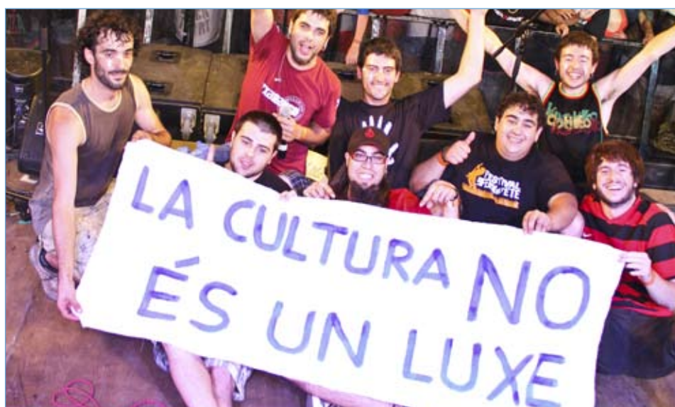
Les Ulé Barraques apleguen molts joves de Riudoms i les comarques veïnes durant les dues nits del cap de setmana de la festa major