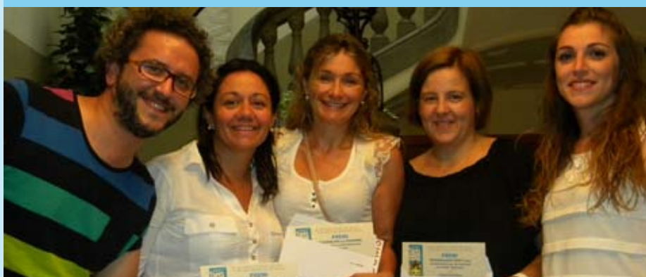
Les regidores de Promoció Econòmica i de Joventut lliuren els premis als guanyadors dels tres sortejos. Que ho gaudiu!