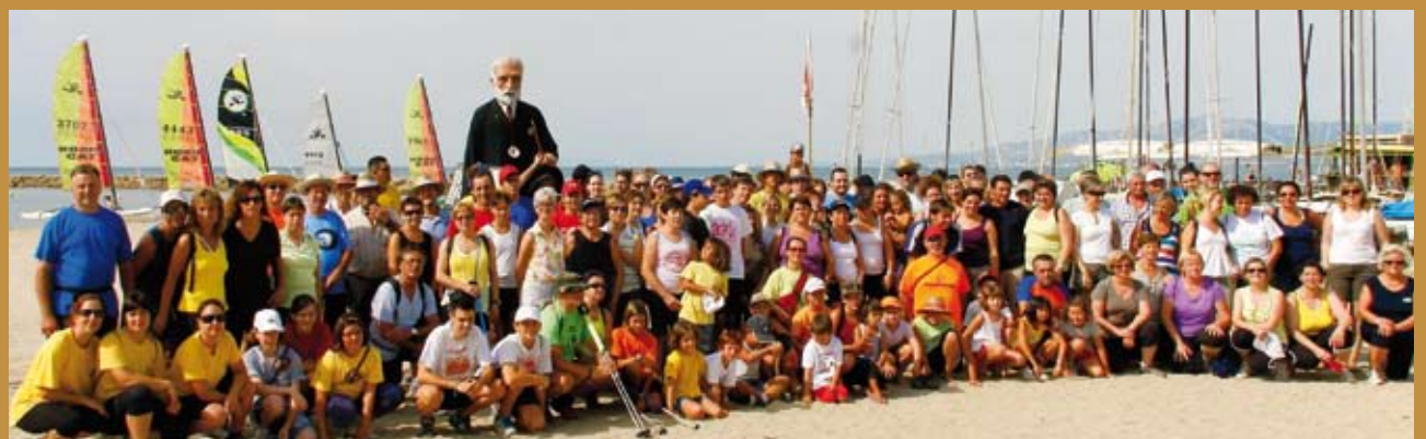
Enguany s'ha celebrat la 10a edició de l'"Anar a mar", organitzada per Amics de Riudoms