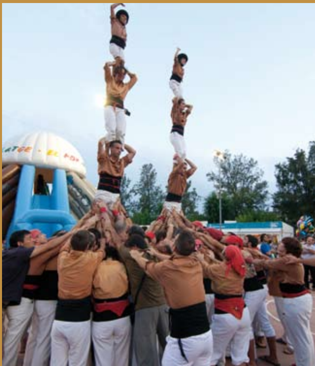
Xiquets avellana, amb "segons" riudomencs