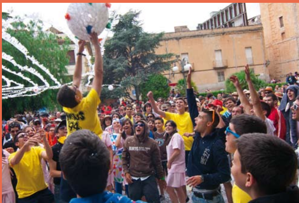
L'enramada final és un dels moments més especials de la festa