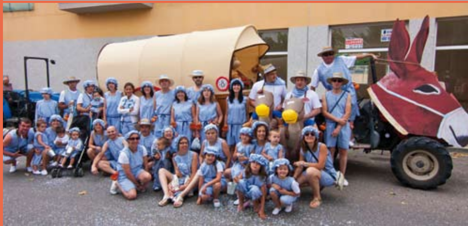
Barri de la Plaça