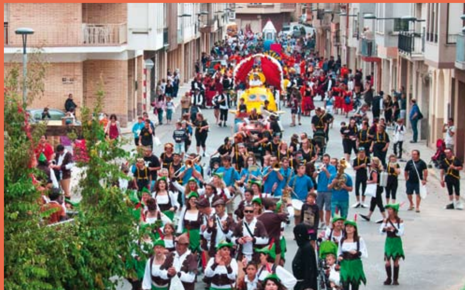
La rua de lluïment fa matinar més de 1.000 persones