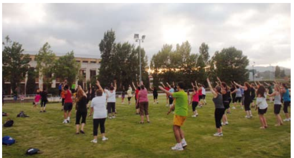
Els dimarts i els dijous de juliol es va practicar gimnàstica a la fresca a les instal·lacions esportives municipals