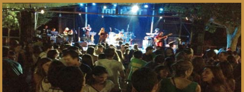
Una de les novetats va ser el Concert Jove amb l'Orquestra Mitjanit