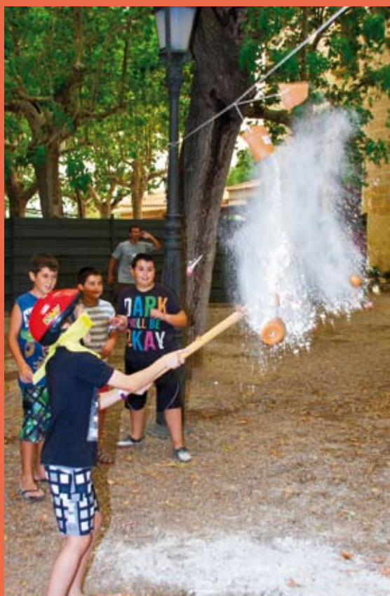
Jocs de cucanya per la canalla

Enguany ha tingut lloc la 25a edició (1988-2012) de la recuperació d'aquesta festa tant riudomenca que, malgrat tot, s'havia deixat de fer l'any 1977. Entre tots, hem fet que estigui més viva que mai. L'enhorabona a tothom!