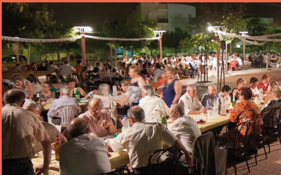
Els 10 barris organitzen els seus sopars a la fresca