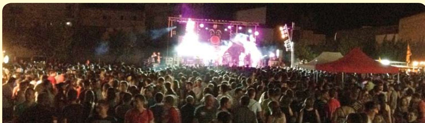
La festa de barraques és un dels actes d'estiu més concorreguts per la gent més jove

Edita: Ajuntament de Riudoms C. Major, 52 43330 Riudoms www.riudoms.cat ajuntament@riudoms.cat 977 85 03 50