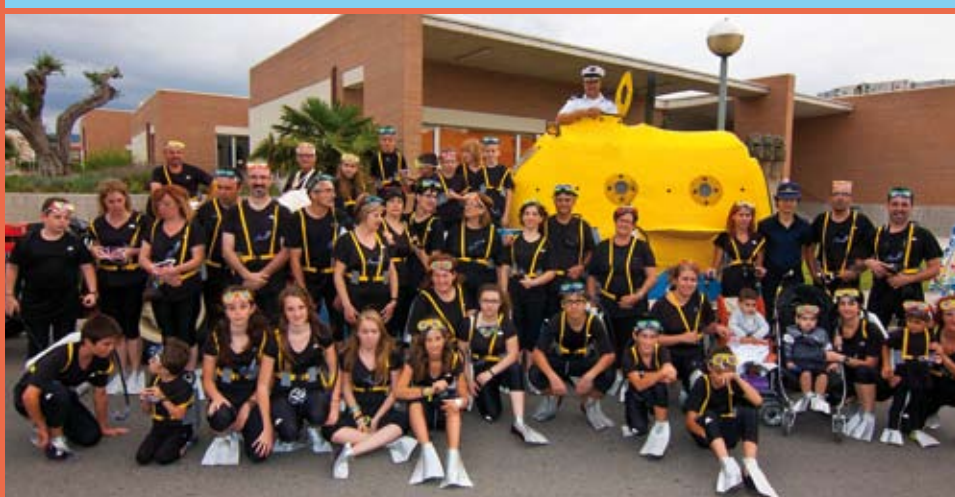
Barri de Sant Sebastià