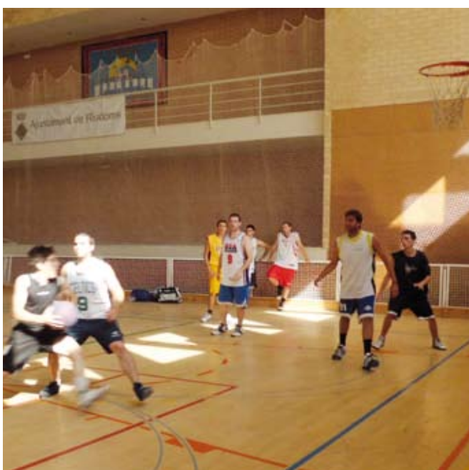
3r Torneig de Bàsquet 3x3 a favor de Caritas

Un any més, Riudoms s'ha posat en forma aquest estiu. Aprofitant el bon temps i les estones de lleure, més de 1.500 persones han gaudit de dilluns a divendres de les activitats esportives que la Regidoria d'Esports ha ofert durant el mes de juliol i que ha comptat amb la col·laboració de L'Estudi i el Centre Actiu. L'èxit de participació ha permès consolidar aquesta iniciativa adreçada a totes aquelles persones interessades a practicar diferents esports.