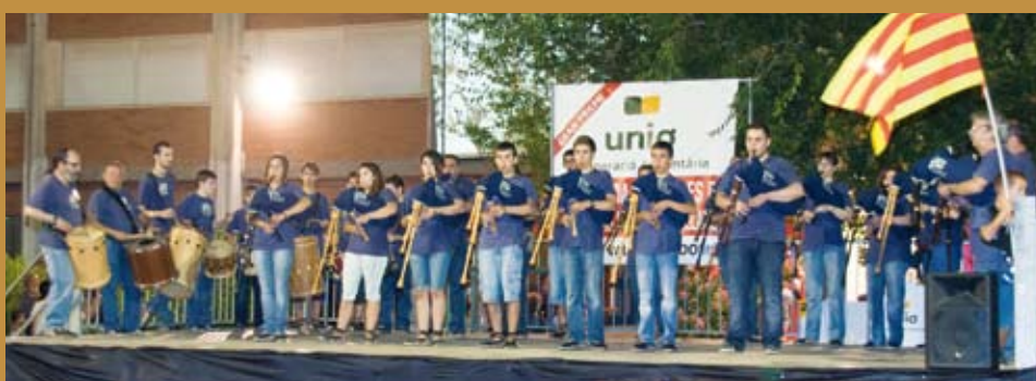
Els Sacaires de Tarragona van fer el concert de cloenda de la Fira