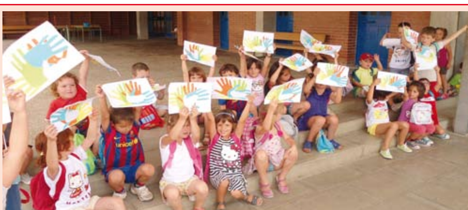
L'Escola de Lleure està consolidada com a activitat d'estiu, des de P-3 fins a 1r d'ESO, amb la participació de 125 nens i nenes