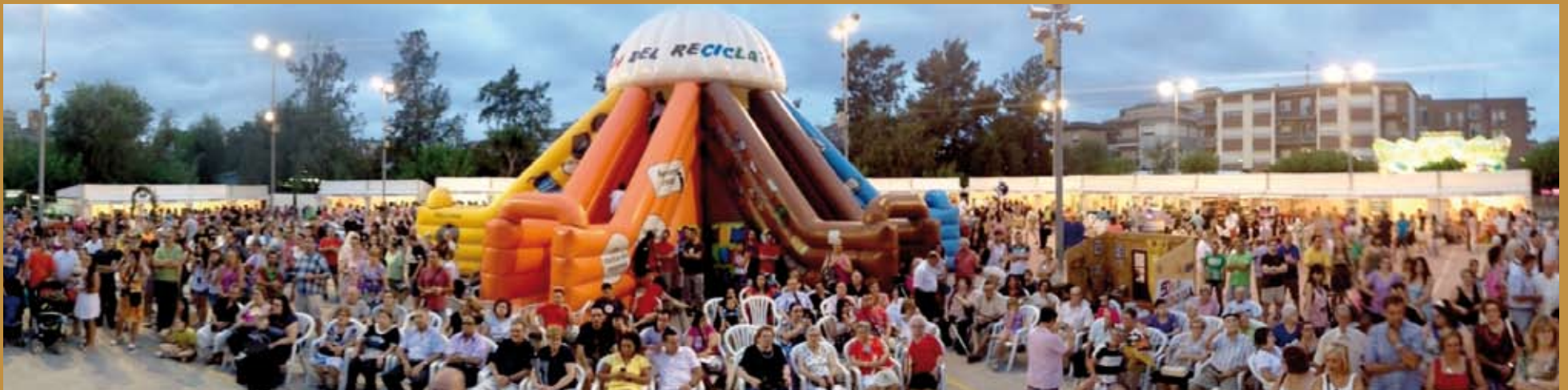
Novedosa visió panoràmica de la fira, en la que es veu el pati de les escoles, feta des de l'escenerai de la fira