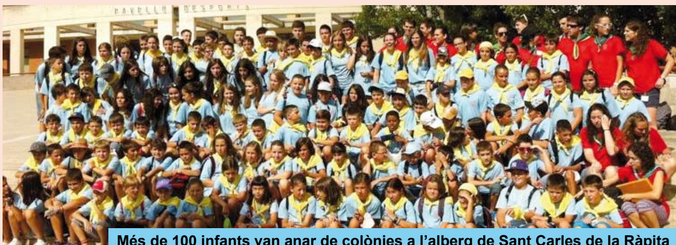
Més de 100 infants van anar de colònies a l'alberg de Sant Carles de la Ràpita

D'altra banda, del 29 de juliol al 5 d'agost, més d'un centenar de nens i nenes van marxar de colònies amb l'Esplai del Casal Riudomenc, a Sant Carles de la Ràpita.