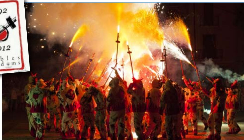
La celebració del Correfoc dels 20 Anys de la Colla de Diablers de Riudoms va fer lluir especialment la Festa Major d'estiu de Riudoms