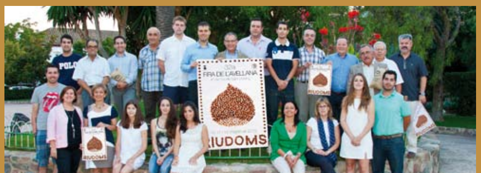
El Comitè Organitzador agraeix a tothom la participació i implicació