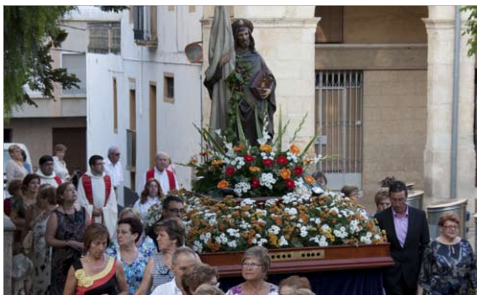
La processó de Sant Jaume Apòstol, copatró de la nostra vila