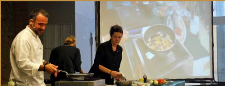
Les 3 jornades de La Cuina de l'Avellana ens van oferir noves receptes