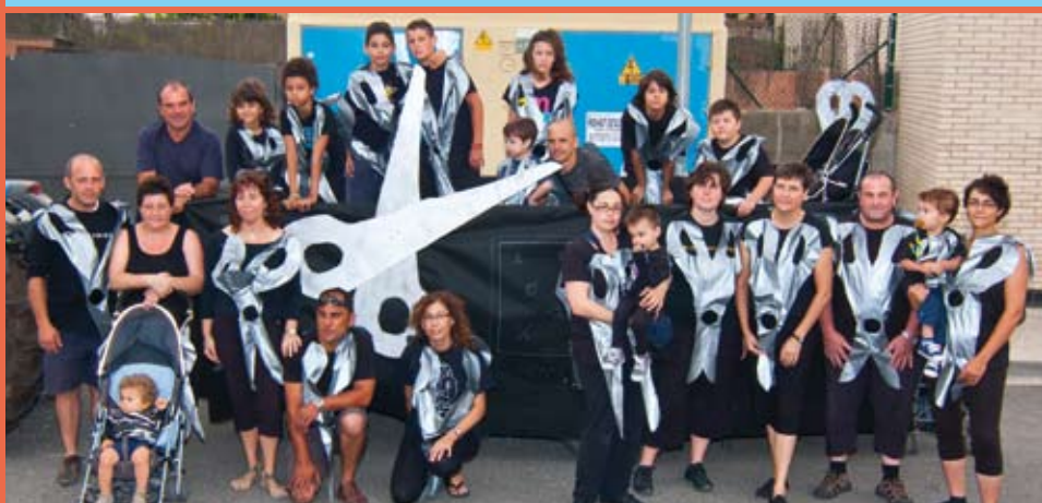
Barri del Colomer