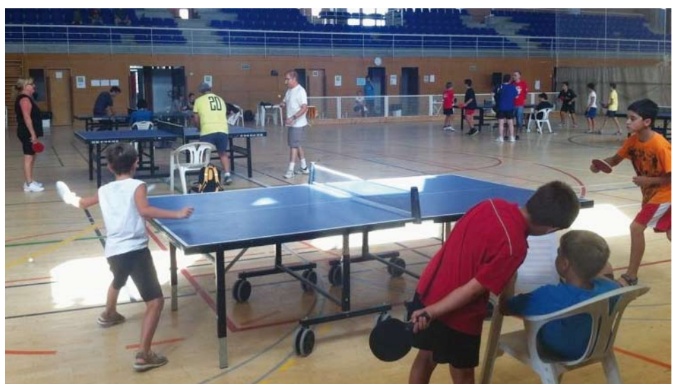
Campionat de Tennis Taula disputat al Pavelló Municipal