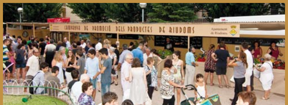
L'Ajuntament destina el seu espai a la promoció de productes locals