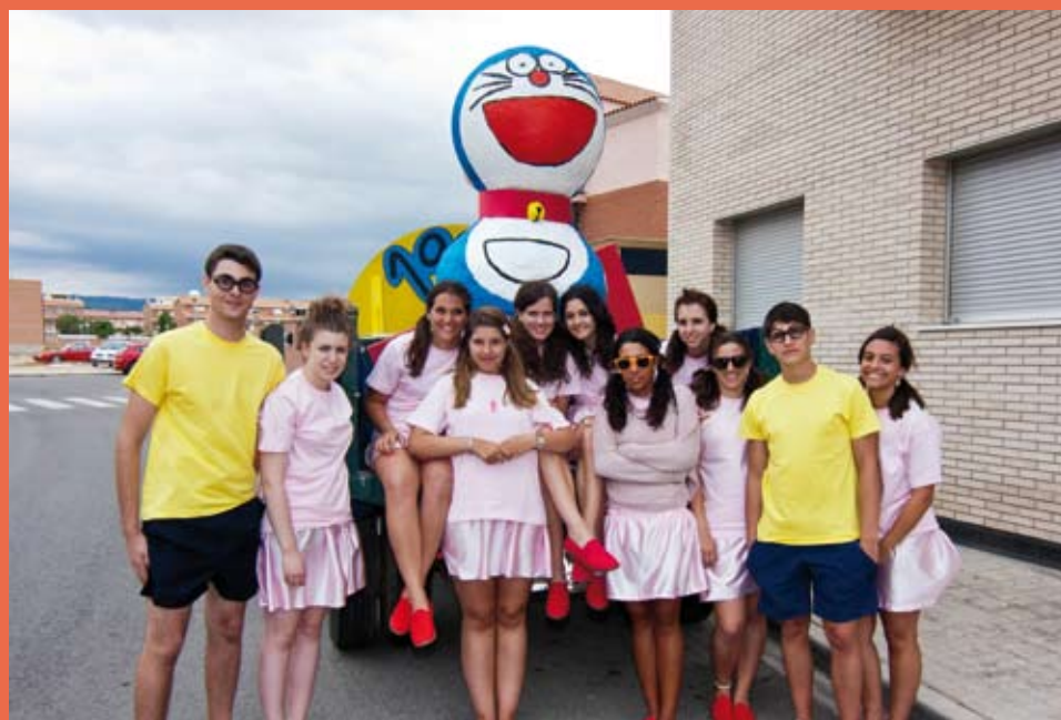
Els quintos que compleixen 18 anys participen activament dels Barris