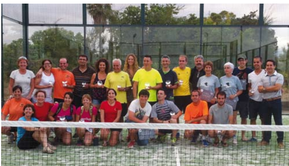
En aquest torneig s'ha estrenat oficialment la 2a pista de pàdel