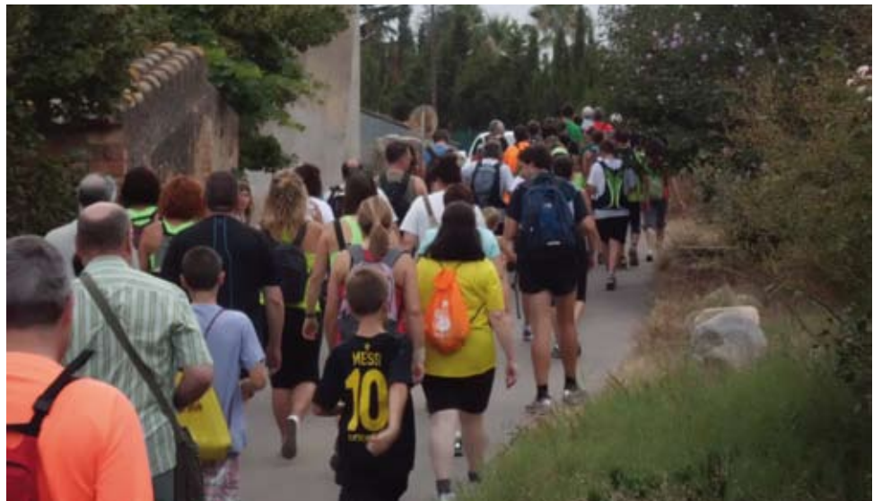
Cada divendres del mes de juliol s'han dut a terme caminades pel terme de Riudoms, amb una distància i participació creixent