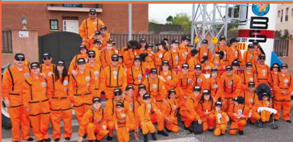
Barri de Sant Antoni