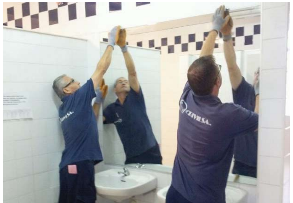
Renovació dels miralls dels vestidors que estaven deteriorats