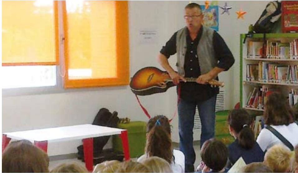
Acte d'inauguració de L'Hora del Conte 2012 - 2013

A partir del 12 de setembre s'ha encetat la nova temporada a la Biblioteca Municipal. L'Hora del Conte és una iniciativa del Grup Municipal de Lectura de Riudoms que, a través dels pares i mares voluntaris que expliquen els contes, pretén fomentar l'hàbit de la lectura entre els infants. Un any més i des de en fa dotze anys, aquesta activitat setmanal es desenvolupa cada dissabte no festiu al llarg del curs escolar, a 2/4 de 12 del matí.