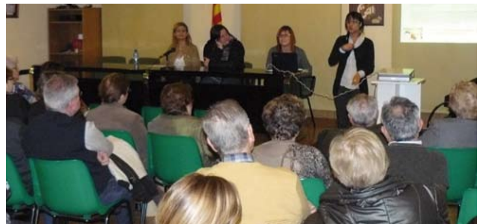
Les xerrades sobre temes de salut han comptat amb la col·laboració professional de L'Onada i el CAP de Riudoms

Podeu rebre més informació a les Oficines de l'Ajuntament de Riudoms o al 977 85 03 50.