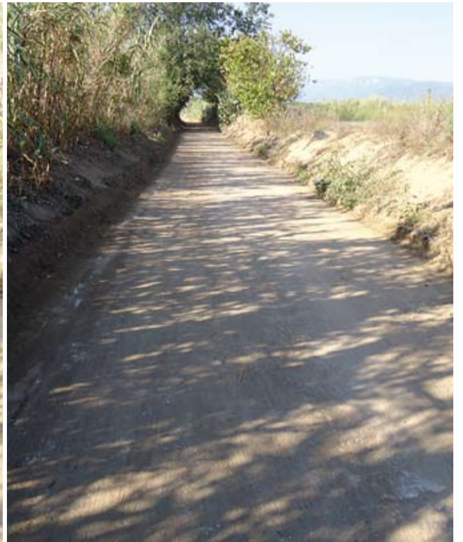
Diferents moments de la millora efectuada en el Camí del Molí de Vent