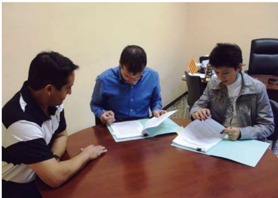
Signatura del contracte d'explotació del bar del Camp de Futbol

A través d'aquesta concessió, l'adjudicatària i el seu marit es faran càrrec de les obres de construcció d'un nou Bar-Restaurant, que de ben segur, permetrà oferir un millor servei als usuaris d'aquestes instal·lacions municipals i a tot el públic en general.