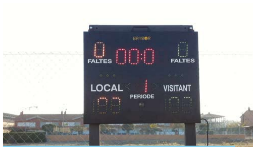
Nou marcador electrònic instal·lat a les pistes poliesportives