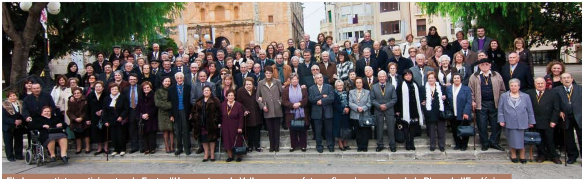
Els homenatjats participants a la Festa d'Homenatge a la Vellesa, es van fotografiar a les escales de la Plaça de l'Església