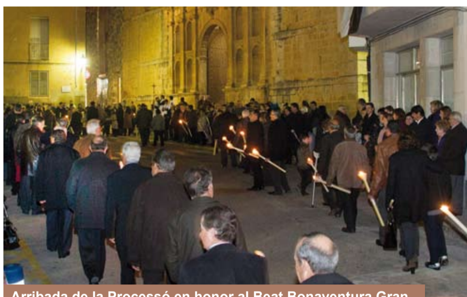
Arribada de la Processó en honor al Beat Bonaventura Gran