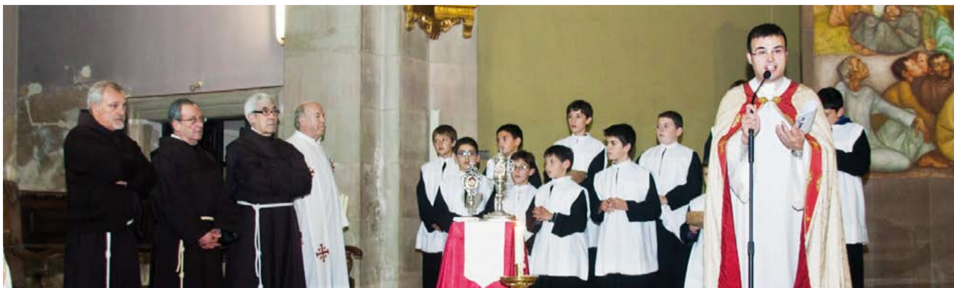
Ofici solemne, amb la presència del Postulador General dels Franciscans, que impulsa la causa de canonització del Beat Bonaventura