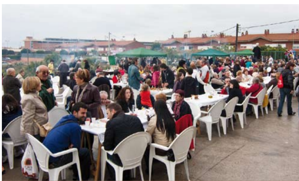
La Festa de l'Oli dóna la benvinguda a la nova collita de l'or líquid