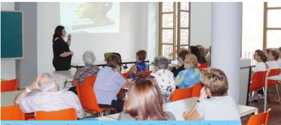
Taller de memòria, a càrrec de la Residència L'Onada