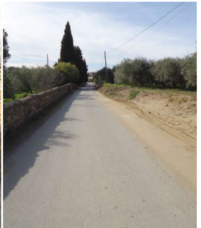
En la millora dels camins municipals s'han eliminat riscos per a la conducció com en aquest cas, al Camí de les Passeres.