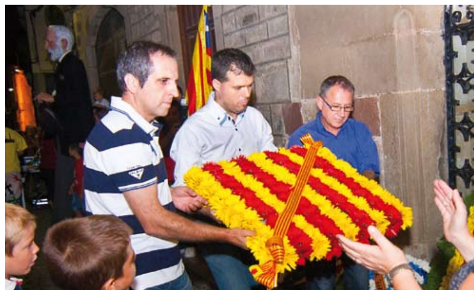
L'Assemblea Nacional Catalana de Riudoms va organitzar un acte unitari, conjuntament amb una gran representació de les entitats locals i persones a nivell particular. Representants dels grups polítics municipals de l'Ajuntament van fer l'ofrena en representació de tot Riudoms