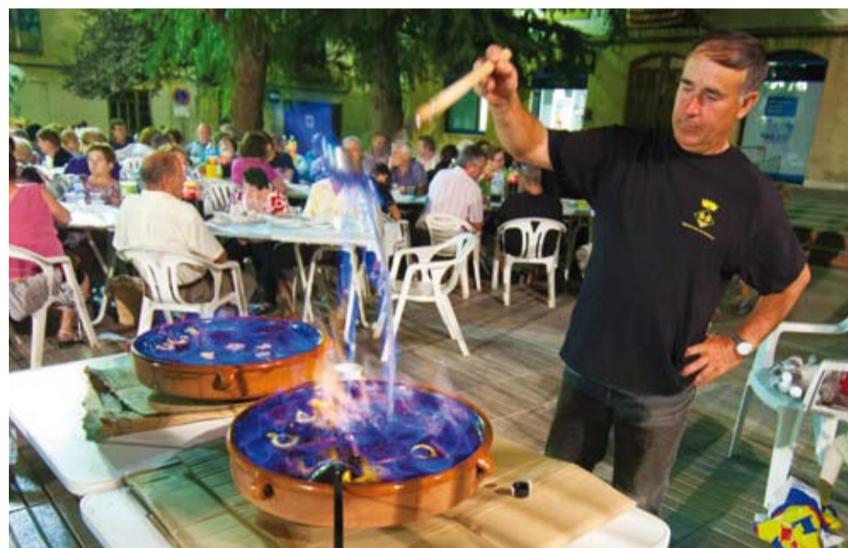
La sardinada popular i el rom cremat han esdevingut moments esperats de la celebració de la Diada a la Plaça de l'Església de Riudoms