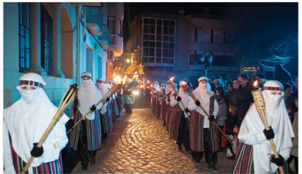
Tot Riudoms es bolca en l'arribada dels Reis Mags d'Orient