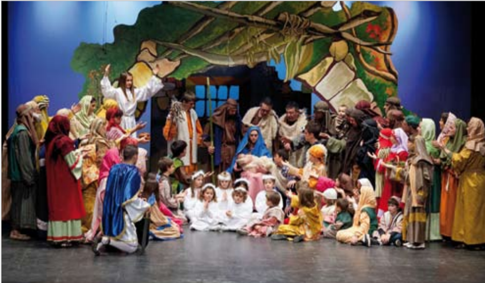
Ben bé 75 persones fan possible "Els Pastorets de Riudoms"