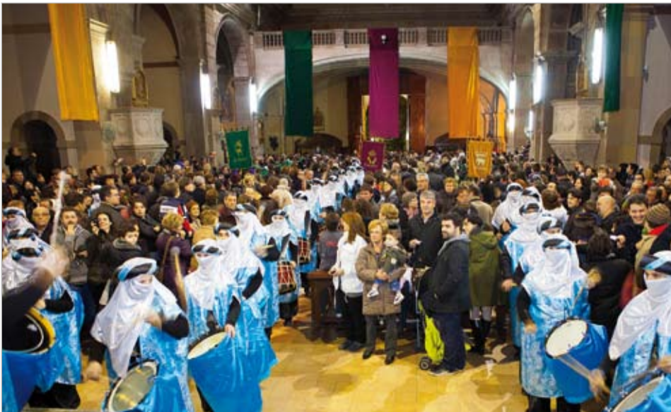
Tothom espera impacient el seu torn amb els Reis d'Orient