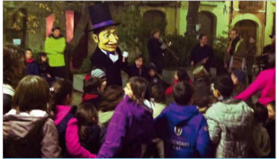
Cada 31 de desembre ens visita "L'Home dels Nassos"