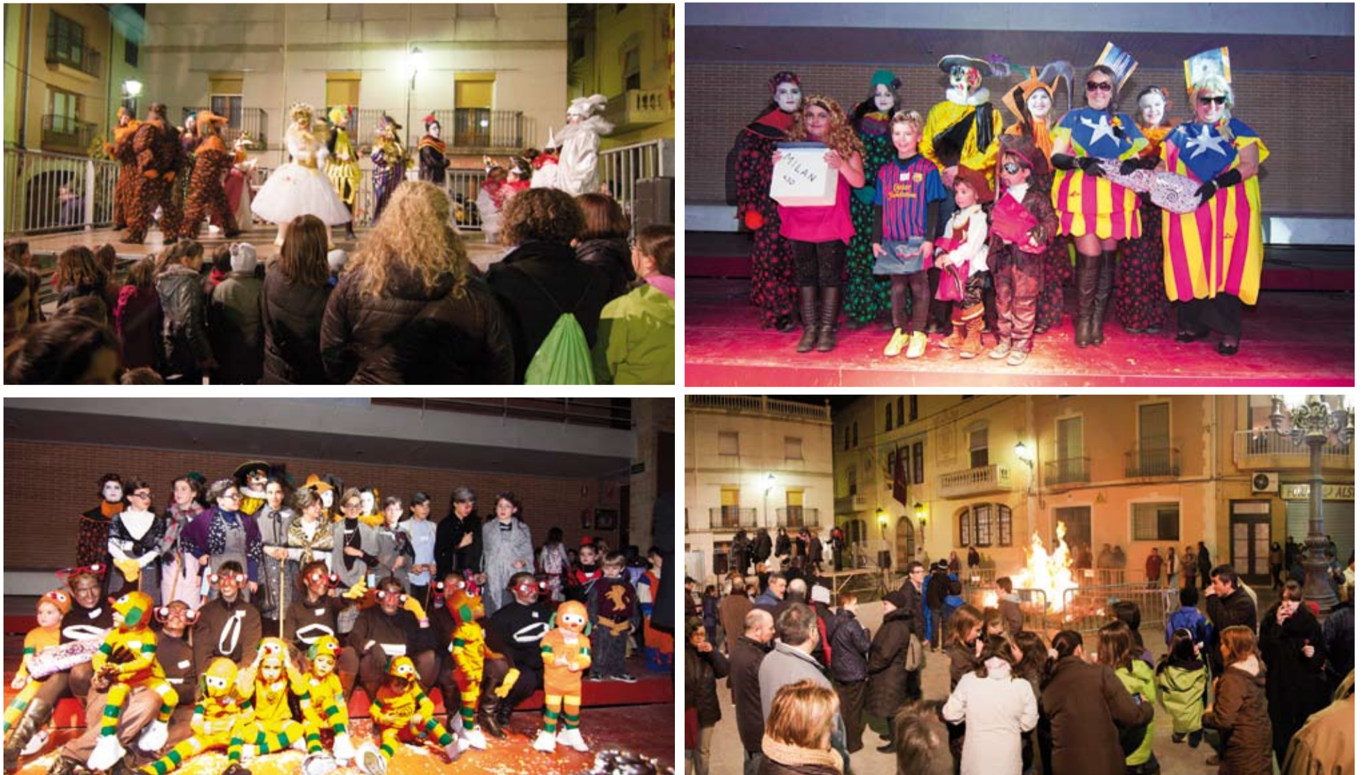
L'arribada i l'enterrament del Rei Carnestoltes, marca el període en el que la gresca, la xerinola i la disbauxa són les protagonistes.