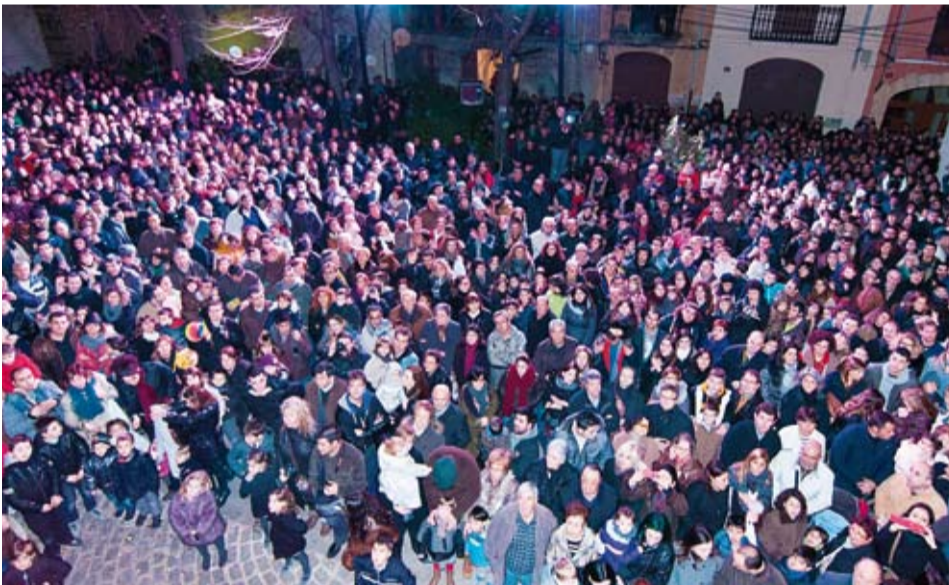
Massiva presència de públic per escoltar els parlaments reials