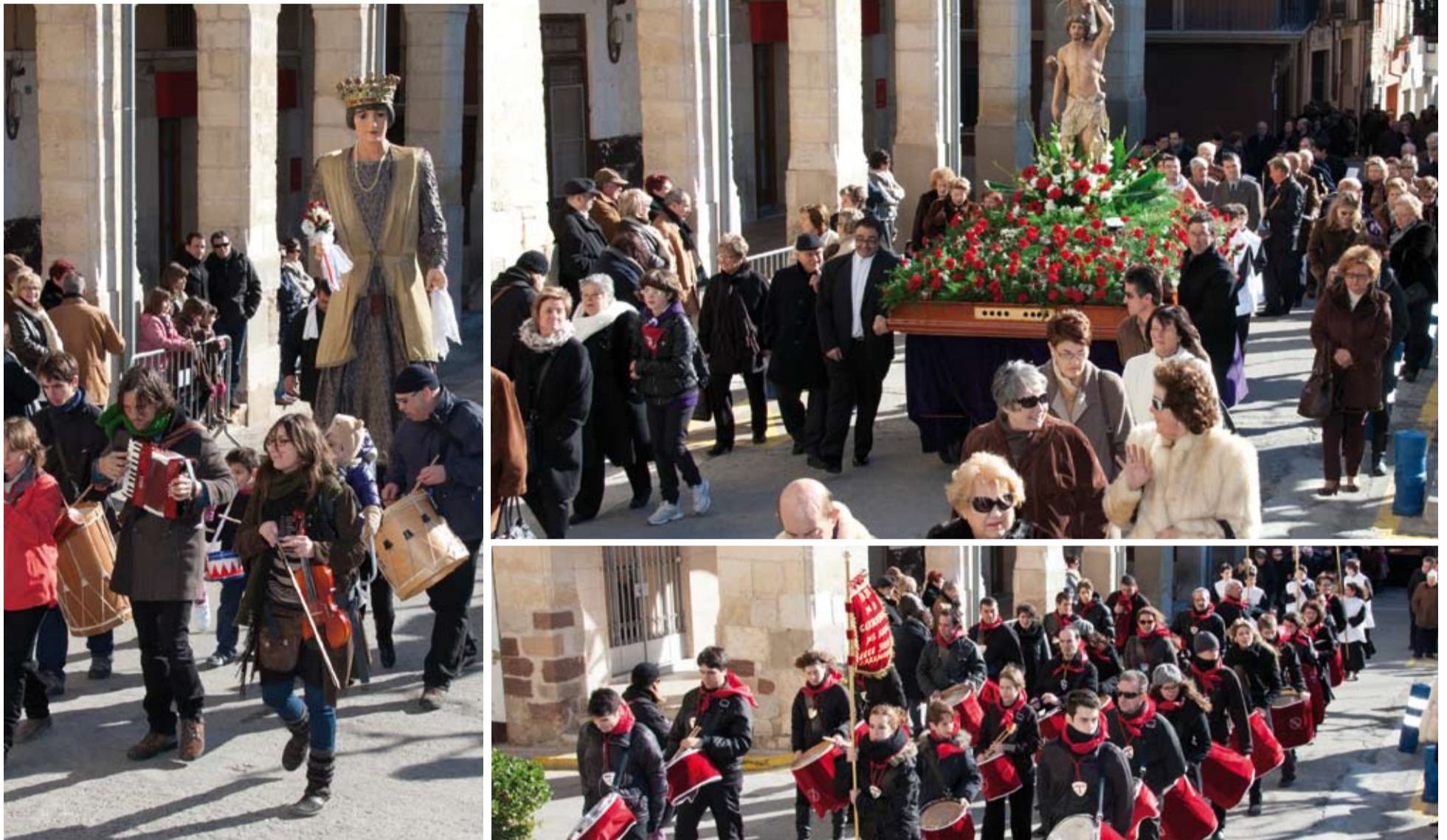
La Festa Major d'Hivern dedicada a Sant Sebastià es complementa amb la Trobada de Sacaires de Catalunya.