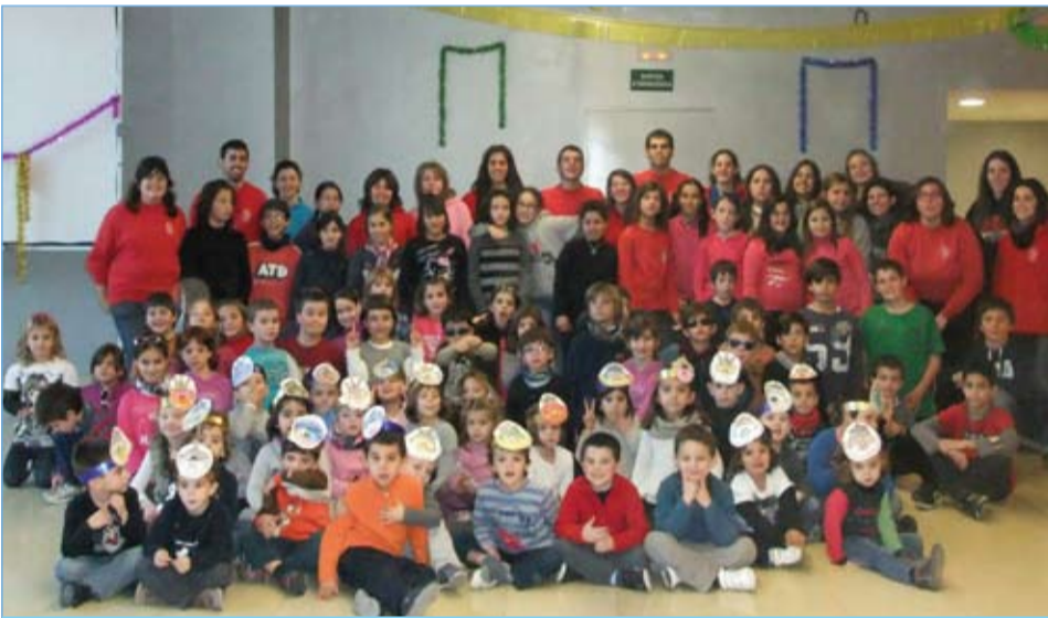
El 2, 3 i 4 de gener va tenir lloc una nova edició del Nadal Genial