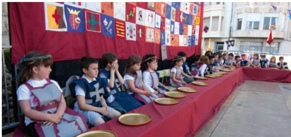
Els nens i nenes "medievals" també hi van participar activament

El 4 i 5 de maig, la plaça d'armes de l'antic castell medieval de Rivoulmorum va convertir-se en el centre de les mirades de les dames i els cavallers que s'hi van concentrar. El mercat, les actuacions i diverses gestes i proeses van omplir la festa que, any rere any, va fent-se lloc en el nostre calendari.