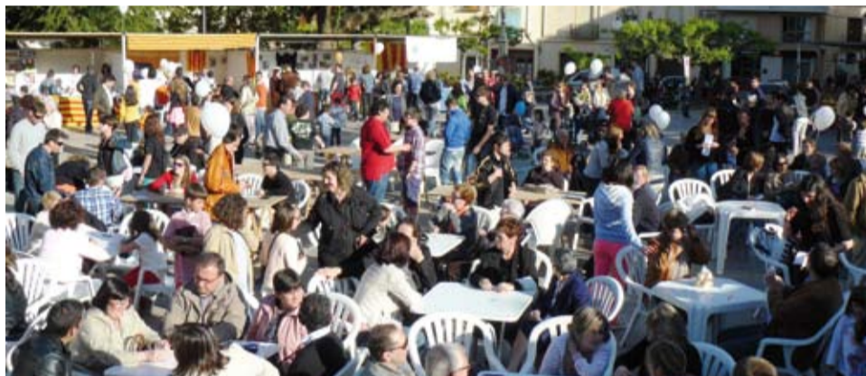
Durant la Diada de Sant Jordi la plaça de l'Església va acollir diverses activitats festives