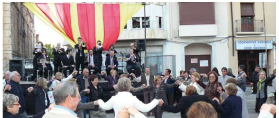
Es va cloure aquesta jornada festiva i cultural amb la tradicional ballada de sardanes