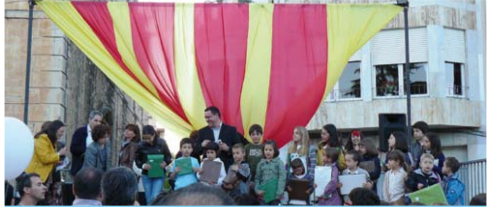
Acte de lliurament dels premis de les diferents activitats organitzades en col·laboració amb les escoles i l'institut