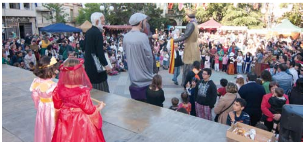
La festa va comptar amb la participació d'altres entitats locals