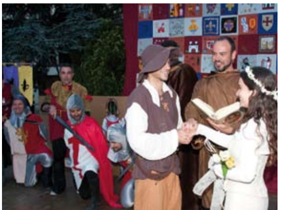
L'AMPA de l'escola Cavaller Arnau va organitzar una espectacular posada en escena a l'estil medieval amb mercat, presència de cavalls, danses, representacions teatrals, escalada i baixada amb tirolina del campanar per recordar el repoblament de Riudoms