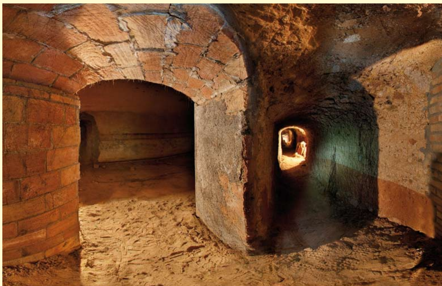
A l'antic dipòsit medieval s'hi van connectar diverses galeries de terra reforçades amb maons