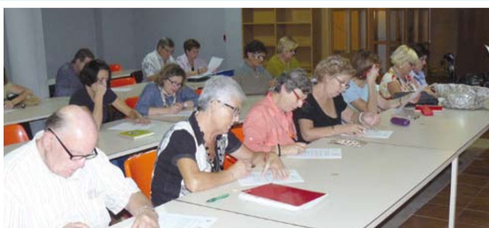
Cursos de català per a diferents nivells d'aprenentatge

Des de l'adequació i posada en servei d'una aula a la Casa de Cultura s'han realitzat un gran nombre d'activitats formatives. L'oferta és molt variada i busca tant l'objectiu de facilitar formació útil pel dia a dia dels veïns, com facilitar un espai distès on poder compartir les mateixes aficions.