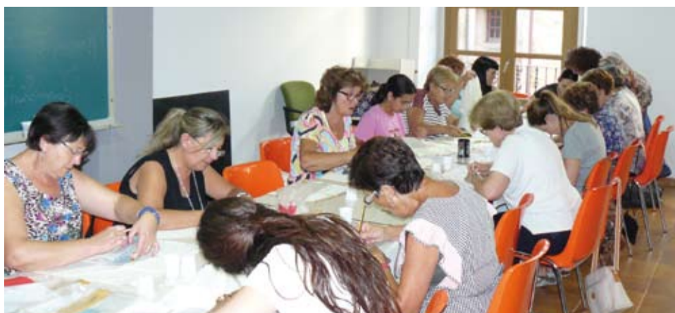
Taller de pintar roba