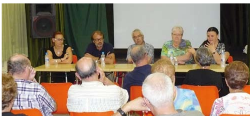
3r Cicle de "Xerrades per a la Gent Gran"