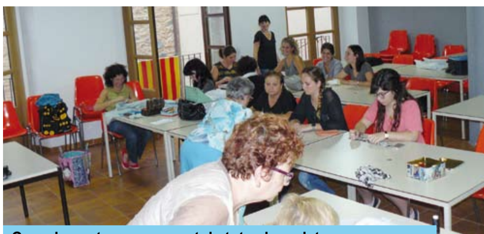
Curs de costura per a gent de totes les edats

Us podeu inscriure gratuïtament a les Oficines de l'Ajuntament, presencialment o bé al telèfon 977 85 03 50.