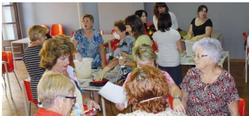
Taller d'aprendre a fer sabó per a reaprofitar l'oli domèstic