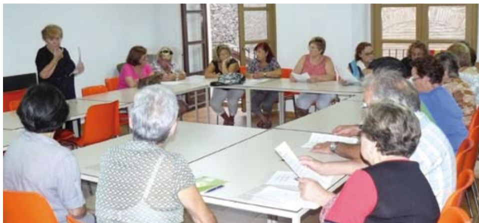
Als diferents espais de la Casa de Cultura s'hi fan les classes teòriques i pràctiques del curs de sardanes