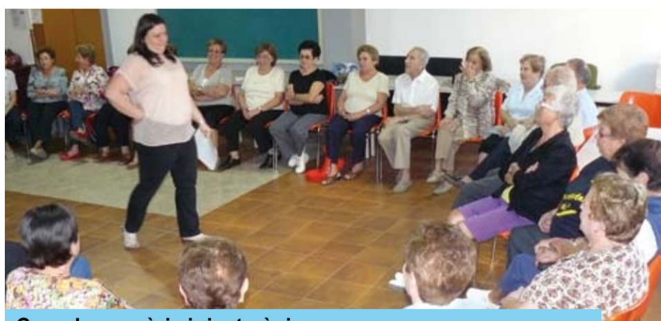
Curs de memòria i risoteràpia