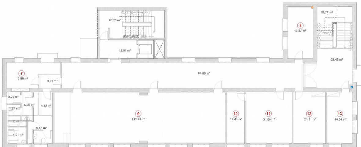
PLANTA PRIMERA E: 1/150