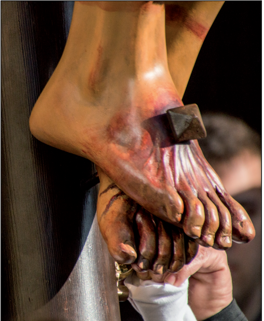
Detall de la fotografia guanyadora del Concurs "La Setmana Santa de Riudoms 2015"